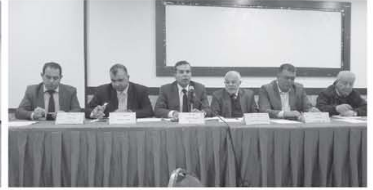
عمان - الأنباط

نظم المجلس الصحي العالي أمس الاثنين ورشة عمل متناظرة لتقرير الحسابات الصحية الإفاقية للأعوام ٢٠١٤ - ٢٠١٥ ومؤشرات الإفاق الصحية.