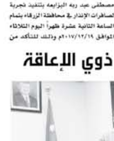
عمان - الأنباط

أوضح مدير عام الدفاع المدني اللواء مصطفى عبيد ربه الزبايعه بتنفيذ تجربة لصفارات الإنذار في محافظة الزرقاء بنام الساعة الثانية عشرة ظهراً اليوم الثلاثاء، لإسبائها وطقر انتشارها.