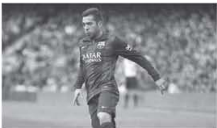
برشلونة - وكالات

ومشقة" - ومن إمكانية عمل ممر شرية لريال مدريد بعد فوزه بموندوال الأندية، قال "ستري ما يحدث يوم السبت، ولكن فريقه، برباعية لطيفة على ديوريتو لاكرونيلا، عن الهمر الشرية لم تمت كأمن العالم للأندية"، وأكد على أهمية التناكح الثلاث في البرتاو، مضيفا: "هون البراسيا في الكلاسيكو ان يخرج ريال مدريد بعد فوزه بموندوال اللقب، ولكنه سيكون شرية قوية لهم"، وكان جويرمو أمور، مدير العلاقات الخسية في برشلونة، قد حسم الجدول حول عمل ممر شرية لريال مدريد في الكلاسيكو، بالإشارة إلى أنه يتم تشييده عندما يكون الملعب فائز باليغا أو دوري أبطال أوروبا فقط.