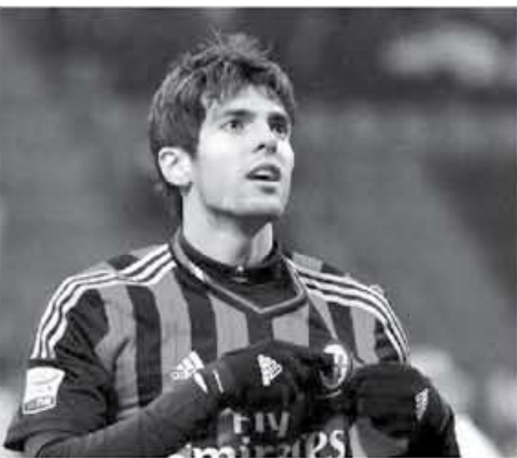
برازيليا - وكالات