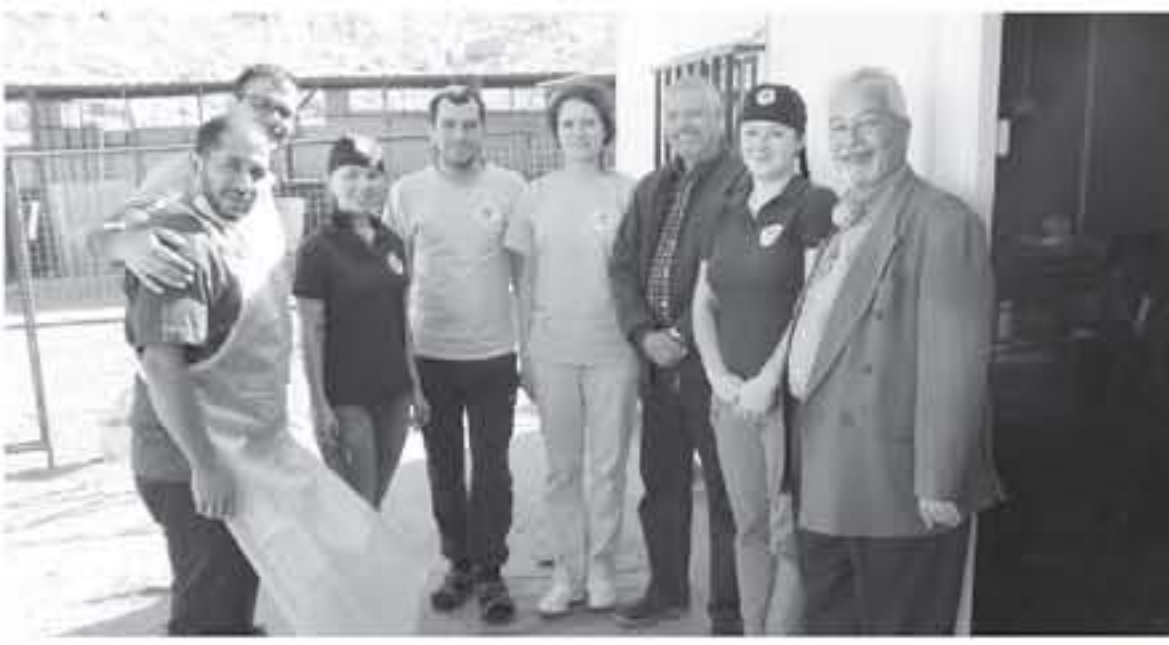
العقبة - ظلال الكباريتي

المتمثلة بالإفاق الصحي على مستوى الاقتصاد الكلي ما يساعد واضعي السياسات الصحية ومتخذي القرار والمخططين في الحصول على المعلومات المستندة على الدلائل والبراهين لوضع السياسات الصحية الكفيلة بتسحين وتزوير أمان النظام الصحي في العقبة.