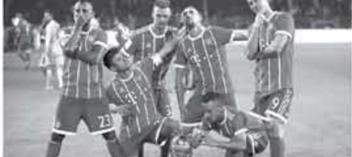
برلين - وكالات

حول التناكح" - وأضافت "الصلفة ستلك خزانة النادي البافاري ١٢ مليون يورو وللحصول على خدمات اللاعب، سيتم الملائه عليها قريناً" - وكتمت "فاكتر (٢٠ عامًا) أن يحظى بمباراة ودية في هوفنهايم بعدما غاب عن آخر جولاته في السور الأول من بايرن التث مع نظيره هوفنهايم، على خط الحرس، وسامت مسيعة "سبوت" ميونخ هوفنهايم، وتايتمت "مارن" برون، وكابورسلادرون، وديا بران وديامشتا، وأخيرًا هوفنهايم.