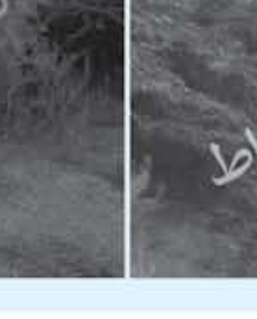
عمان - الأنباط

مجلس محافظة البلقاء كمال التعمير بين للأنباط خلال جولة بمواقع انبعاث الدخان " منذ فترة طويلة وبشكل مستمر وبشكل متزايد انبعاث الدخان من جارات الأراضي الفلسطينية، وقد تم التواصل مع الجهات المعنية بمعالجة المشكلة وتأمين الان ما زلت تنتظر على اية جهة صناعية علاقة بالعمل على إطفاء انبعاث الدخان من حيث الرصد والتي منها لخرح هذه الانبعاثات الخاطرة بالناس //