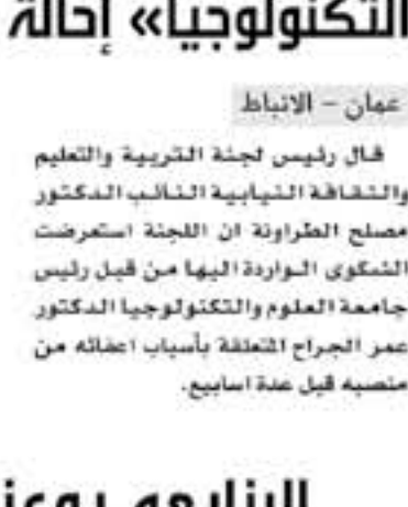
عمان - الأنباط

ناقشت لجنة الصحة والبيئة النيابة برئاسة النائب الدكتور ابراهيم الجبور مشروع قانون المسؤولية الطبية والصحية لسنة ٢٠١٧.