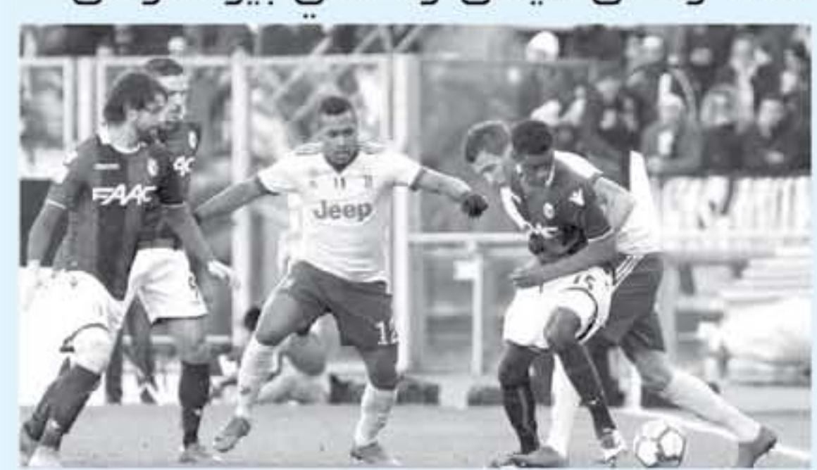
ميلان - وكالات

بعد الحسارة الكبيرة أمام ميلان هيرونا، كتبت ميلان، بلا أي كرامة، هيرونا فالتن والتصميم لا يتغير لملان" كما أذرت إلى فيز بوفنتوس، يبرض خراجه، ويستمر على بونونا