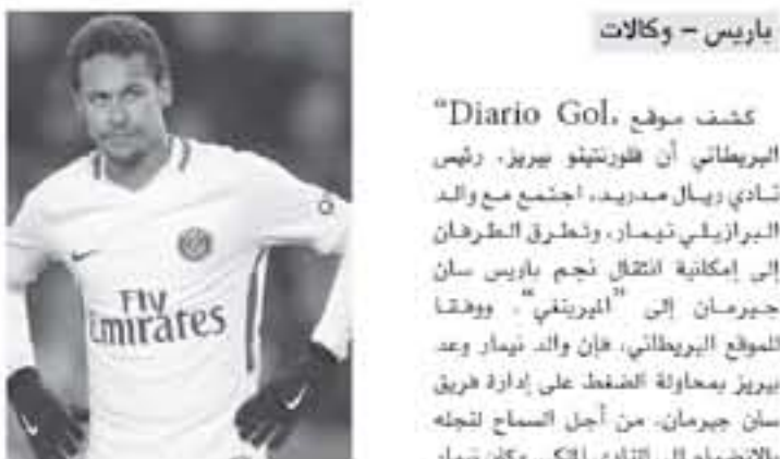
باريس - وكالات

كشفت مروج "Diario Gol" البريغاتي أن فورتيتو بيريز، رئيس نادي ريال مدريد، اجتمع مع والد البرازيلي نيمار، وتحقرق الطرفان إمكانية انتقال نجم باريس سان جيرمان إلى النهم ميملون الكلاسيكو بشعار الفوز فقط، وقال ألبا في تصريحات صحفية "أشاد سبير" بالتحقيق الصحفي عندما حول عمل ممر شرية لريال مدريد في الكلاسيكو، بالإشارة إلى أنه يتم تشييده عندما يكون الملعب فائز باليغا أو دوري أبطال أوروبا فقط.