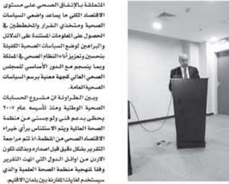
عمان - الأنباط

وأوضح العضو في أن هذه المبادرة استنفذت كماتية تجريبية للهيئة، يوم من كل شهر لتثبيتها في مختلف المحافظات بدعم من تحقيق أهدافها بعد انطلاقها.