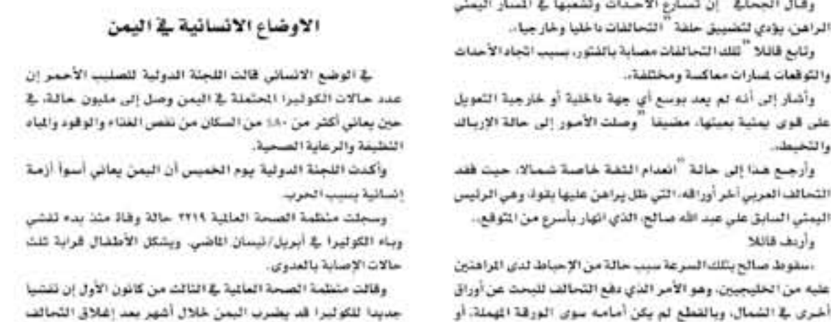
في الوضع الاسلاني قالت اللجنة الدولية لتسليح الأحمر إن عدد حالات الكوليرا المحتملة في اليمن وصل إلى مليون حالة، في حين يتوقع أكثر من ١٠٠ من السكان من نفس الغداء والوقود والمياه النظيفة والرعاية الصحية.

ويعتقد أن هدف الحوثيين من الاستمرار في إطلاق الصواريخ على السعودية هو دفعها للتوسط بينهم، خصوصا بعد فشل هذه التبعات عليها السابق الرئيس اليمني على عبد صالح لكن السعودية بدلا من ذلك كلفت نفسها ليعمل الحوثيين في شمال اليمن موقفا ١٦ فبراير ما بين ١٦ كانون الأول الهجري. وكشفت القيادي في الحزب الجنوبي اليمني، والد الجساع الأسباني، التي تدعى "السياتيو الأسوأ" تفكيك الحرب اليمنية، هو القادح، وقال الجساع "إن لتسارع الأحداث وتدهورها في مسار اليمني الراهن يؤدي لتضييق حلقه" التناقضات داخلها وإخراجها. ورابع هذا إلى حالة "انعدام الثقة خاصة شمالا، حيث فقد التحالف العربي أحرارها، التي تظل يراهن عليها بقوه وهي الرئيس اليمني السابق على عبد صالح الذي انهار بأسرع من المتوقع. مطوق صالح بتلك السرعة سبب حالة من الإحباط لدى المراهقين عليه من الحليبيين، وهو الأمر الذي دفع التحالف للبحث عن أوراق أخرى في الشمال، وبالقطع لم يكن أمام سوى الورقة الهائلة، أو