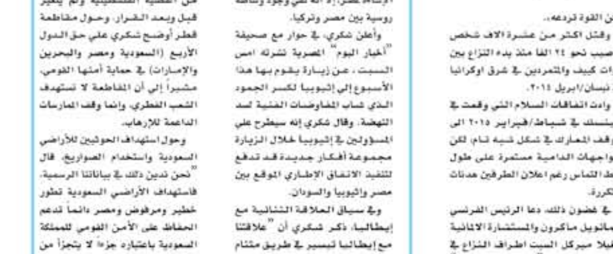
الوزير سامح شكري

موسكو - أ ف ب قالت روسيا وتركيا وإيران يوم الجمعة في مؤتمر الحوار الوطني السوري في سوتشي تشكيل "مجموعة عمل" لإطلاق سراح ٢٠٠ سجين في سوريا. وقال وزير الخارجية الروسي سيرغي لافروف في مؤتمر صحفي في موسكو، إن "مجموعة عمل" ستعمل على إطلاق سراح ٢٠٠ سجين في سوريا. وقال وزير الخارجية الروسي سيرغي لافروف في مؤتمر صحفي في موسكو، إن "مجموعة عمل" ستعمل على إطلاق سراح ٢٠٠ سجين في سوريا.