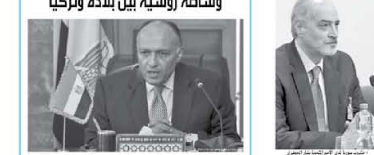
الوزير سامح شكري

القاهرة - أ ف ب حالياً تحديد موعد لزيارة الرئيس عبد الفتاح السيسي إلى منطقة عمارة بعد أسابيعها بسبب الأحداث الارهابية بمسجد الروضة بالعريش، وأكد شكري على عدم وجود دور في العلاقات مع أمريكا بسبب القدس مشيراً إلى أن ذلك مشروط بعدم التشكل في الشؤون الداخلية وعدم الإضرار بصير إلا أنه لم يحدد موعداً.