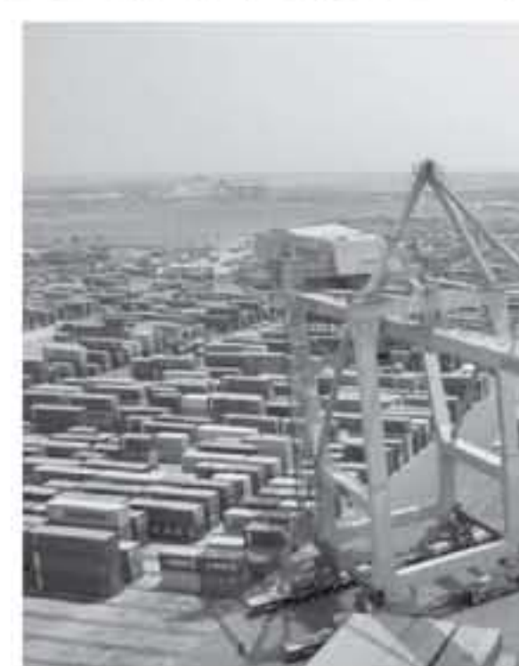
الأوضاع الوردية التي كان قد قرر إنائها في حربي الإصلاح اليمني.

سليمان ملك اليوم في مسرح الصراع المشتعل في اليمن، وما هي التبعات الإنسانية المدمرة من طهران لتقلص صلاحياتها على العاصمة السعودية الرياض، فهل ذلك تحذير إيراني لأمر كالأمر مجردة خلفه جديدة مع الحوثيين مع السعودية جارة اليمن؟ سؤال طرحة مراسم الصحبة لوفد القارة الخضراء جورج ماثيرون قائلا في البداية إن السعودية سرعان ما وضعت الصواريخ بالهاتف الإيراني. غير أن ماثيرون لفت إلى أن وزارة الدفاع الأمريكية لم توجه أصابع الاتهام هذه المرة إلى إيران على عكس الصاروخ الأول، إنما اكتفت بالإعلان عن التوصل لعمليات "تفكيك بالاطلاق الحوثيين صاروخا بالستيا على السعودية"، على تعبير أحد المتحدثين باسمها. وبما أن الإطراء، يترك الكاتب إلى أن ما حاولت السفارة الأمريكية في مجلس الأمن تكن حثي الترويج له عبر عرض مفاجئ ما قالت إنه صاروخ "هامة" الإيرانية الذي أطلقه الحوثيون على الرياض "لم يكن متفجرا"، مضيفا أن إيران تفت لتسليمه صواريخ بالستيا للحوثيين. لكن ماثيرون نقل هذا تأكيد الرئيس الفرنسي إيمانويل ماكرون على أن الصاروخ الأول الذي أطلقه الحوثيون على الرياض كان "مدمر" خلف من صنع إيراني". غير أنه لزم القوضي على ما زال يفت مسألة الترويج الذي تسلم فيه الحوثيون هذا السلاح في "حل كل قبل أو بعد الحظر الذي فرضته الأمم المتحدة على نقل الأسلحة للحوثيين".