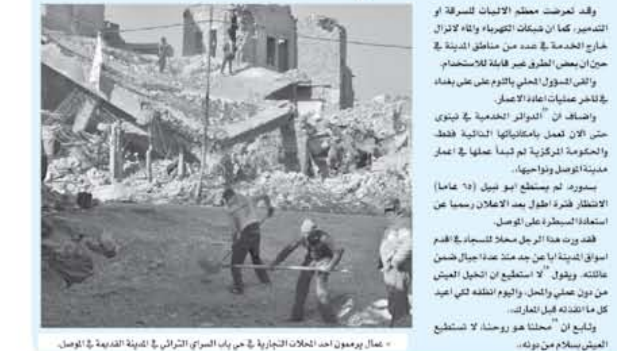
عمال يرمون الحلات التجارية في باب المصراي التركي في المدينة القديمة في الموصل.