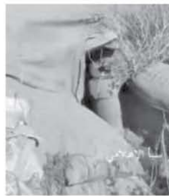
وكانت وزارة الصحة اليمنية أعلنت في ١٤ كانون الأول الهجري، عن تسجيل ٢١٨ حالة وفاة نتيجة هذا المرض هناك.

وكانت وزارة الصحة اليمنية أعلنت في ١٤ كانون الأول الهجري، عن تسجيل ٢١٨ حالة وفاة نتيجة هذا المرض هناك. وأشارت المنظمة الرقابية المذكورة إلى أن ١٥ من حالات الوفاة بهذا المرض في اليمن كانت بين الأطفال دون سن ١٥ عاما. وقال الرئيس، تقدم منظمة الصحة العالمية بالتعاون مع المنظمة غير الحكومية "أطباء بلا حدود" بتقديم الدعم الطبي والإعلامي والرعايا التخصصي لوزارة الصحة اليمنية في مجال مكافحة تفشي هذا المرض وبعض الأمراض الخطيرة الأخرى.