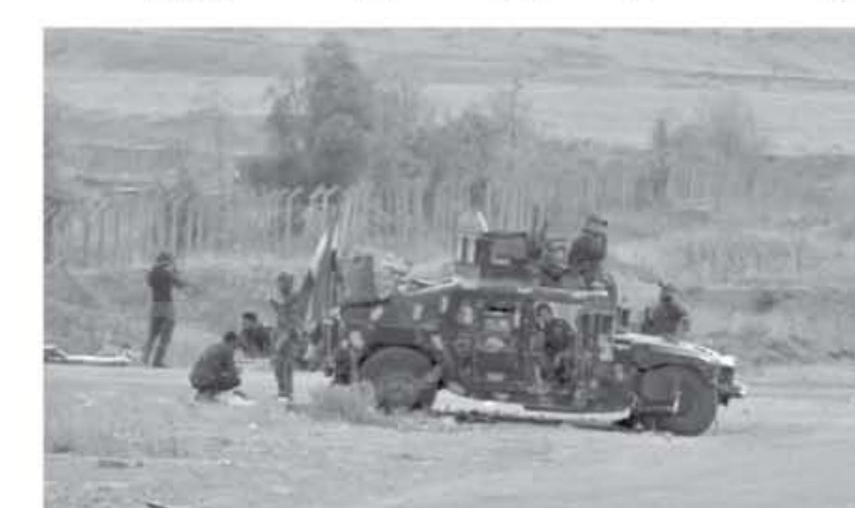
مقاتلون من قوات الحشد الشعبي الشيعية.

بغداد - رويترز قال قائد عسكري بمصالحات الحشد الشعبي الشيعية العراقية يوم الجمعة إنها انتشرت على الحدود السورية لدعم قوات حرس الحدود العراقية بعدما تعرضت لضغوط دولية من داخل سوريا خلال الأيام الثلاثة الماضية. ولم ترد أياً بعد بشأن من فتح النار من الأراضي السورية لكن القوات المنتشرة ضد تنظيم الدولة الإسلامية في العراق وسوريا تتوقع أن يلمس انتشيم إلى حرب العصابات بعد خسارته معارضة الحشوية في وقت سابق هذا العام.