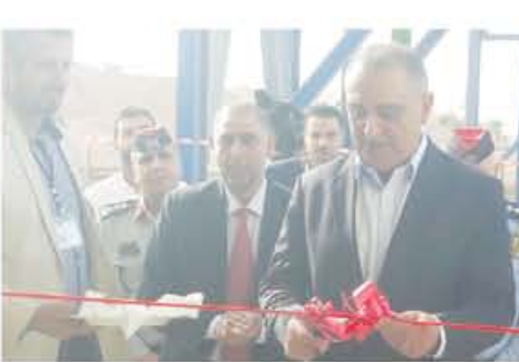
التفاصيل ص ٤٧