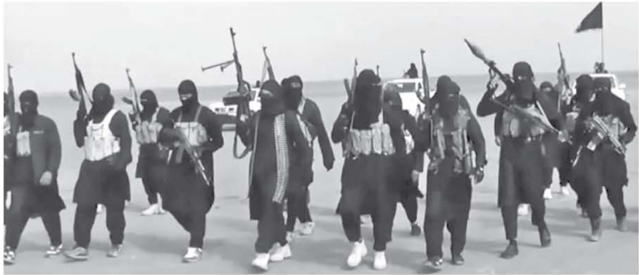
عواصم وكالات- الأنباط - ماون العربي