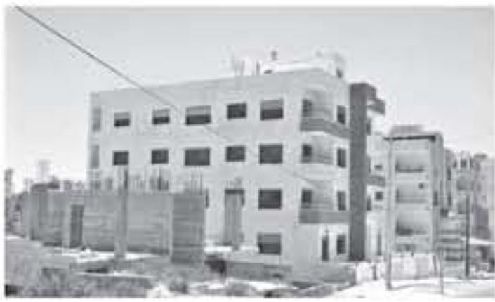
عمان - بتر

الاسكان بالمشقة كونه من القطاعات الاقتصادية المحفزة للنمو والمحفل الرئيس لعجلة الاقتصاد. وقال إن تهديد القرار سيسهم في تحفيز النشاط العقاري والإسكاني في المملكة ومعالجة التراجع الواضح في نشاط القطاع منذ بداية العام الحالي وحل الصعوبات والتحديات التي تواجه المستثمرين والمستقطب وتشجيع الاستثمارات وتشجيع المواطنين على شراء مساكن. وأضاف المحين سراد ان القرار جاء بوقت مناسب ويؤكد حرص الحكومة ولقها واستجابتها لمطالب القطاع التجاري بضرورة الاستمرار بالاجراءات التحفيزية لتحفلة القطاعات انطلاقاً من المشاركة الحقيقية بين القطاعين، لما فيه مصلحة الاقتصاد الوطني وفتح محلة التنمية وتحقيق النمو. وأوضح رئيس الغرفة ان القرار له أهمية كبيرة في تنشيط الحركة الاقتصادية محلياً في ظل الظروف الاقتصادية الصعبة التي تمر بها حاليا وحالة الركود النسبي الذي تشهده بعض القطاعات التجارية.