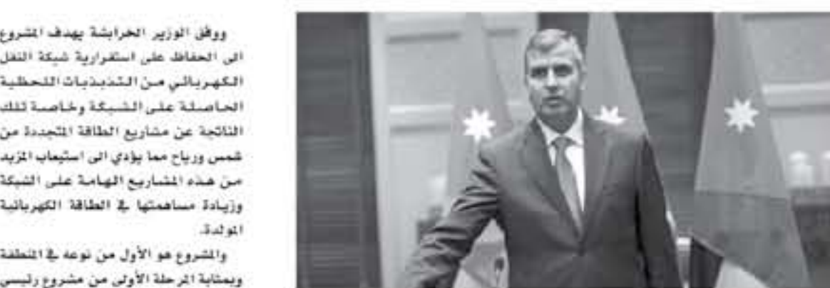
عمان - بتر

أعلنت وزارة الطاقة والثروة المعدنية ٢٣ شركة من أصل ٤١ شركة تمت اختيارها بالاستثمار في مشروع تخزين الطاقة الكهربائية على شبكة النقل الكهربائي لشركة الكهرباء الوطنية. وقال وزير الطاقة والثروة المعدنية الدكتور صالح الخرابشة في تصريح صحفي أمس الاثنين، إن عملية تأهيل طاقمات الاستثمار من الشركات الراغبة في المشاركة في مشروع تخزين الطاقة الكهربائية الوطنية، وبمشاركة ١٩ شركة من نوعه في المنطقة وبمعالجة المرحلة الأولى من مشروع رئيسي لتشغيل الطاقة الكهربائية ستقوم بتنفيذه شركة الكهرباء الوطنية لاحقاً لتتبعها على استثمارية الشبكة لعامة العام ٢٠٢٠.