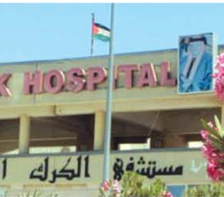
مستشفى الكرك الحكومي