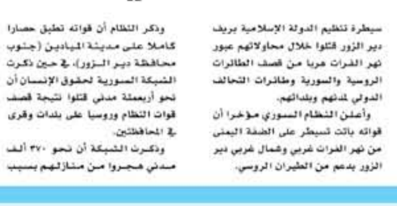
دمشق - وكالات

قالت مصادر سورية محلية إن 24 قتيلا سقطوا، في قصف بمقاتلات تم تعرف هويتها كقصف منية الخويلد، وأحد الغارات التي نفذتها القوات السورية في محيط مدينة البوكمال السورية دير الزور الشرقي عند الحدود السورية العراقية.