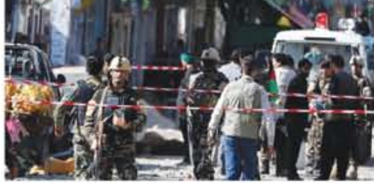
كابل - وكالات

قتل مراسل الجزيرة في أفغانستان عن شخص واحد أثناء صلاة المغرب امس الجمعة وأصيب آخرون في هجوم وقع داخل مسجد للشيعة عربي العاصمة كابل وقد قامت الشرطة الأفغانية بتطويق منطقة الهجوم.