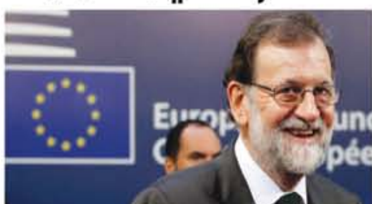
مادريد - وكالات

أعلن رئيس الوزراء الإسباني ماريانو راخوي أن حكومته ستعلن تعليق الحكم الذاتي في إقليم كتالونيا، بعد اتفاق مع المعارضة على اتخاذ إجراء ضد الإقليم الذي يسعى إلى الانفصال.