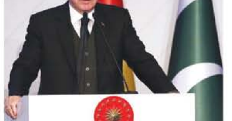
إسطنبول - وكالات

قال الرئيس التركي رجب طيب أردوغان، إن الاكتفاء بمتابعة أسامة مسلمي أركان لا يليق ببلدنا، كما لا يليق إلقاء عبء اللاجئين على بلدنا.