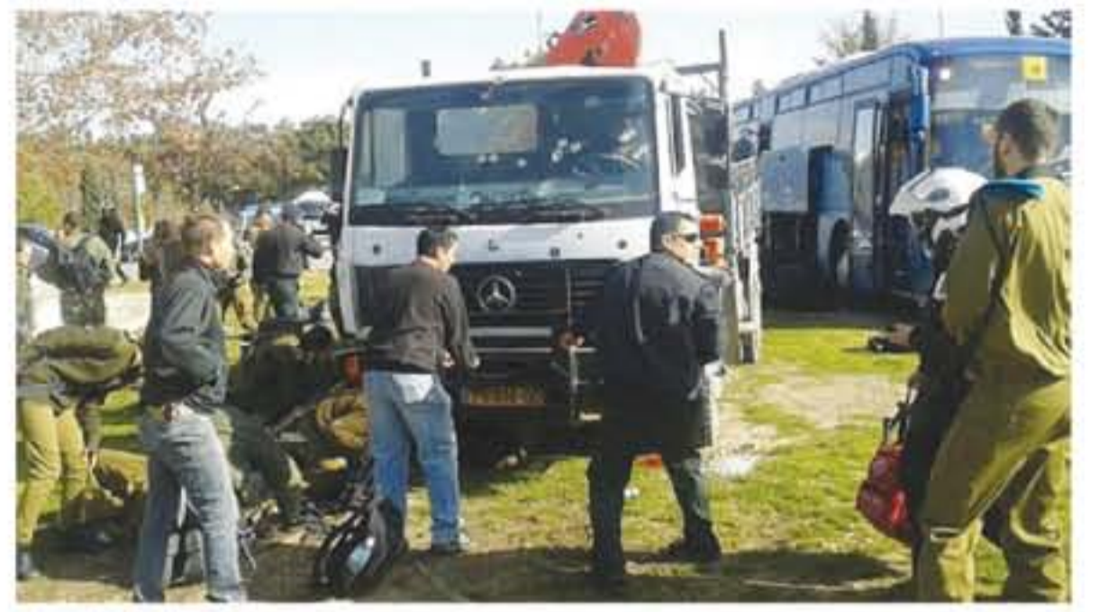
القدس المحتلة - وكالات

اتجمعت مئات المستوطنين بحراسة من جيش الاحتلال فجر امس الجمعة بلدة كفل حارس شمال سفيت، والهاوا طقوساً دينية واحتفالات صباحية في معابنها التاريخية.