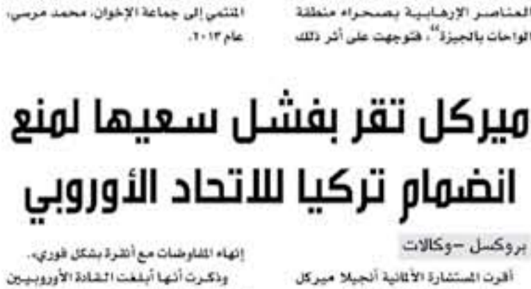
القاهرة - وكالات

قتل ضابط شرطة وأصيب آخرون من قوات الأمن في مواجهات اندلعت خلال مظاهرات إرهابية بمنطقة الأحياء الفقيرة غرب القاهرة، حسب ما ذكرت مصادر أمنية مصرية، امس الجمعة.