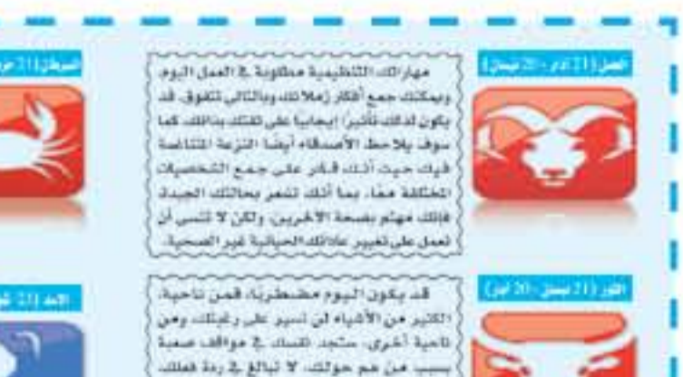
القاهرة - وكالات

قتل ضابط شرطة وأصيب آخرون من قوات الأمن في مواجهات اندلعت خلال مظاهرات إرهابية بمنطقة الأحياء الفقيرة غرب القاهرة، حسب ما ذكرت مصادر أمنية مصرية، امس الجمعة.