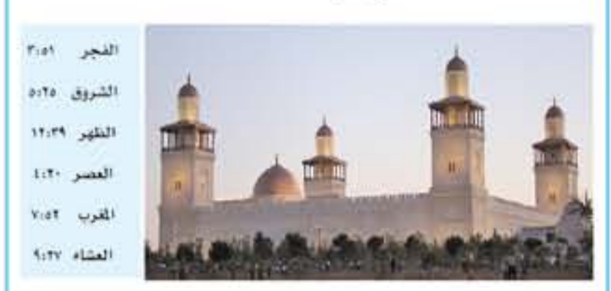
مكة المكرمة - وكالات