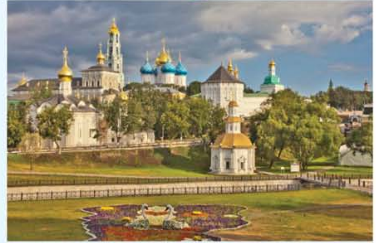
رصد مائة خنزير

السياحة في موسكو موسكو تحلصن "المدن الأحمر" الذي يعتبر قلب المدينة التاريخي والذي يربطه معظم التوارخ الروسية والطرق السريعة