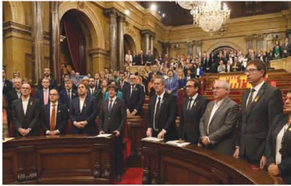
بالاتصال تم غزو تشيد الإقليم، وقال مراسل الجزيرة بيرشونة أيمع الزبير إن التصويت السري على انفصال إقليم كتالونيا جاء لتفادي المتابعة القانونية من لدن سلطات مدريد.

نيويورك - وكالات شهد مفوض الأمم المتحدة السامي لحقوق الإنسان الأمير زيد بن رعد على أهمية دور المدافعين عن حقوق الإنسان من أجل سلامة عمل المجتمعات، مشيراً إلى استهدافهم في الأمريكيتين على مدى السنوات الأخيرة. وأضاف سموه في بيان صحفي أمس، حيث يقوم حالياً بجولة في أميركا اللاتينية استهله بزيارة بيرو، أنهم يتعرضون للتهديدات وحملات التشويه والاعتقال العسفي وسوء المعاملة وحتى التعذيب