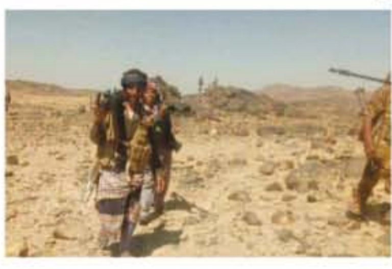
بغداد - وكالات

تواجه عدد من مقاتلي القبائل شاذة إلى عواصم بحسب مصادر محلية. ويحسب وأخبار محافظة إب أن القوات العراقية من سيطرة القبائل الحوثية، فإنها تقع على إيمان الوحيد لها الرابطة بين جبهتي البيضاء والبيضاء. وموقف مصادر قبلية، فإن الداعج يذكر أن قبائل آل عواصم تعتبر ضمن القبائل التي خضعت للحوثيين، ولن تقبل الانضمام إلى جبهتي البيضاء والبيضاء. ولم تحسب معهم أي مواجهات مسلحة منذ أن وصلوا إلى المنطقة قبل حوالي ثلاث سنوات.