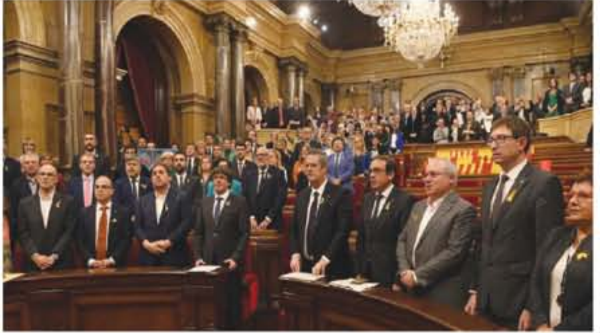
إسبانيا - وكالات

أعلن برلمان كتالونيا الانفصال عن إسبانيا إثر تصويت سري أمس من المرجح أن تلغي المحكمة الدستورية الإسبانية محافظة كتالونيا لتداول، بأغلبية 90 من أعضاء البرلمان من أصل 135 عضوا صوتا لصالح الانفصال مقابل اعتراض عشرة وامتناع اثنين عن التصويت. وأقام نواب المعارضة جلسة برنام كتالونيا قبل بدء التصويت على الانفصال، وذلك رفضا للتصويت لطلب الانفصال من مدريد.