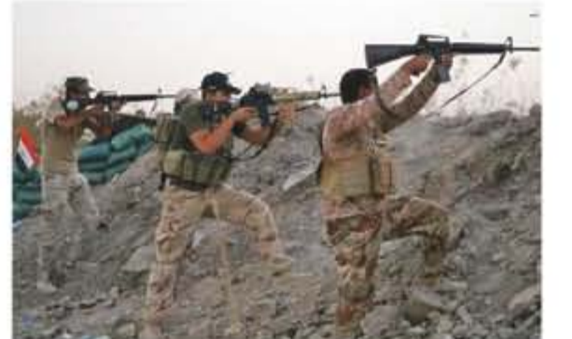
بغداد - وكالات

أعلنت مصادر أمنية عراقية عن سقوط 32 قتيلًا من مسلحي تنظيم داعش في اشتباكات بمحافظة الأنبار غرب البلاد، حيث تشن القوات العراقية حملة عسكرية لاستعادة آخر معاقل التنظيم على الحدود السورية.