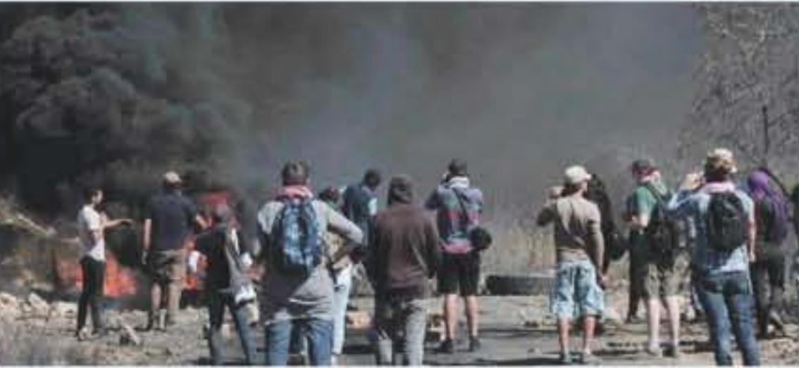
القدس المحتلة - وكالات اقتحم جنود الاحتلال عدة مناطق في الضفة الغربية واعتقلوا خمسة مواطنين بعد معارضة منازلهم ونشيتهم، فيما قام مسلحون بإطلاق النار على موقع عسكري إسرائيلي جنوب جنين شمال الضفة المحتلة.

قضى محافظة الخليل أدعى جيش الاحتلال أنه ضبط سلاحاً في أحد المنازل خلال عملية اقتحام ونشيتهم، فيما نصب الجنود الفيلة الماضية حواجز عسكرية على مداخل القرى الغربية لمدينة دورا جنوب شرقي الخليل، لعرض عليها المواطنين للتفتيش من قبل جنود الاحتلال التي أوقفتهم لساعات على الحواجز. في سياق متصل، قام جنود الاحتلال الإسرائيلي بعمليات تشييد واسعة فجر امس في بلدة بعد جنوب مدينة جنين، عقب تعرض نقطة دوتمان العسكرية لإطلاق نار من قبل مسلحين فلسطينيين لا توبالفرار. كما امتدت قوات الاحتلال على المشاركين في مسيرة كسر هدم الاسبوعية المناهضة للاستيطان والظلمة بفتح شارع القرية المغلق منذ أكثر من ١٤ عاماً بقرار من جيش الاحتلال لصالح مستوطنة مستوطنة هدم المقامة عنوة على أراضي القرية.