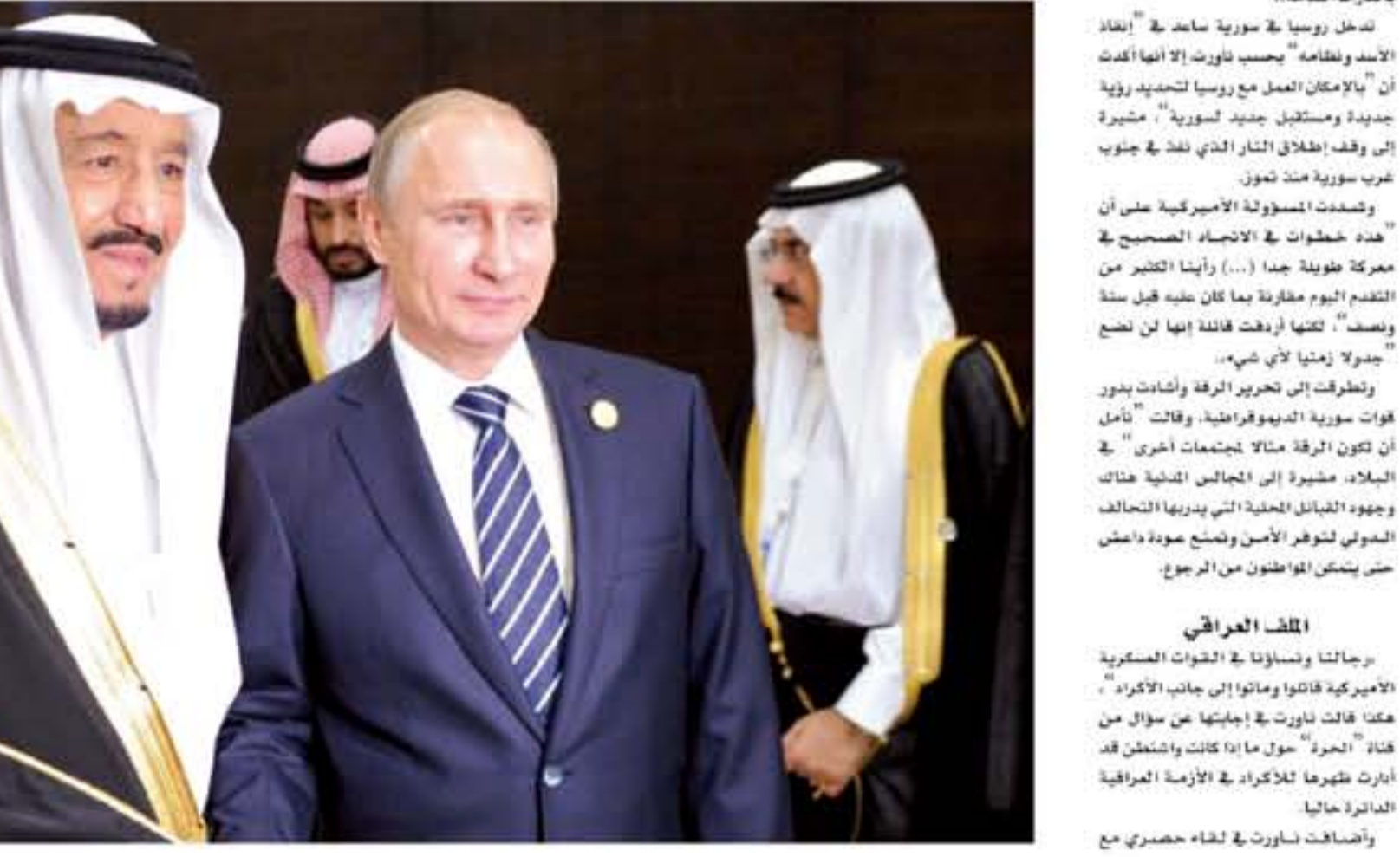
الملك العراقي... واجتازت وسانا في القوات العسكرية الأمريكية... وأضافت ساروت في لقاء حضوري مع