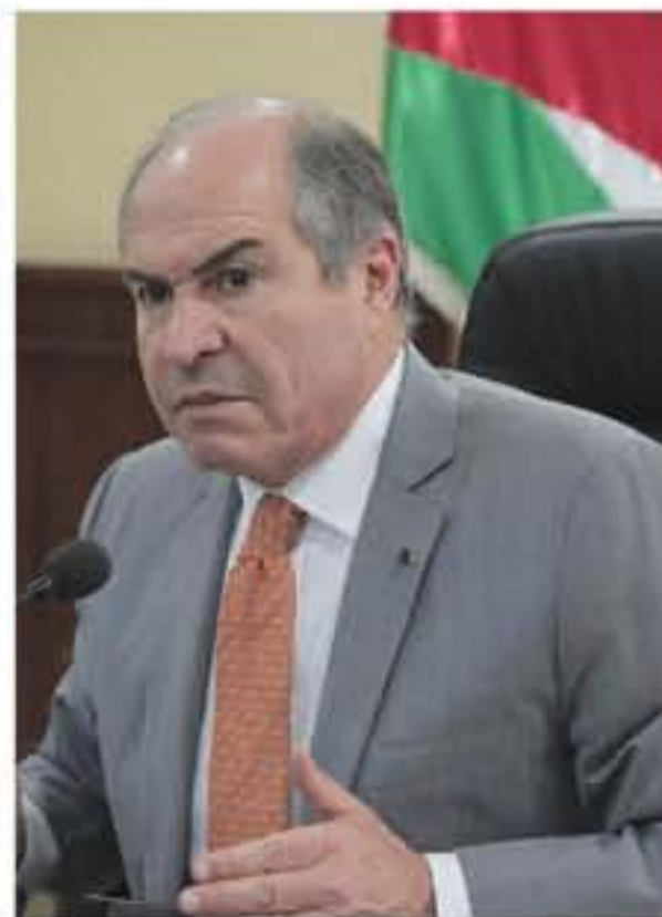
خلال جاعة نجل النائب النائب الأسبق مروان سلطان، حيث أكد الدكتور محمود العبادي أحد أبرز أعضاء عمان السابقين

حتى اللحظة لم تكشف الحكومة أسباب إطلاق معلومات العاصمة الجديدة عبر منطلي وسائل التواصل الاجتماعي في أنون السعي لاقرار تعديلات على قانون الجرائم الإلكترونية الذي يصدره التشريع أنفسهم بأنه مكمم للأهواء وضغط على الحريات، وينتس الوقت لم تكشف الحكومة عن أية اختيار التشريع واسس التعاون معهم، فهناك ٤ ملايين أردني ناشط على الفيس بوك و ١٠٠ ألف ناشط على تويتر، فكيف استطاعت الحكومة تمييز التشريع عن الكسالي، أو هي التي وضعتها شركة العلاقات العامة التي استعان بها الحكومة لتحسين صورتها على مواقع التواصل الاجتماعي أم انهم كتائب الاعلام الالكتروني الموجهة؟ بعيدا عن تصميم الفناء والاختيارات كنف المناطق الاصلاحية باسم الحكومة الدكتور محمد المومني عن العاصمة الجديدة التي ستكون على خمس مراحل وسيتم الاعلان عن تفاصيلها خلال شهرين، أي بعد اقرار الموازنة من مجلس النواب بحيث يمكن رصد هذه التصاريح بوصفها إير تخدير لعجز الموازنة، فخلال هاتف مع وزير الشؤون البلدية والتشريفية نفي وجود أي معلومات لديه عن العاصمة الجديدة لا مكانها ولا زمانه، وكذلك قال الوزير الثاني في الحكومة نخبه عمالية