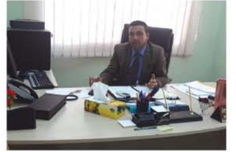
من كافة الخدمات والتشريع والمرافق... وأكد الحيسان ان النادي فور تسليمها