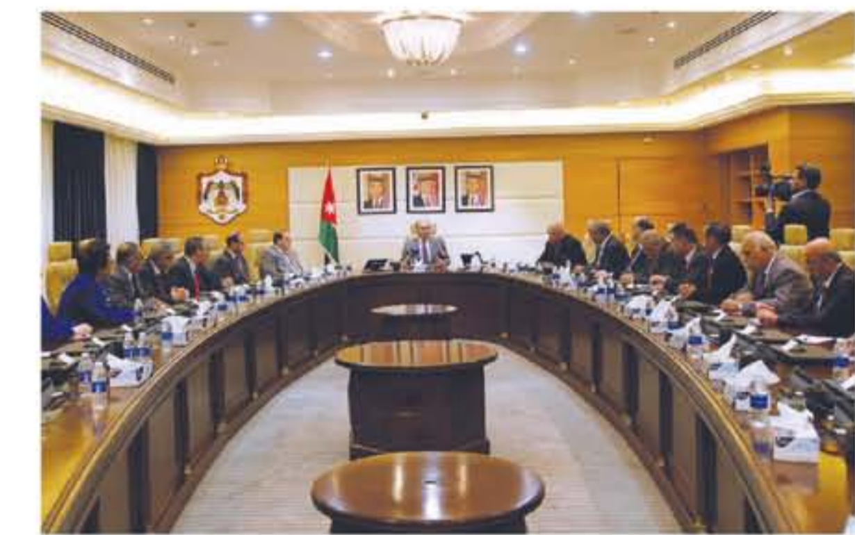
مخرجاته التي هي بالاساس مدخلات لتسويق العمل، واستعرض رئيس الوزراء التحديات الاقتصادية التي تواجه الأردن نتيجة عدة عوامل داخلية وخارجية بشكل

عمان - بتر أعلن رئيس الوزراء الدكتور هاني الملقي ان المدينة الجديدة التي يجري العمل على دراسة انشائها خارج العاصمة عمان، تأتي ضمن جهود الحكومة في التحفيز الاقتصادي واستقطاب الاستثمارات نوعية مؤكدا ان المدينة الجديدة ستقام على اراضي خزينة ومحاطة بمساحات كبيرة باراضي خزينة ايضاً. ولفت رئيس الوزراء خلال لقائه رؤساء الجامعات الأردنية الرسمية والاهلية في دار رئاسة الوزراء امس الاحد الى ان مشروع المدينة الجديدة يشكل فرصة استثمارية كبيرة للقطاع الخاص. واكد ان هذا المشروع الاستراتيجي يأتي في سياق تطبيق مفهوم المدن الحديثة التي يساهم بناؤها بانعاش الاقتصاد معرباً عن ثقته بان هذا المشروع سيسهم بشكل كبير في إيجاد حلول لتلكة النقل في العاصمة عمان والتخفيف من الازمة المرورية والكثافة السكانية العالية في العديد من المناطق. وخلال اللقاء أكد رئيس الوزراء ضرورة المحافظة على الهوية النسبية الأهم التي يمتاز بها الأردن وهي الأمان وان جميع الخطط والاستراتيجيات التي توجدها الدولة الأردنية يجب ان تستهدف ضمان مستقبل أفضل له وللجيال القادمة. وأشار الى ان تمكين الانسان الأردني يكون