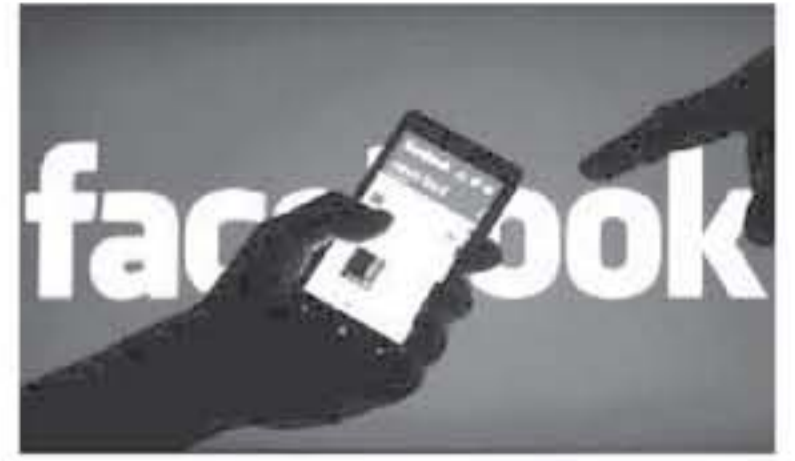
في أيلول الماضي تحفظت 4.0 ملايين و 400 ألف حساب «فيسبوك» في الأردن.

بلغ عدد الحسابات على موقع التواصل الاجتماعي الفيس بوك في الأردن حتى أيلول الماضي نحو 4 ملايين و 400 ألف حساب وذلك وفقاً لما نشرته الشركة في بيانها الصادر عن مكتبها في عمان. وأشارت الشركة إلى أن عدد الحسابات على موقع تويتر في الأردن بلغ 200 ألفاً وموقع الانستغرام 400 ألف حساب. وعن تراجع حسابات الفيس بوك في الأردن أرجع الأخصائي الفني للشركة بإيقاف الحسابات الوهمية حيث بلغت منتصف العام الحالي نحو 0 ملايين و 400 ألف حساب بينما