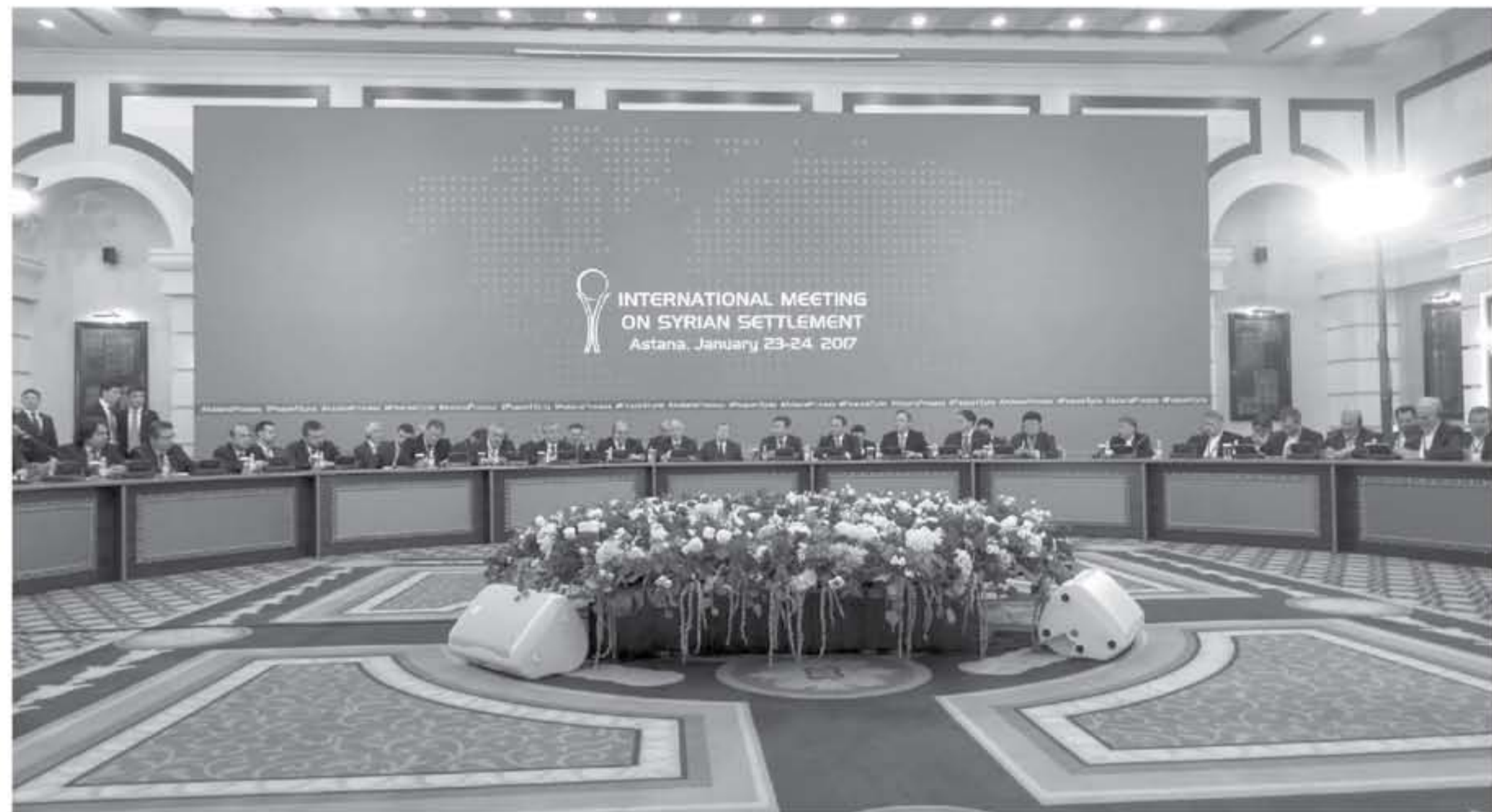
INTERNATIONAL MEETING ON SYRIAN SETTLEMENT Astana, January 23-24, 2017

عوامصم - وكالات - الانباط - مامون المعري