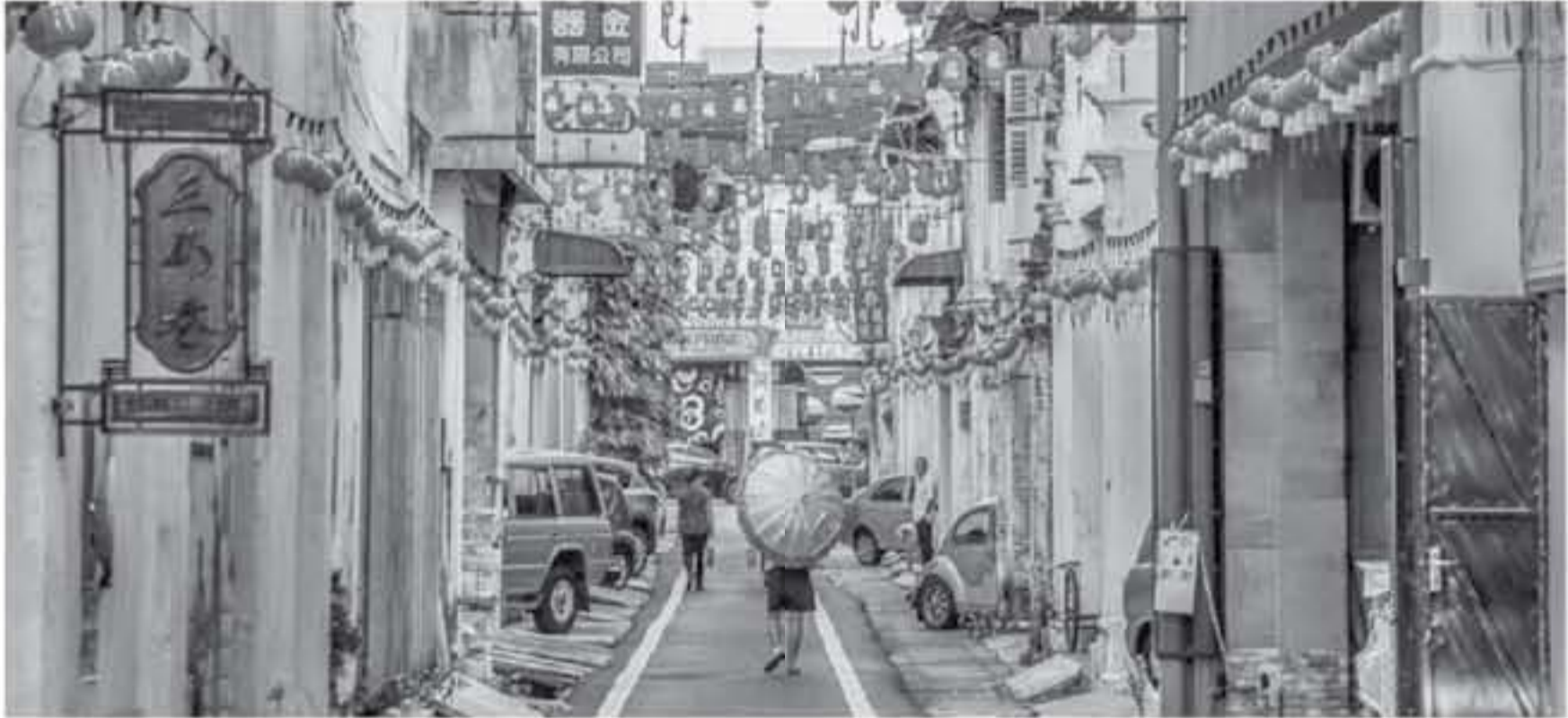
يتمتع الفرصة بتذوق بعض الشاي الشهيرة هو معهن ثيان تشون الشهير، والذي يقع في جالان بنجر ليما، حيث يحظى بشعبية كبيرة من قبل السكان والسكان المحليين على حد سواء، ويقدم مجموعة متنوعة من الأطباق المحلية الرائعة.

أماكن سياحية بالقرب من إيپوه يوجد بالقرب من إيپوه العديد من مناطق الجذب المدهشة والأكثر شعبية في ماليزيا، بما في ذلك مرملعات كامبرون،