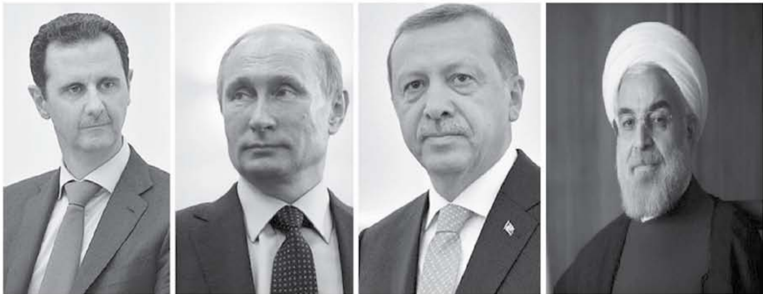
الإبط - وكالات وعاظم - مأون العري

هكذا لابد ان تشر الامور بعد اجتماعات ولقاءات سوتشي بين الاسد وبوتين ، وبين بوتين وروحاى و اردوغان ، بان الرئيس الروسى فلاديمير بوتين يدرك انه يجب بحث مستقبل سوريا حول طاولة المفاوضات لا في ساحة المعركة. وقد تبدو الامور بان الرئيس الروسى يرى في المفاوضات امتدادا للمعارك، والهدف واحد وهو الابقاء على حكم بشار الاسد. تحدثنا في الانباط عن الزخم الدبلوماسى تجاه سوريا هذه الايام في المدينتى السابقيين ، و تناولنا لقاءات بوتين مع منتج سوتشي الروسى، مع الاسد والرئيس التركى رجب طيب اردوغان والى ايراني حسن روحاني ولقاء جميع الاطراف في سوتشي على عدم السماح باى تدخل لاي قوة اجنبية في سوريا دون موافقة الاسد، وهم بذلك يضمنون الولايات المتحدة، التى هضمت قاعدة عسكرية سورية هذه السنة كره على استخدام سلاح كيميائى ضد المدنيين.