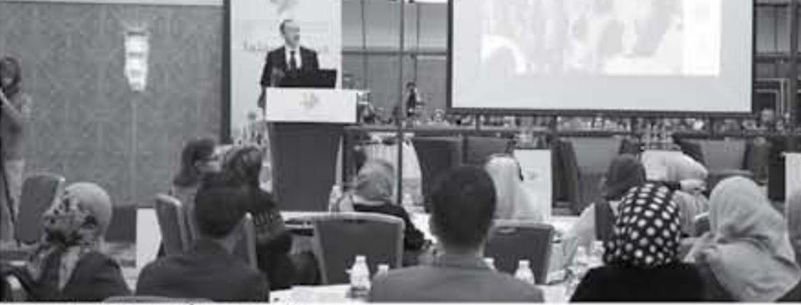
جلسة مؤتمر عقدها الكلية الملكية للتدريب المعلمين

أجمع أكاديميون على ان برامج تأهيل المعلمين الناجحة هي التي تقوم على توجيه المعلم والعمل معه في الميدان من خلال وضعه في بيئة صفية حقيقية.