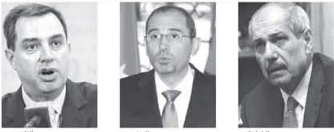
لقاءات حذرة وتوصيات مهدفة بين النخبة ورئيس الديوان

بأمر ساميون اجتماعه مؤخرا برئيس الديوان الملكي الدكتور طاهر الخزازة ووزيري التخطيط والخارجية ومندوبين عن جهاز المخابرات العامة والاسخبارات العسكرية ان تحوّل