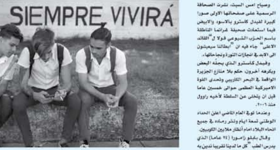
هاغانا - أ ف ب احتت كوبا أمس ذكرى مرور عام على وفاته قائد ثورتها فيدل كاسترو بينما تتخلل البلاد بانتقال تاريخي سبتي خلال أقل من مئة يوم ستة عقود من حكم الأخير كاسترو. ويتناه على رغبة "الثالث الأعلى" في رفض عبادة الشخصية وبم ما يمكن رؤية على حفلة مرحلة. لن تشهد الجزيرة أي احتفال جماهيري في ذكره وفاته هذه الشخصية التي لم يكن ممكنا تجاوزها خلال الحرب الباردة. فلي هاغانا تنظم مساء امسية أمام الجامعة بينما يمكن أن يتوجه راؤول كاسترو إلى سانتياغو دي كوبا (جنوب شرق) لزيارة القصر الذي يضم رماه في جميع أنحاء البلاد. في هذه المرحلة لم تؤكد رسمياً وفاته. وقال بيلفو زامورا (٢٤ عاماً) الذي يدرس الطب "كل من لدينا تقريباً لديهم في الالهة الجديدة".