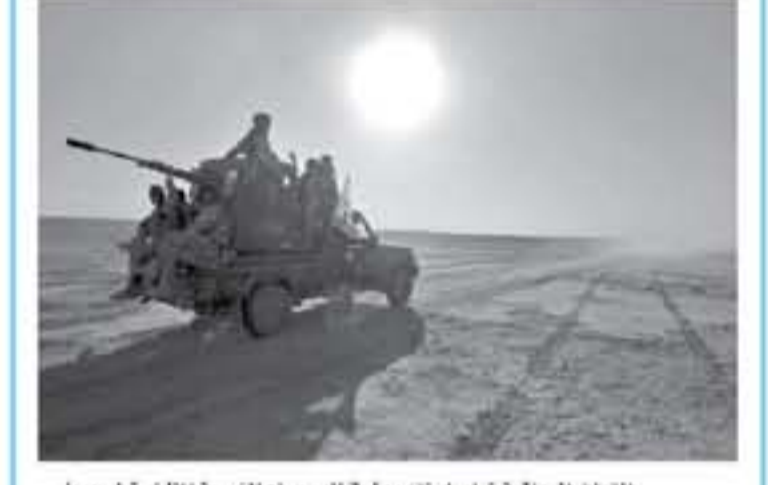
القوات العراقية تواصل تقدمها في الصحراء الغربية المتاخمة لسوريا

الهزيمة النهائية لتنظيم التطرف في العراق. وقد هذا الإطراق، أكد قائد قوات الحشد الشعبي أبو مهدي المهندس أن المنطقة المتخلفة هي آخر منطقة تواجد عسكري لتنظيم التطرف في العراق. لكن المهندس شد في تصريح متلف وزعمه مديرية إعلام الحشد الشعبي للتنظيم، وكان التنظيم يعبر إلى "أنهم متواجدين في مناطق أخرى" وخشون بين الأقاليم. ولقد المهندس إلى "منطقة الصحراء ذات أهمية لوسية وكانت خط التفتوت والإسراء والاتصالات والتنظيم، وكان التنظيم يعبر عن الخطوط الدفاعية في الموصل وكركوك وصلاح فارسا من سوريا، وأضاف "حتى اللحظة استطاعت حوالي مئة قرية. لاخطنا صفات ومخازن مئة وأشدسة ومسيرات مسلحة، لا زالت موجودة. وأكد المهندس أن "الأمن الذي نتم به الحق للحركة في العراق هو بفضل العمل العسكري والحفاظ عليه حتى يمكن لإيصال الحدود مع سوريا بشكل كامل". ويؤكد المهندس "بتوجه العراق أكتوبر ٢٠١٦ ضد محافل الجهاديين بدءاً من الموصل التي استقرت لمدة أشهر من أعزاز النابية، مروراً بمتنصر والوجهة شمالاً، وصولاً إلى الأنبار في غرب البلاد.