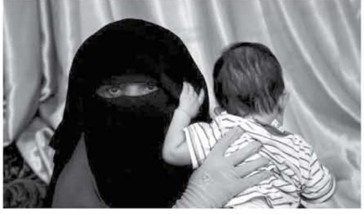
إن نهاية تنظيم داعش لا يعني نهاية لتفنين التطرف للأطفال أو الرافضين ولا نهاية ذلك النوع من التشنج على الجواه المزموه. ففهم الصفي سيطرت في تحرير الشام "مع محافظة الرابح في الشمال الغربي من سوريا بشكل كامل. ولا يختلف النهج التعليمي الهجينة فهياً عن ذلك التشنج من قبل داعش، كما أكدت الوسيلة الإعلامية Vice في عام ٢٠١٥.