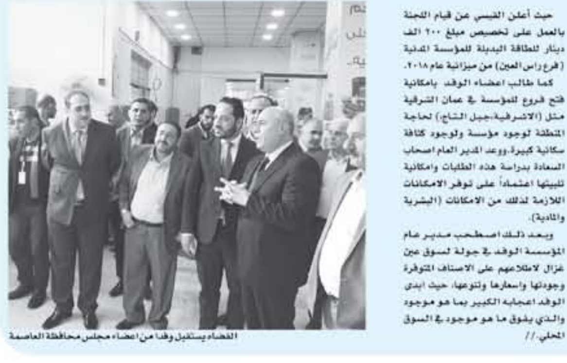
الضياء يستقبل ولدا من أعضاء مجلس محافظة العاصمة

الأنباط - عمان - راشد حسن... والى ان الرئيس الصري يستنصرها شعرا شعرا في مقابلة مع راسية الشرطة الى حالة الإحتلال السياسي في العراق... ويرى ان هذا الإحتلال يصير لاحقا لدم الدولة... وسيفعل العار من هذا الإحتلال كما ستفعله الدولة السلطة... الرئيس الصري في مقابلة التحذيرية حذر هذه الصيغة من الحكم بؤشر الى ان الدولة التي تمثّل الأربن والشعب والسياسة هي التي يجب ان تكون هي الغاية به واحترامه وصونه وبما وكل لتتبعه هذا الأسلوب الثلاثة الرئيسية للدولة مقابل قوة السلطة التحركه وليس التنازل والتي تمثل الحكومات رجموهم القانون بعملي اذرة شؤون الدولة من خلال السلطة التنفيذية.