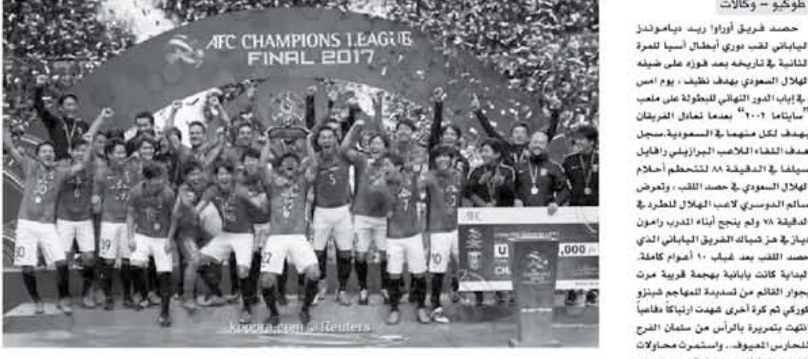
طوكيو - وكالات

الفرقية ووجه تصويبه مرت بجوار القاتل دفاع أوروا ولكن قلب التركز أمام الرمي بشكل واضح بدون فاعلية متوهمة. وأحرز الفوز دفاع الهلال وخطف اللقب بعد غياب ١٠ أعوام كأعلة الياية كانت يابانية بهجمة قوية مرت بجوار القاتل من تصديده للمهاجم فينتو كوكري من كرة أخرى شهدت ارتباكاً فظافاً انتهت بتسديدة بالرأس من سفان الصرح للحراس الميروف... واستمرت محاولات الفريق الياباني بدون توقف مع فوات فاعية كغالية وأبعد الشهراني ضربة رأس خطيرة لأوروا وتعرض عمر خربين لإصابة ولكنه استكمل اللقاء بشكل طبيعي وإرتسك دفاع الهلال بشكل واضح في الربع ساعة الأولى ولكن بدأت التحركات الهجومية من جانب دفاع الهلب وسام المودسري... ونال عبد الله عجيلد لاعب الهلال البطاقة الصفراء للخطوة، وثائق محمد جحتلي وأندف الخطاطفة خطيرة من الفريق الياباني ونظم الهلال كرة مرعدة سريعة بتسديدة الشهراني ولكن التمثل أوقف الفدية... وسخت محاولة أخرى يابانية لشغلة الحقائق وواصل المودسري مسلسل لتسديداته