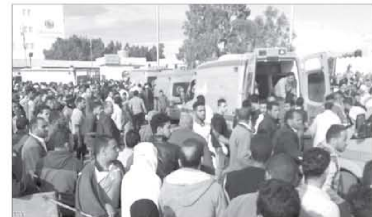
قواسم - وكالات - الأناضول - ماون العربي