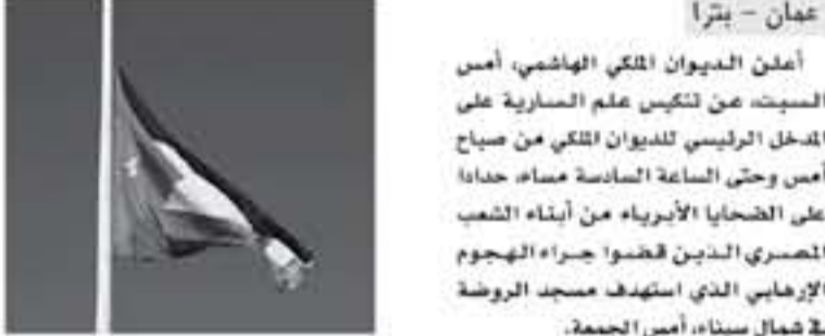
علم سينا، أمن الجمعة.