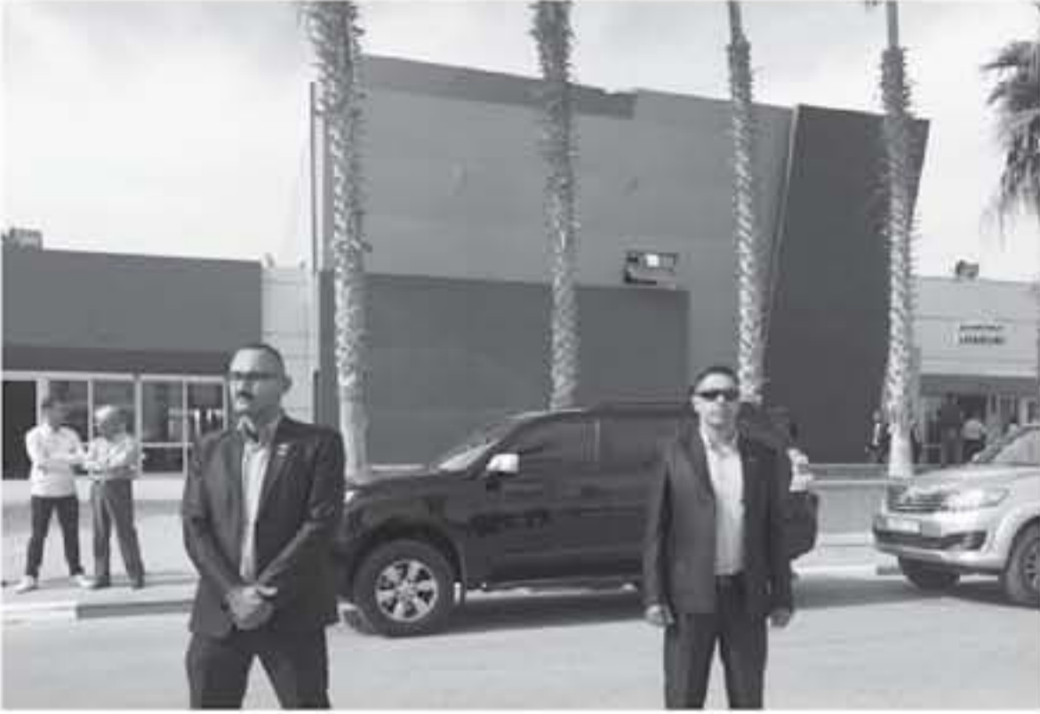
غزة - معا قال الخصري تراسة "معا" معبر رفح هو معبر فلسطيني مصري جديد أن يملئ ولكن هناك ظروف مؤقته تحول دون فتحه والزيادة في الأوضاع الأمنية. والمعبر الخصري ان الحديث من الممر الذي لا يعني البحث عن بديل ولكن بحث عن ممر بحري ومائي هو حل أفضل ليست عنه وتعمل من أجل أن يكون هناك بالفعل ممر بحري من وإلى غزة وهذا ممر جديد على الأوقات ولا على الأحوال وليس بديلا من معبر رفح الفلسطيني المصري.