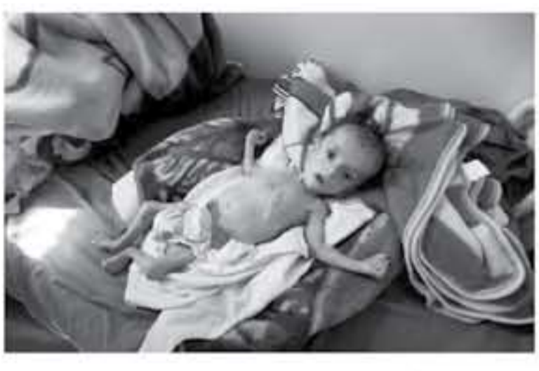
صنعاء - أ ف ب حطت في معسكر صنعاء أمس السبت طائرة حملة بطائرات الأطفال. في أول مساعدات تصل إلى العاصمة اليمنية الخاضعة لسيطرة المتطرفين الحوثيين منذ ثلاثة أسابيع حين أطلق التحالف العسكري بقيادة المملكة السعودية كل منافذ البلد المغلقة.

وأشار الخصري إلى أن إسرائيل تفرض حصاراً بحرياً ومهما سخالت لكل الثوابين لرضى الواقع ويستغل الحصار دولياً للتغطية الفاعلة من وإلى قطاع غزة وبرعاية إسرائيلية لتسبب النزاع من الاحتلال. ولقد الخصري في أن إسرائيل تفرض حصاراً بحرياً ومهما سخالت لكل الثوابين لرضى الواقع ويستغل الحصار دولياً للتغطية الفاعلة من وإلى قطاع غزة وبرعاية إسرائيلية لتسبب النزاع من الاحتلال.