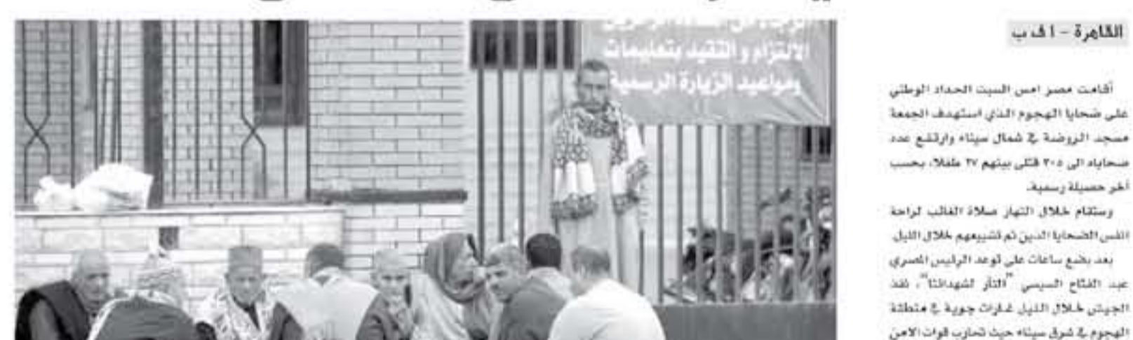
القرب ضحايا الاعتداء على مسجد الروضة في سيناء يتلقون خارج مستشفى الجامعي في الاسماعيلية

أقامت مصر من السبت الحفاد الوطني على ضحايا الهجوم الذي استهدف الجمعة مسجد الروضة في شمال سيناء وارتفع عدد ضحاياه إلى ٣٠٥ قتلى بينهم ٢٧ مدنياً بعد آخر حفلة رسمية.