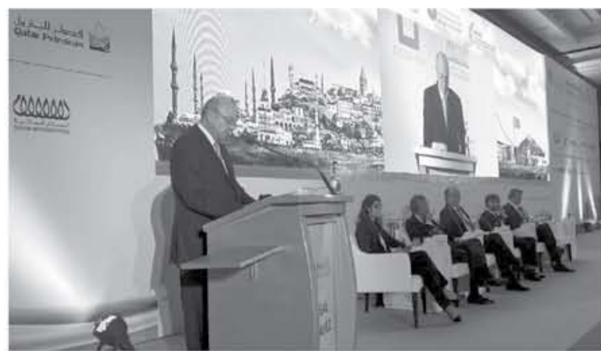
عمان - بترا

قال رئيس مجلس الاعيان فيصل الفايز، ان الاردن ليس من صنع الامارة السورية، فلماذا يحمل مسؤوليه ولماذا اليوم بعد الاردن مالينا لتكتمه من موجهة التحديت الاقتصادية والاجنية التابعة من ازمة اللاجئين وصراعات المنطقة السياسية.