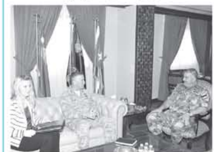
عمان - الانبياط

كما واستقبل رئيس هيئة الأركان المشتركة الفريق الركن محمود عبدالحليم فريحات، أمين الأربعماء المشتركة الفريق الركن محمود عبدالحليم فريحات، أمين الأربعماء المشتركة الفريق الركن محمود عبدالحليم فريحات، أمين الأربعماء... (The text reports on the meeting between the Kuwaiti and American defense attachés, discussing military cooperation.)