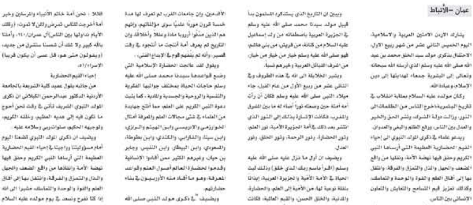
عمان - الانبياط

ويبين ان الترحيب الذي يشتركه المسلمون بنا قبل مولد سيدنا محمد صلى الله عليه وسلم في الجزيرة العربية بانظمة من ولد اسماعيل عليه السلام من كنانة، من قرين من بني هاشم، فهو صلى الله عليه وسلم خير من خير من خير من طرف القبائل العربية وخيرهم نسأ.