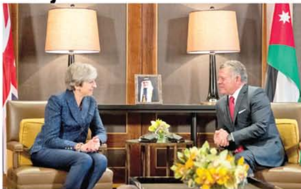
رئيسة الوزراء البريطانية: ندعم رؤية الأردن ٢٠٢٥

عقد جلالة الملك عبدالله الثاني، ورئيسة الوزراء البريطانية تيريزا ماي، في قصر الحسينية، أمس الخميس، مباحثات ركزت على علاقات الصداقة التاريخية بين البلدين، وآخر المستجدات على الساحتين الإقليمية والدولية. وبحسب تصريحات صحفية، قبيل المباحثات الثنائية، التي تبعها أخرى موسعة، رحب جلالة الملك بزيارة رئيسة الوزراء البريطانية إلى المملكة، وقال "يسعدنا وجود معنا هنا في زيارتك الثانية للأردن هذا العام، ونقدر لك هذا الاهتمام، كما أشكره وجميع المؤسسات البريطانية على المستوى المتميز من التنسيق، فقد زارنا وفد من مؤسسات بريطانية الأسبوع الماضي. وتابع جلالة الملك "لقد ناقشت مع رئيس الوزراء اليوم سبل تعزيز منعة اقتصادنا، وهو أمر مهم جدا، ونحن نقدر تأييد هذا الجهد، وما تبدلونه للمساعدة في التعامل مع التحديات.