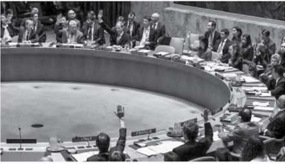
عواصم - وكالات

اجتمع مجلس الأمن الدولي الجمعة في جلسة طارئة بمدة من ثمانين بول لبحث قرار الرئيس الأمريكي دونالد ترمب الاعتراف بشكل أحادي بالقدس عاصمة لإسرائيل. وأثار قرار ترمب غضبا كبيرا في العالم العربي والإسلامي وفضا عاما من شرارة، واشتعل، وقال دبلوماسي ردا على سؤال بشأن النتيجة المتوقعة للاجتماع أنها ستكون «عزلة» واشتعل في هذا النزاع في حين قال آخر "لا شيء". وكان هناك تفاعل كبير لشهد المقدسين وهم يرددون صلاة نصر أمن بمنطقة باب العمود، في صورة تعيد للأفعال لآزمة البوابات الأمريكية، دونالد ترمب، اعتبار الرئيس الأمريكي عاصمة إسرائيل، وقال ملايدوف لجلس الأمن الدولي، "هناك خطر داعم اليوم من أننا قد نرى سلسلة من التصرفات الأحادية التي من شأنها أن نهدمنا عن تحقيق هدفنا المشترك وهو السلام".