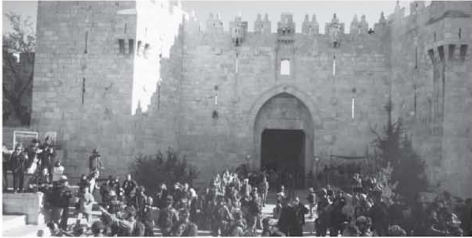
الأراضي الفلسطينية المحتلة - وكالات

استشهد فلسطيني وأصيب أكثر من ثلاثمائة الجمعة في المواجهات بين الشبان الفلسطينيين الغاضبين من القرار الأمريكي بشأن القدس وفوات الاحتلال الإسرائيلي في الضفة الغربية وقطاع غزة. وقالت مصادر طبية إن فلسطينيا استشهد وأصيب ١٢٠ بينهم ثلاثة في حالة خطيرة، في المواجهات التي اندلعت في مناطق القدس على الحدود الشرقية لنطاق غزة. وقال مراقبون إن قوات الاحتلال أطلقت الرصاص الحي وقنابل الغاز الدخيم على الشبان الذين اشتدوا على الحدود بعد خروج حريات مسيرات جماهيرية في مناطق مختلفة من القطاع لتندد بقرار الرئيس الأمريكي دونالد ترمب الذي أعلن الأريهاء انصاف إسرائيل بالقدس عاصمة لإسرائيل. ومع حلول الظلام أثار مرافقون بأن المهدوم عاد نسبيا إلى مناطق المواجهات، كما سيما أن قوات الاحتلال كلفت في المناطق الأخيرة إطلاق الرصاص الحي والغاز الدخيم في الضفة الغربية عقب قيام فيها القدس المحتلة، أصيب ٢٠٠ فلسطينيا بجروح وبمخالات اختناق جراء إطلاق قوات الاحتلال الإسرائيلي الرصاص الغازي والغاز المسيل للدمع عليهم.