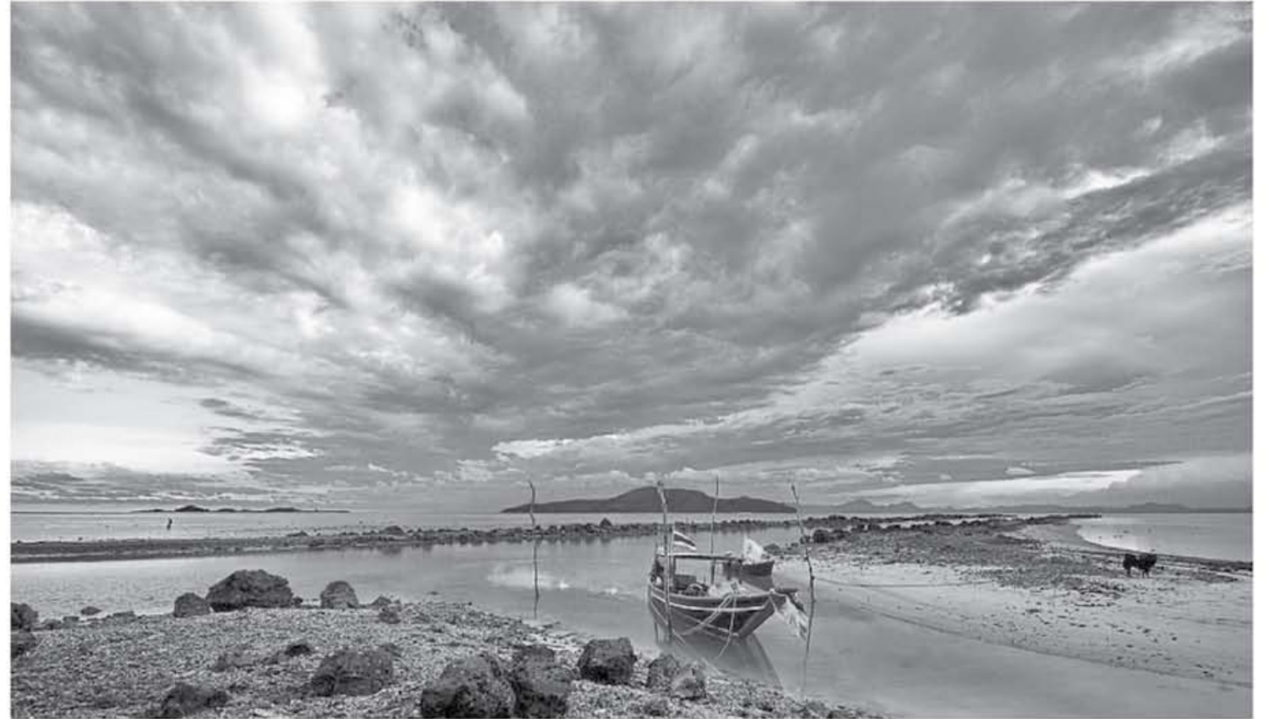
رصد جنانة خنزير

كو ساموي هي جزيرة تقع في أرخبيل تشونغتون في خليج تايلاند. على بعد ٢٠٠ كم جنوب بانكوك وحوالي ٨٠ كم من الساحل الشرقي لجنوب تايلاند، وهي واحدة من مجموعة كبيرة من المنتجعات بفضل ما تقدمه من لؤلؤة رائعة من فرص ترفيهية وأماكن سياحية متنوعة. حتى أنك لن تشعر هناك بالمثل مهما طالت رحلتك في جزيرة كوه ساموي الجميلة. الوصول إلى جزيرة كوه ساموي مع مطارها الدولي الخاص ليس جزيرة كوه ساموي واحدة من الجزر الأكثر شعبية في تايلاند بفضل ما تقدمه من مجموعة كبيرة من المنتجعات وأنظمة والشواطئ الجميلة، ويستمتع سكان ساموي رحلات من بانكوك ويبلغ ما يقرب من ١٠٠ مليون دولار سنوياً من رحلات جوية من سنغافورة وكوالالمبور وبنوك كونج.