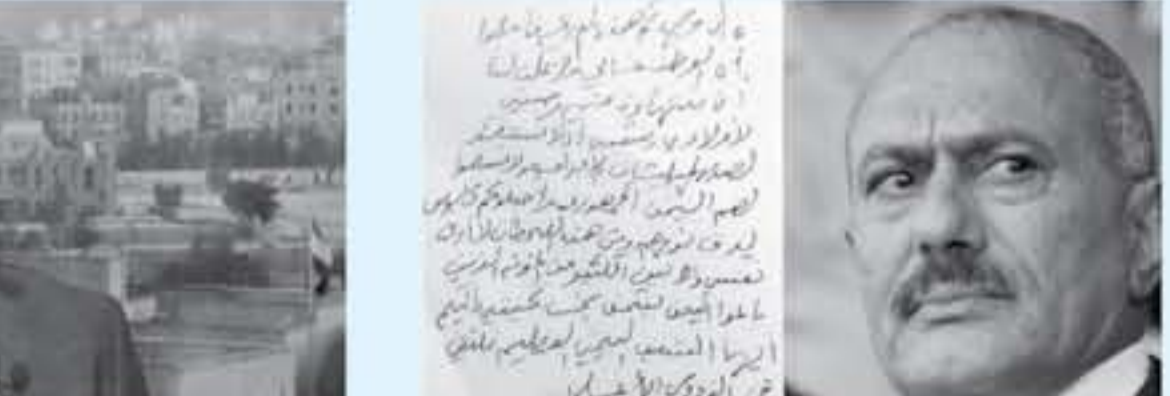
صعابا - وكالات

تداول الناطقون بجنون، ورقة مكتوبة بخط اليد قالوا إنها "وصية" كتبها الرئيس السابق على عبدالله صالح قبل مقتله بيوم واحد على أيدي ميليشيات الحوثي الانقلابية، ومدنية بتوجهه. ونشرت صحيفة الجزيرة، التي تنشر أخبار العواصم، تعليقاً باسم العواصم اليمني، قائلاً: "الآن أصبحنا نرى أخباراً عن وصية صالح التي كتبها قبل مقتله بيوم واحد على أيدي ميليشيات الحوثي الانقلابية، ومدنية بتوجهه.