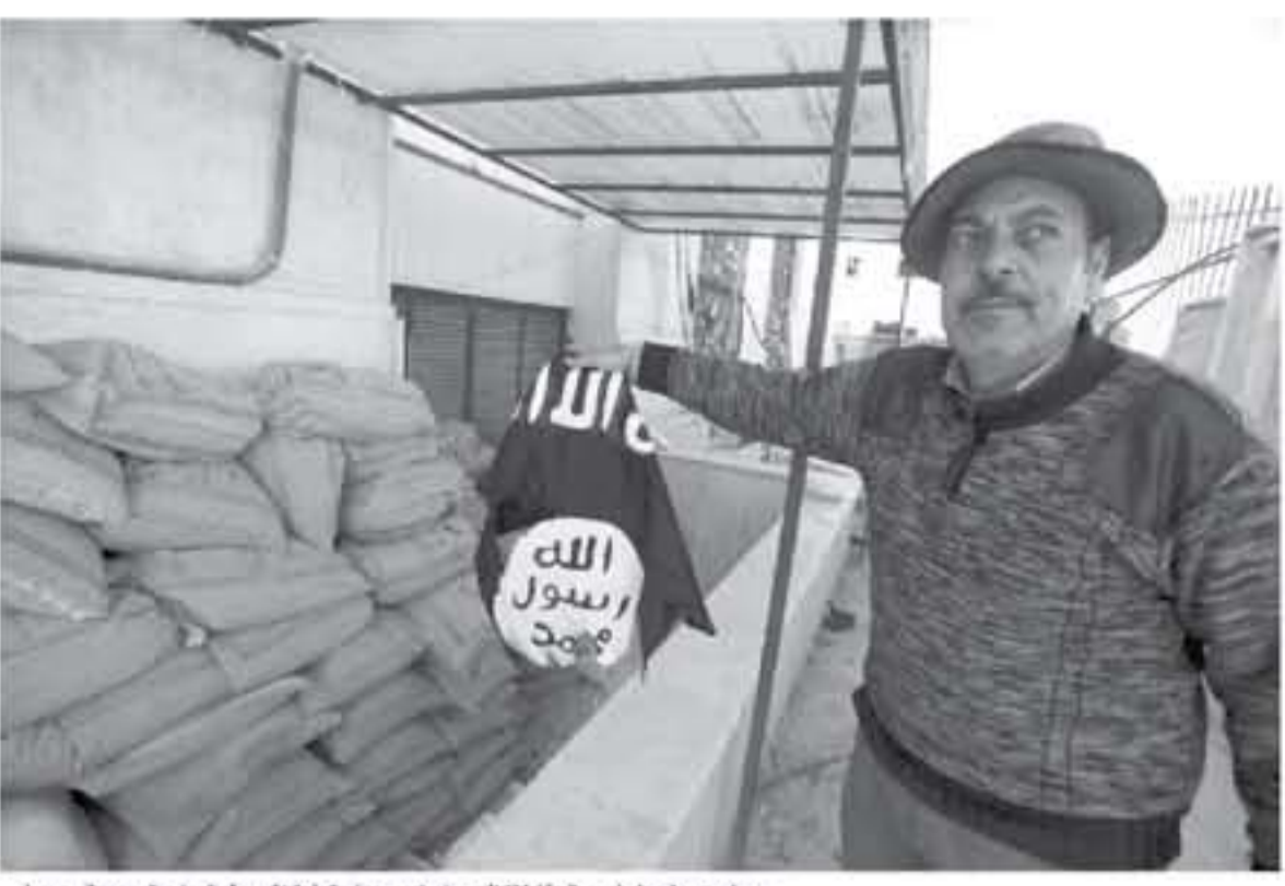
رجل يحمل علمًا محرفًا لتتظيم داعش مع استمارة السيطرة على دمر في سوريا

حدثت أجهزة الاستخبارات الروسية امس الثلاثاء من عودة جهاديين من سوريا قبل مباريات بطولت كأس العالم لكرة القدم والانتخابات الرئاسية الرئاسية الروسية من سوريا خلال ما بين 2018 وذلك بعد ايام على اعلان موسكو ان سوريا "حررت بالكامل" من تنظيم داعش. ويأتي ذلك هفدها اعلان الرئيس الروسي فلاديمير بوتين سحق قسم كبير من القوات الروسية من سوريا خلال زيارة مفاجئة قام اليها الى قاعدة حليممير في زيارة مفاجئة قام اليها الى قاعدة حليممير الروسية في سوريا. ويصوب الامر الرئاسي بما الانتساب الجزئي لقوات الروسية الثلاثة. وسدات روسيا تدخلها العسكري في النزاع السوري عام 2016 وشقت عشرات جوية دعمًا لنظام الرئيس اسدي بشار الأسد ما شكل منعطفًا في مسار الحرب السورية التي اولفت حتى الآن اكثر من 340 ألف قتيل ونسيت بتجهيز الملايين اكثر من ست سنوات. وصرح الاستخبارات الروسية المتكندر بورتنيكوف خلال اجتماع للجنة مكافحة الإرهاب في روسيا ان «عودة مقاتلين سابقين ضمن جماعات مسلحة متحالفة للثوار في الشرق الأوسط يشكل خطراً خطيراً إذ يمكن أن يتخلطوا بمصالحات اجرامية ويخلطوا بين وحش المشاركة في تجنيد مقاتلين آخرين».