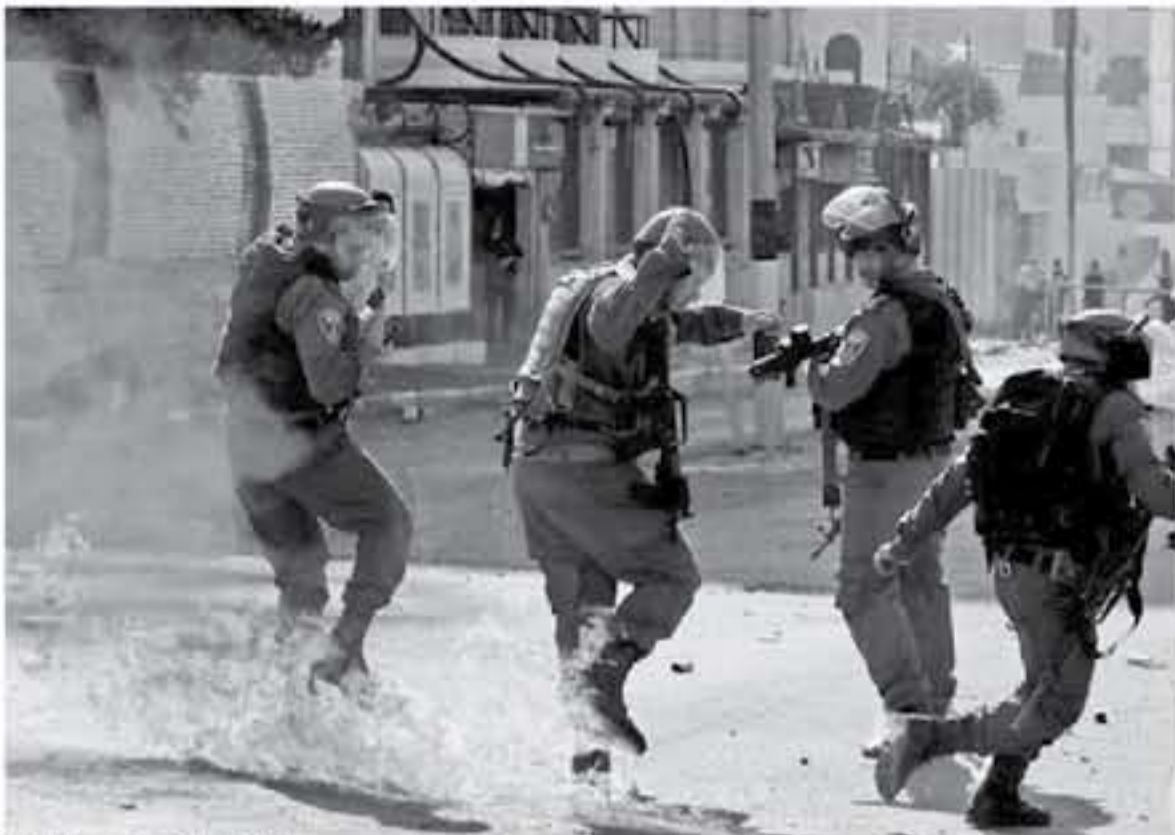
نار الانتفاضة تحرق جنود الاحتلال