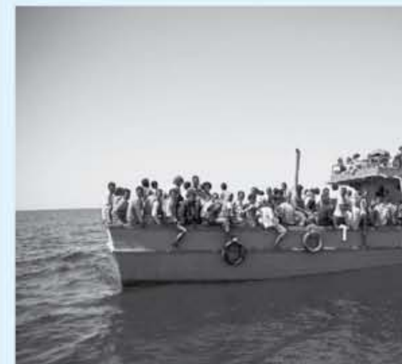
مهاجرون ينتظرون أن يتم انقاعهم في البحر المتوسط

درمت مساعدات إلى هيئة مكافحة الهجرة غير الشرعية التي لديها مراكز الاحتجاز في ليبيا والصالح كالتس باسفر إلى أوروبا عبر السفن القنولية ولا سيما عبر مراكز عثرات الأف، وأكدت المنظمة أن "المهاجرين والاجنبي الذين يترجمهم طغر السواحل الليبي يتلقون من مراكز احتجاز حيث يتلقون معاملة مروعة" مضيفة أن "20 ألف شخص لا يزالون محتجزين في هذا المركز المكتظة والتي لا تراعى أي معايير للثقافة الصحية. وقال المهاجرين في قهدهاتهم أن حراس مراكز الاحتجاز يقومون بتعذيبهم بالترزم والمضوء على ما معهم من مال". سور عن تجارة الرقيق في ليبيا، أعلن الاتحاد الإفريقي الأسبوع الماضي مزمة إعادة هؤلاء العتريين إلى شخص إلى بلدانهم الأصلية خلال ستة أسابيع.