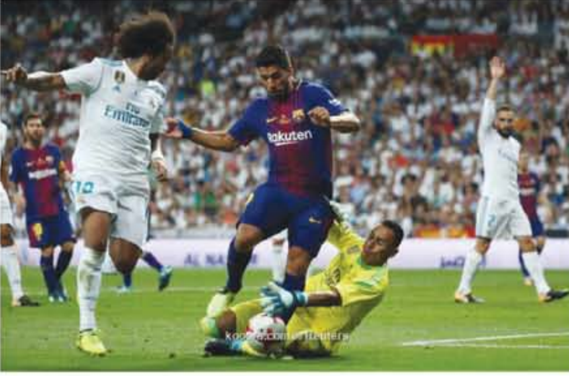
مدير - وكالات

وتشبال مدريدان خلال تلك الفترة من الصراعات التي لا تنتهي الرسائل سواء من خلال الصحافة أو التوجهات المباشرة أو الخفية الجديدة عن الأناظر، بالإضافة إلى التفرقات خلال المباريات بيد أن ذلك كله كان في الوقت الذي كان يعيش كل منهما في مدينة مختلفة، ولكن الآن أصبح الأمر مختلفا وأكثر تعقيدا بعدما التفتت عدولتهما من ضواحي مدينة مانشستر، ولا يجمع بين هذين المديرين الكبريين سوى النجاح فلاهما فاز بهدي أبطال أوروبا مرتين، فيما يتفوق مدريد على ريال مدريد في عدد مرات بطولات الدوري بواقع ١٢ فوزا، فيما أدار مواجهة برشلونة وجرورنا، وانتهت ٢-٠ أيضا للبرشلونة.