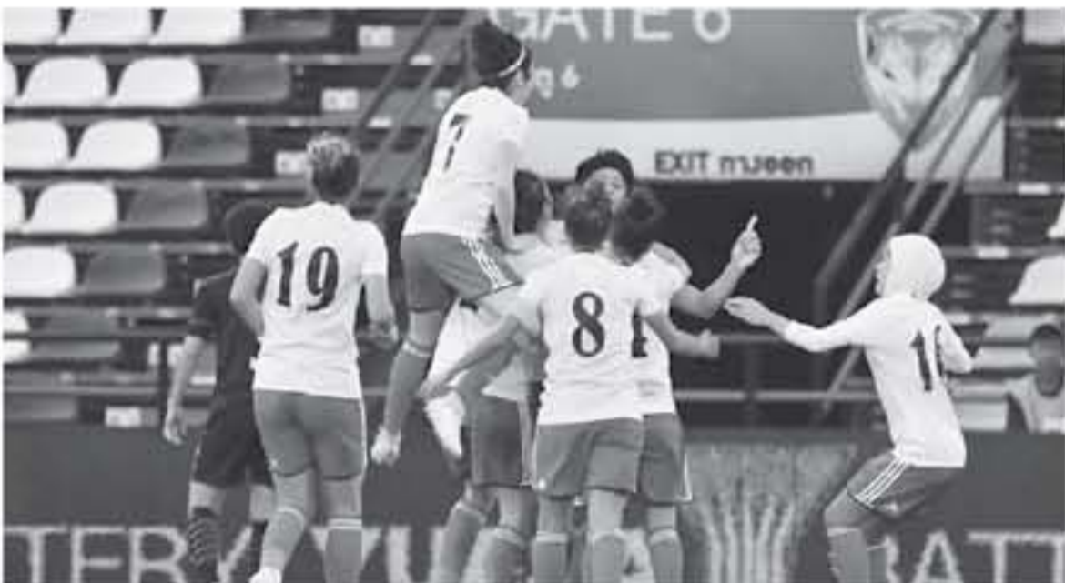
عمان - الأنباط

اختتم المنتخب الوطني للنشميات لكرة القدم امس معسكره التدريبي في تاييبت في اطار الاستعدادات للمشاركة في بطولة كأس اسيا التي تستضيفها الاردن خلال الفترة من ٦ الى ٢٠ نيسان المقبل. اشتمل المعسكر التدريبي على تدريبات متنوعة ومباريات بين المنتخب امام منتخب سمات تاييبت، حيث خسر المنتخب في المباراة الاولى قبل ان يفوز امس في المباراة الثانية واشرف المدرب الامريكي مايك بيكي على تدريبات المنتخب الوطني للنشميات الذي تواجد في معسكر تاييبت بدمون لاصيته المحترفين في الثانية وامريكا مارا بو صباح ساسي فرزان، وكانت فرقة كأس اسيا للنشميات والتي تم سحبها السبت الماضي في البحر الميت الوقت للتحضير الوطني الى جانب الصين وتاييبت والفلبين، وسيواصل منتخبنا برنامجه الاعدادي لكأس اسيا للنشميات مع بداية السنة الجديدة.