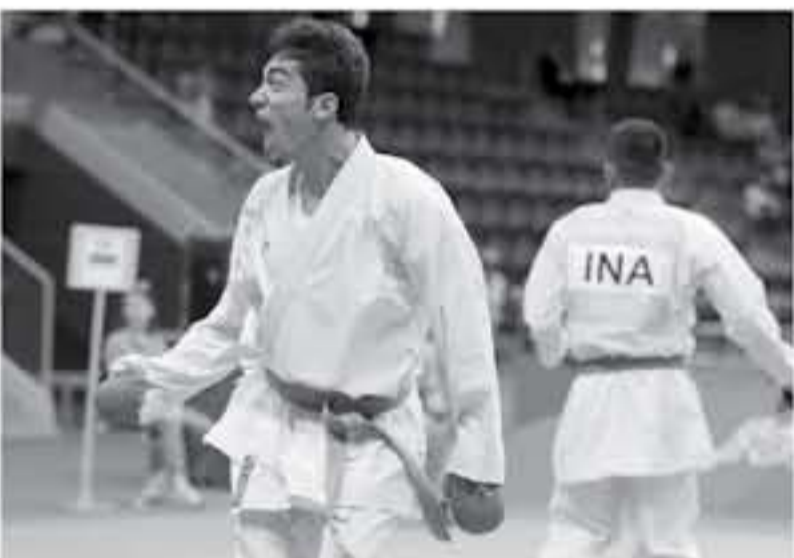
عمان - الأنباط

شارك في بطولة الكراتيه تصفية المنتخبات الوطنية للكراتيه لخاتمة الفعاليات العمومية (الرياضة) خلال يومي الجمعة والسبت في صالة مركز الأمير راشد لاعاب الدفاع عن النفس بمشاركة ٢٠٠ لاعب ولاعبه مسجلين من المراكز التالية // البيوكان // النجار // مسفر فريش // هبة الاسد // شادي النجار // مدلاسة الاحمد // خالد // العهد الاسود // الاحتراف // الجامعه // محالب النمر // عربين // الاسود // صلاح الدين // الذهبي // الامن العام // البيرق // اساطير الاردن // التائر // حسان اليقاف // احمد يوسف // خولوكا سويلمة //