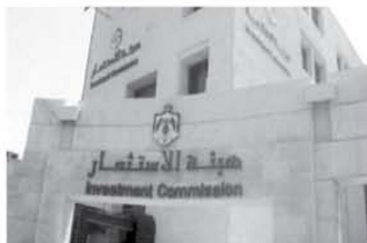
عمان - الأنباط - علاء غلان

قامت هيئة الاستثمار بتعيين مهندسة منتدبة للعمل بالهئية دون إجراء المقابلة اللازمة لها لسوء باقالي الموظفين الذين جرى تعيينهم.