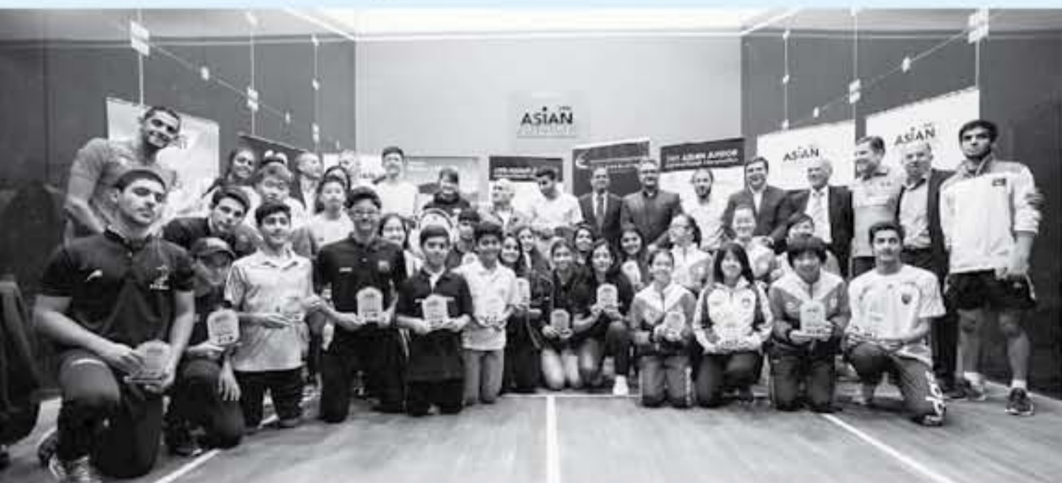
عمان - الأنباط

شارك في بطولة اميركا المنتخب الوطني للسكواش في بطولة اميركا في مدينة سان فرانسيسكو في ولاية كاليفورنيا من ١٤ الى ١٩، وكرم البطوليه ومباراتهم رضاء عن مرحلة الاعداد التي خاضها المنتخب في الفترة الماضية. لا سيما وأن المنتخب الوطني سيشارك في بطولة اميركا في مدينة سان فرانسيسكو في ولاية كاليفورنيا من ١٤ الى ١٩، وكرم البطوليه ومباراتهم رضاء عن مرحلة الاعداد التي خاضها المنتخب في الفترة الماضية. لا سيما وأن المنتخب الوطني سيشارك في بطولة اميركا في مدينة سان فرانسيسكو في ولاية كاليفورنيا من ١٤ الى ١٩، وكرم البطوليه ومباراتهم رضاء عن مرحلة الاعداد التي خاضها المنتخب في الفترة الماضية.