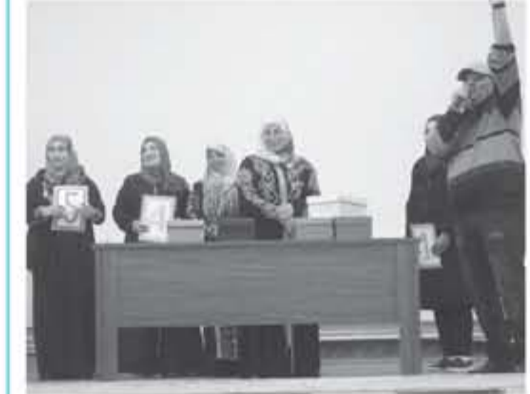
عجلون - الأنباط - ناديا الفانزارة احتفلت لجنة الدعم المجتمعي للفلال الأحمر الأردني في عجلون في الجامعة الهاشمية باختتام أنشطتها وبرامجها للعام الحالي ضمن مشروع منسق من قبل الصندوق الأردني الهادف للتنمية البشرية والتعاون مع المنظمات الدولية.

و أشار إلى أن شأنه بالمشاورات بين المتخصصين العام والخاص ويهدف إلى حوسبة جميع التخصصات الطبية في المملكة إضافة الى توضيحه لميزات بوابة الأردن للحلول الطبية عن بعد مرضاهم.