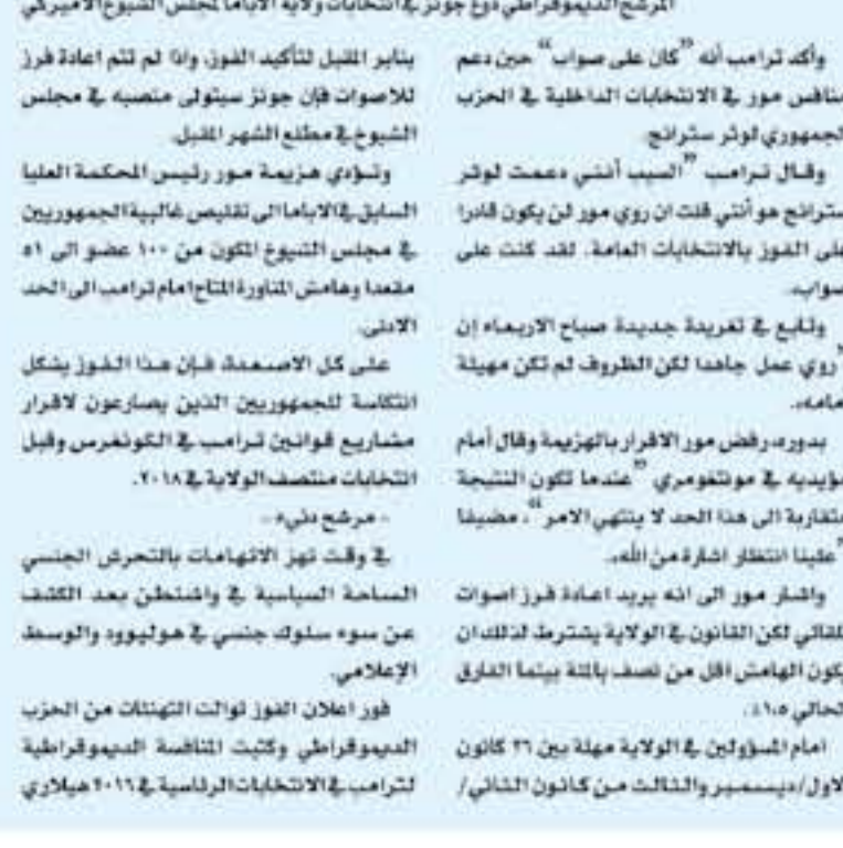
المرشح الديموقراطي دوج جونز في الانتخابات لولاية الاباما لجلس الشيوخ الامريكى

واصغرهم بالخر "البطة اعتر الخبون في الاباما ستلورا سيصغرهم بالخر". مدينة "ان تكن الديموقراطيون من العوز في الاباما باكتالونيا وعيليان انتكاش في كل مكان.