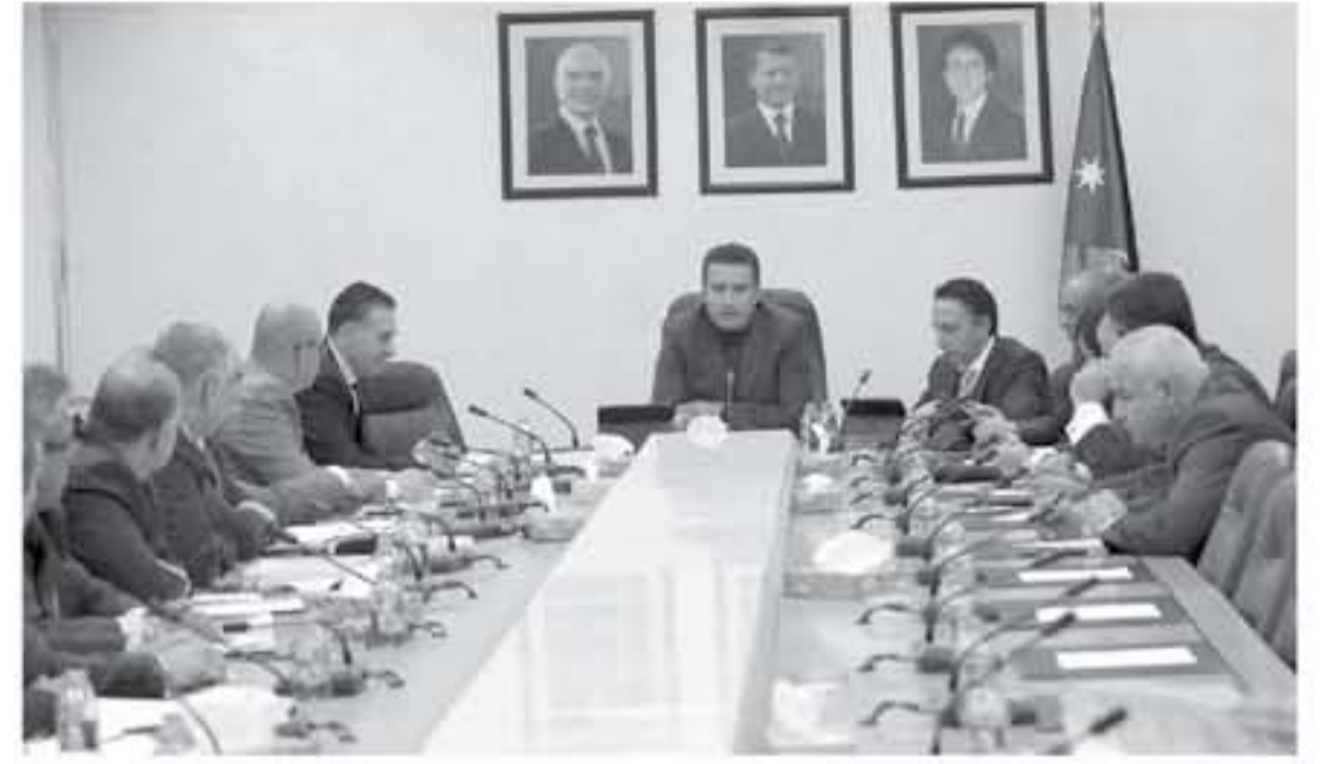
عمان - الأنباط