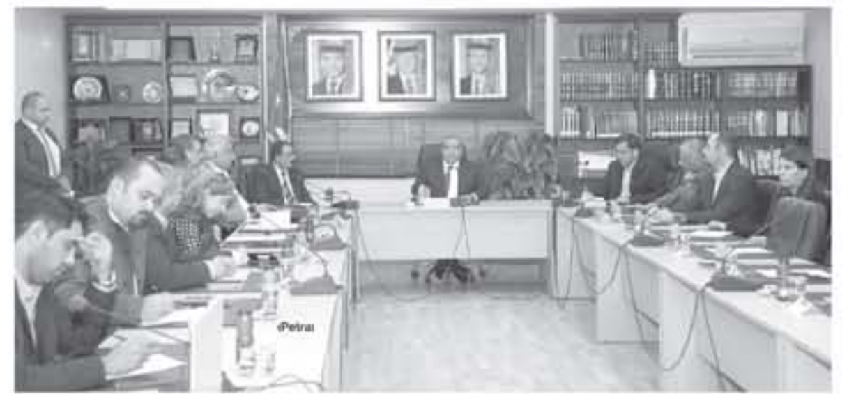
عمان - الأنباط - طارق أبو عبيد

أطلق وزير العدل الدكتور عوض أبو عراد تشايقية، خدمة استصدار شهادات عدم المحكومة إلكترونياً بتسهيلا الحديثة ضمن خطة التحول الإلكتروني الحكومي والتوجه الحكومي للوصول إلى آراء وهي عام ٢٠١٠، والتي يبدأ العمل بها رسمياً في الأول من كانون الثاني القادم.