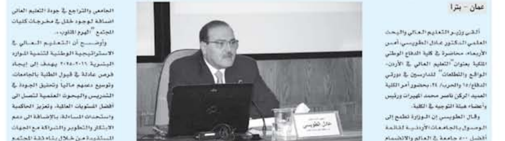
عمان - بتر