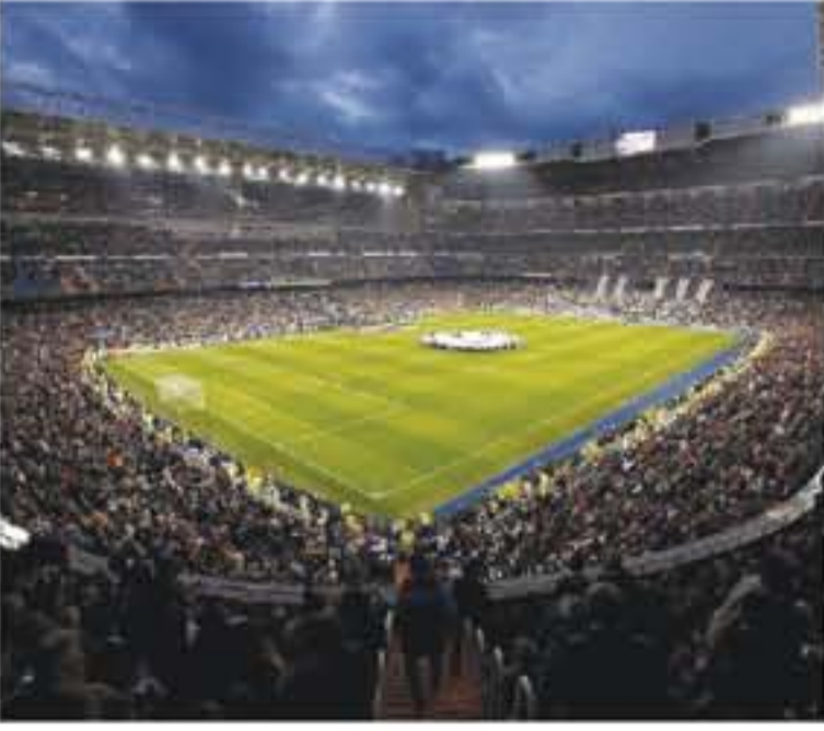
مدير - وكالات

تاريخه. ومن بينها نهائي بطولة أمم أوروبا لكرة القدم عام ١٩٦٤، التي أقيمت بين إسبانيا والاتحاد السوفيتي، والثقة بطول لا يوصف. في دور المجموعات، وكذلك المباراة النهائية، التي فازت بها إيطاليا على ألمانيا ٢-١.