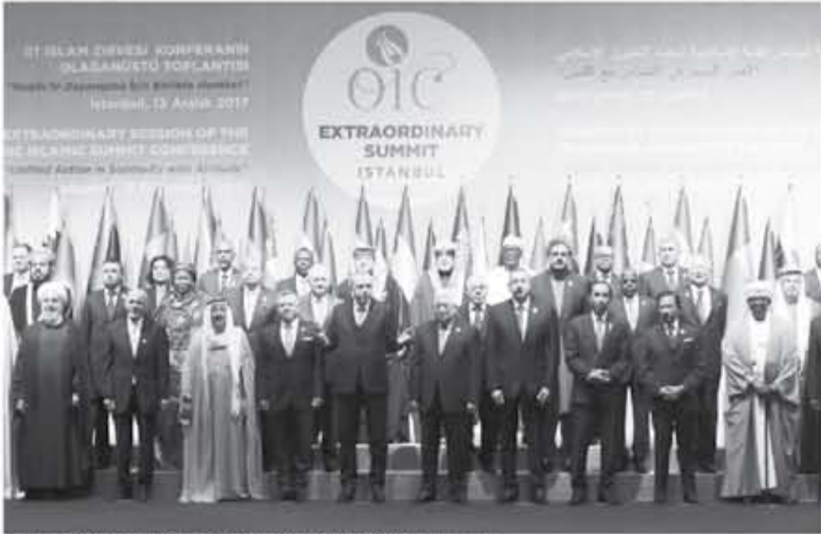
قادة ومستو الدول الأعضاء في منظمة التعاون الإسلامي خلال القمة الطارئة في اسطنبول

وكان حضور الرئيس التركي الساري نيكولاس مابورو القصة لافتة، إذ إن بلاده لا يوجد بها عدد كبير من المسلمين، لكنه بينما معارضا قويا للسياسات الأمريكية.