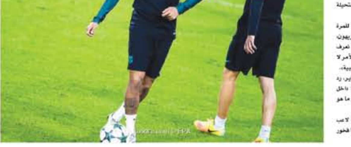
برشلونة - وكالات

حدث أندريس إنبيستا نجم برشلونة، عن إمكانية انضمام زميله السابق يسعيف البرسا نيمار جونيور مهاجم باريس سان جيرمان الفرنسي إلى صفوف الفريق التقليدي ريال مدريد.