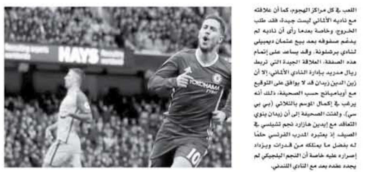
مدير - وكالات

يسعى نادي ريال مدريد الإسباني لتضم صفوفه في سوق الانتقالات الشتوية، في مركز قلب الهجوم، خاصة بعد الأزمة الهمجية التي يعاني منها الفريق، مع أنه عرف انتمائه في الفترة الأخيرة، وكان النادي الملكي يضع يديه على نجم لستر سيتي، ماركو إيكاردو إلا أن النادي الإيطالي رفض حتى التفاوض حول إمكانية رحيل نجمه في الوقت الحالي، وحسب صحيفة موندو ديبورتيفو الكاتالونية، فإن ريال مدريد قد حوّل اهتمامه باتجاه نجم روسيا دونكوف، بيب إيمريك أوباميانج، من أجل التمهيد معه في يناير، وبأن هذا الاختيار، لأن اللاعب الجانبي يستطيع اللعب في كل مراكز الهجوم، كما أن علاقته مع ناديه الألماني ليست جيدة، فقد طلب الخروج وخاصة بعدما رأى أن ناديه لم يقدم صفوفه بعد بيع عثمان نديجيبي لنادي برشلونة، وقد يساعد على إتمام هذه الصفقة، العلاقة الجيدة التي تربط ريال مدريد بإدارة النادي الإسباني، إلا أن زين الدين زيدان قد لا يوافق على التوقيع مع أوباميانج حسب الصحافة، ذلك أنه يرغب في إكمال الموسم بالثلاثي (بي بي سي)، ولقبت الصحافة إلى أن زيدان يولي التلاعب مع إيدن هازارد نجم تشيلسي في الصيف إذ يعتبره المدير الفرنسي حثماً له بفضل ما يمتلكه من قدرات، ويزداد إصراره عليه خاصة أن النجم البلجيكي لم يجده بعدد معه في النادي الندي.