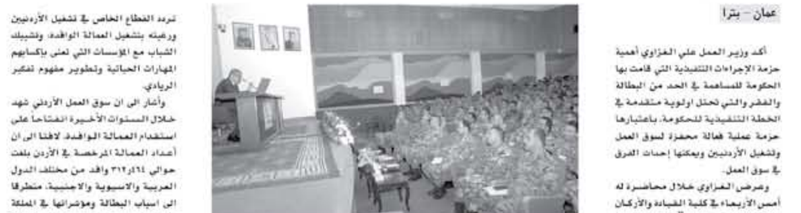
عمان - بتر