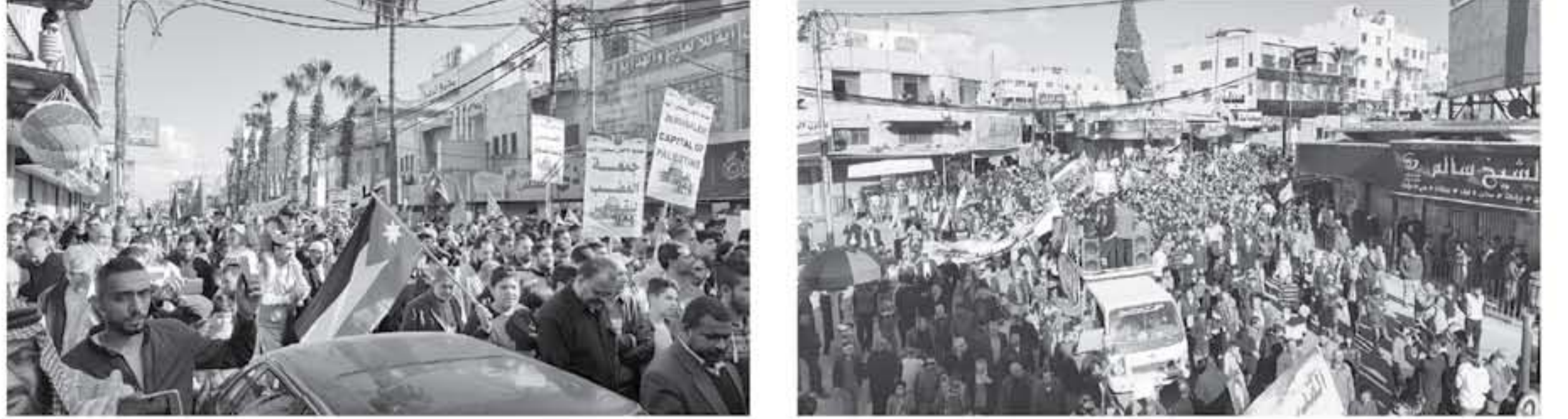
عمان - سبأ