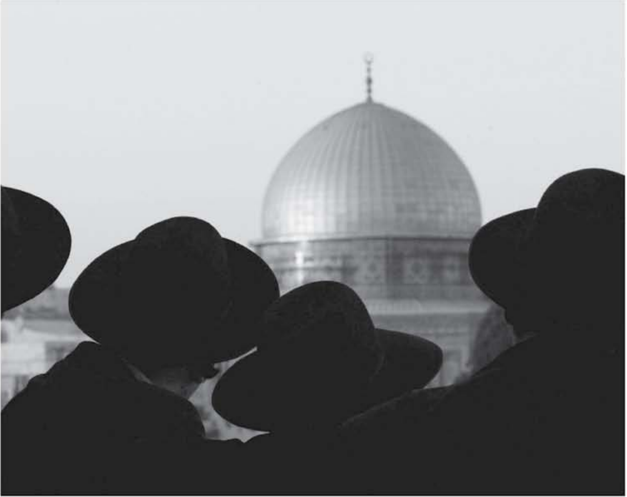
الولايات المتحدة بتقديم بعض المقترحات الجادة أو طرح مقترحات جديدة بأنفسهم

تقرير المؤتمر. إن سطوة القوي الصهيوني في واشنطن والقدرة على جعل القرار الأمريكي رهينة في يده أمر واقعي، وعندما ينظر إليه من هذا المنظور فإن ما فعله ترامب في ٦ ديسمبر لم يكن معيارا لتمام. وما كان لشهد برمنه ليكون أكثر سخافة لو أعلن ترامب أيضا التي تحولت من كونها الدولة الأقوى على وجه الأرض إلى قزم يركب على عاتق أسود، لا يمكن أن يكون قرارها إلا نظرية المؤامرة. أزمة عميقة تكمن مشكلة إسرائيل في أنها غارقة في كثير من القضايا والأزمات في الشرق الأوسط، بيد أن مشكلة الولايات المتحدة في الوقت الراهن تكفي على مشكلة إسرائيل، نحن نرأى أزمة عميقة في المنطقة، نشكها سلسلة من الاحتمالات التي تشكلت كشكل شكل تلك العلاقة الأمريكية والهجمات الإسرائيلية على مدى عقود. إن الاحتلال الإسرائيلي والهجمات المتعمدة الإسرائيلية وإن كان على غزة ولبنان والاحتلال الأمريكي لأفغانستان والعراق كانت المصادر الأساسية للأزمات المتعلقة على مدى العقود الماضية الماضية. ولذلك فإن إعلان ترامب عن القدس لا يختلف عن خطوات التدخل في الدول الأخرى التي اتخذتها الإدارات الأمريكية السابقة والتي لا تستند إلى استراتيجية متناغمة صولوا بالإجماع (٩٠ إلى صفر) في السبعينات الثمينة و التخطيط الشامل لقرن من الزمن. ولذلك يجب النظر في قرار ترامب جنيا إلى جنب مع القانون الذي أقره الكونغرس الأمريكي خلال رئاسة بيل كلينتون في ١٩٩٥ ونقل السفارة الأمريكية من تل أبيب إلى القدس. ومن ثم فإن الصعب أن يختلف مع الرأي الفائل بأن السياسة الأمريكية لا يوجد أي تحدي للولايات المتحدة في الشرق الأوسط، حيث أن إسرائيل التي تلعب دورا محوريا في الشرق الأوسط، وهي مصدر قلق كبير في الشرق الأوسط، ولكن على خلفية من الشرق الأوسط، حيث إن الشخص الوافي سوف