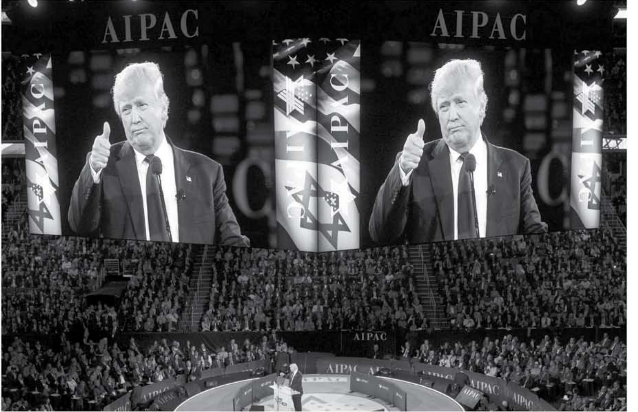
النياب - عزائم ووكالات - ماونز القبري

اعتدت الصحافة الامريكية ومصادر دراسات بالعلاقات مع اسرائيل، في اعقاب الخطوة التي اتخذها الرئيس دونالد ترامب بشأن القدس، وشاءت العديد من هذه الصحف من مثل فورين بوليسي، كيف تراه من اسرائيل على ترمبه وهو وسرمان ما يشوه أي شيء يمسها؟ والايات نقلت وتتلو ابعاد العلاقة بين الولايات المتحدة الامريكية والكيان الاسرائيلي وسامى التخوفات في الداخل الامريكي وسرر التخفير في السياسة الامريكية في اعقاب قرار ترمب الاعتراف بالقدس عاصمة لاسرائيل ونقل السفارة الامريكية الى القدس وبما هوولة في مانشورته الحقة الامريكية (فورين بوليسي) و مقال للكاتب ميريك تشوليت قال فيه إنه بالرغم من هذه العلاقة، وذلك لأنها تكشف عن تحد عميق يمثل في احتمال تدمير ترمب لهذا الدعم الذي تشكته اسرائيل من الحزبين الرئيسيين الجمهوري والديمقراطي. وقال الكاتب إنه يمكن سماع الصوتين والتعبير الإسرائيلي وهي تتحدث عن أن عهد أوباما شك كارثة غير متناهية بالشرق الأوسط، حيث انسحبت الولايات المتحدة من المنطقة وتعاونت مع إيران والغت بأصدقائها من العالم العربي على كافة المقرب. وأضاف أنه منذ الربيع العربي إلى اتفاق النووي مع إيران ميريك سوات أوباما بإخلافات عميقة بين الولايات المتحدة واسرائيل، وأن العلاقة بين أوباما وتناوه تفاقمت إلى أبعد الحدود، لكن ذلك لم يمنع استمرار التعاون بين الطرفين على المستويات الأمنية والاستخبارية والعسكرية والمالية.