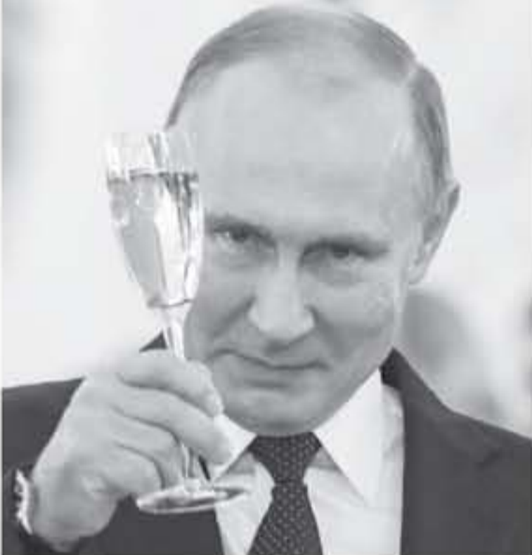
بوتين من "الأمال الصادقة في سوريا" التغيرات الحورية للأفضل في سوريا

موسكو - أ ف ب دعا الرئيس الروسي فلاديمير بوتين إلى "تعاون براغماتي" بين بلاده والولايات المتحدة في تهنياته لتظهير الأمريكي دونالد ترامب بمناسبة رأس السنة، على ما أعلن الكرملين أمس السبت.