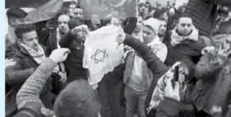
الاحتجاج الإسلامي في ألمانيا

برلين - د ب أ ضربت صحف ألمانية تقارير من مظاهرات للمسلمين معادية للسامية في برلين بعد قرار إسرائيل بإغلاق سفارة فلسطين كبادرة إبان الاعتزاز من شبيخة المسلمين وتخوير اليهود بضرورة، كما يرى الكاتب اليهودي إرمين لانغر في تعليقه.