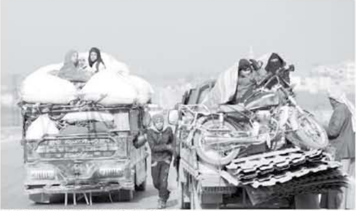
تأخرون من ادب (شمال غرب سوريا) على طريق حلب دمشق الدولي

بيروت - أ ف ب حققت قوات الجيش العربي السوري تقدماً آمس السبت على حساب الفصائل الجهادية والمقاتلة في محافظة ادب في شمال غرب البلاد، وفق ما أفاد المرصد السوري لحقوق الإنسان، زائماً مع استمرار حركة نزوح السكان من المنطقة.