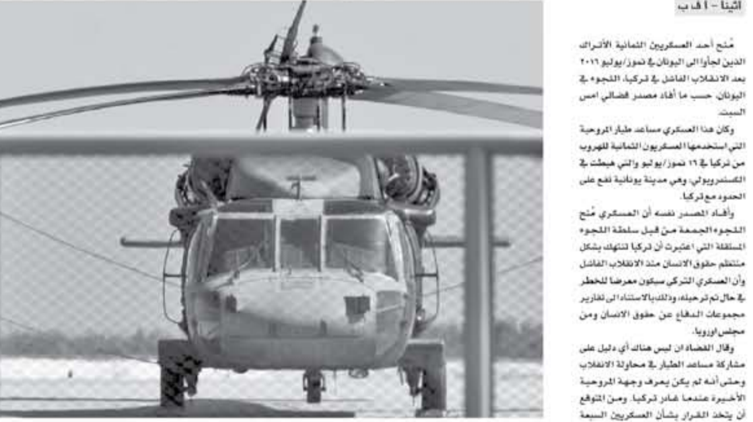
الطائرة العسكرية التي استخدمها العسكريون الثمانية للهروب إلى اليونان في ١٦ كانون/يناير ٢٠١٦ بعد الانقلاب الفاشل في تركيا

ثينا - أ ف ب منح أحد العسكريين الثمانية الأتراك اللجوء إلى اليونان في كانون/يناير ٢٠١٦ بعد الانقلاب الفاشل في تركيا، الجوء في اليونان حسب ما أفاد مصدر إخباري أمس السبت.