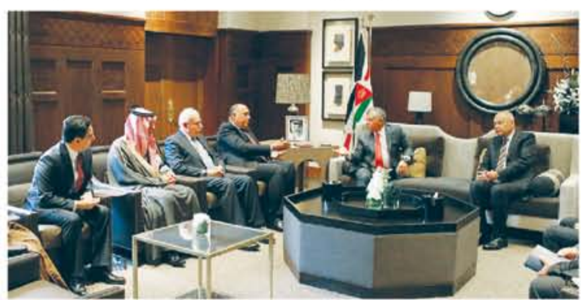
التفاصيل من ٢٠

عمان - الأناضول: أكد جلالة الملك عبد الله الثاني ضرورة تكثيف الجهود وتنسيق المواقف العربية لدعم الأشقاء الفلسطينيين في الحفاظ على حقوقهم التاريخية والقانونية الراسخة في مدينة القدس، وبما يساهم في إقامة الدولة الفلسطينية المستقلة وعاصمتها القدس الشرقية. وأشار جلالة إلى أن مسألة القدس يجب تسويتها ضمن إطار الحل النهائي والتفاهت سلام عادل وناجم بين الفلسطينيين والإسرائيليين، يستند إلى حل الدولتين وفق قرارات الشرعية الدولية ومبادرة السلام العربية. جاء ذلك خلال استقبال جللته، في قصر الحسينية، امس السبت، الوفد الوزاري العربي المكلف التوسط به متابعة تداعيات القرار الأمريكي الاعتراف بالقدس عاصمة لإسرائيل ونقل السفارة الأمريكية إليها. كما شدّد جلالة الملك خلال اللقاء، على أهمية دعم مسودتين الفلسطينيين وحماية الهوية العربية كدينة القدس والتمسك بالإسلامية والمسيحية فيها، لافتاً جللته إلى