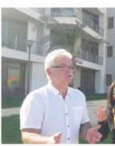
التفاصيل من ١٤

العقبة - خالد فخيدة: أكد المسؤول الأمني الروسي الجنرال بوزير وإخاريكون واقع الأمن والأمان الذي شاهده في الأردن والعقبة فاق توقعاته التي كانت من أسباب زيارته للأردن الياسم. والجنرال وإخاريشكو حل ضيفاً على مديرية الأمن العام وقام في تاليهاته على شاطئ العقبة لعدة أيام وشاركه الصباح الروس احتفالاً بعيدهم رأس السنة الميلادية. وقال إخاريشكو للأناضول ان أبرز ما لفت انتباهه أمانها انه لا تشاهد رجال أمن في الشوارع خاصة في الجزء الجنوبي من مدينة العقبة الا أنهم يظهرون لك فجأة عند الطلب.