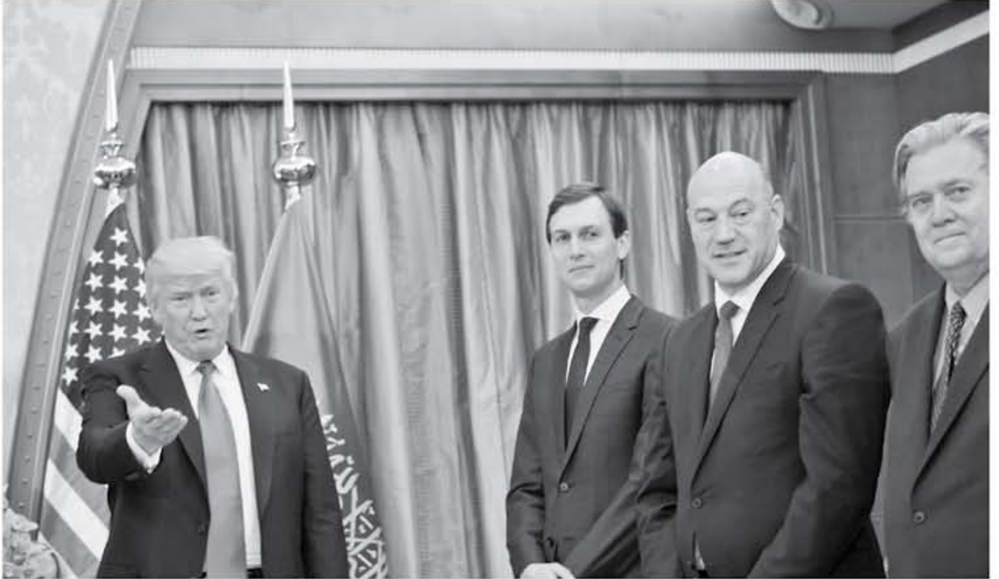
ولتر - واشنطن - الرباط - بايون العمري أصبح كتاب المؤلف مايكل وولف الأكثر مبيعاً في الولايات المتحدة. داخل بيت تراهب الأبيض، الأكثر مبيعاً على الإنترنت. وقد طلب غير مسروق حبيبا ما ذكرت صحيفة "نيويورك تايمز" البريطانية. وقالت مكتبة أمازون وبارنر أند نوبل الإلكترونية إن الكتاب احتل المرتبة الأولى بحلول منتصف يوم الجمعة. إلا أن محزون الكتاب بدأ يتفقد حيث أشارت أمازون إلى أن الشحن قد يستغرق من أسبوعين إلى أربعة أسابيع وقد نمت نسخ الكتاب في غضون 1٤ ساعة فقط من بدء توزيعه.