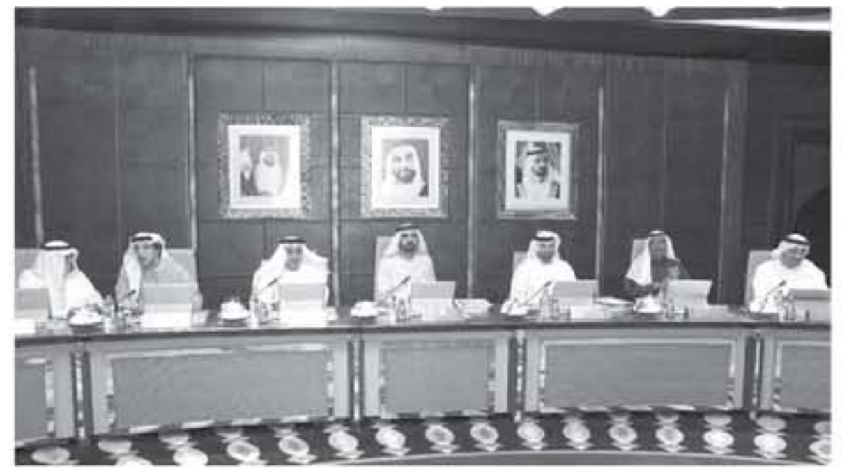
كما اعتقد المجلس استراتيجيية الأسمن المالي لثولة الإمارات خلال العتدين المقلين. حيث تشمل الحلقة

أبو ظبي - الفريية اعتقد مجلس الوزراء الإماراتي... المجلسة المتشقة بصدر الرئاسة