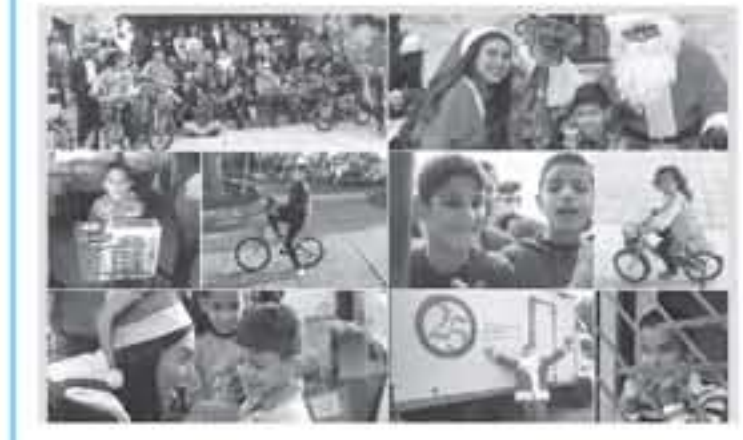
عمان - الأناة نشاي ويوشي لعام الثالث على التوالي... بالإضافة إلى مركز بريرة الأردن لهذا