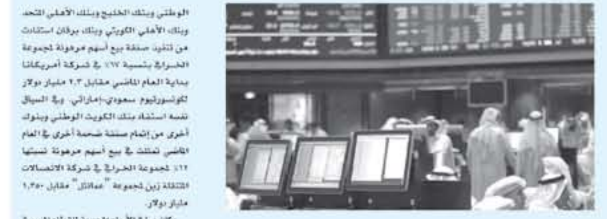
الكويت - العربية تربة البورصة اعتباراً من هذا الأسبوع... الاستعدادات للاعلان من نتائج المالية