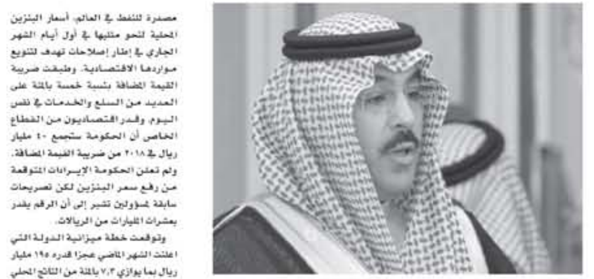
البدل أيضا وتحمّل الدولة ضريبة القيمة المضافة في بعض الحالات من بينها

الرياض - رويترز نقلت صحيفة الشرق الأوسط... من عواد العواد وزير التجارة