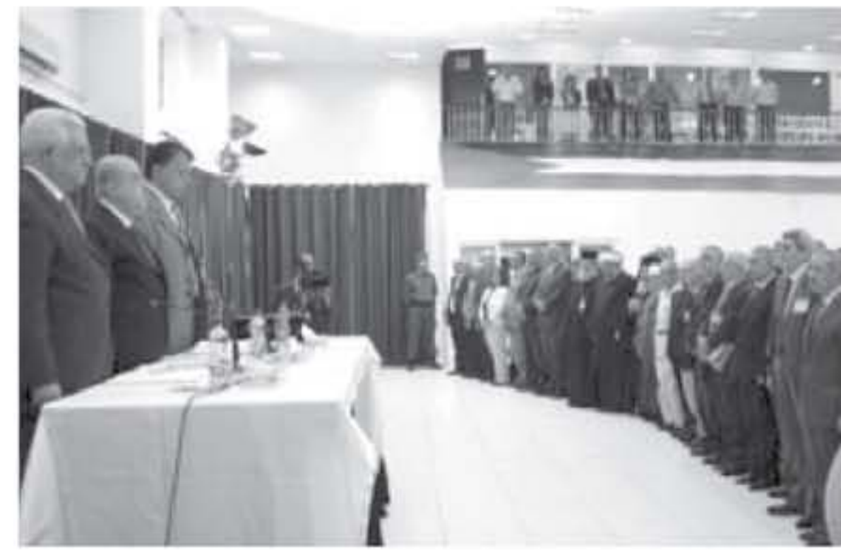
بيت لحم - يفا

كتب الدكتور أحمد مجدلاني عضو اللجنة التنفيذية لمنظمة التحرير ان الجلسة المركزية سوف يتخذ قرارات حاسمة تتعلق بالسلطة من مرحلة الى مرحلة جديدة.