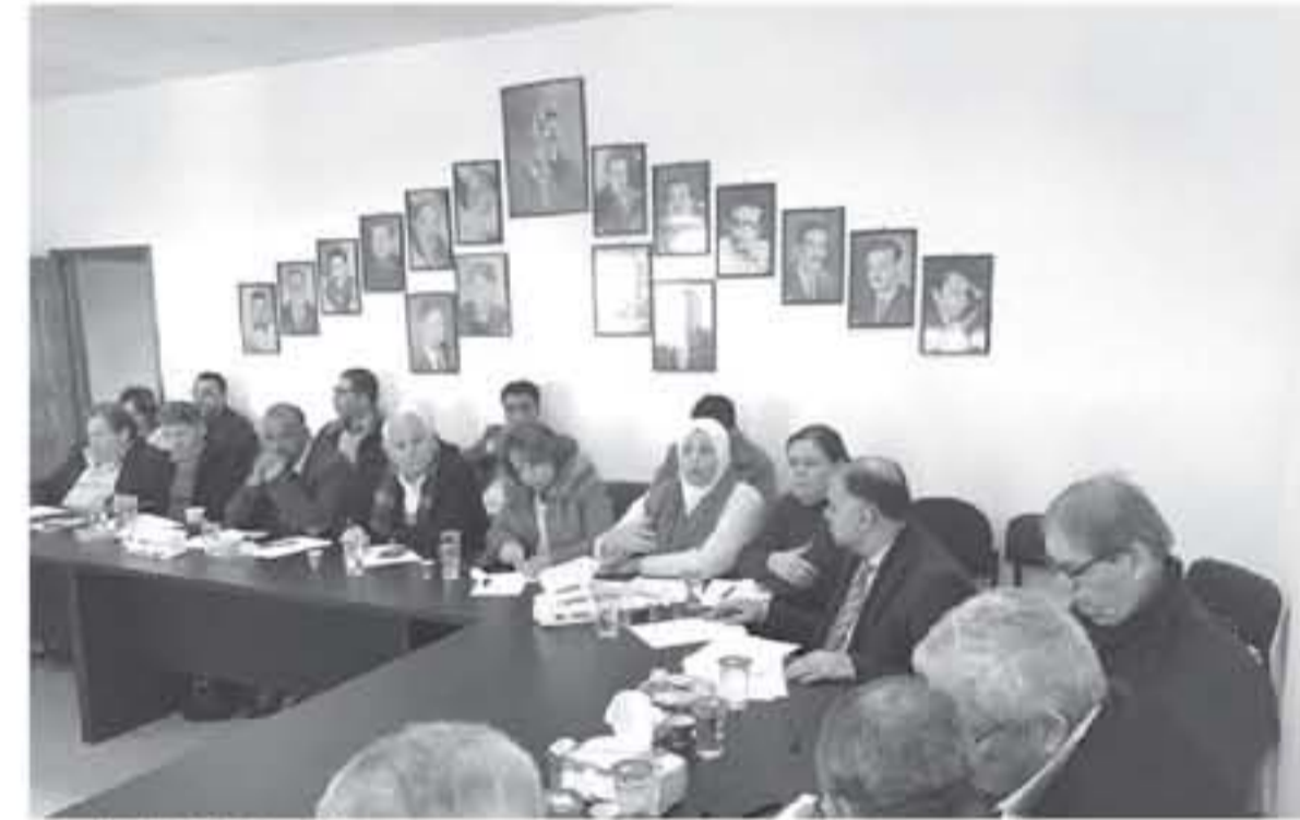
رام الله - يفا

عقد مجلس المجلس الثوري لحركة فتح بمدينة رام الله صباح امس اجتماع نقاشي لاختصار الجلسي الثوري لتحركة وحضره ما عدوا وذلك بغرض مناقشة التطويرات والاجتماعات المجلس المركزي لسلطة التحرير والمبادرة رام الله وحضر الاجتماع نائب رئيس حركة فتح محمود العالول وعضاء اللجنة المركزية الحاج اسماعيل جبر وروحي فتوح.