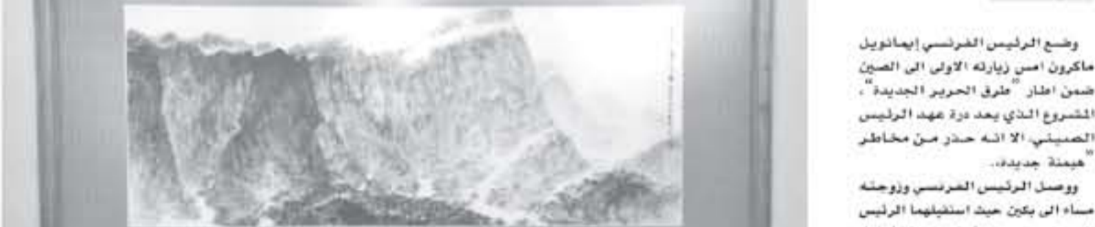
يكنين - أ ف ب

وضع الرئيس الفرنسي إيمانويل ماكرون امس زيارته الاولى الى الصين ضمن إطار "طرق الحرير الجديد".