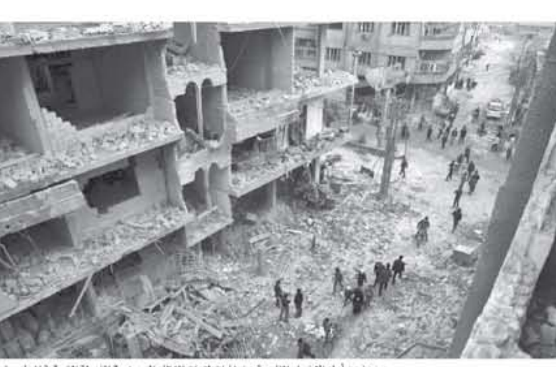
مدمون أمام الاضرار الناتجة عن غارات قوات النظام السوري في الغوطة الشرقية المحاصرة

وأورد المرصد من جهته أن قوات النظام تكثفت من قصف لغرة نعلها بإدارة المركبات الحاذية كتيبة حرسا. ويصعب بعد الرمن تشتت الوجهات غرب اارة المركبات لتوسع احر الذي قتمه فريق من القوات الخاصة.