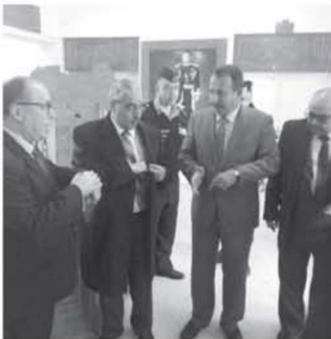
الرمثا - الأنباط