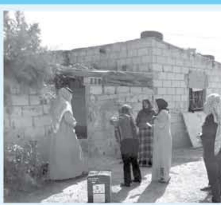
مخالفة في أول امتحانات التوجيهي ٢٣

مخالفة في أول امتحانات التوجيهي ٢٣ مخالفة في أول امتحانات التوجيهي ٢٣ مخالفة في أول امتحانات التوجيهي ٢٣