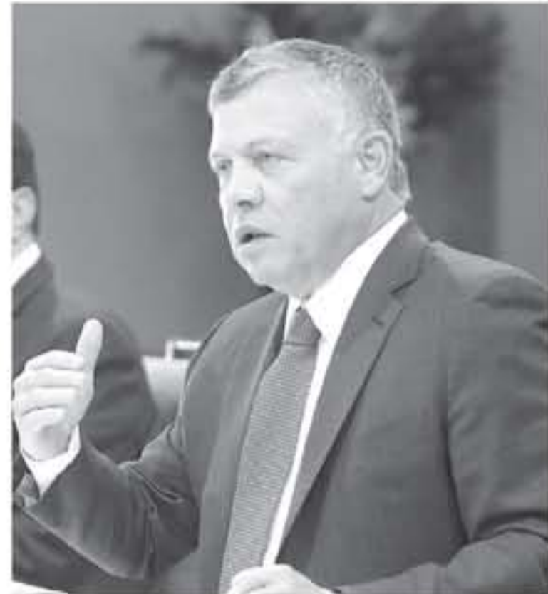
عمان - بتر

■ الإصلاحات المالية والاقتصادية يجب أن تعراي حماية ذوي الدخل المحدود ■ التأكيد على أهمية مواصلة التعاون بين الحكومة ومجلس النواب ■ يجب أن يكون هناك إصلاح واسع وجذري في مؤسسات القطاع العام