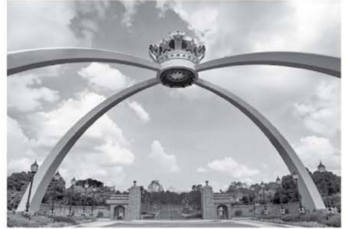
رصد جمالة خنجر

تقع مدينة جوهور باهرو في جنوب ماليزيا وهي عاصمة ولاية جوهور، ويعني اسمها "الجوهر الجديدة"، وذلك بفضل ما تنتج به من وافر من الأماكن السياحية الرائعة وفقرص التسوق المشوقة فضلا عن المشاع اللطيف ودرجات الحرارة المعتدلة، ما يجعل من جوهور باهرو وجهة سياحية جذابة لتسحق الزيارة