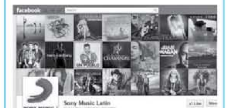
يوتيوب - رويترز

فالت شركة أبل أي تي. بي. أي. أنها وقعت اتفاقية مع شركة "فيسبوك" لتحميل وتبادل ملفات الموسيقى مع مستخدميها، وذلك في إطار اتفاقية شراكة مع شركة "سوني" و"ستيفن جوبز" الذي يستثمر في الشركة، وذلك في إطار اتفاقية شراكة مع شركة "سوني" و"ستيفن جوبز" الذي يستثمر في الشركة، وذلك في إطار اتفاقية شراكة مع شركة "سوني" و"ستيفن جوبز" الذي يستثمر في الشركة.