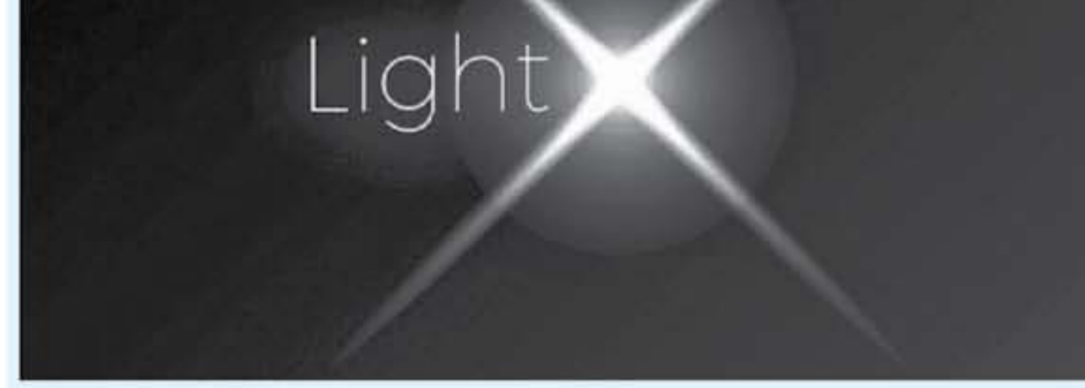
يوتيوب - رويترز

من منا لا يكره أن يتطلع فجأة هاتفك بعد أن تستلم بطاريته الموت، ولعل ما يزيد الحوف "عرجاً" أن تفرغ البطارية وأنت في طريقك لاجتماع عمل ضروري مثلاً، أو لقاء أصدقاء لم تحدد مكان موافقتهم بعد، إلى ما هنالك من مواقف سيئة قد تعرض لها جميعاً "هاتفك"!