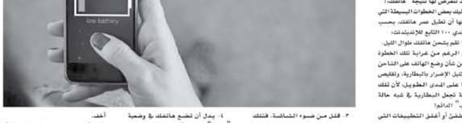
يوتيوب - رويترز

من منا لا يكره أن يتطلع فجأة هاتفك بعد أن تستلم بطاريته الموت، ولعل ما يزيد الحوف "عرجاً" أن تفرغ البطارية وأنت في طريقك لاجتماع عمل ضروري مثلاً، أو لقاء أصدقاء لم تحدد مكان موافقتهم بعد، إلى ما هنالك من مواقف سيئة قد تعرض لها جميعاً "هاتفك"!