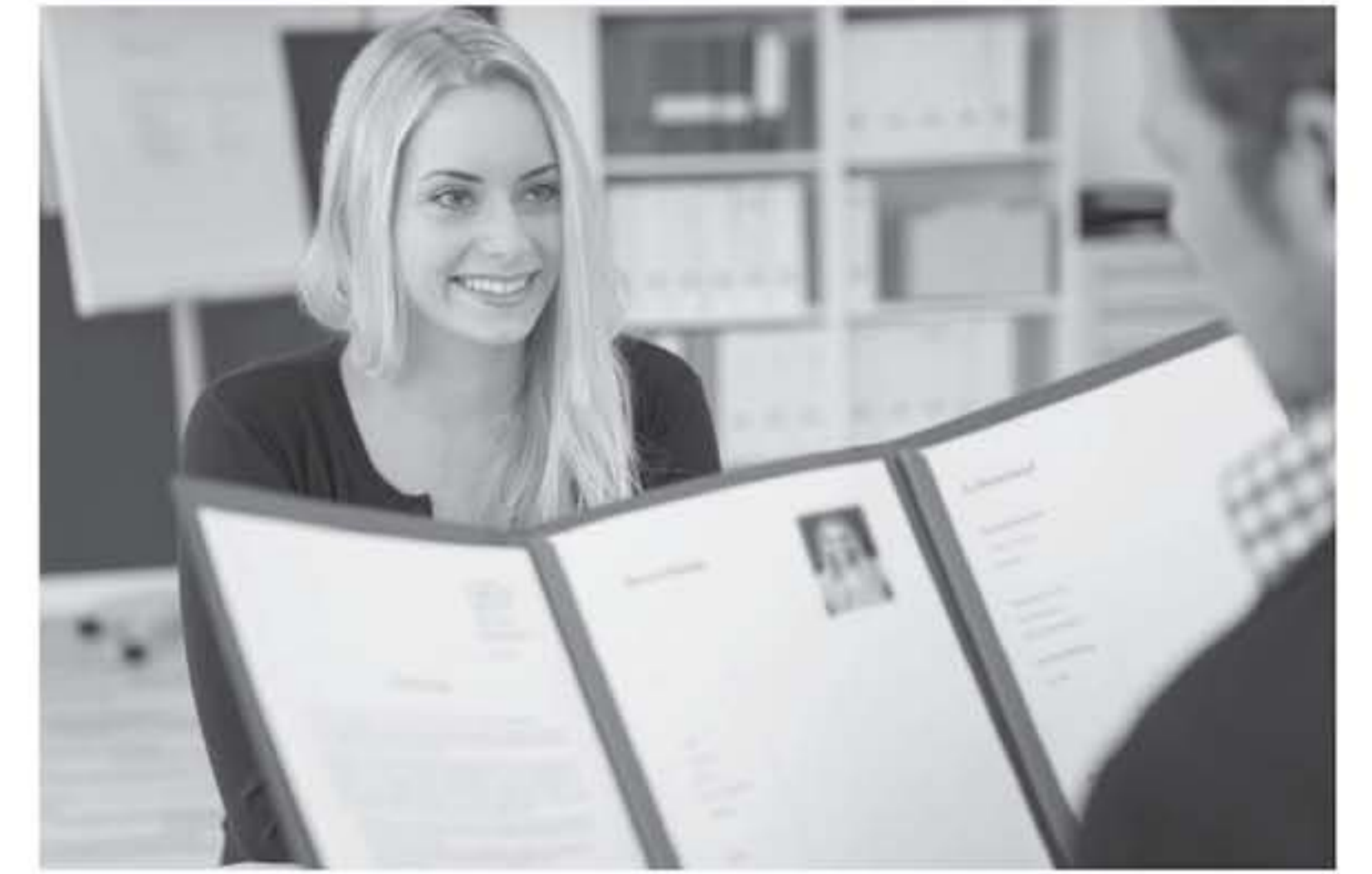
الأخبار إيان أبو شوك

تعد الصورة الذاتية الناجمة عن التحاق السري للوظيفة على الوظيفة التي لعنا حلت بها، ولذلك يحرض الكثير من الباحثين من عمل على توعية سيرهم الذاتية بالصفات التي تجذب الشركات لتعيينهم، لكن دراسة جديدة أظهرت أن