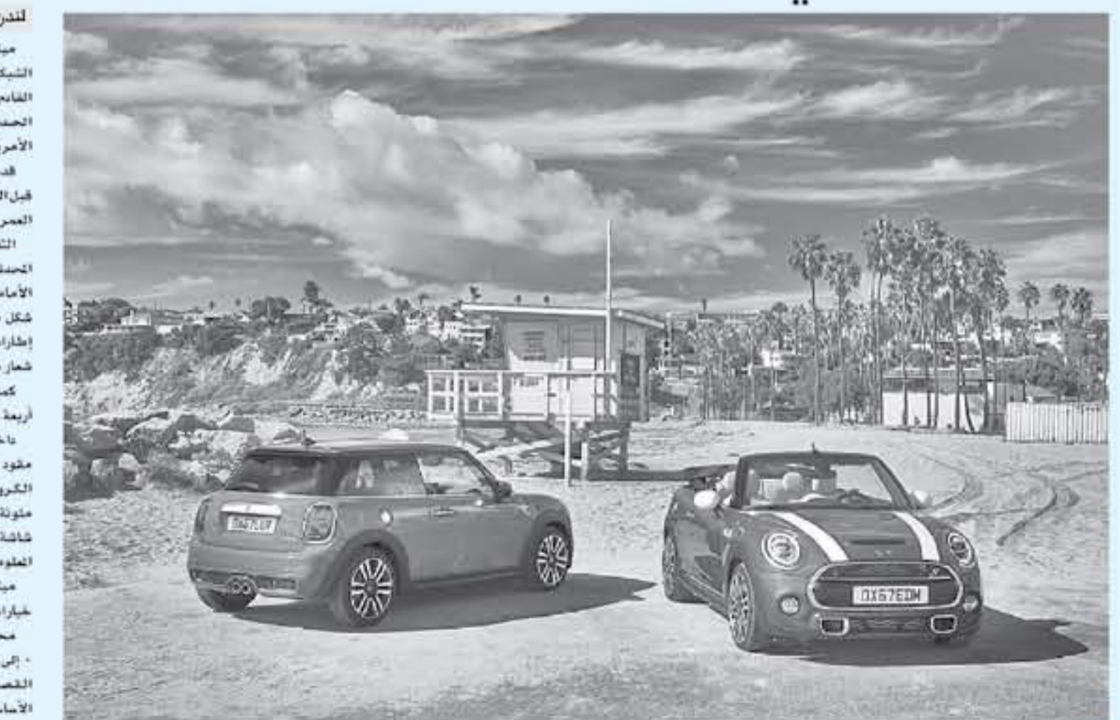
القائمة بسيزيد عن ٦٠٠ حسان

كما تشتهر أيضا جوهور باهرو بالرحلات البحرية، حيث تشتهر إلى قرية كوكوك الساحلية وبنده سمرات الواقعة على ضفاف النهر، فضلا عن إمكانية زيارة كل من منتزه إنساو ورومين الوطني وحديقة كونونغ ليمبانج الوطنية، حيث توفر مسارات السير بين المناظر الخلابة إلى الشلالات والغيابات في الأراضي المنخفضة والجمال والحياة البرية النادرة.