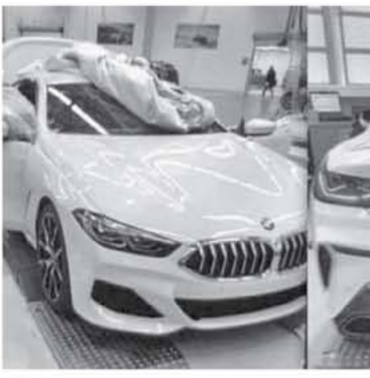
القائمة بسيزيد عن ٦٠٠ حسان

كما تشتهر أيضا جوهور باهرو بالرحلات البحرية، حيث تشتهر إلى قرية كوكوك الساحلية وبنده سمرات الواقعة على ضفاف النهر، فضلا عن إمكانية زيارة كل من منتزه إنساو ورومين الوطني وحديقة كونونغ ليمبانج الوطنية، حيث توفر مسارات السير بين المناظر الخلابة إلى الشلالات والغيابات في الأراضي المنخفضة والجمال والحياة البرية النادرة.