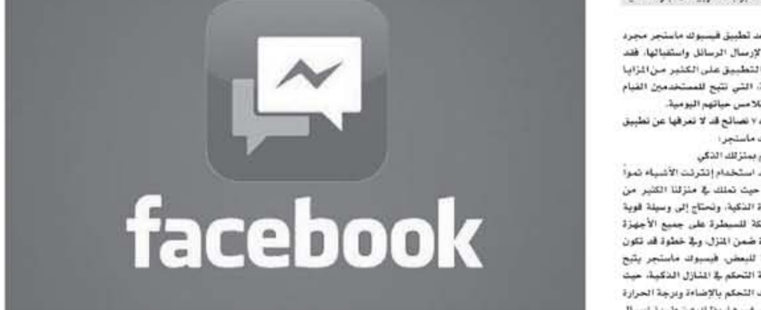
يوتيوب - رويترز

لم يعد تطبيق فيسبوك ماسنجر مجرد تطبيق لإرسال الرسائل واستقبالها، فقد حصل التطبيق على الكثير من المزايا المضافة، التي تلجج للمستخدمين القيام بأشياء تلامس حياتهم اليومية.