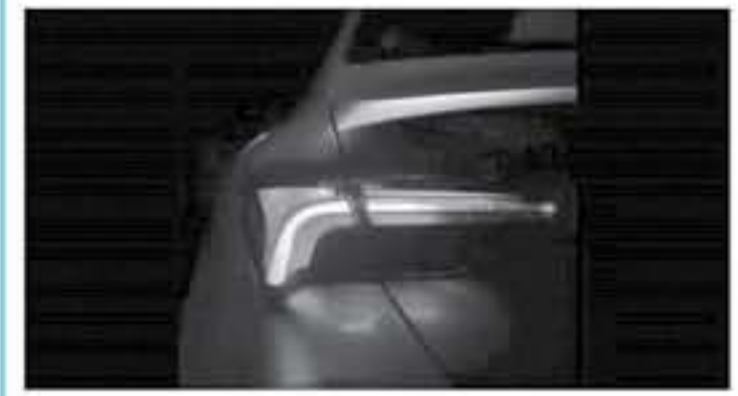
واشنطن - وكالات

كما ستظهر سيارة فورد فالتون القائمة أكبر هضمر من الميناسكيبية الخلفية من خلال تصميم لعنفا الحرك الذي سيحتوي على الحفالت، وستروو السيارة بمخرجين للادمم بشكل قياسي وأربعة مخرج للسخخ الرياضية. ويرجع أن تعتمد سيارة فورد فالتون ٢٠١٩ القائمة على محرك ٦ سلندر سعة ٣.٥ لتر بولف ٢٠١٥ حصان و ٣٦١ نيوتن.متر من عزم الدوران، كما ستوفر هذه السيارة القائمة بالتأكد بنسخة هجينة تعتمد على محرك ١ سلندر سعة ١.٤ لتر يعمل على البنزين يعمل إلى جانبه محرك كهربائي يولف للحركين معاً قوة لصل إلى ٢٨٠ حصان.