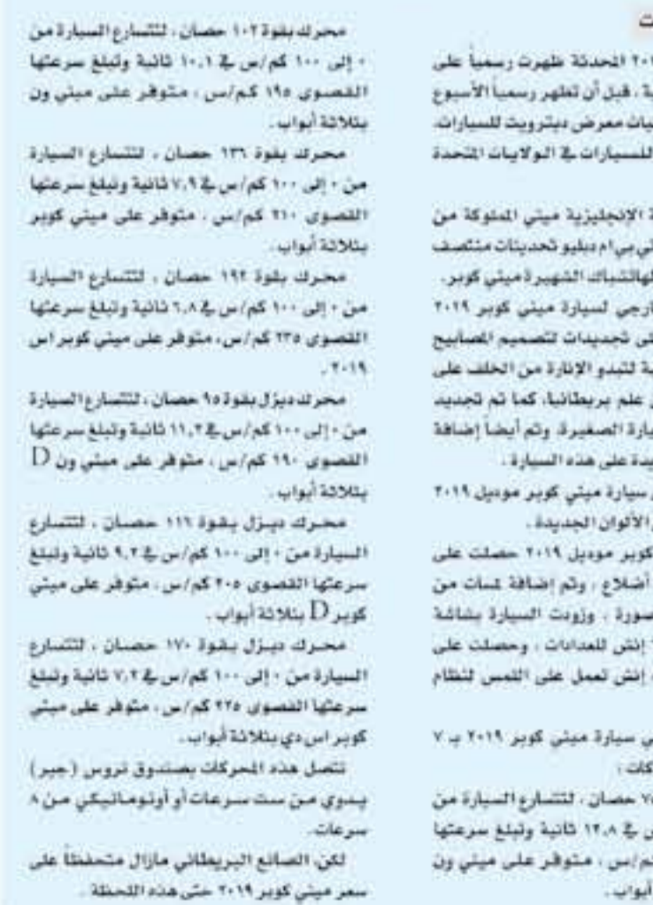
القائمة بسيزيد عن ٦٠٠ حسان

كما تشتهر أيضا جوهور باهرو بالرحلات البحرية، حيث تشتهر إلى قرية كوكوك الساحلية وبنده سمرات الواقعة على ضفاف النهر، فضلا عن إمكانية زيارة كل من منتزه إنساو ورومين الوطني وحديقة كونونغ ليمبانج الوطنية، حيث توفر مسارات السير بين المناظر الخلابة إلى الشلالات والغيابات في الأراضي المنخفضة والجمال والحياة البرية النادرة.