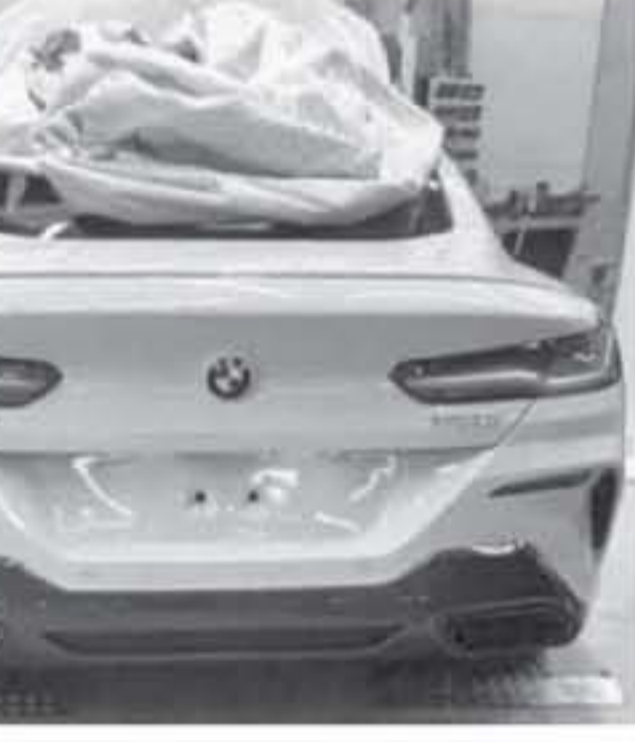
القائمة بسيزيد عن ٦٠٠ حسان

مستشعراً من نسختها الاختيارية مع وجود اختلافات معقولة لتبني جعلها سيارة سيستم صنعها لشخصين باستخدام مرسيدس اس كلاس كوبيو، ولكن يرجح أن مقصورة هذه السيارة القادمة ستختلف بتكامل عن السيارة الاختيارية.