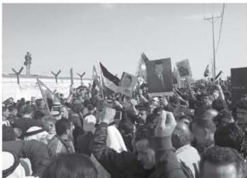
عنان - الأنباط

على اطفال جمعة ايتام النصر والذين في بادرة انسانية قامت مرتبات مديرية الامن العام بتوزيع العصير والساكر في بادرة انسانية قامت مرتبات مديرية الامن العام بتوزيع العصير والساكر