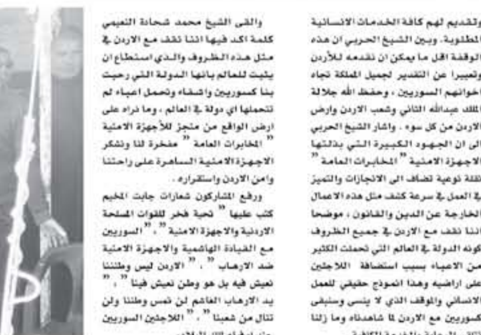
عنان - الأنباط

ضبط شخصين ومواد مخدرة جنوب عمان ضبط شخصين فيما لا ثالث لباربع بعد مطاردة مركبة ضبط داخلها ٢٠٠٠ حبة مخدرة وكفي حشيش جنوب عمان