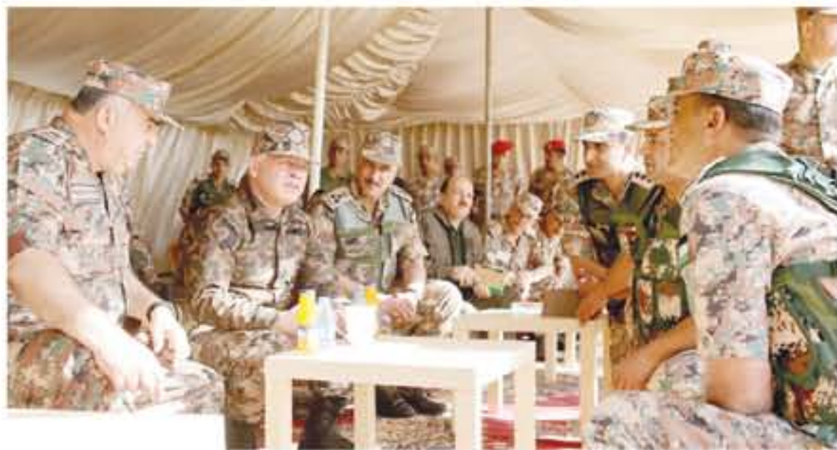
عمان - بترا

جلالته يفتتح مبنى لحرس الحدود مصمما بطرق هندسية جديدة