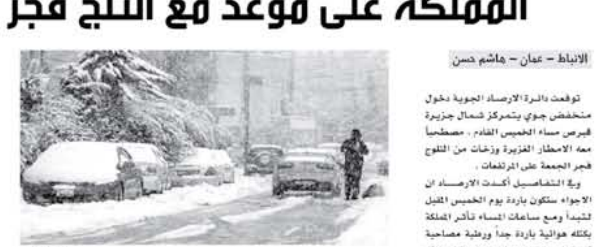
الأنباط - عمان - هاشم حسن