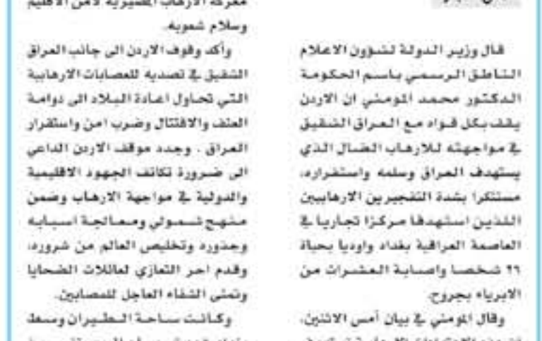
عمان - بترا