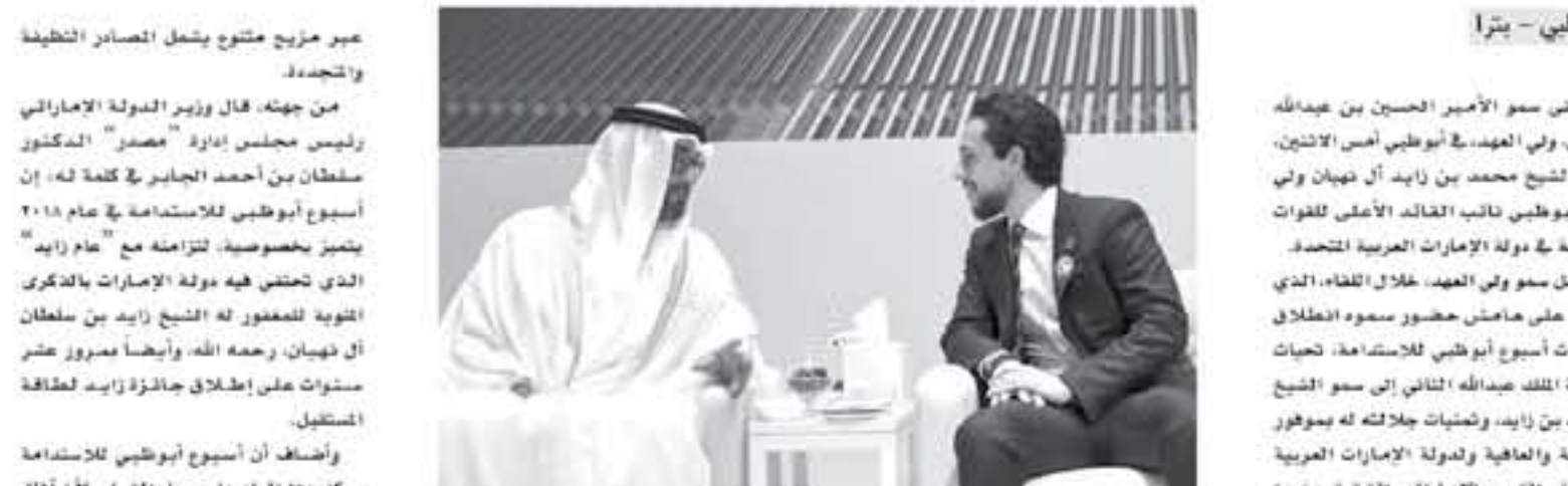
أبوظبي - بترا