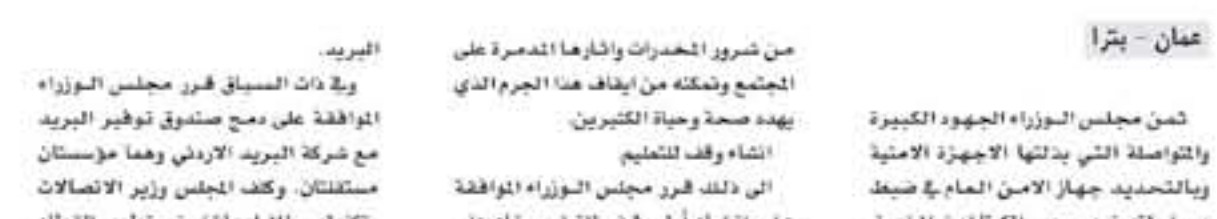
عمان - بترا