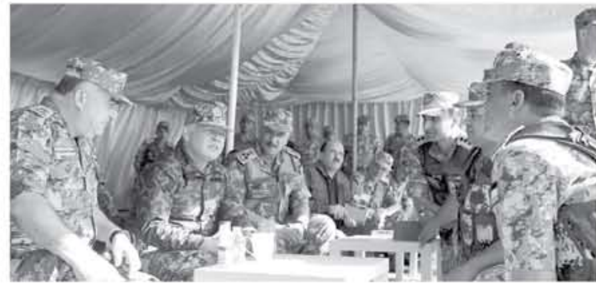
عمان - بترا