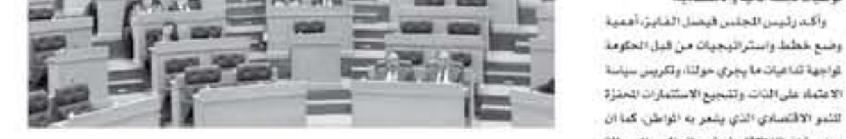
عمان - بترا