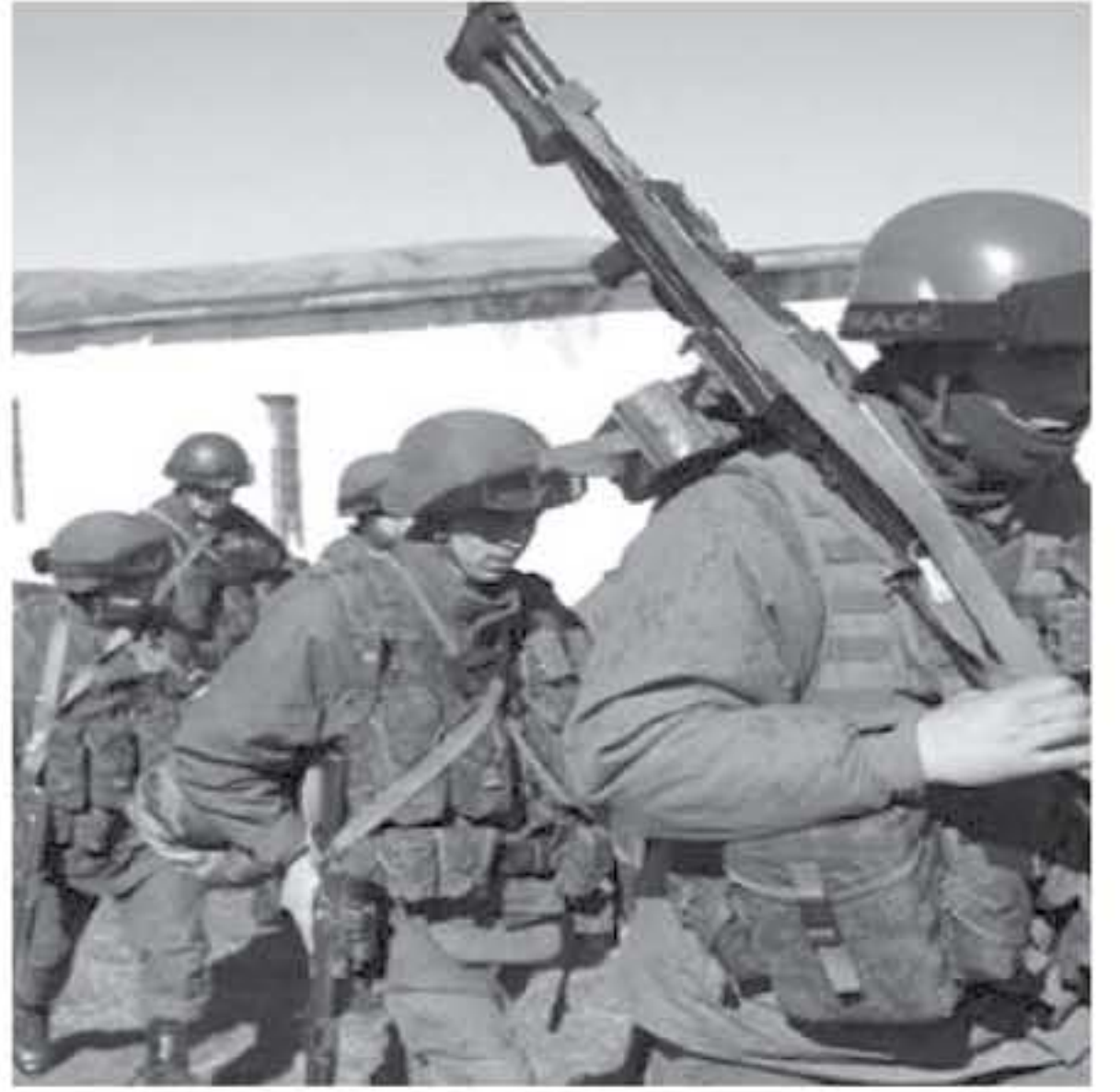
عناصر - وكالات - الأنباء - ياهو الميديا