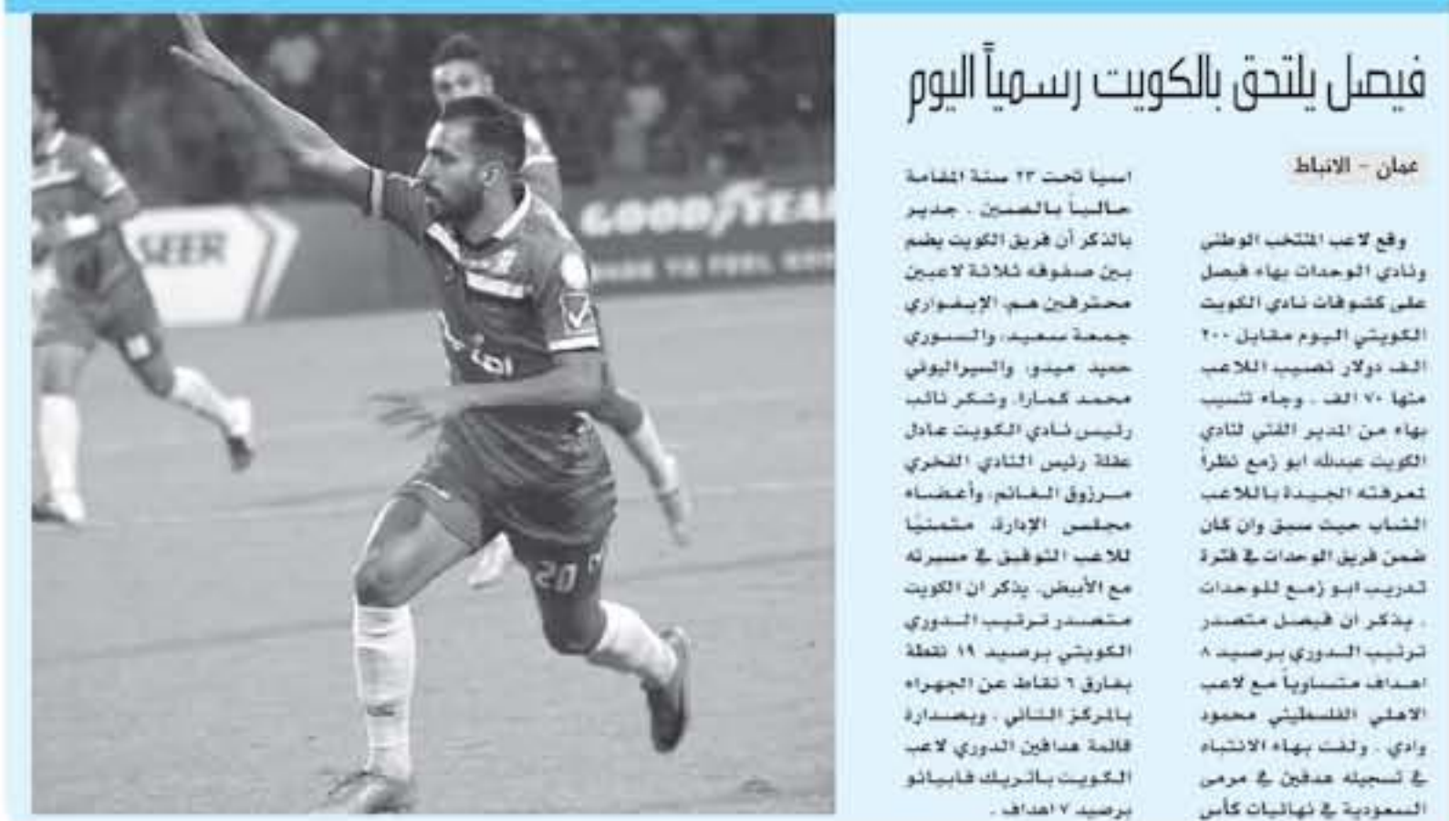
عنان - الأنباط

مختلف المحالات، ومنها جانب يشمل تشييد وتطوير وضع كرة القدم الآسيوية في الأردن، ويأتي المحسك من اللاعبين المحترفات والنشريات، أمام فريق من النمساوي الاوربي، ستلمسهم في تطوير المنتخب من جميع النواحي الفنية والفسيقية والبدنية، وهو ما نحتاجه في الرحلة المقبلة... ويقام المحسك ضمن الاتفاقية التمازج المشتركة الموقعة بين الاتحاد العربي لكرة وسطية الآسيوية الآسيوية للمحترفين "لا ليغا"، التي تهدف لتجديد النشريات في جنوب آسيا والمغرب وإقامتها في الهند.