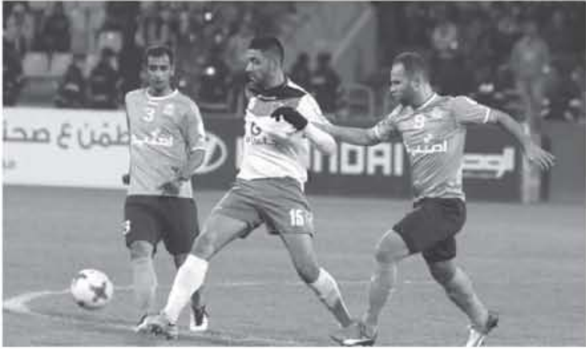
عنان - الأنباط

معرضي، كما وأبقى على الحترف ابو لاندى لوكاس والسفاني ومونيك مندو واصاف