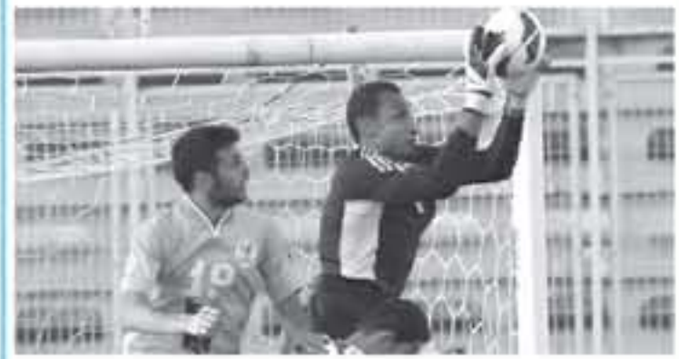
عنان - الأنباط

العقد بين الاتفاق والسعودي يتفعل بحسبة اللاعب باعتباره من مؤيدي السعودية والتصدير الرياض وهو ما يتعارض مع النخبة وتعليمات اتحاد الكرة السعودي... ولقت الحاربان إلى أنه لم يخسر شيئاً من هذه التجربة، مشيراً إلى أنه حصل على مدهم عقده، كما أن نادي الجزيرة الذي انتقل من خلاله عقدت بحسبة مالية وقعا ولي النص الكامل الذي نشره عبد الستار على صفحته الشخصية...!! السلام عليكم ورحمة الله... بناه على طلبه فسخ عقد الاحتراف بيني وبين نادي الاتفاق يطلب مني بالتراضي بينما وأكسر نادي الاتفاق ابرارنا ولاعين وصماهير على حسن التعامل والضيافة، ولم الاتفاق ويعوق إلى نادي الجزيرة وأحسن التوفيق والرضا من الله، دعواتكم لنا