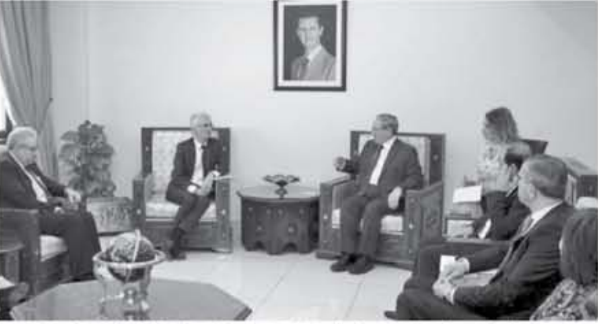
نائب وزير الخارجية السوري فيصل الحداه مع مساعد الامين العام للامم المتحدة للشؤون الانسانية والاغاثة مارك لوكوك في دمشق.

معلقة فعربين فإن ذلك سيثير عمدا عندياً من قبل الجيش التركي على سيادة اراضي" سوريا. ويأتي التحذير السوري بعد أيام من تصعد تركيا مواقفها وتهديدها على منطقة عربين التي يسيطر عليها الأكراد في شمال الجبلد، على خلفية تهديدات أسرة الايوبي. وقال المشاء في بيان لبلاد اسام الصحافيين في مبنى الوزارة في دمشق قلته وكالة الأنباء السورية الرسمية "سانا" قبله إلى ان قوات الدفاع الجوية السورية استعانت قواته الكاملة وهي جاهزة لتدمير الأهداف الجوية التركية في مساء الجمهورية العربية السورية". وأضاف "نحذر القيادة التركية أنه في حال الجابرة إلى بدء أعمال قتالية في منطقة غربين، ونحن على أهامة الأكراد متعلقة فغربين فإن ذلك سيثير عمدا عندياً من قبل الجيش التركي على سيادة اراضي" سوريا. ويأتي التحذير السوري بعد أيام من تصعد تركيا مواقفها وتهديدها على منطقة عربين التي يسيطر عليها الأكراد في شمال الجبلد، على خلفية تهديدات أسرة الايوبي. وقال المشاء في بيان لبلاد اسام الصحافيين في مبنى الوزارة في دمشق قلته وكالة الأنباء السورية الرسمية "سانا" قبله إلى ان قوات الدفاع الجوية السورية استعانت قواته الكاملة وهي جاهزة لتدمير الأهداف الجوية التركية في مساء الجمهورية العربية السورية". وأضاف "نحذر القيادة التركية أنه في حال الجابرة إلى بدء أعمال قتالية في منطقة غربين، ونحن على أهامة الأكراد