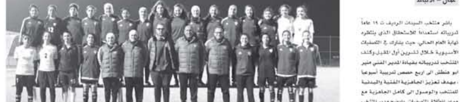
يشارك منتخب السيدات الريف... منتخبنا الريف للسيدات يبدأ الاعداد للتصفيات الاسيوية...