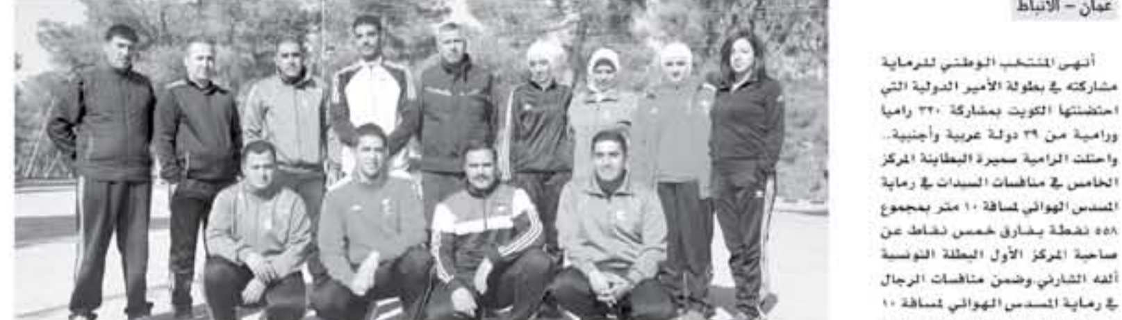
تمت مشاركة في بطولة الأمير... نتائج متواضعة لمنتخب الرماية في بطولة الأمير...