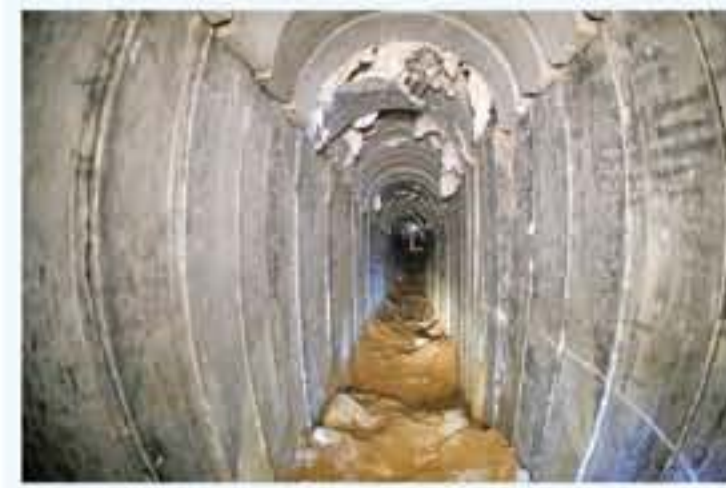
تunnel tunnel اسرائيل ان الجهاد الإسلامي حفرته من قطاع غزة

القدس المحتلة - صفا وكان الجيش اعلن قبل ايام تدمير نفق حفرته حركة المقاومة الإسلامية (حماس) التي تسيطر على قطاع غزة مستخدماً ضربات جوية ووسائل أخرى لتدمير النفق الذي يمتد من قطاع غزة إلى الأراضي الاسرائيلية ويمتد حتى مصر. وهذا النفق هو الثالث على الاقل الذي تدمره اسرائيل منذ نهاية تشرين الاول/اكتوبر. وبه نيسان/ابريل ٢٠١٦، أعلنت اسرائيل العثور على نفق يمتد من قطاع غزة إلى الأراضي الاسرائيلية للمرة الأولى بعد حرب غزة في العام ٢٠١٤. وتعبر النفق تحت الجدار الذي يعلق بإحكام الحدود الاسرائيلية مع قطاع غزة وكانت احد الاسلحة الأكثر فاعلية للتواصل الفلسطينية.