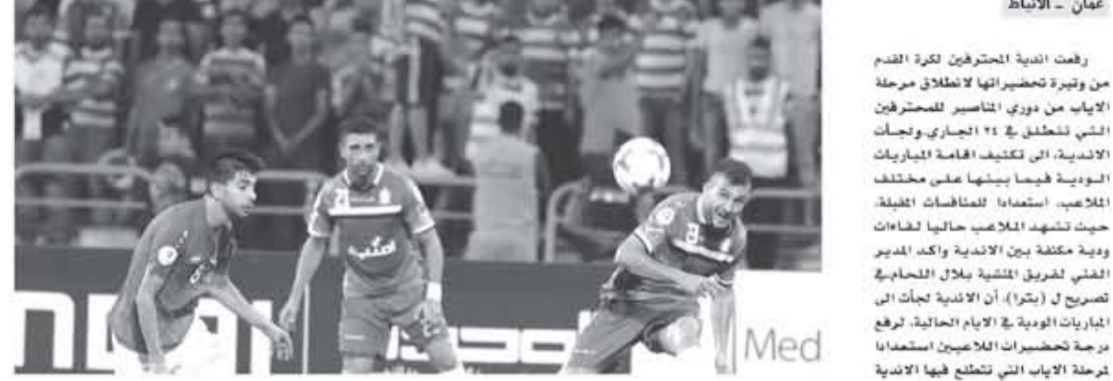
العديد من المشاكل من جهته... الفرق المحترفين تواصل الاعداد لمرحلة الالياب...