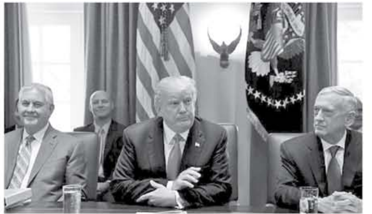
توماس - وكالات - أنباط - مايون العربي

فشل في إيماء أرضية مشتركة كافية. قال الرئيس الأمريكي باراك أوباما إن الشلل الجزئي الذي أصاب الإدارة الأمريكية لأول مرة منذ سبعة عشر عاما ليس نصفا للديمقراطيين الحكوميين الذين طاقا تعرضوا لضغوط البيئة السياسية وتعهده أوباما بالتفكير في التفاوض مع الكونغرس بخصوص استئناف أعمال الحكومة في أقرب وقت ممكن.