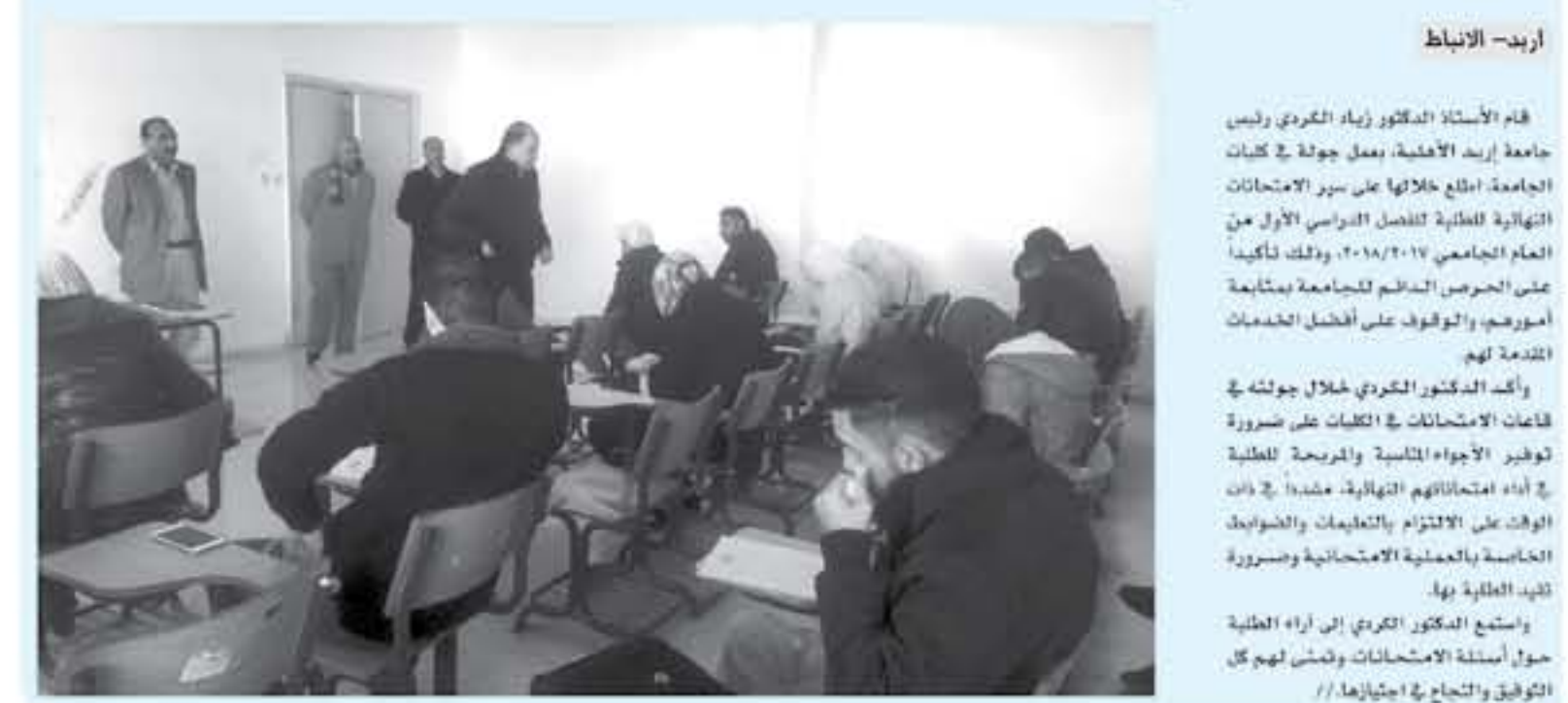
رئيس جامعة إربد الأهلية يتفقد الامتحانات النهائية