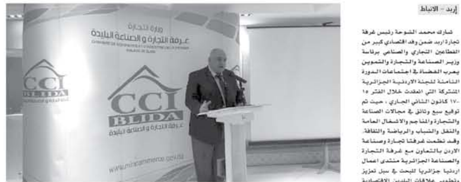
رئيس «تجارة إرد» يشارك في اجتماعات «الأردنية الجزائرية»