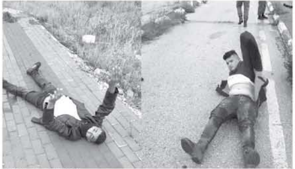
الفتيان المصابان برصاص الاحتلال