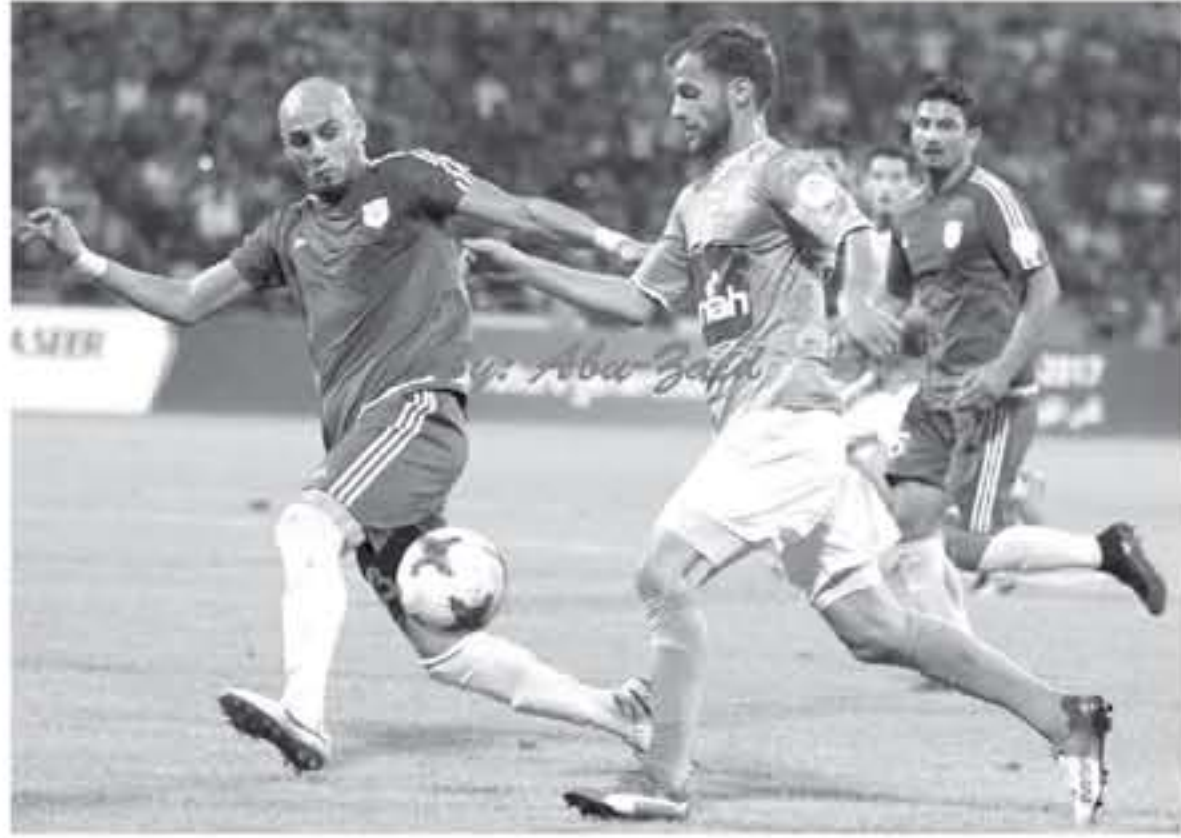
لاعبين فيصلي ويروك في مباراة افتتاح مرحلة الاياب لدوري المحترفين.