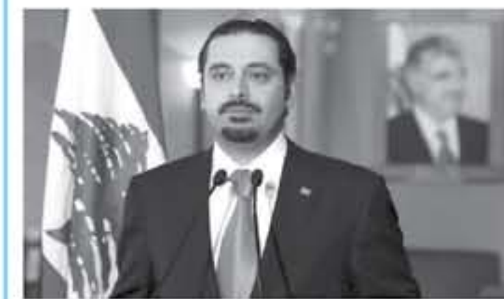
بيروت - رويترز