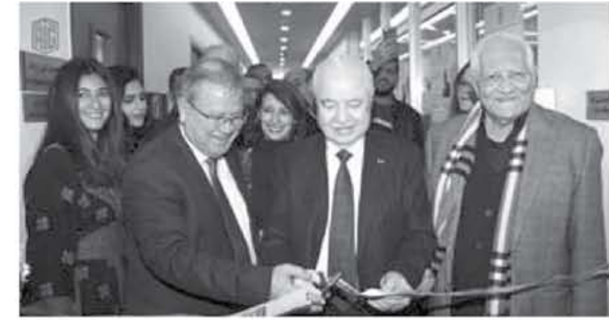
عمان - الأنباط