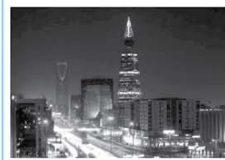
أبوظبي - سكاى نيوز