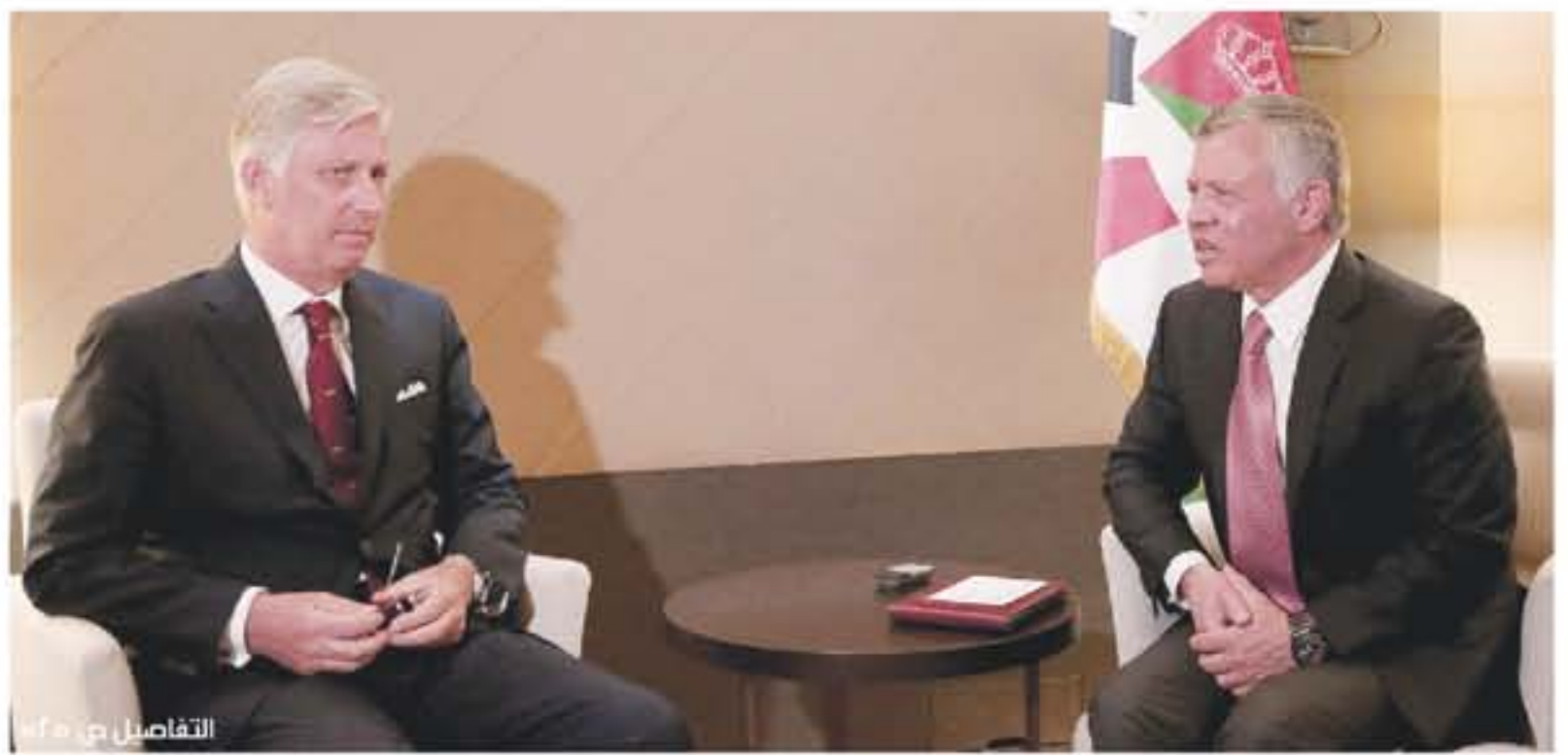
التفاصيل من ١٥

صناعة الاثاث الأردنية تحتضر عمان - بتر من دول الاتحاد الأوروبي وتركيا والصين ودول شرق آسيا ما الحق ضروا "فادحا" بالصناعة الوطنية. ويستمتعون ومصنعون اردنيون لثلاث حومهم خلال لقاء صحافي نظمته شرفة صناعة عمان بموقع مصنع شركة "جوايكو" التي تأسست قبل اكثر من اربعة عقود، مشيرين الى معاناتهم مع المنافسة غير العادلة التي تواجههم بالسوق المحلية وسط انخفاط الأسعار. ويبينوا ان استمرار افراق السوق المحلية بمنتهج الاثاث المستورد واهلها مكان الصناعة الوطنية قد يؤدي خلال سنوات وجيزة الى انخفاض اعداد المنشآت العاملة بالطعام الى النصف والافاق مصانع متبقية أصبحت مازكة مسجلة للاردين بالخارج. وقالوا ان صناعة الاثاث الأردنية تصعد اليوم بعمليات افراق عشوائية ومنافسة شديدة وغير عادلة جراء الاستيراد الكبير من الميضايع وبخاصة المنطقة.