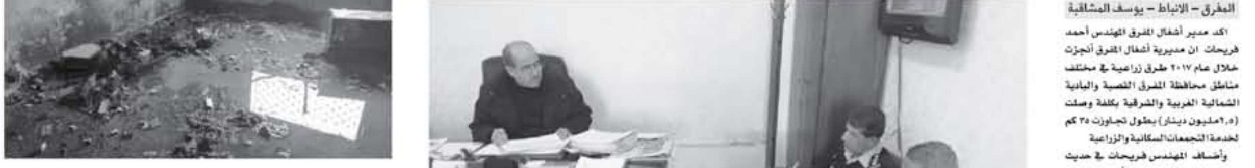
المفروق - الإنباط - يوسف المشاقبة

أسبب اوهلطين حالة الخناق أثر حريق في منزلهم المكان في المفرق سبب اشتعال صوبة الغاز إثر انقلابها مما أدى إلى اشتعال معظم محتويات المنزل... وأكد هنية أن "حسينا لن يستسلم أمام هذه القرارات، وقادر على الدفاع عن الأرض والقدس والحقوق..."