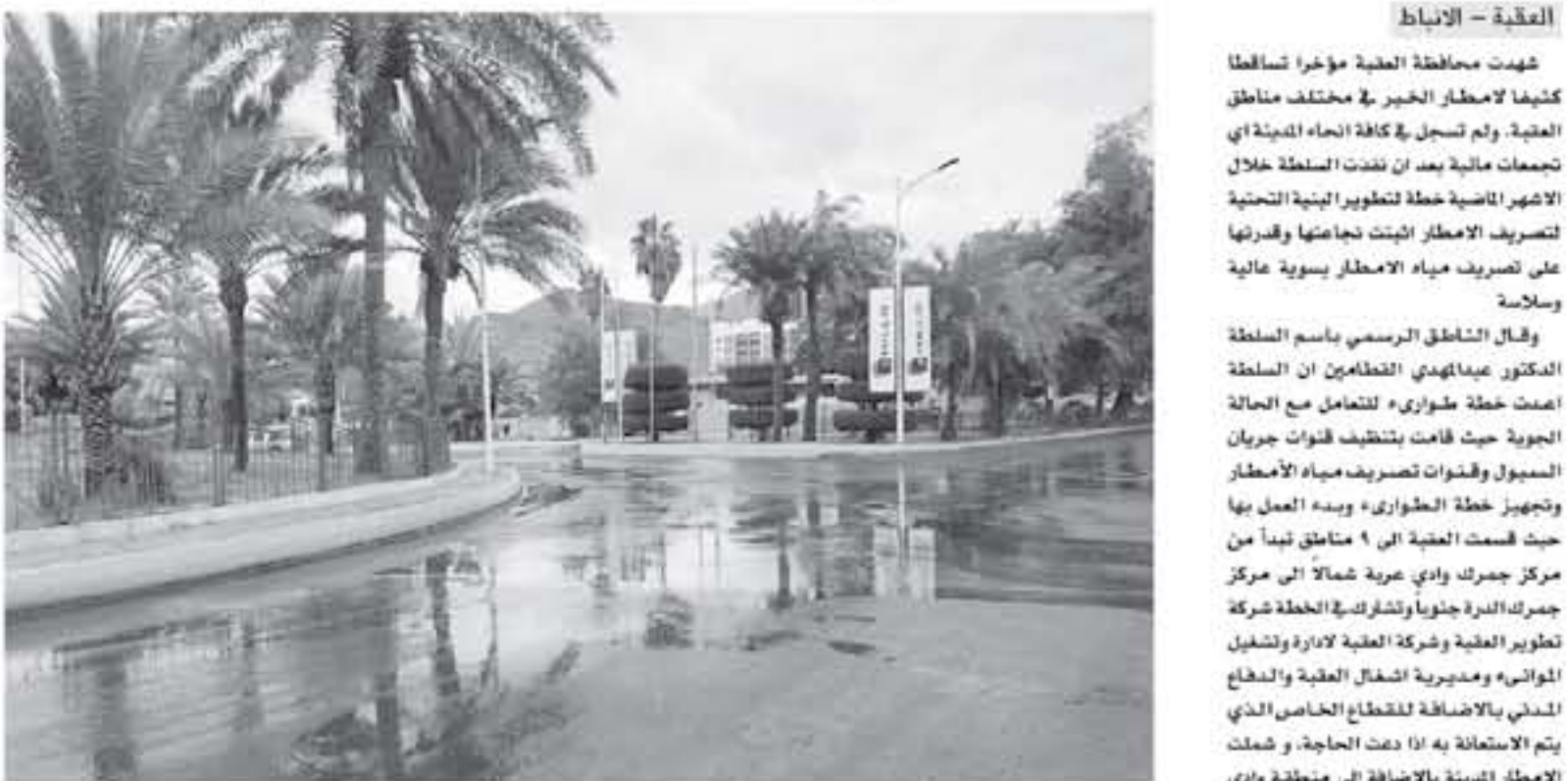
العقبة - الإنباط

شهدت محافظة العقبة الخير في مختلف مناطق العقبة، ولم تسجل في كافة أنحاء المدينة أي تسعجات مائية بعد ان نفذت السلطة خلال الايام الماضية خطة لتطوير البنية التحتية لتصريف الامطار التي تبناها وقدرتها على تصريف مياه الامطار بسوية عالية وسلاسة.