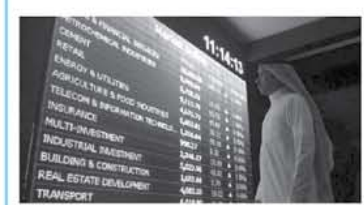
واشنطن - وكالات

كانت مستخدم بعض من هوار التجلة مع أنه لا يزال أمامها خياران للتصالح مع المحكمة التجارية في نيويورك ومن بعدها محكمة الاستئناف الفيدرالية في واشنطن. ويأتي القرار بالاستعداد هذه الأسبوع في مؤتمرات لاستئناف إعادة التفاوض حول اتفاقية التجارة الحرة لأميركا الشمالية (نافتا) بين كندا والولايات المتحدة. ولجنة التجارة الدولية في لجنة مستقلة مكونة حالياً من ضويفين جمهوريين وآخرين بمصالح تجارية. ومهمتها التحقيق مع الضرر الذي يصيب الصناعات الأميركية جراء استيراد سلع من دول أخرى.