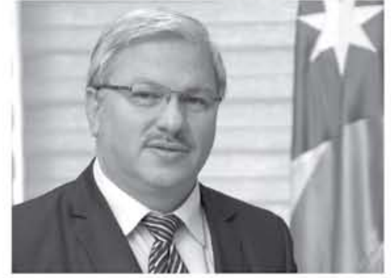
عنان - الأنباط

سجلت هيئة تنظيم قطاع الطاقة والمخاطر زيادة رخص الرخص الأساسية التي أصدرتها الهيئة العام الماضي للتعامل مع المخاطر الإشعاعية بنسبة ١٨ر٩ بالمائة مقارنة مع عام ٢٠١٦ بمجموع رخص يبلغ ٩٠٠ رخصة.