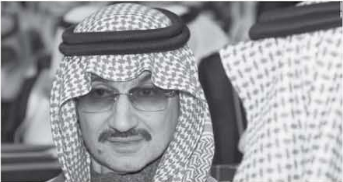
الامير السعودى الوليد بن طلال

عنه، حسباً الله مصدر مقرب من الحكومة، وقال المصدر الحكومي: «بال تأكيد، لا يوجد تسوية ولا تسبب مخالفت، ولا تمت التسويات إلا بالمرأه منهم بها وتوثيق ذلك خطياً وتعهده بعدم تكررها».