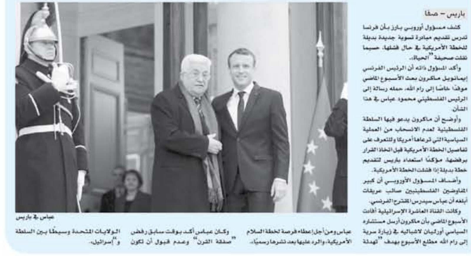
جياس في باريس

باريس - صفحا كشف مسؤول أوروبى بارز بأن فرنسا تدرس تقديم مبادرة تسوية جديدة بديلة للخطة الأمريكية في حال فشلت. حسبما نقلت صحيفة «الحياء».