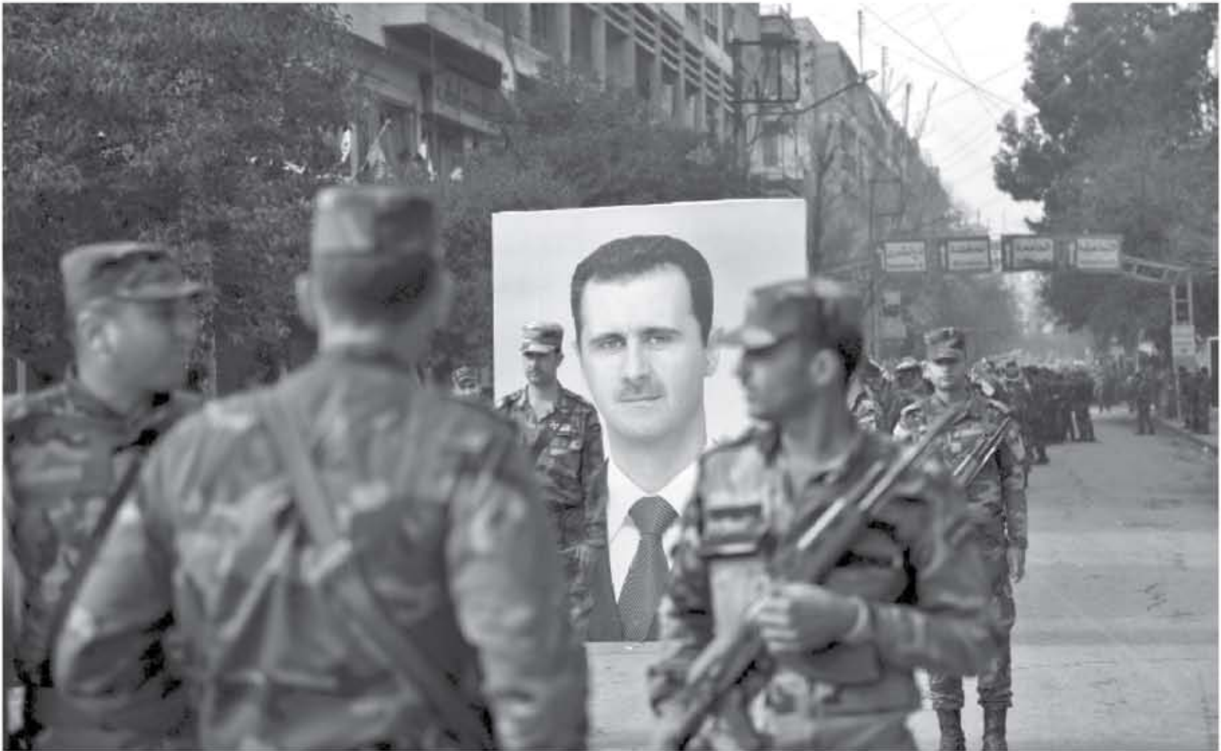
عفرين تفتتح شهية البحث عن