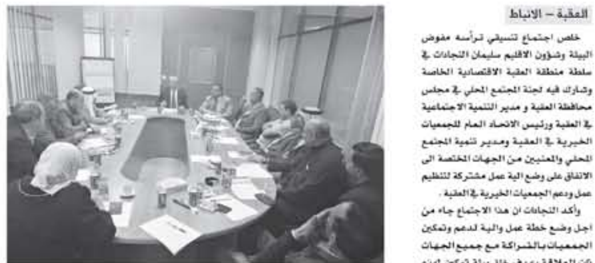
العقبة - الإنباط