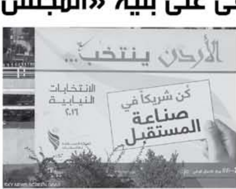
عمان - الأنباط

أحد مركز القدس للدراسات السياسية مؤخرًا دراسة تحليلية لأثر قانون الانتخاب الجديد لجسور النواب، حيث أظهرت الدراسة أن نسبة مجلس النواب الثامن عشر وأدائه بعد العام الأول على انتخابه، وستخصص الدراسة وفق أوسع نطاق من أثر مهم للثلاثين الجديد هي تركيبة مجلس النواب وأدائه، بعد أنه طوى صفحة نظام «الصوت الواحد».