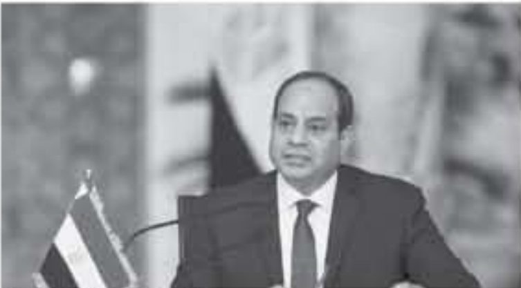
الرئيس المصري عبد الفتاح السيسي

القاهرة - أ ف ب في غياب أي مرشح قوي لواجهته تيمو الانتخابات الرئاسية في مصر، في ٢٦ آذار/ مارس المقبل. اجراء شكليا لعبد الفتاح السيسي الذي يحكم البلاد منذ من حديد بعد سبع سنوات من الثورة على حسني مبارك. وقبل الملاق باب الترشح للانتخابات الرئاسية ١١٠٠٠ (١٢٠٠٠ ت غ) الاثني تيمو رئيس حزب الوفد الجديد عبر مطار بيروت إلى قطر، كخطة إلى دولة موسى مصطفى موسى المعروف بمواقفه المؤيدة للسيسي بأوراق ترشحه إلى الهيئة الوطنية العليا للانتخابات. وقد أعلن وزير ترشح موسى فان قيمته السياسية الانتخابية، كما أن السيسي حاضر صفه الرشح الوحيد بعد أربع سنوات من فوزه بالولاية الأولى لترشحه التي حددت سره في ٢٠١٤ من الأصوات عام ٢٠١٤. وقبل أن يصبح رئيساً، أطلع السيسي بينما كان قائدا للجيش الرئيس الاسلامي محمد مرسي في العام ٢٠١٣ آخر لقاءات جمهورية كبرى طالب برحيله. وعند تولي السلطة ألقى السيسي كالمسيح كان العدو قد أفرق في الانتخابات الجارية من ضابطين وعصيان. فقط في مختلف المدن المصرية كنوع من النسخة الانتقالية، كما أن السيسي حاضر صفه الرشح الوحيد بعد أربع سنوات من فوزه بالولاية الأولى لترشحه التي حددت سره في ٢٠١٤ من الأصوات عام ٢٠١٤. وقبل أن يصبح رئيساً، أطلع السيسي بينما كان قائدا للجيش الرئيس الاسلامي محمد مرسي في العام ٢٠١٣ آخر لقاءات جمهورية كبرى طالب برحيله. وعند تولي السلطة ألقى السيسي كالمسيح كان العدو قد أفرق في الانتخابات الجارية من ضابطين وعصيان.