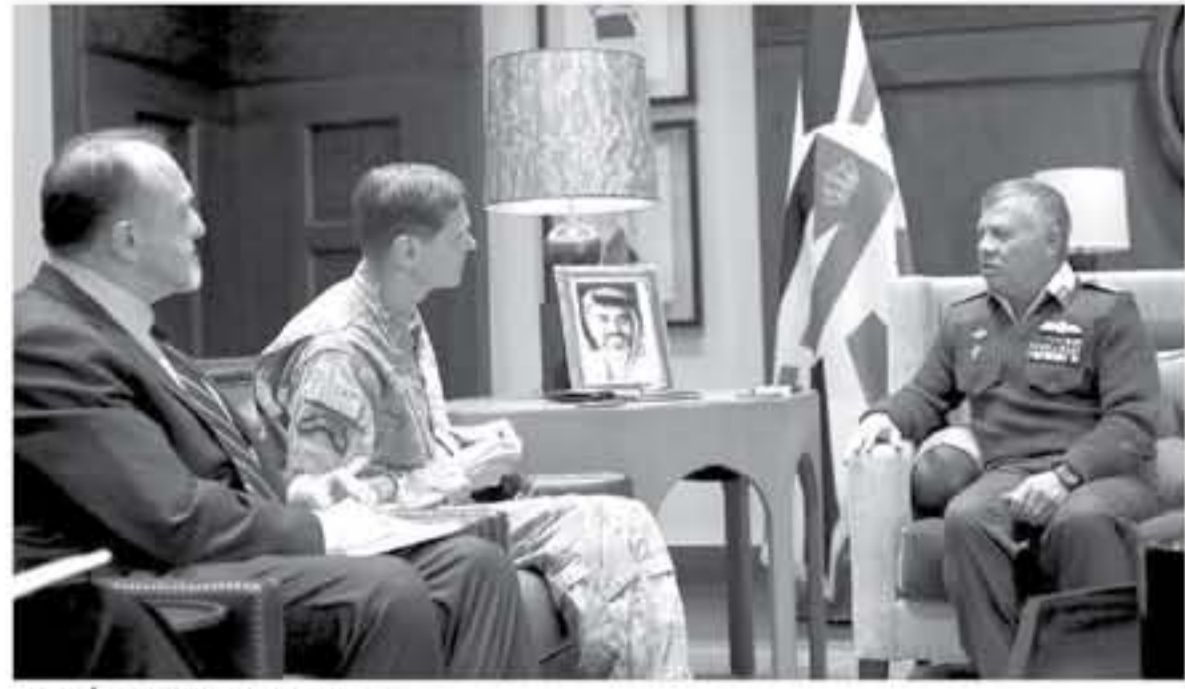
الملك يستقبل قائد القيادة المركزية الأمريكية