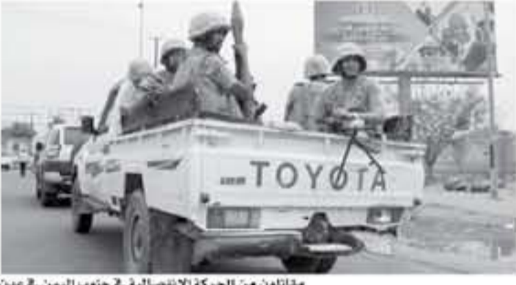
مقاتلون من الحركة الانفصالية في جنوب اليمن في عدن

عدن - أ ف ب اشتدت حدة المعارك في مدينة عدن لليوم الثاني من هجوم القوات الموالية للانفصاليين الحوثيين والقوات الحكومية معارك جديدة سقط فيها تسعة قتلى، وذلك في أعقاب هجوم مسلح من قبل الحوثيين على القوات الحكومية في مدينة عدن. وقال وزير الدفاع العسكري في عدن اللواء/بصيمر حبس أحمد فتعود وهو ضابط في الجيش اليمني أعلن زعمه على خوض العمليات الرئاسية، تمت سنوات بعد اتهامه بالانحياز و«مقتضيات النظام العسكري»، وعت خصم شخصيات مصرية الأحد إلى مقاطعة الانتخابات الرئاسية المقررة في آذار/مارس ٢٠١٨ متهمين السيسي ب«مغ أي منافسة تزيه». اشتدت حدة المعارك في مدينة عدن لليوم الثاني من هجوم القوات الموالية للانفصاليين الحوثيين والقوات الحكومية معارك جديدة سقط فيها تسعة قتلى، وذلك في أعقاب هجوم مسلح من قبل الحوثيين على القوات الحكومية في مدينة عدن. وقال وزير الدفاع العسكري في عدن اللواء/بصيمر حبس أحمد فتعود وهو ضابط في الجيش اليمني أعلن زعمه على خوض العمليات الرئاسية، تمت سنوات بعد اتهامه بالانحياز و«مقتضيات النظام العسكري»، وعت خصم شخصيات مصرية الأحد إلى مقاطعة الانتخابات الرئاسية المقررة في آذار/مارس ٢٠١٨ متهمين السيسي ب«مغ أي منافسة تزيه».