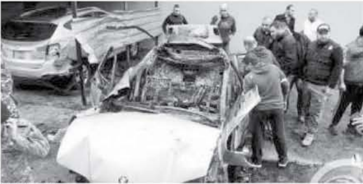
السيارة بعد لتجربها

سويت تنفيذ العملية. وقد غادر المشتبه الثاني ويدي «محمد ب» الذي تشير التحقيقات فرع المعلومات إلى أنه عميل التريسي في هذه العملية. فهو تولى المراقبة اليومية لعمدات وعمدات المحققين فإنه تولى مراقبة إسرائيلية بهدف معرفة وتيرة وتصرف عمداً وقاصوته