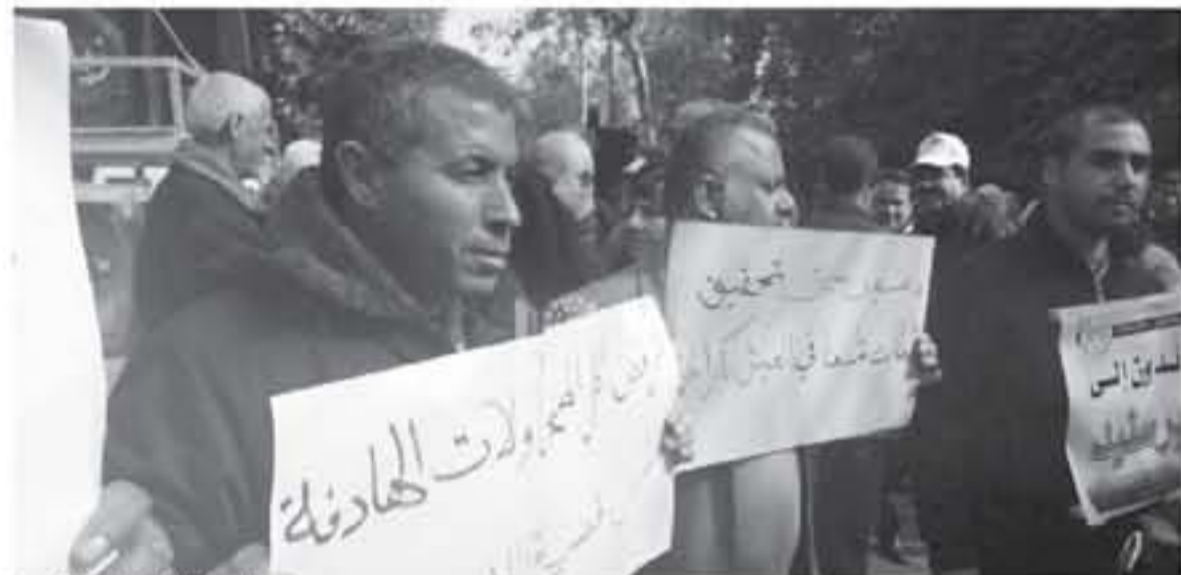
جانب من المشاركين في المظاهرة

أضاف «أمنكم أنتم تتصرفون والغضب الشديد، لكن رسالتنا للأمم المتحدة ليست بالكلية بل بالحيمة والقوة للولايات المتحدة الأمريكية كنتم فركنا مليونين تسدتمونا وتخصيص المساعدات والتبرعات الترموية للولايات المتحدة الأمريكية، هو القاسم خطي يهدد استمرارية تقديم الخدمات الرئيسية من صحة وتعليم ودعميات اجتماعية. وهذه المسائل على شروط أن تبقى وكالات الغوث الدولية بعيدة من أي ابتزازات سياسية، لأن تحويلها هو تعهد أممي وواجب أخلاقي لغاية الوصول لحل نهائي ولن نضيق ولن نكفم كافة طرق مقاومتنا» وأوضح أن موظفي الأونروا باتوا قلقين من فقدان الأمان الوظيفي وعدم الوضوح في مستقبلهم، مما يحتم على الجميع أن يساهم بدم وكالات الغوث لتقديم خدماتها للأونروا