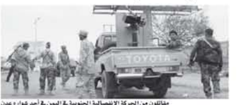
مقاتلون من الحركة الانفصالية الجنوبية في اليمن في أحد شوارع عدن