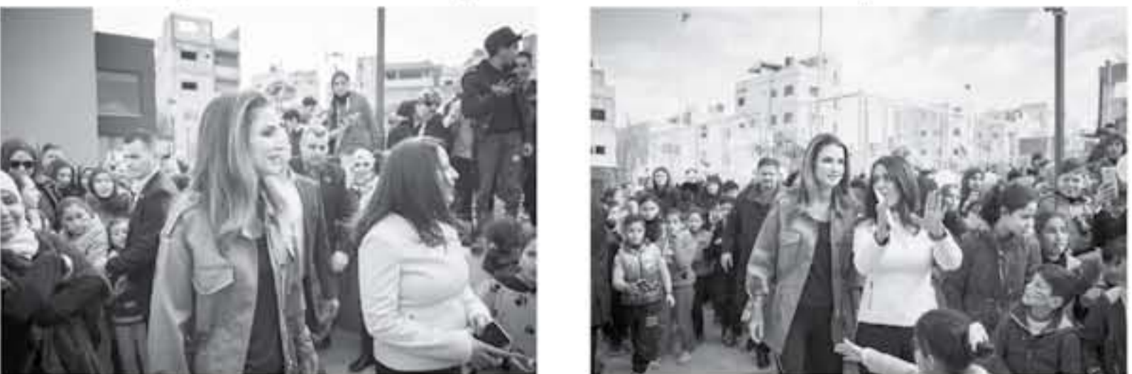
عنان - الأنباط