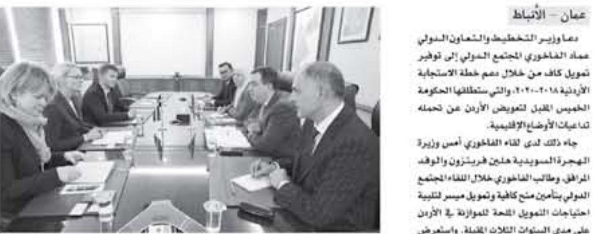
عنان - الأنباط