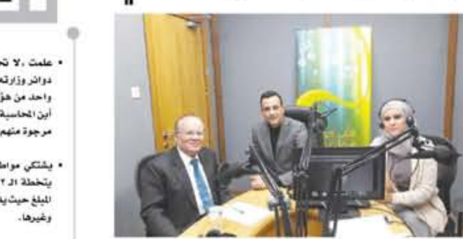
من تطور للعملية التعليمية والتربوية والاصلاح السياسي والاقتصادي. كما تم الحديث من خلال لقاءات مباشرة أو الفصائل هادفة حول الاوراق الناشئة لجلالة الملك عبدالله الثاني وما لها من ابعاد اإصلاحية فكرية وسياسية واقتصادية واجتماعية.