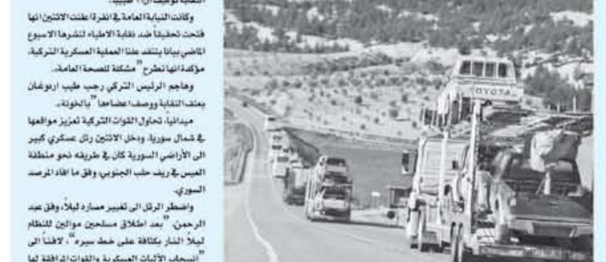
رجال عسكري يرافق مقاتلي سوريا مؤمنين تركيا في كبريس على مسيرة من الحدود السورية خلال توجيههم الى عفرين في سوريا