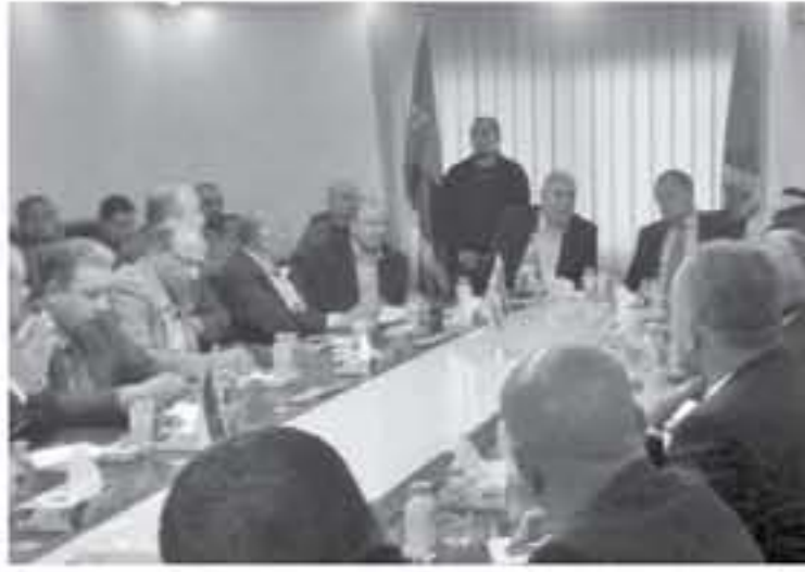
المفرق - الأنباط

سجلت منطقة المفرق منذ تأسيسها في محافظة المفرق ارتفاعاً في حجم الاستثمارات المحلية خلال العام الماضي بإجمالي ١٧ مشروعاً استثمارياً بقيمة إجمالية بلغت ٢٢٠٠ مليون دينار، مما يعكس ارتفاعاً في حجم الاستثمارات في المناطق التنموية بالمفرق. أكدت السيدة مديرة مديرية الأمراض الصدرية والوقاية من أمراض الجهاز التنفسي والمخاطية التي تعقدت على هامش الاجتماع التنووي للمناطق التنموية، إن حجم الاستثمارات في مناطق التنموية بالمفرق ارتفع بشكل ملحوظ خلال العام الماضي، حيث سجلت ١٧ مشروعاً استثمارياً بقيمة إجمالية بلغت ٢٢٠٠ مليون دينار، مما يعكس ارتفاعاً في حجم الاستثمارات في المناطق التنموية بالمفرق. وأشارت إلى أن هذا النمو جاء نتيجة لسياسة الاستثمار العام والخاص وتطوير البنية التحتية في مناطق التنموية، مما جعلها أكثر جاذبية للمستثمرين المحليين والأجانب. وأضافت مديرة المديرية أن ارتفاع حجم الاستثمارات في مناطق التنموية بالمفرق جاء نتيجة لسياسة الاستثمار العام والخاص وتطوير البنية التحتية في مناطق التنموية، مما جعلها أكثر جاذبية للمستثمرين المحليين والأجانب.