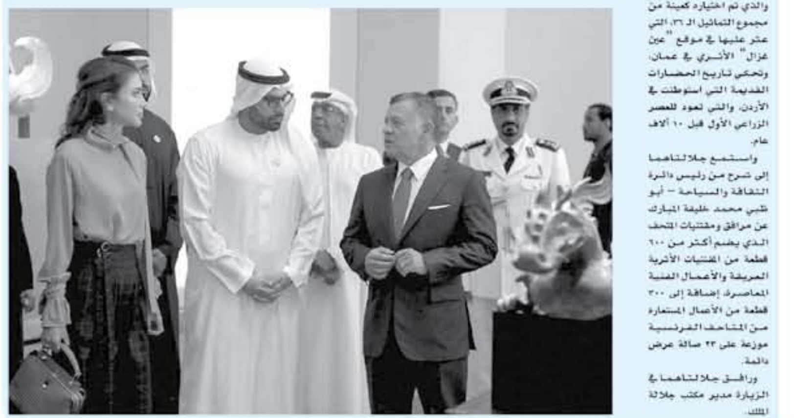
أبو ظبي - بنيرا

زار جلالته الملك عبدالله الثاني وجمالته الملكة علياء الحسين، متحف اللوفر أبوظبي، الذي يسلف الضوء على تاريخ الإبداع الفني للإنسان، ويسيرز أروعها الخرافات والفن المشترك، الحضارات والتقاليد، وتحتل جلا شامها، في عدد من قاعات المتحف، الذي يعد أول متحف عالمي في العالم العربي، وأول متحف عالمي على الامتداد والسطح الفنية المعروضة التي تعود إلى عهد ما قبل التاريخ، وصولا إلى اصنام العاصرة العدمية التي استوطنت في ومن بين المعروضات أحد تماثيل " عين عزال" الأثرية البالغة في القدم والذي تم اكتشافه كمين من مجموع التماثيل الـ ٣٦ التي عثر عليها في موقع " عين عزال" الأثري في عمان، وتحتل تاريخ الحضارات القديمة التي استوطنت في الأردن، والتي تعود للمصر الزراعي الأول قبل ١٠ آلاف عام. واستمتع جلالتهما إلى شرح من رئيس - أبو الثقافة والسياسة - طيب محمد خليفة المبرك الذي يقدم أكثر من ٦٠٠ قطعة من مقتنيات الأثرية العريقة والأصنام العدمية المعاصرة إضافة إلى ٣٠٠ قطعة من الأضال المتعارة من المتاحف الفرنسية موزعة على ٣٤ صالة عرض دائمة. ورافق جلا شامها في الزيارة مدير مكتب جلالته الملك.