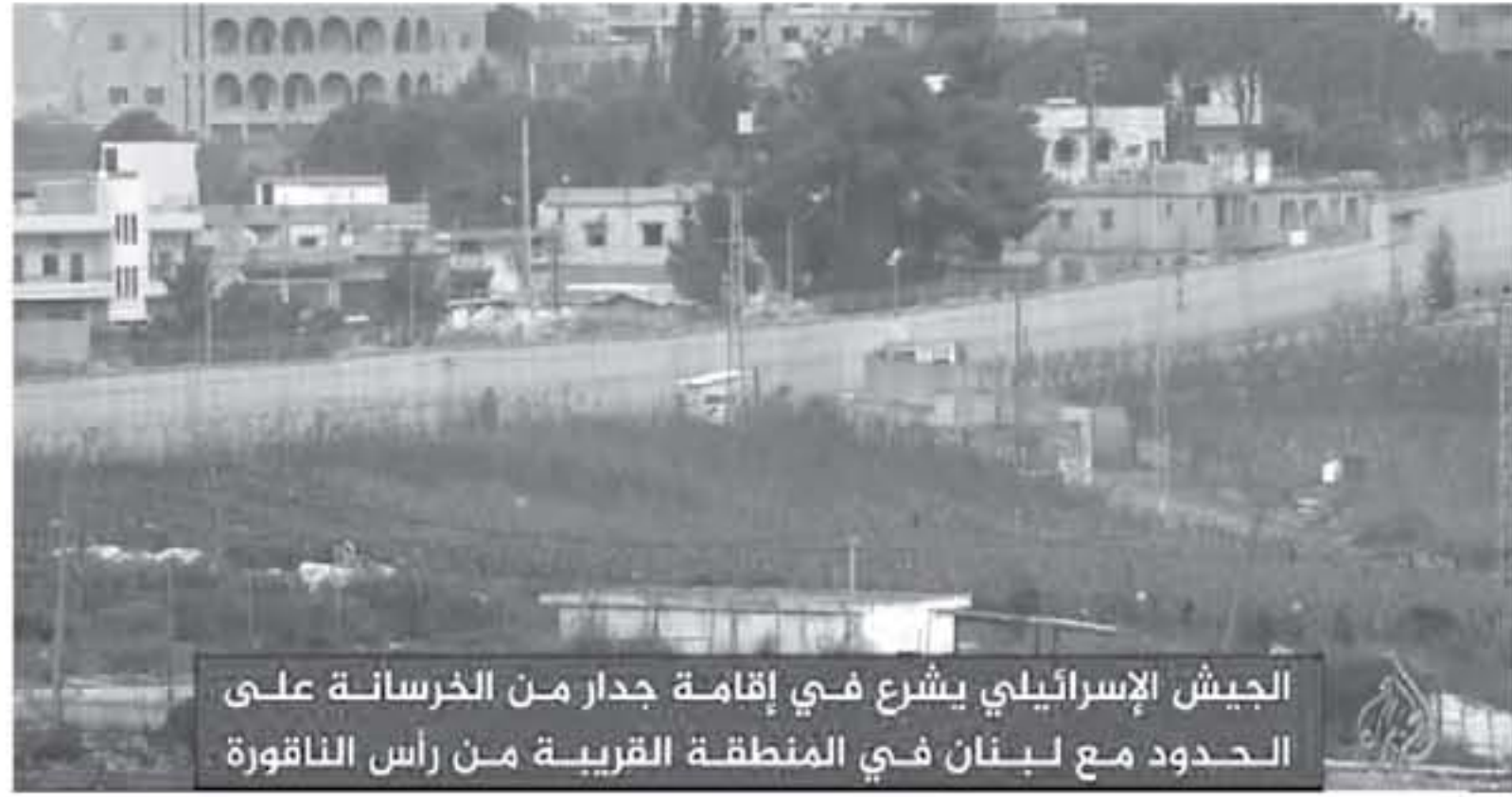
الجيش الإسرائيلي يشرع في إقامة جدار من الخرسانة على سبيل مع لبنان في المنطقة القريبة من رأس الناقورة

القدس المحتلة - وكالات باشرت إسرائيل بناء جدار إسرائيلي على حدود لبنان الذي ستر من أنه سيتم إقامته داخل أراضيها، وذلك وسط مخاوف من مواجهة عسكرية إذا وقع التمرد على حدود لبنان البرية والبحرية. وقال مراسل الجزيرة إيهاس كرام إن إسرائيل شرعت في إقامة الجدار بالفطاح الغربي من الحدود وتحديدًا قرب منطقة رأس الناقورة. وأضاف أنه سيتم من بلدة حانينا في القطاع الأوسط من الحدود باتجاه البحر المتوسط في المرحلة الأولى، وفي مرحلة ثانية بين بلدتي مسافح عام والقطنة. وتابع أن مبرر إسرائيل المعلن لبناء الجدار الإسرائيلي هو منع حزب الله من احتلال البعثات الإسرائيلية الحدودية أو أسر جنوده فيها في حال مواجهة جديدة بين الطرفين، وأشار إلى أن الجيش الإسرائيلي يتحدث عن أي تهديدات للحدود في البحر المتوسط من أي صواريخ مضادة للدروع قد تستهدف الجدار الإسرائيلي، وأضاف أن إسرائيل تحارب من مراقبة الترسات العسكرية ونقل مرسلات الجزيرة من مصادر إسرائيلية أن الجدار الإسرائيلي سيمنع