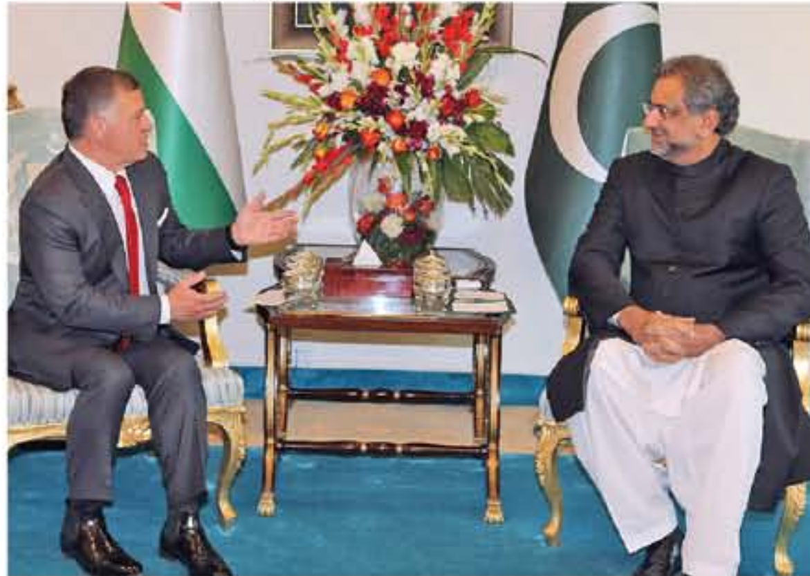
إسلام آباد - بئرا

بعد جلالة الملك عبدالله الثاني، في إسلام آباد، أمس الخميس، مباحثات مع رئيس الوزراء الباكستاني شاهر خان، ركزت على العلاقات بين البلدين، والتطورات الإقليمية والعالمية. وخلال مباحثات ثنائية، تبعتها موسعة جرت بحضور كبار المسؤولين في البلدين، جرى استعراض اليات النهوض بمستويات التعاون الثنائي في المجالات السياسية والاقتصادية والتجارية والعسكرية والأمنية والثقافية. وتم التأكيد، خلال المباحثات، التي عقدت في مقر إقامة رئيس الوزراء الباكستاني، على عمق العلاقات التاريخية التي تجمع بين الأردن وباكستان، وضرورة الاستفادة من الفرص المتاحة لتعزيز التعاون الاقتصادي وزيادة التبادل التجاري بينهما، خصوصاً في قطعي التعدين والأسمنت. كما جرى بحث فرص الاستفادة من موقع الأردن الاستراتيجي كجوابية للأسواق في الولايات المتحدة وأوروبا وأفريقيا.