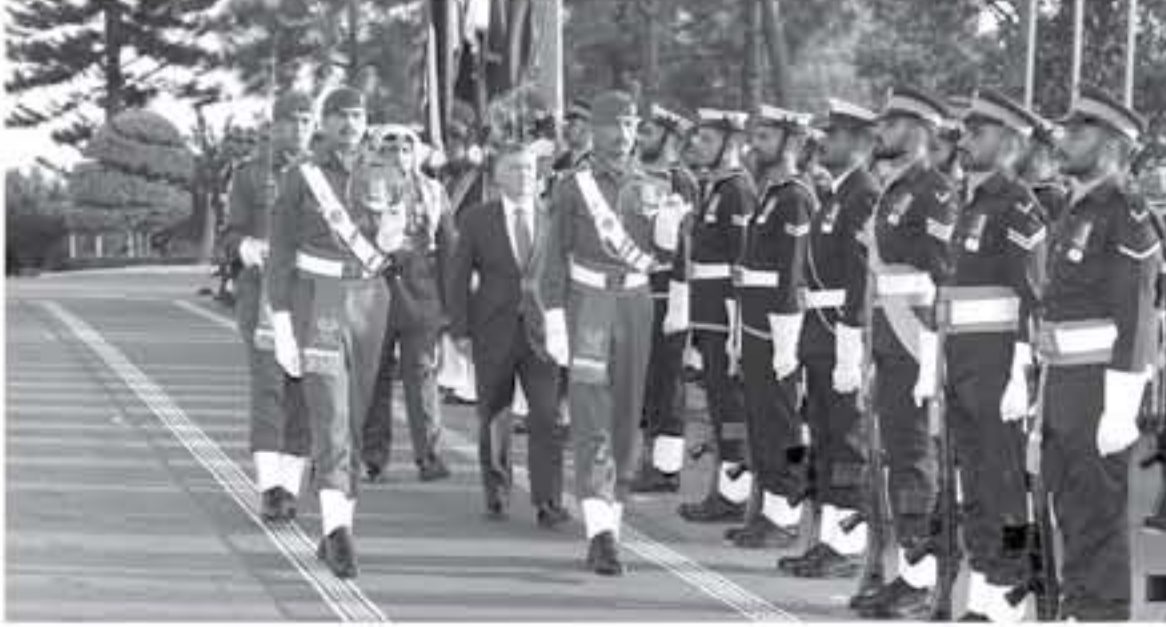
عبدالله بن زايد

القدس، كما تشكلت المباحثات الجهود الإقليمية والدولية لمحورة الأزمة، ضمن استراتيجية شمولية، كون حلها يمثل هدفا ملتبها لخلافة الأمن والسلام العائليين، حيث أكد جلالته الملك، لتقدير الأون ودعمه جهود الحكومة الفلسطينية في حيازة الأرياف، والتطرف- واستعداد المملكة للتعاون الوثيق مع باكستان بهدف الحصول. تحقيق السلام العائلي والتعاون، المستند إلى حل الدولتين وقرارات الشرعية الدولية وعبارة السلام العائلي، وبما يؤدي إلى إقامة الدولة الفلسطينية المستقلة على خطوط الرابع من حزيران عام ١٩٦٧ وعاصمتها القدس الشرقية. وشهد جلالته على أن مسألة القدس يجب تسويتها ضمن إطار الحل النهائي للصراع الفلسطيني الإسرائيلي، داعيا إلى ضرورة أن تشمل الجميع المولى مسؤولياته لحماية حقوق الفلسطينيين والعرب والمسلمين والمسيحيين في مدينة القدس التي تمثل مفتاح تحقيق السلام والاستقرار في المنطقة. في هذا الصدد، أكد رئيس الوزراء الباكستاني شاهد خاقان عباسي أهمية الوزارة الهادفة على التمسك بالإعلامية