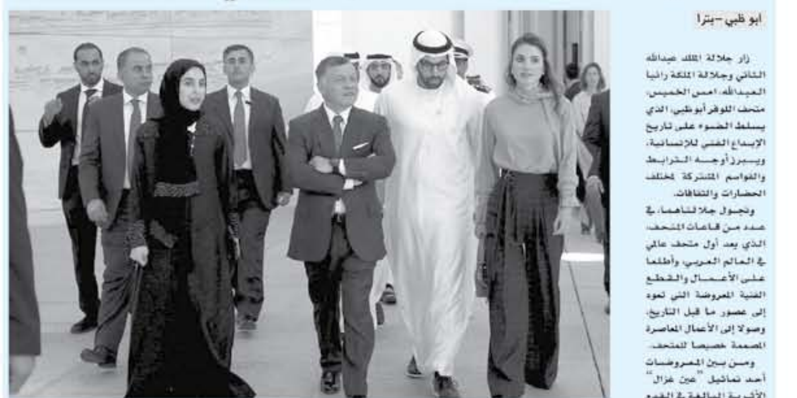
أبو ظبي - بنيرا

زار جلالته الملك عبدالله الثاني وجمالته الملكة علياء الحسين، متحف اللوفر أبوظبي، الذي يسلف الضوء على تاريخ الإبداع الفني للإنسان، ويسيرز أروعها الخرافات والفن المشترك، الحضارات والتقاليد، وتحتل جلا شامها، في عدد من قاعات المتحف، الذي يعد أول متحف عالمي في العالم العربي، وأول متحف عالمي على الامتداد والسطح الفنية المعروضة التي تعود إلى عهد ما قبل التاريخ، وصولا إلى اصنام العاصرة العدمية التي استوطنت في ومن بين المعروضات أحد تماثيل " عين عزال" الأثرية البالغة في القدم والذي تم اكتشافه كمين من مجموع التماثيل الـ ٣٦ التي عثر عليها في موقع " عين عزال" الأثري في عمان، وتحتل تاريخ الحضارات القديمة التي استوطنت في الأردن، والتي تعود للمصر الزراعي الأول قبل ١٠ آلاف عام. واستمتع جلالتهما إلى شرح من رئيس - أبو الثقافة والسياسة - طيب محمد خليفة المبرك الذي يقدم أكثر من ٦٠٠ قطعة من مقتنيات الأثرية العريقة والأصنام العدمية المعاصرة إضافة إلى ٣٠٠ قطعة من الأضال المتعارة من المتاحف الفرنسية موزعة على ٣٤ صالة عرض دائمة. ورافق جلا شامها في الزيارة مدير مكتب جلالته الملك.