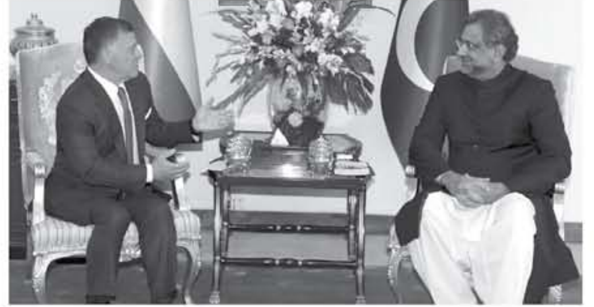
إسلام آباد - بنيرا

مسألة القدس يجب تسويتها ضمن إطار الحل النهائي للصراع الفلسطيني الإسرائيلي