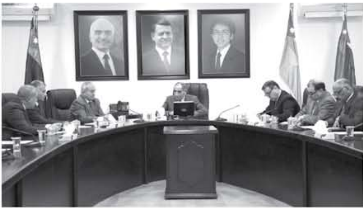
عمان - بنيرا

الزعيبي يشدد على ضرورة حل المشاكل العالقة بالمحافظات مهما استعصت