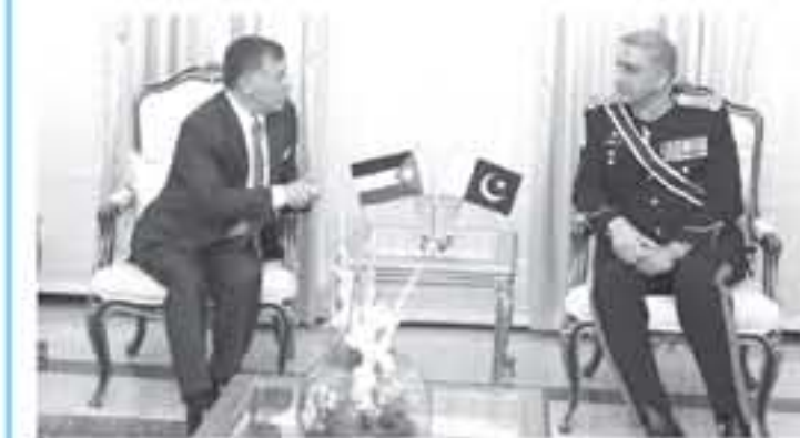
إسلام آباد - بنيرا

جاءت خلاله استعراض العلاقات بين البلدين، خصوصا في المجالات العسكرية. وشكر الملك الذي حضره رئيس هيئة الأركان المشتركة الفريق الركن محمود عبدالحكيم فريحت، جهود حيازة الأرياف. وحيث جلالته الملك لدى وصوله قاعة فور خاين الجورية كلة من حرس الشرف، وأقبلت الوفود لإحدى وعشرين قلعة شرفه لجلالته. وحرس جلالته مرافق استقال رسمية في مقر إقامة رئيس الوزراء الباكستاني، حيث عززت المراسم الترحيبية للملك الأردني والوفد المرافق الباكستاني، كما استعرض جلالته حرس الشرف الذي اصطف لتحيته فيما حضره طياران مقاتلة من طراز (F-17) بافغانستان المصنعة لتفجع سلاح الجو الباكستاني، تحية لجلالته. وعلى هامش زيارة جلالته لإسلام آباد، التقى جلالته الملك عبدالله الثاني، مع وزير الدفاع الأردني ورئيس الأركان المشتركة، وسفير مكتب جلالته لدى السفير الأردني في باكستان، فيما حضرها من الجانب الباكستاني وزير الخارجية وزير السليبي والوزير الباكستاني في الأون.