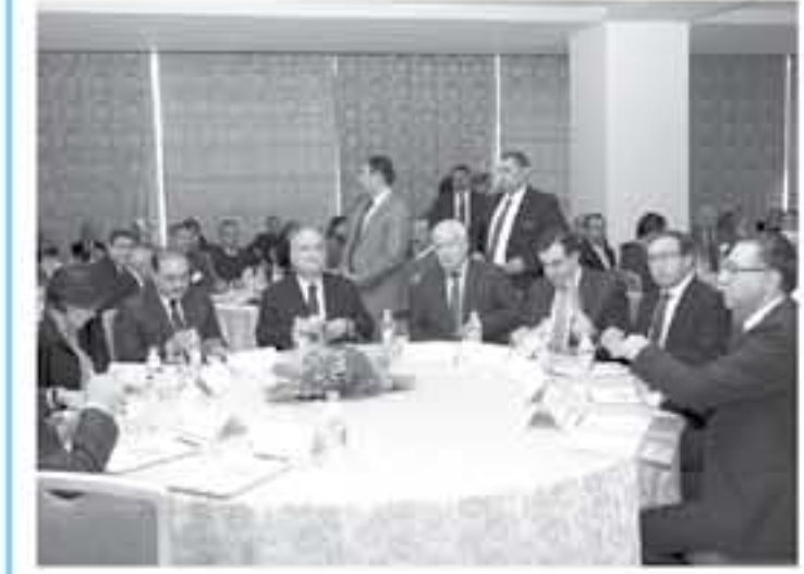
عمان - بنيرا

من جهته واستعرض رئيس منظمة الزراعة «أغار» حياح الأوسين نصر الدين الجهود المبذولة لتحسين مصادر الغذاء والاستعداد على الزراعة في نظمية احتياجات المكلة واستدامة الموارد الطبيعية وتنوع مصادر الطاقة في ضوء زيادة عدد سكان في الأردن، مؤكدا استناد المنظمة لتعاون مع المكلة للتشاور على تحقيق أهداف التنمية المستدامة. وعدا المشاركون إلى ضرورة تحقيق أهداف التنمية المستدامة التي تضمن التغذية حيث يؤدي العدم الأمن الغذائي إلى نشوء النزاعات والحروب، مؤكدا أهمية الوعي لتعزيز الأمن الغذائي على مستويات عالية. وتناقشت الورشة أهمية تطبيق أهداف التنمية المستدامة التي تضمن التغذية حيث يؤدي العدم الأمن الغذائي إلى نشوء النزاعات والحروب، مؤكدا أهمية الوعي لتعزيز الأمن الغذائي على مستويات عالية. وتناقشت الورشة أهمية تطبيق أهداف التنمية المستدامة التي تضمن التغذية حيث يؤدي العدم الأمن الغذائي إلى نشوء النزاعات والحروب، مؤكدا أهمية الوعي لتعزيز الأمن الغذائي على مستويات عالية.