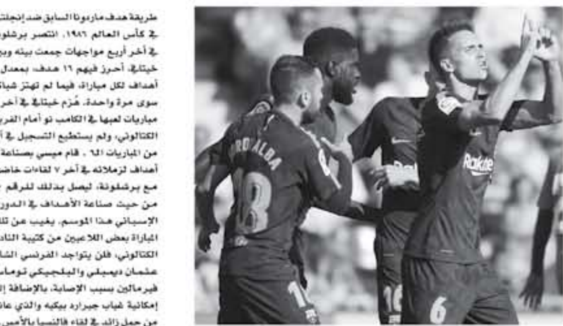
برشلونة - وكالات

يتسبب برشلونة فريق خيتلة في الجولة 12 من الدوري الإسباني، وسيكون موعد اللقاء يتصدر الالاجورنال جدول ترتيب الليجا برصيد 81 نقطة بعد التعادل الإيجابي مع إسبانيول في مدريد كاتالونيا بنتيجة (1-1)، متوقفاً في نقاط على أتلتيكو مدريد بوصيف صاحب 1-1 نقطة، ومتوقفاً في 18 نقطة على فالنسيا صاحب المركز الثالث برصيد 80 نقطة. على الجانب الآخر فريق خيتلة الذي يحتل المركز الـ 11 برصيد 71 نقطة (1-1)، يأمل في مواصلة هذه التفاعلات موسم الجاري . يذكر ان سواريز حصل على الجائزة الذهبية لهداف الليجا برصيد 28 هدفاً خلف ميسي 27 هدفاً ، والوسم الذهبي، وكبرت صمجة "سورث" التكتولونية ان سواريز صعد في أهداف بواقع 4 في الدوري وبن بانكاس، جانب هدف واحد في التصاميرتولج كانت أفضل صمد أهداف، فو ورسولوة خلف كوتويل ميسي (11 هدفا) وجوزي ربا ألبا