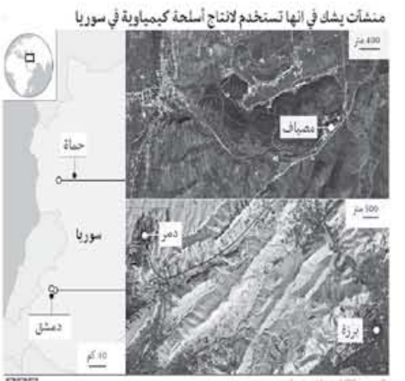
مشنات يشك في أنها تستخدم لإنتاج أسلحة كيميائية في سوريا