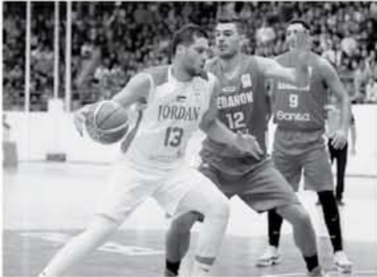
عمان - الأنباط

تنطلق مساء اليوم بطولة غرب آسيا لكرة السلة للشباب التي يستضيفها الاتحاد الأردني لكرة السلة في صالة الأمير حمزة في الحسين بالمدينة الرياضية خلال الفترة من 11 إلى 16 تشرين الثاني ويتشارك في البطولة منتخبات: العراق، إيران، سوريا، لبنان، بالإضافة لأردن، وتنتقل المنافسات لقطاء جميع المنتخب السوري مع العراقي الساعة الرابعة. لتها مباراة لبنان مع إيران.