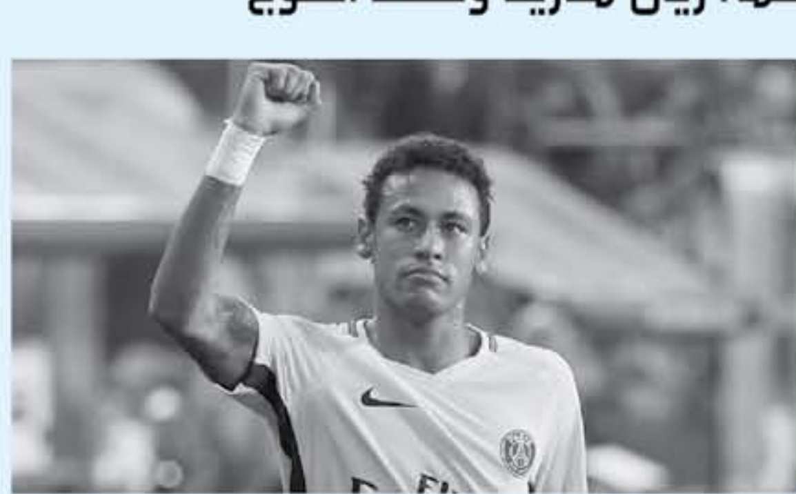
باريس - وكالات

يبدو أن حرارة اللقاء المرتقب الأسبوع المقبل بين ريال مدريد الإسباني وباريس سان جيرمان الفرنسي، لم تشع النجم البرازيلي نيجار ما سيقف من التمتع بالتلوج، التي تساقط هذه الأيام على عاصمة الأور. ينتظر عشاق الساحرة المستديرة بفارغ الصبر مباراة ريال مدريد الإسباني، حامل لقب نسخة دوري أبطال أوروبا الماضية، ضد العملاق الفرنسي باريس سان جيرمان يوم الأربعاء المقبل. واستغل مدرب فريق العاصمة الفرنسية، أوناي إيبيري، "العرب النفسية" على الألبان التي "تصبرج أكد فيه أن ريال مدريد هو الأفضل، ويرى بعض الفريقين ان إيبيري يريد نقل الضمم على العملاق الإسباني، الذي توجبه شبح الخروج خالي الفواض هذا الموسم، إذ يتأخر بملبار 19 نقطة كامتة من متصدر الاسبوع بولنديت لوروني، في تعوير كما أن "البرنجي" وبع كاس ملك إسبانيا على يد فريق ليغانس، لكن يبدو ان جيرمان، إضافة لثلاثه من ريال مدريد، لن يشارك في مباراة ريال مدريد، بل في مباراة باريس سان جيرمان وريال مدريد، له وقع شنيع كبير على المستوى العالمي، جلت إلى هنا للقول بكل البمولات، ولا تا فكرت في هذه الخطوة من الأساس