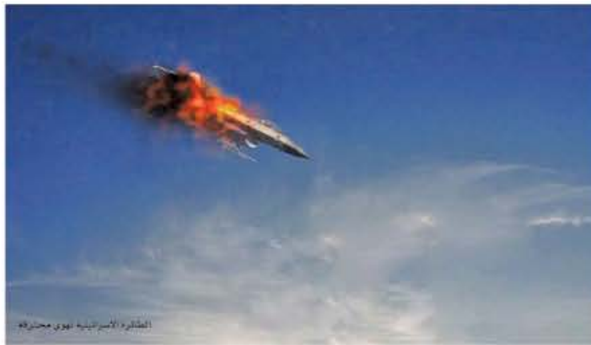
الطائرة الإسرائيلية التي حطرت

مبيناً أن هذا الإعلان يجعل الاحتلال يتكرر كثيرا قبل ان يشن عدوانا سواء على غزة او على أي جبهة في لبنان او سوريا.