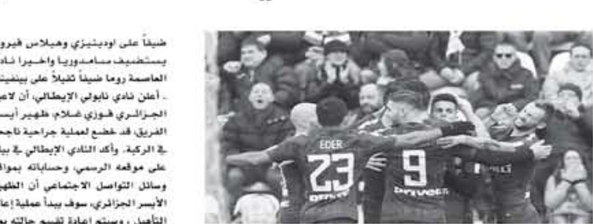
ميلان - وكالات

بدأ الشيف بديور حول فكرة الهامج الأرجنتيني وفاند فريق إنتر ميلان الإيطالي مازورويكاري من لشكاره في مباراة فريده القادمة أمام بولونيا. ويستضيف إنتر ميلان الذي لم يحقق الفوز منذ فترة طويلة لتظوره الثوري على ملعب جوزيبي مياتزا، ضمن منافسات الجولة الرابعة والعشرين من الدوري الإيطالي، وأهدت لقاء "سورث مدياميتا" الإيطالية ان مازورويكاري توجده في تدرجات إنتر ميلان كواجبة والفتاح، بينما تدريب أيضا بشكل منفصل صباح اليوم الجمف. وأضاف المصمم ان إيكاريدي لم يندرب كثيرا بسبب كثرة الإصابات التي يعاني منها، وهذا قد يغير الحرب الإيطالية لوشكناو سيأتي على إيداه