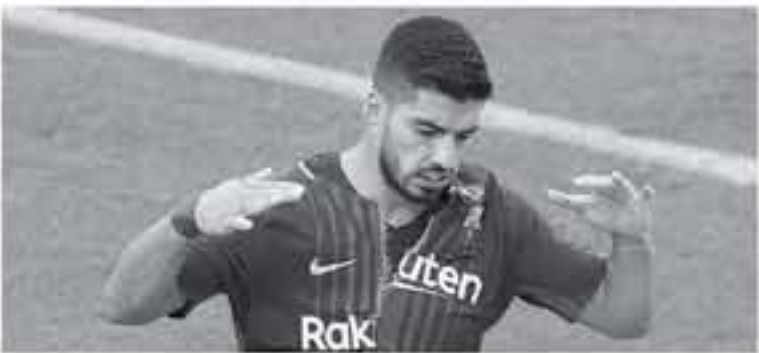
برشلونة - وكالات

يتسبب برشلونة فريق خيتلة في الجولة 12 من الدوري الإسباني، وسيكون موعد اللقاء يتصدر الالاجورنال جدول ترتيب الليجا برصيد 81 نقطة بعد التعادل الإيجابي مع إسبانيول في مدريد كاتالونيا بنتيجة (1-1)، متوقفاً في نقاط على أتلتيكو مدريد بوصيف صاحب 1-1 نقطة، ومتوقفاً في 18 نقطة على فالنسيا صاحب المركز الثالث برصيد 80 نقطة. على الجانب الآخر فريق خيتلة الذي يحتل المركز الـ 11 برصيد 71 نقطة (1-1)، يأمل في مواصلة هذه التفاعلات موسم الجاري . يذكر ان سواريز حصل على الجائزة الذهبية لهداف الليجا برصيد 28 هدفاً خلف ميسي 27 هدفاً ، والوسم الذهبي، وكبرت صمجة "سورث" التكتولونية ان سواريز صعد في أهداف بواقع 4 في الدوري وبن بانكاس، جانب هدف واحد في التصاميرتولج كانت أفضل صمد أهداف، فو ورسولوة خلف كوتويل ميسي (11 هدفا) وجوزي ربا ألبا