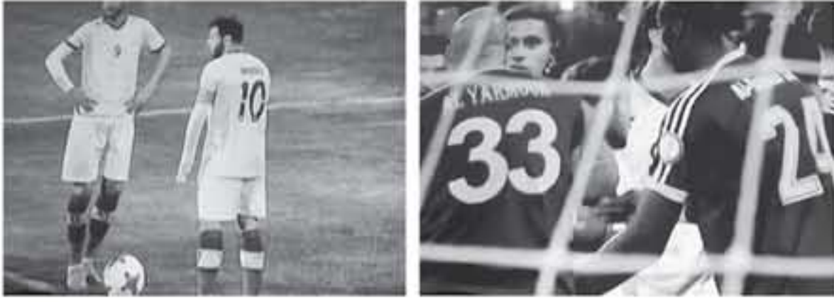
عمان - الأنباط - محمد الحنتواوي

اختتمت مساء امس مباريات الاسبوع الرابع عشر من دوري المتصدر لكرة القدم في مواجهتين، حيث حل البقعة ضيفاً على العقبة في مباراة الهروب من شبح الهبوط ، واستضاف البرموك الذي يبحث عن طرق التجار نادي الصفاياح لفتحة الاحتمالات بالصدارة بعد تعادل الأخير 1-0 في كلاسيكو الكرة الأردنية مع الفيصل.