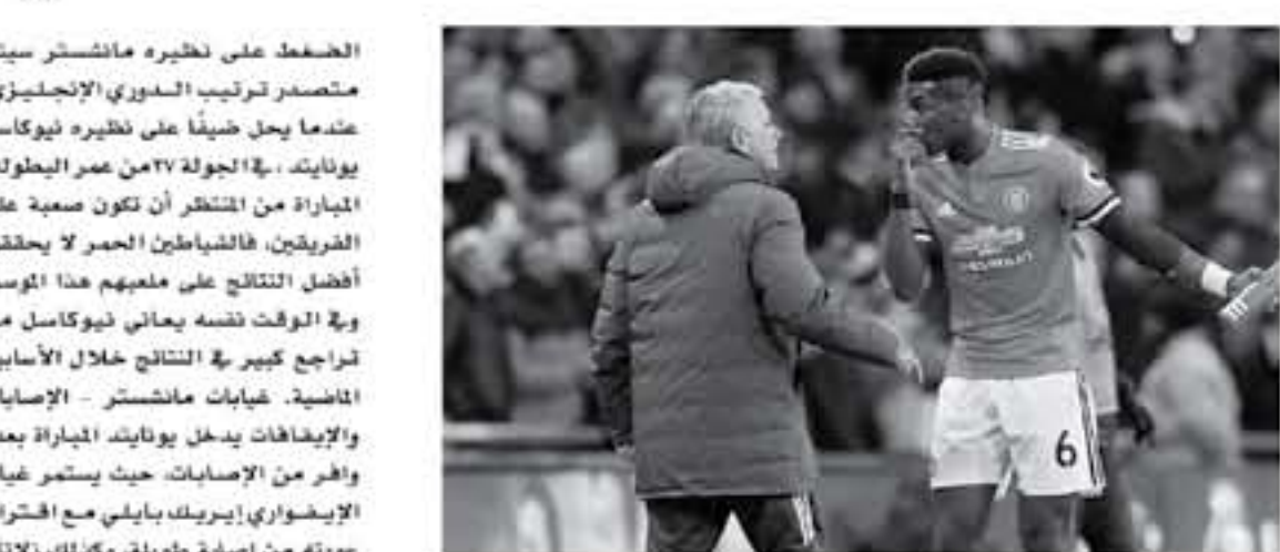
لندن - وكالات

مباراة محمية في البريميرليج بين الريدز نادي ليفربول وتظهير نادي ساوثهامبتون مباراة هامة للغاية من ناحية الريدز ليتقدموا في جدول الترتيب ملاحقا نادي مانشستر يونايتد الذي يتعدت عنه بخمس نقاط فقط. هدف بعد تعمرهم وتعادلهم مع نادي توتنهام بعد هدفين للكلها، مباراة هامة أيضا من أجل نادي ساوثهامبتون للاندباء من شبح الهبوط من دوري الدرجة الأولى، متوقفا ان تكون المباراة من جانب الريدز هجومية، وواقعية بالنسبة لأصحاب الأرض لتأمين شيكهم والفتناسي في هدف اعتمدا على سلاح الكرنشات، هدف كلا الفريقين قبل المباراة، يدخل نادي ليفربول المباراة وهو يحتل المركز الثالث برصيد 81 نقطة في ترتيب جدول الدوري خلف كل من مانشستر سيتي ومانشستر يونايتد، الريدز يسير على حطش ثابتة بعد تقدم المدافع فان ايدك