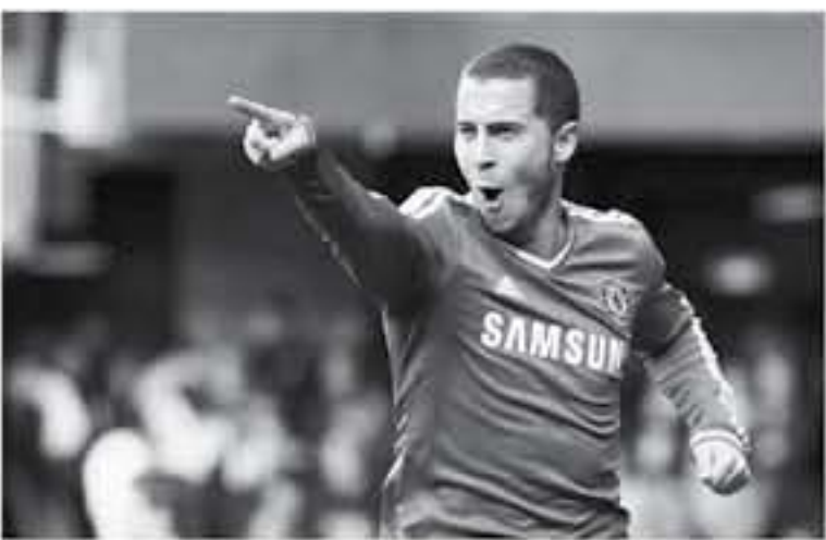
مدريد - وكالات

أدى أسطورة ليفربول والحمل الحادي يشية إيس إبي إيس، شيف بيكول برأي غريب بشأن إمكانية الضمام إيدين هازارد، صانع ألعاب مدريد تشيلسي الإنجليزي لنادي ريال مدريد الإسباني المقرب، وكانت تقارير وعده كيبيري من الحقلين، قد لوقوا خلال الأسابيع القليلة الماضية الضمام اللاعب في تصفوف النادي الملكي ضمن خطة الاعمال. وسجل إيدين هازارد 12 هدفاً في 34 مباراة مع تشيلسي هذا الموسم.