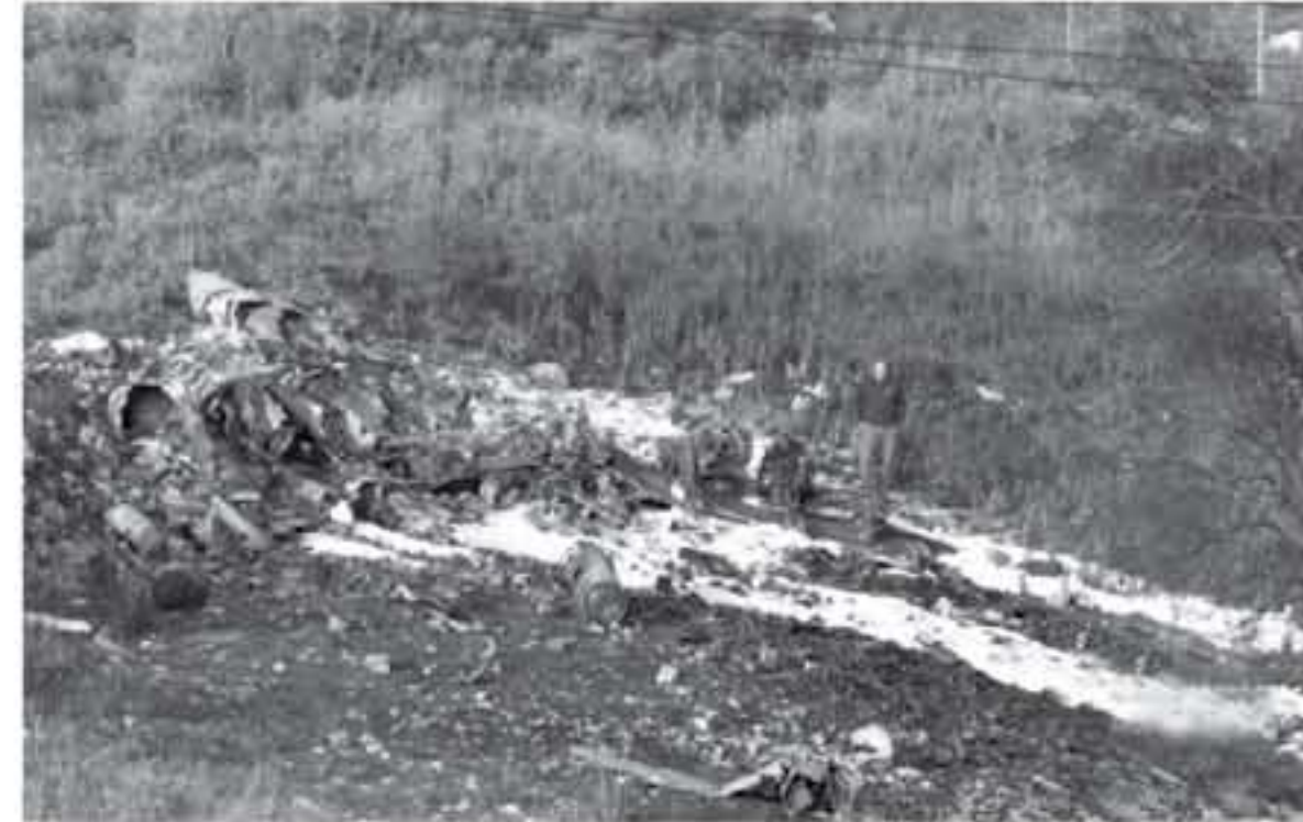
حطام الطائرة الإسرائيلية