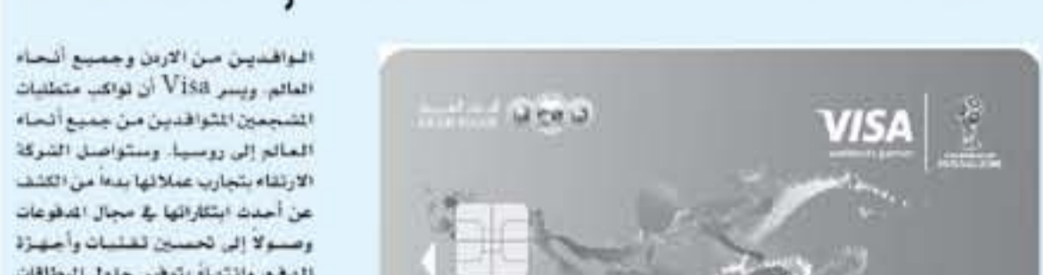
أطلق البنك العربي مؤخراً حملة ترويجية خاصة ببطاقات فيزا الائتمانية، بالتعاون مع كأس العالم FIFA ٢٠١٨، والتي ستقام في روسيا في شهر حزيران القادم.

منحت جوائز جوردن بيزنس لأفضل مشاريع الأعمال في الأردن، في حفل أقيم في عمان، بحضور عدد كبير من المسؤولين. منحت جوائز جوردن بيزنس لأفضل مشاريع الأعمال في الأردن، في حفل أقيم في عمان، بحضور عدد كبير من المسؤولين.