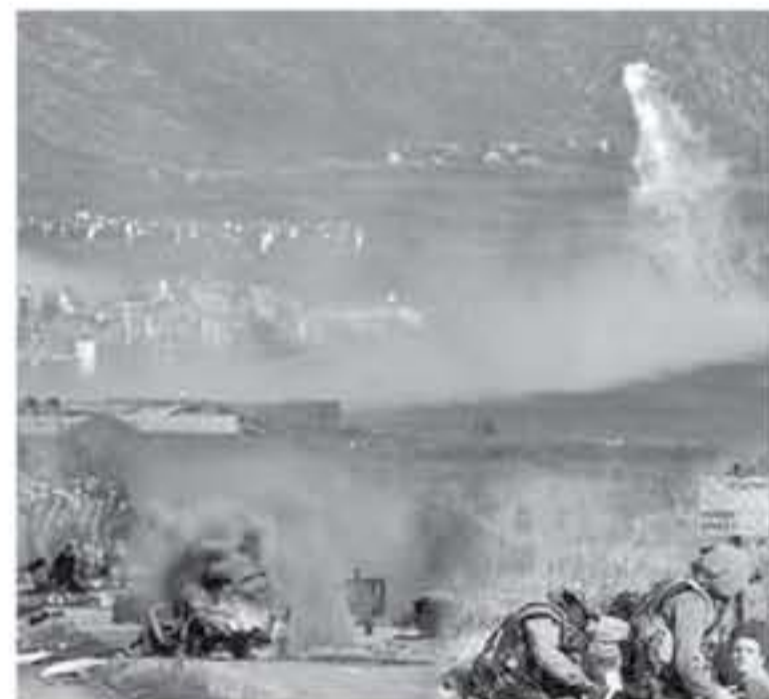
مواقع تقع على مقربة من مناطق انتشار مستشارين روس، وخاصة في مطار "تل أبيب" في رف حيفا الإسرائيلي.