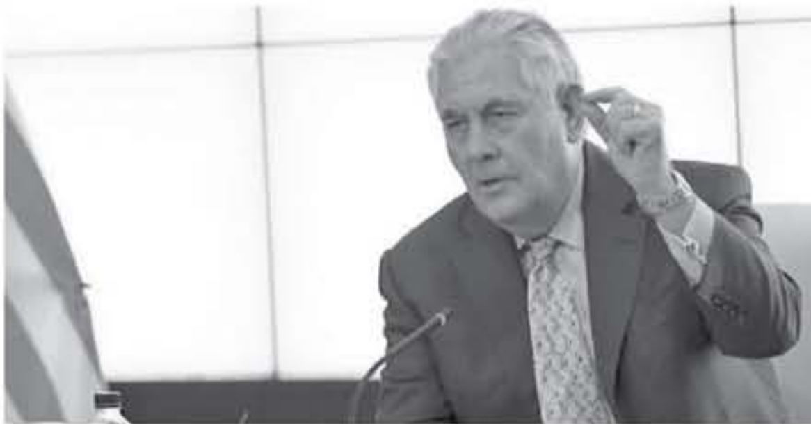
تيلرسون يتحدث خلال مؤتمر صحافي في الكويت على هامش اجتماع مقبلين من التحالف الدولي لمحاربة تنظيم الدولة الإسلامية

من جهته، أعلن وزير الدفاع جيم ماتيس أن العراق يتوقع أن يحرز انتصارات مهمة في غضون أسابيع قليلة، مشيراً إلى أن القوات العراقية قد بدأت بالفعل في القضاء على داعش في مناطق واسعة من البلاد، داعياً إلى مزيد من الجهود لمحاربة المتطرفين.