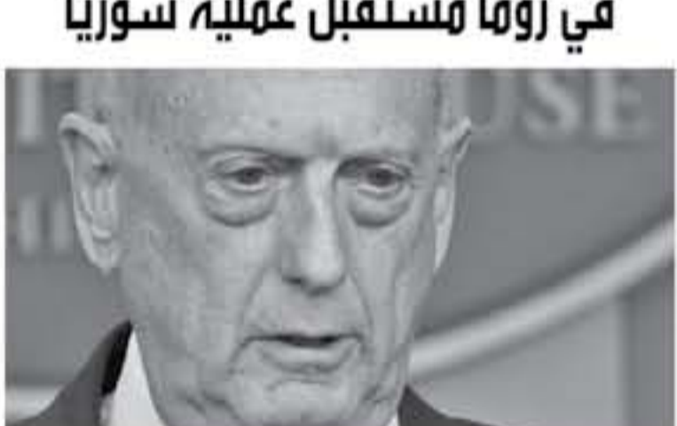
وزير الدفاع الأميركي جيم ماتيس يتحدث إلى الصحفيين في واشنطن