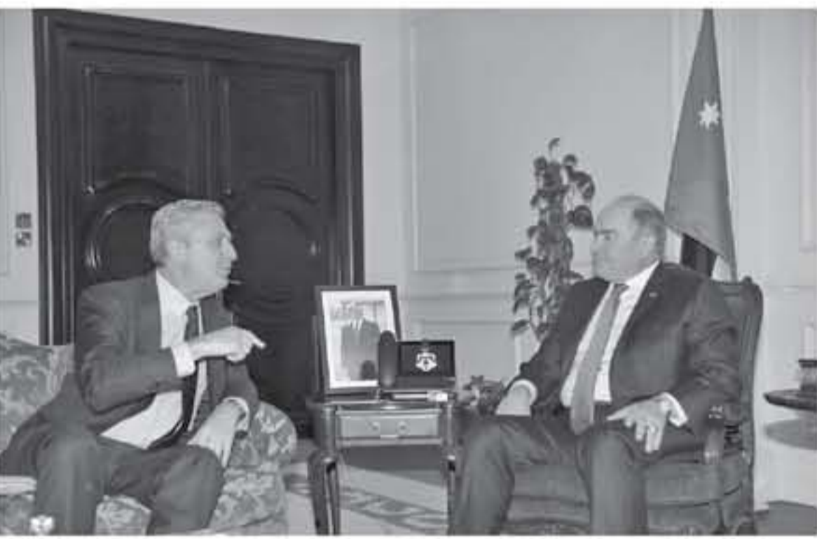
عمان - الأنايب

استقبل رئيس الوزراء الدكتور عاني المهلي في مكتبه برئاسة الوزراء أمس مفوض الأمم المتحدة السامي لشؤون اللاجئين هيليو غراندي وألقى الحرفق كلمة.