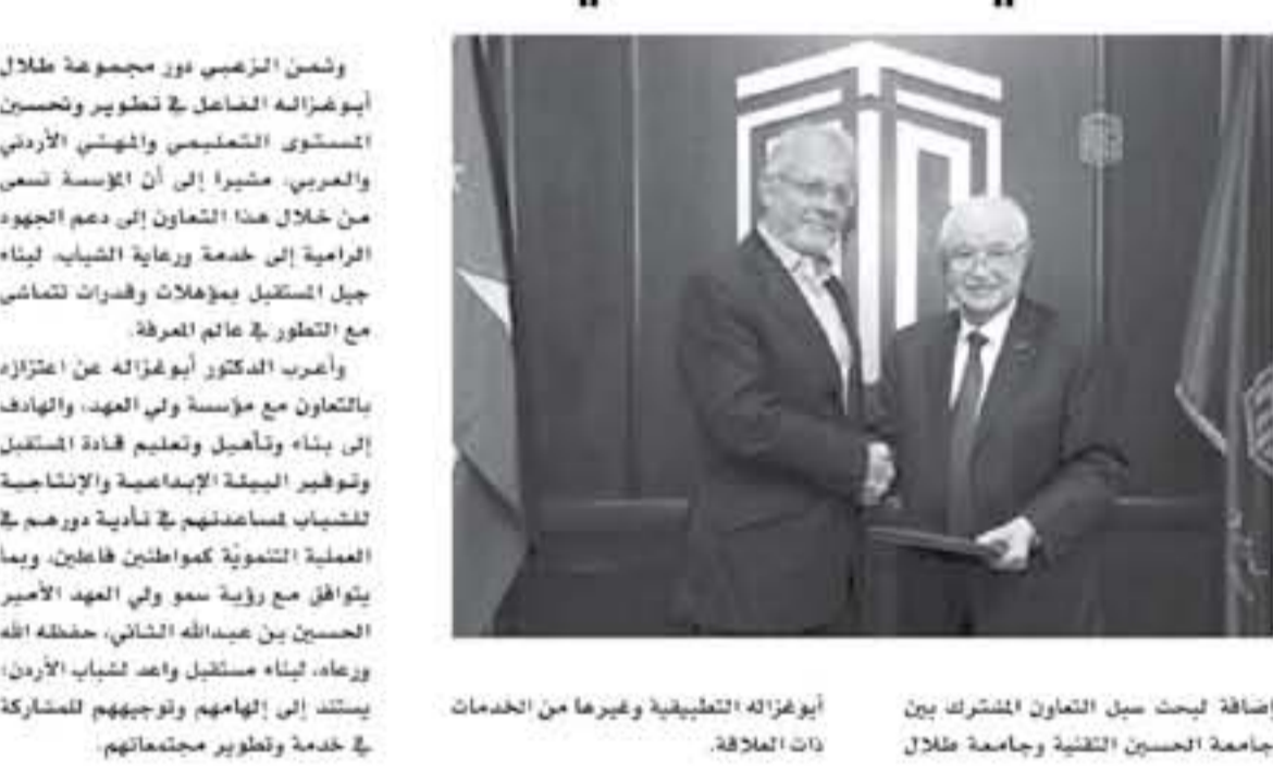
أبوغزاله التطبيقية وغيرها من الخدمات ذات العلاقة