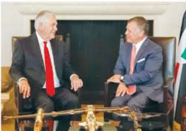
عمان - بئرا

إضافة إلى الجهود الإقليمية والدولية في الحرب على الإرهاب ضمن نهج شمولي، جاء ذلك خلال استقبال جلالة الملك، وزير الخارجية الأميركي ريكس تيلرسون الذي يزور المملكة ضمن جولة له في المنطقة، حيث جرى استعراض علاقات الشراكة الاستراتيجية بين البلدين وأخر المستجدات على الساحتين الإقليمية والدولية.