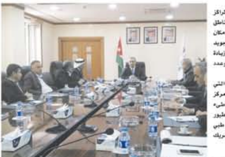
التفاصيل ص ٦٦

زيادة عدد المدن الصناعية من ٢ الى ٥ ومن المراكز التجارية من ٥ الى ١٠ مراكز واعطائها صفة المناطق الحرة وخلق فرص عمل للاردنيين واحلالهم مكان العمالة الوافدة وزيادة اعداد السياح بعد تجويد المنتج السياحي المقدم لهم لافتاً الى ان هناك زيادة ملحوظة في اعداد السياح ومعدل اقامتهم وعدد العرف الفندقية. وأشار الشريدة الى المشاريع الاستثمارية التي ستنفذها السلطة خلال السنوات المقبلة مثل مركز العقبة الشرقية وصنرح مفتوح على الشاطيء الجنوبي ومحطة للحياة البحرية وحديقة للعبور وانشاء مدينة ألعاب اولمبية متكاملة ومجمع طبي للسياحة يشجع السياحة العلاجية وانشاء للفريك يربط الجبل بالشاطيء ضمن مشروع النقل.