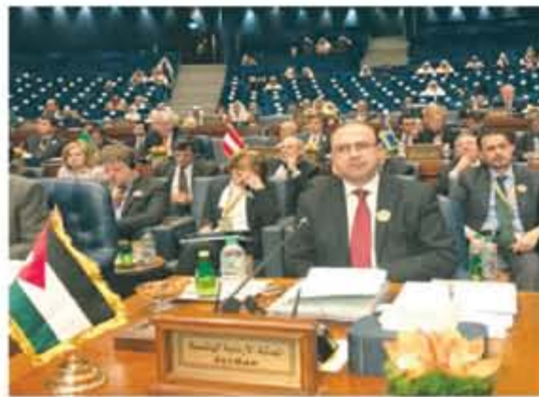
الكويتية وجمع ثلاثين مليار دولار لاعمار اعمار العراق، علماً بأن بداية مؤتمراً اعمار العراق جرى في العاصمة

ربما لا تحتاج الاجابة الى كثير تفكير بأن الاشارات القادمة من مشاريع الاعمار الكبرى لن تعود لتخير الكثير على الأردن الذي اكتمل يتحمل اعباء اللجوء فقط مستودا بخذلان عربي وعالي وبقلة حيلة وسوء ادارة حكومية لهذه اللغات حتى لا ننكر الخطأ الذي نعمل اوزار.