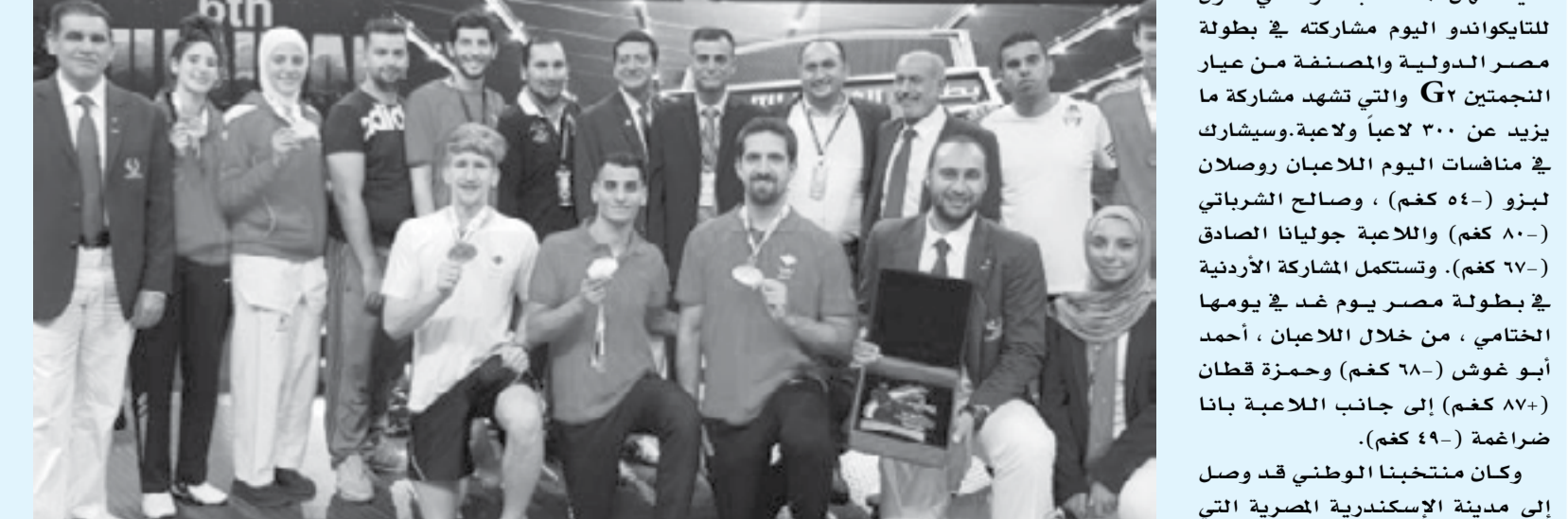
عمان – الأنيابط