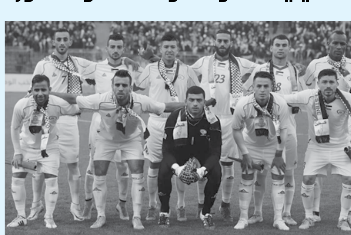
عمان – الأنيابط

ليست القدس بالعاصمة التقليدية لتكونها حلم وسحاب ملئقي وموضع نبوءة وسلام فهي أرض الأنبياء والسلام ومعها يتجدد حلم العربيه من الحجد إلى الخليج ورغم كل السحب اللائكة تبقي القدس ضمننا العربي والإسلامي ؟ لكن تظل علينا الرياضة الفلسطينية من خلال فصائد مختلفة في الشكل والجوهر مع تقديرنا لكل فقصائد أسن الوطن البديع الكبير محمود درويش وخاصة أمام إنجازات الحصاد كرة القدم الفلسطيني والذي يتراسه الرمز الفلسطيني العربي اللواء جبريل الرجوب وما حققه من نجاح باهر في قيادة كرة القدم الفلسطينية التي ترأجت بعد نكبة عام ١٩٤٨ م إلى اللواء وسط طرفان الاحتلال الإسرائيلي وكان كان المحتوي الرياضي الفلسطيني عنوان لتواصل تربي الفلسطينيين من وجهة نظر مختلفة وهذا ما يلمس على شاطئ الساحرة المستديرة في العالم العربي وخاصة عشاق كرة القدم الفلسطينية...ومع رغبة في التعلم كان اللواء الرجوب صوت الرياضة الفلسطينية يعرض في كل الدور العربية من أجل رفعة كرة القدم الفلسطينية التي استطاعت بالفعل جذب المشاهد العربي بل اصبح منتج فلسطين لكرة القدم العديد من اللاعبين الذين حققوا إنجازات فريدة من نوعها في ظل الحصار الإسرائيلي على الفلسطينيين.