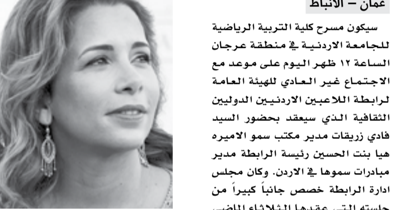
عمان – الأنيابط