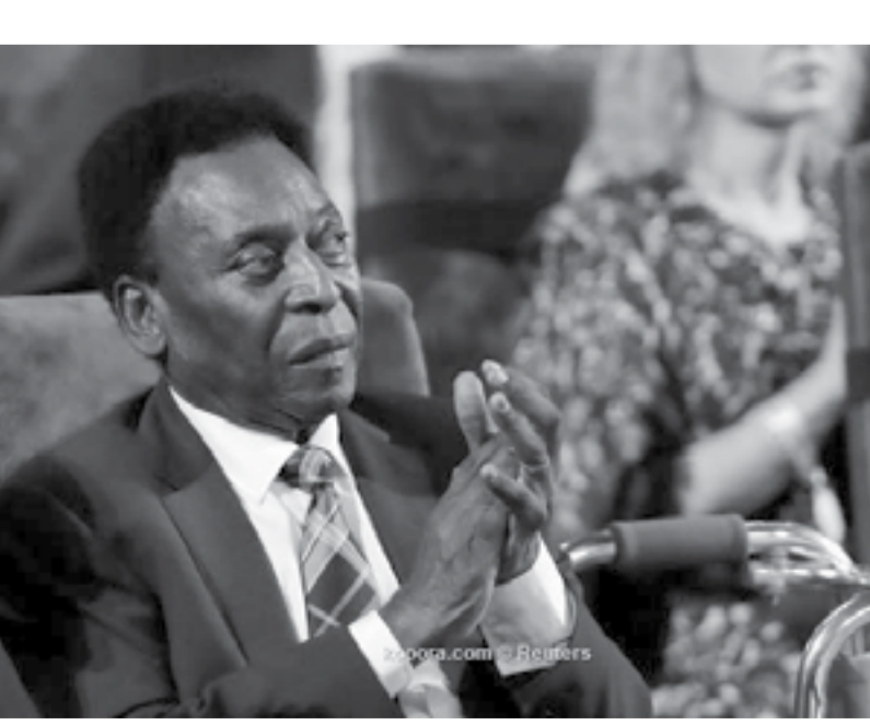
عمان – الأنيابط

مجموعتين، وتقام مباريات الدور اول من مرحلة واحدة بنظام الدوري الجزأ، بحيث يتنافس اول كل فريقين من كل مجموعة الى الدور الثاني الذي سيقام بنظام خروج المغلوب من مرة واحدة على ان يلتقي اول كل مجموعة مع وصيف المجموعة الاخرى، وفي حال تعادل الفرق المتقابلة في مباريات الدور الثاني والمباراة النهائية خلال الوقت الاسلبي للمباراة (٩٠ دقيقة) يتم حسم النتيجة بالهجو بالنسبة لي الركلات الترجيحية المشاركة في