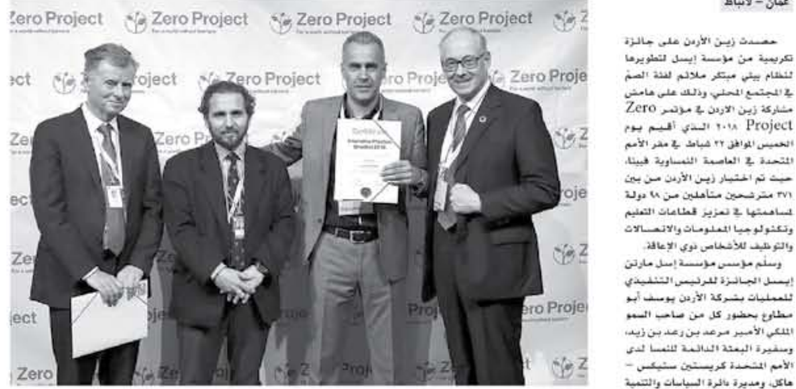
عمان - الأنباط

حصلت زين الأردن على جائزة تكريمية من مؤسسة إيسل العالمية... لشغلي بيئي مبتكر ملانها لفضة العام في المجتمع المحلي... وذلك على هامش مشاركة زين الأردن في مؤتمر Zero Project ٢٠١٨.