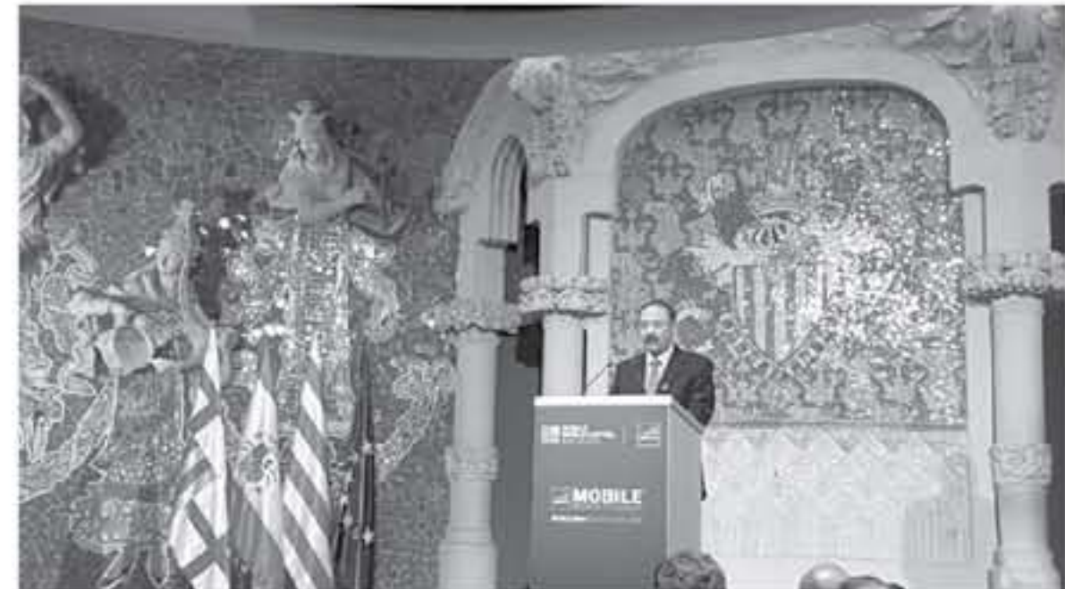
برشلونة - الأنباط

أعلن أسب في مدينة برشلونة الإسبانية عن فوز رئيس مجلس مفوض هيئة تنظيم قطاع الاتصالات الدكتور المهندس غازي الجور بجائزة الابتكار الحكومي... لشغلي الهوائيات المتنقلة لعام ٢٠١٨.