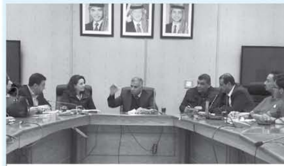
القياد يتحدث في اللقاء