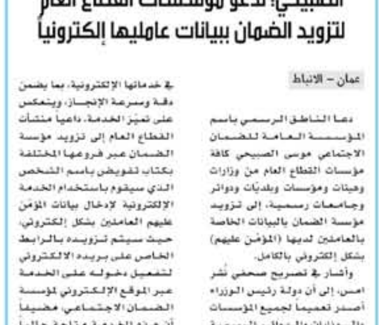
عمان - الأنباط

دعا الشاطنق الرسمي باسم المؤسسة العامة للضمان الاجتماعي... مؤسسات القطاع العام من وزارات ومؤسسات ومؤسسات وبنديات ودوائر جامعات رسمية، إلى تزويد مؤسسة الضمان بالبيانات الخاصة بالعمالين لديها (المؤمن عليهم) بشكل إلكتروني بالكامل.