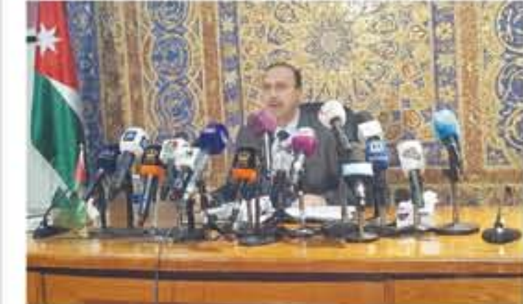
لا استمراج لتعيين سفير اسرائيلي جديد