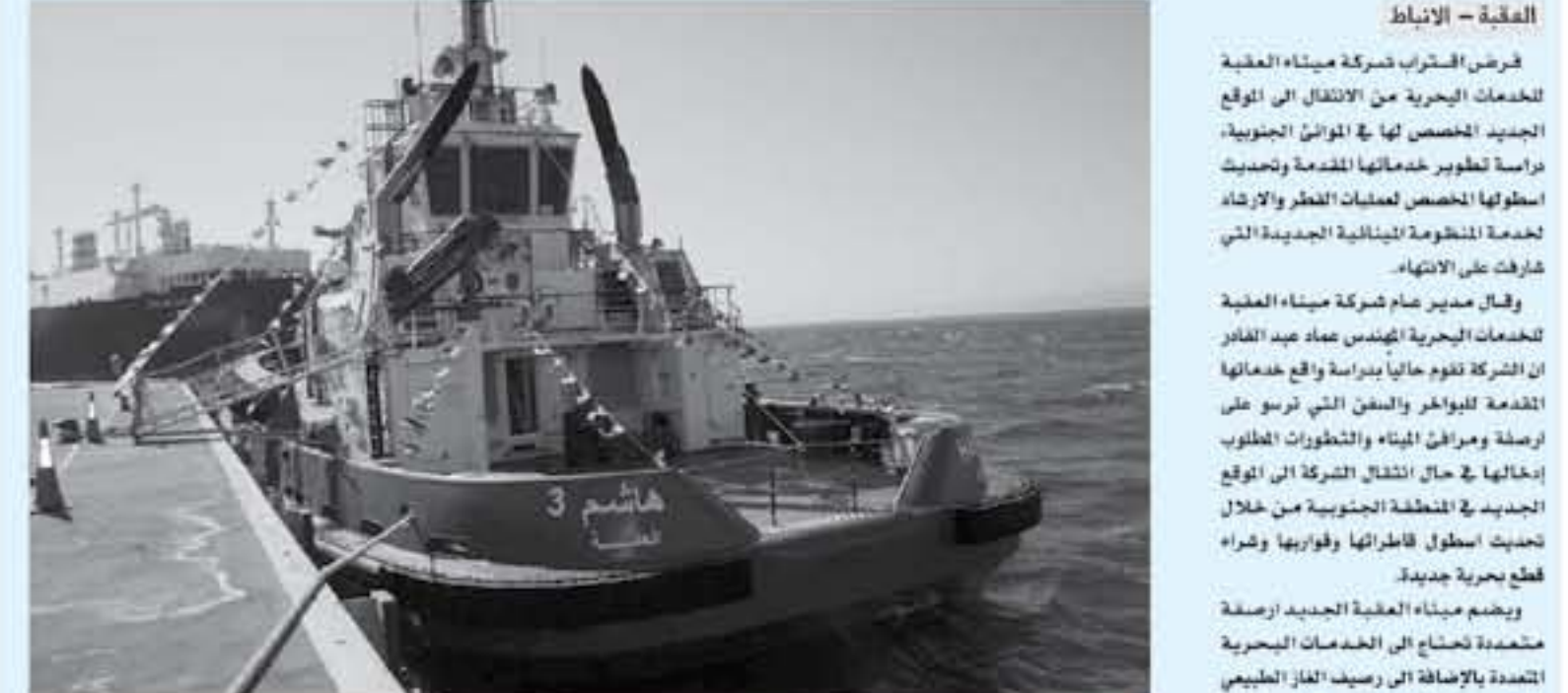
العقبة - الأنباط