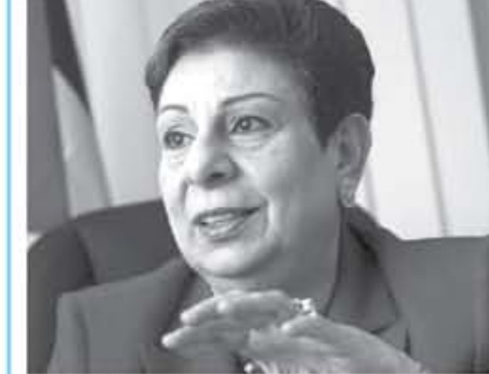
رام الله - صفا