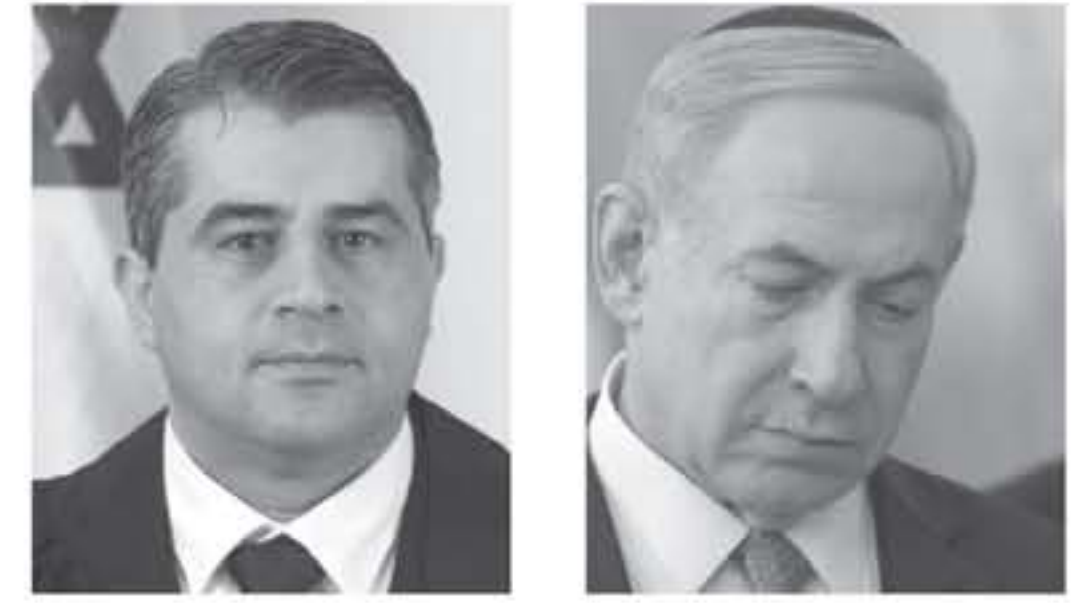
بيت لحم - معا

يخضع رئيس الوزراء الإسرائيلي بنيامين نتانياهو... الجعنة القادم للتحقيق تحت مظلة التحدير في مقل... رقم ٤٠٠٠ قضية بروت (١٥) وان يشهد في ملف ٤٠٠٠... (العواصم).