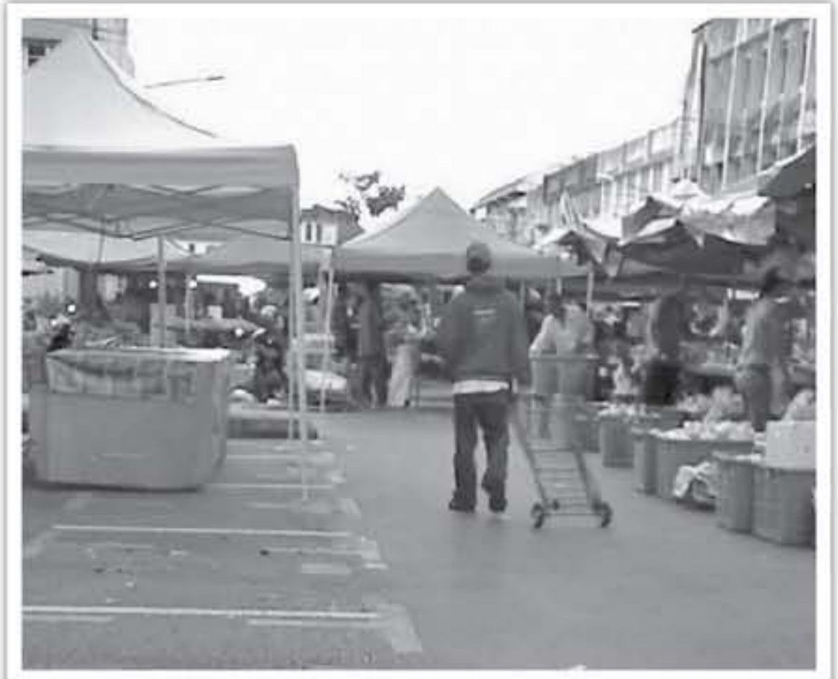
رصد جملة خفر