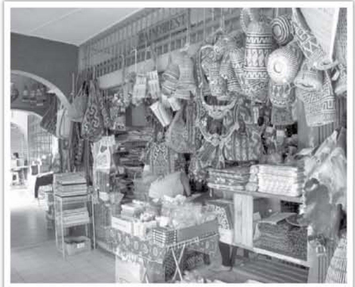
رصد جملة خفر