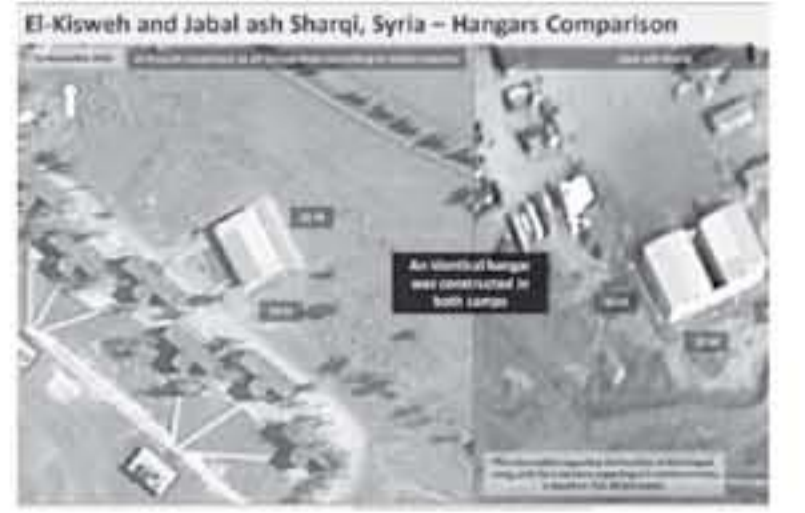
El-Kisweh and Jabal ash Sharqi, Syria – Hangars Comparison