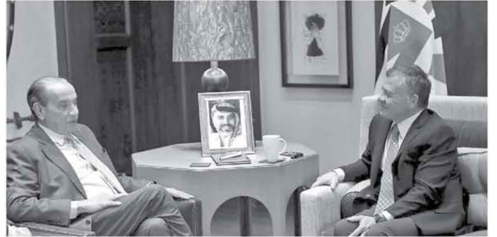
الوزير البرازيلي في حضرة الملك