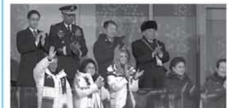
القيادة الإعلان عن أنها عليا إلى حين استئناف التحقيقات.