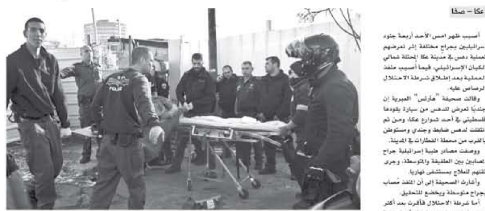
القدس المحتلة - صفا