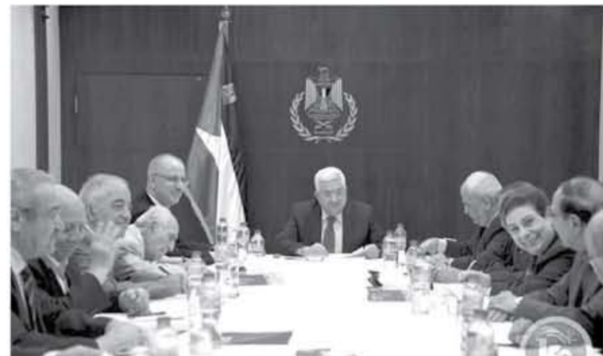
رام الله - معا

قررت اللجنة التنفيذية لشبكة التحرير الفلسطينية، خلال اجتماع برئاسة الرئيس محمود عباس، أمس الأربعاء، عقد المجلس الوطني الفلسطيني يوم ٣٠ نيسان/ أبريل 2016. واستتمت اللجنة إلى عرض قدمه الرئيس محمود عباس حول جدول التطورات المتوقعها السياسية والتشريعية بما في ذلك إطلاق من الرئيس الروسي فلاديمير بوتين في موسكو، والسكريتير العام للأمم المتحدة القطري فولغيريس في نيويورك، وطرحه لتروية الفلسطينية للسلام أمام مجلس الأمن الدولي.