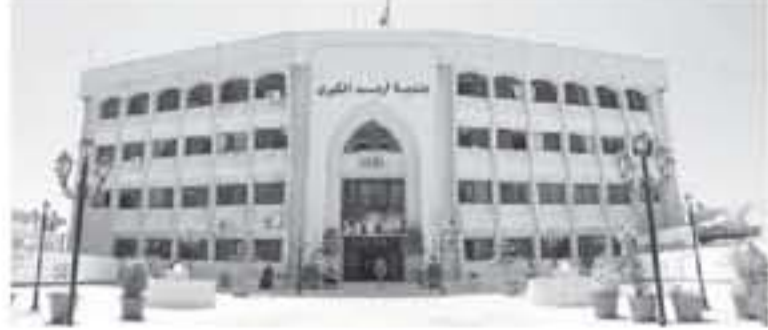
اربد - الأنباط

دعت بلدية اربد الكبرى المواطنين الراغبين بالصفالي في عقد واستشارة لعقبات إقامة مشروع تجاري أو مهني، التثبت من حصول العقار على إذن الأشغال اللازمة التي تثبت حصوله على رخصة بناء أو إثبات توافقه لاي اشغال.