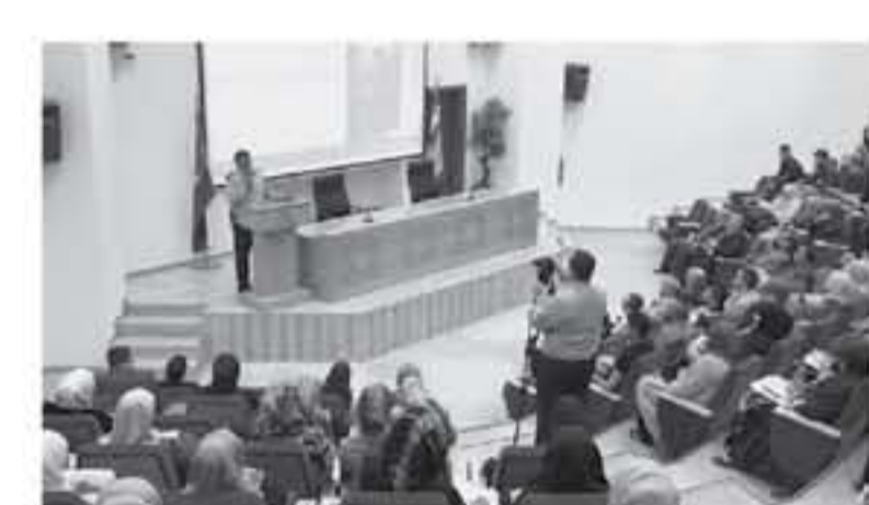
العقبة - الأنباط

مشروها عن رئيس المجلس الاقتصادي الاردنية / العقبة رعى مساعد الرئيس الدكتور رياض مناصر حفل اطلاق دورة اصدقاء البيئة التي نظمتها مكتب التواصل وخدمة المجتمع في الجامعة بالتعاون مع الادارة الملكية لحماية البيئة في العقبة بهدف نشر الوعي حول القضايا البيئية المختلفة لدى طلبة الجامعة والعاملين فيها واكدت مديرية مكتب التواصل وخدمة المجتمع في الجامعة المذكورة مديرين سيميات في كلمتها أهمية عقد مثل هذه الدورات لطلبة والعاملين في الجامعة بهدف جعل المواطن فريحا استراتيجيا في الحفاظ على البيئة من خلال تعديل السلوك وتبني مبادئ صديقة للبيئة والحفاظ على شراعت ومقدرات الوطن البيئية إضافة إلى توعومه في البرامج من جانب جهات مكتب التثقيب مكاتب المحافظة