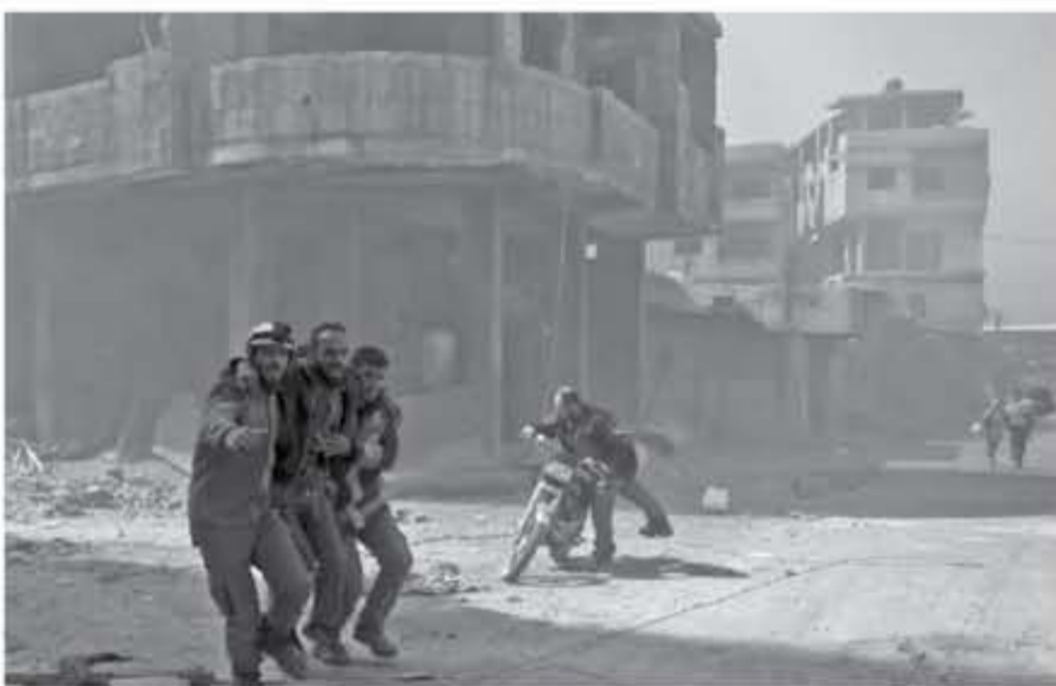
متطوعون من الدفاع المدني السوري يساعدون رجالاً في حمورية في الغوطة الشرقية