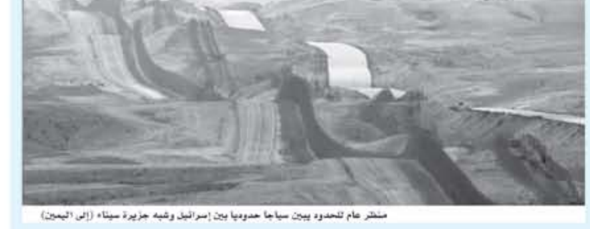
القدس المحتلة - رويترز

قال مسؤولون إسرائيليون يوم أمس الأربعاء إن إسرائيل ومصر تعملان على وقف الأعمال التي أسببت تشويش الهاتف المحمول بعد أن تسبب تشويش مصري على الاتصالات سببها في غضون ساعات من عتبات الجنود. وقالت الضميمة في عشرات الجنود قرهون إن هذا الإجراء يخلق ضغطا كبيرا على الفلسطينيين مما يصعب عليهم العمل ويعرضون لكناية تفاصيل كاذبة لتختص من أعباء هذا الإجراء.