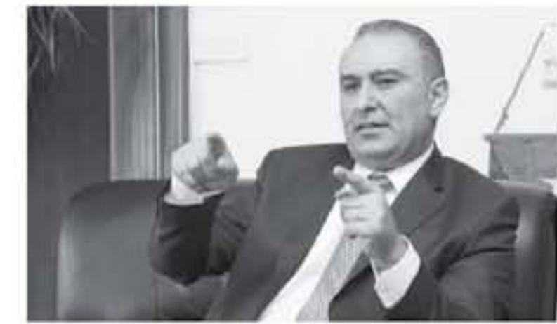
العقبة - الأنباط

اطلقت سلطة منطقة العقبة الاقتصادية الخاصة في العجبة اليوم خطتها التنموية الجديدة لتنمية وتطوير المجتمع المحلي وتعزيز المشاركة التوعوية بين السلطة والمجتمع المحلي لتحقيق تطبيق التنمية الشاملة بمشاركة السلطة والمجتمع.