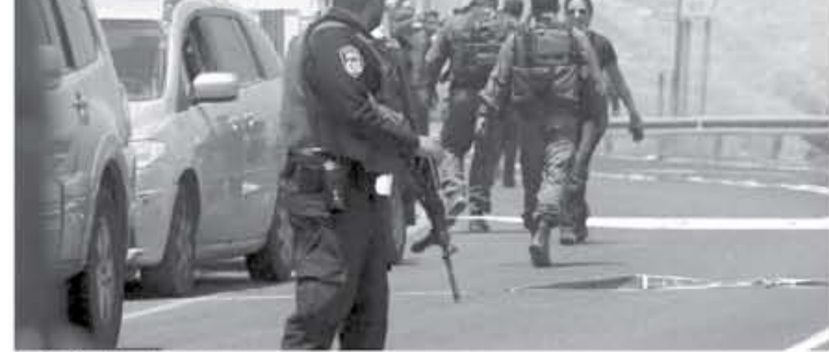
القدس المحتلة - صفا

كشفت مصادر إعلامية صربية صباح أمس الأربعاء أن جيش الاحتلال بدأ مؤخرا بجمع معلومات من الفلسطينيين بالضفة الغربية عبر حواجز التفتيش على طرقات الضفة وعرضها ضمن حملة أطلق عليها اسم «احتضان الدب».