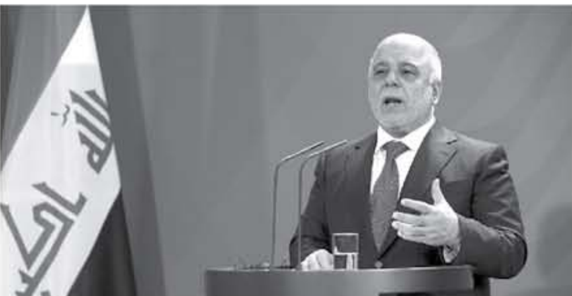
رئيس الوزراء العراقي حيدر العبادي