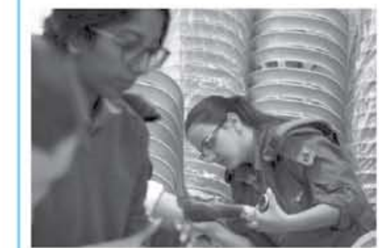
بيت لحم - معا

وقال كوهن: "نحن في حارة معقدة وكثيرة الحركة، ومن الممكن أن تكون تطورات على الجبهة الشمالية والجنوبية على حد سواء، خاصة ما يجري في قطاع غزة حيث الواقع متحرك على مدار الساعة، علما أن العدو يبني قوة عملية في الشمال والجنوب، وبالتالي تعمل على منح حماية لكافة المواطنين من الشمال وحتى الجنوب، حيث لعننا القدس اعتبارا من حملة (الحرف الصادق) على قطاع غزة في صيف 2011، متصرا على تحرير فلسطينية على وجهه كوهن رسالة لفلسطينيين، قائلا: "أريد أن أوصي سيدينا (الفلسطينيين) بأن يكونوا جريدين (الحرب، جيش الدفاع الإسرائيلي جازم تماما من ناحية الجبهة الداخلية ومن ناحية عقائدية لطرب وإبداء الطرف الثاني، من يعتقد أن الجبهة الداخلية هي (الجنين الضميمة) لإسرائيل، فعد أن يتكرر في الأمر من جديد، نودع كونا لدينا بغير عملية لتتمثل على حدة شديدة على الخطان الإرامية في القطاع غزة" على حد تعبيره.