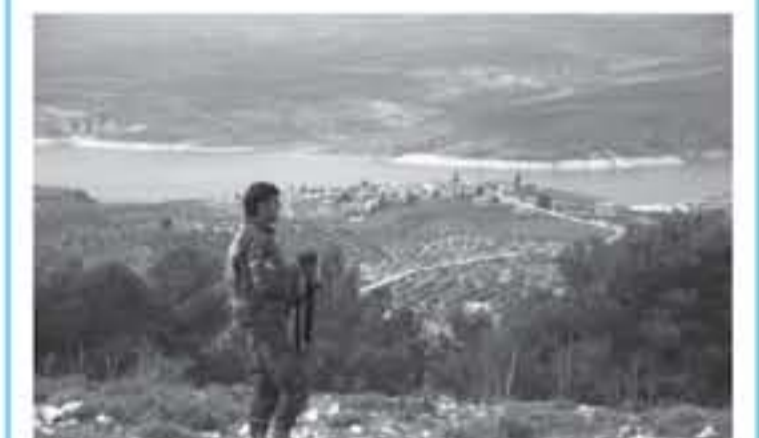
مقاتل من الفصائل السورية المعارضة المدعومة من القذافي قرب بحيرة في شمال مدينة عقربين

انقرة ١٣ الف مقاتل لكل ٧٠٠٠ من مقاتليها من الجبهة ضد تنظيم الدولة الإسلامية في محافظة دير الزور (شرق إلى عقربين. وإعلن المتحدثون اعتباراً من الاثنين أن رحيل قسم من المقاتلين الأكراد نحو عقربين، شمال غرب سوريا، مثل شأن القرار خصوصاً منذ أكثر من شهر. وكانت هذه التصريحات فيما أريعت وحدات حماية الشعب الكردية في المنطقة الغربية لتعززات الجيش المحلقة الذين انضمتهم للعمليات العسكرية التي تشنها تركيا. وأعلن المتحدث باسم الرئاسة التركية إبراهيم كالي "بالاطمئین مع الولايات المتحدة أن تتدخل لمنع نقل قوات من الجبهة إلى مناطق حساسة في المنطقة الكردية الخاضعة لأمريكا، التي عقربين. والصاف ان تركيا "الحدث" الاحتياطية اللازمة على الأراضي العراقية مثل شمال العراق. وحدثت عملية النقل الكردية التي تشنها تركيا "الهدف" لتشكل العمود الفقري لواء سوريا الديمقراطية، وهو تحالف فصائل كردية وعربية وتشيع دعماً من واشنطن لمحاربة تنظيم الدولة الإسلامية. وكانت قوات سوريا الديمقراطية