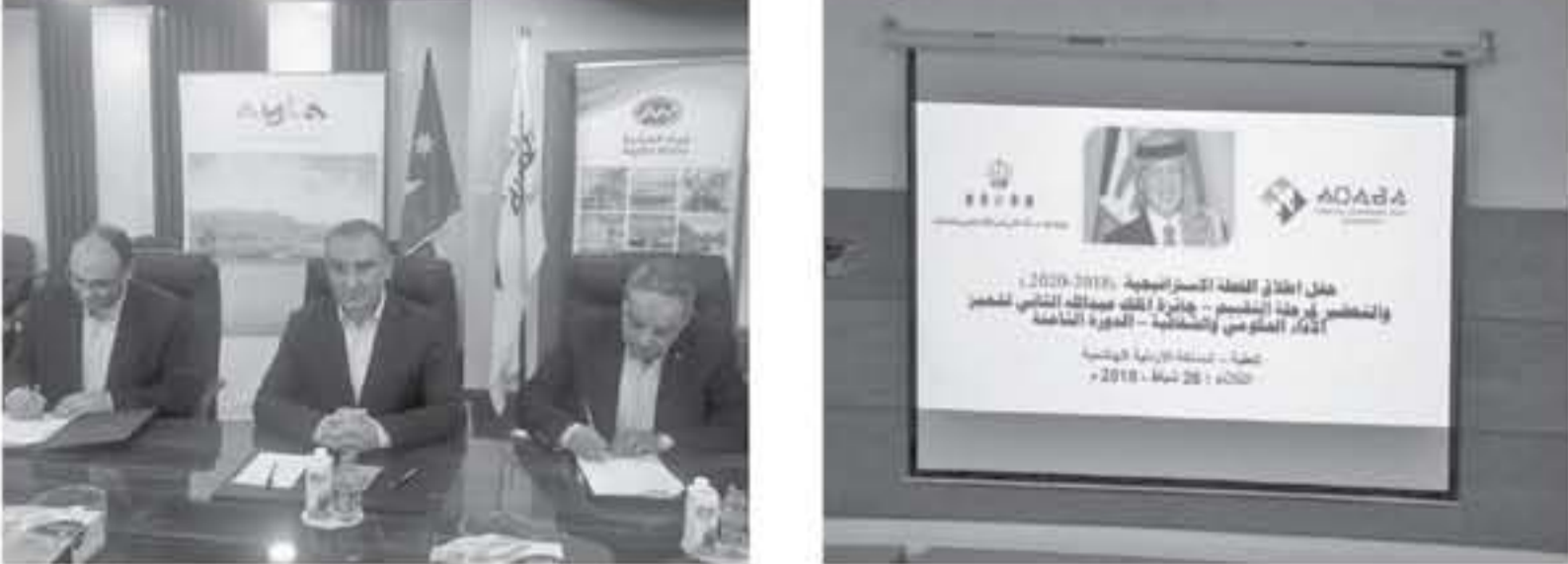
العقبة - الأنباط - خاص