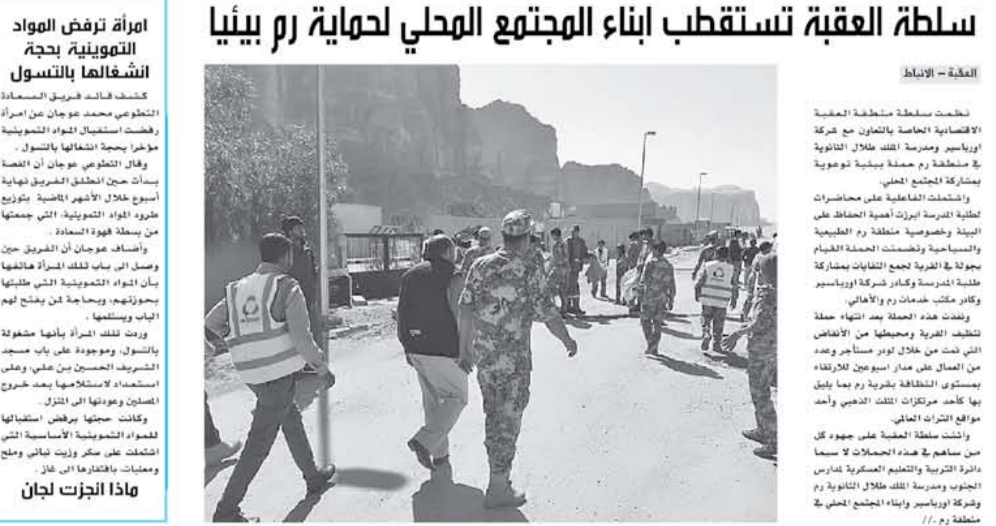
العقبة - الأنباط

في حملة نظمتها بالتعاون مع التعليم العسكري واورباسير سلطة العقبة تستقطب ابناء المجتمع المحلي لاهمية رم بيئي