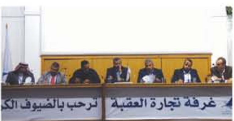
غرفة تجارة العقبة ترحب بالضيوف الكرام

العقبة - طلال الكباريتي تظمت جمعية ديوان أبناء بئر السبع الخيرية مؤخرا جلسة حوارية مع مجلس المحافظة استضافتها غرفة تجارة العقبة ، وركزت أوراق النقاش على مناقشة احتياجات المدينة من تطوير قطعي التعليم والصحة بالإضافة الى البيئة التحتية للمدينة والتسابق مع الزمن بانطلاق تنفيذها في ظل ما تعانيه المدينة في تلك المجالات .