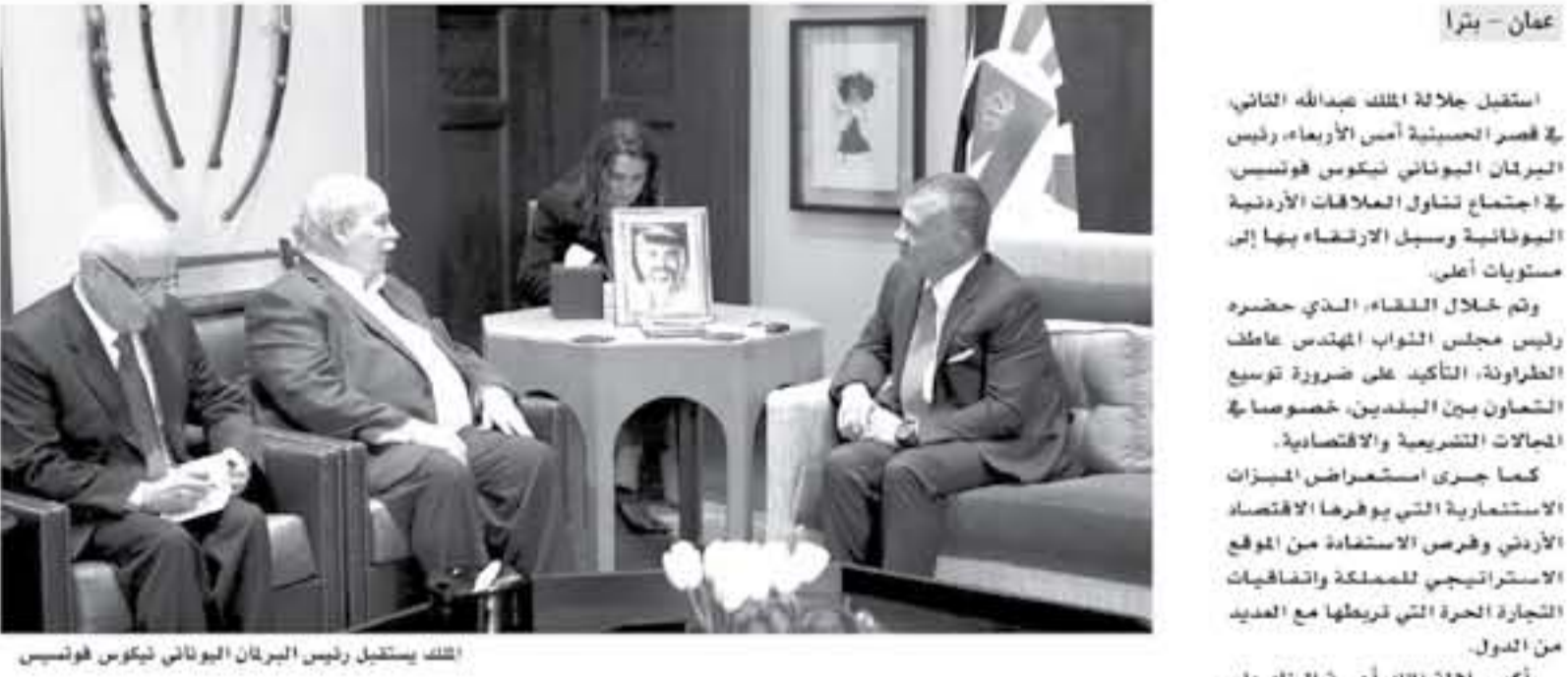
عمان - بترا