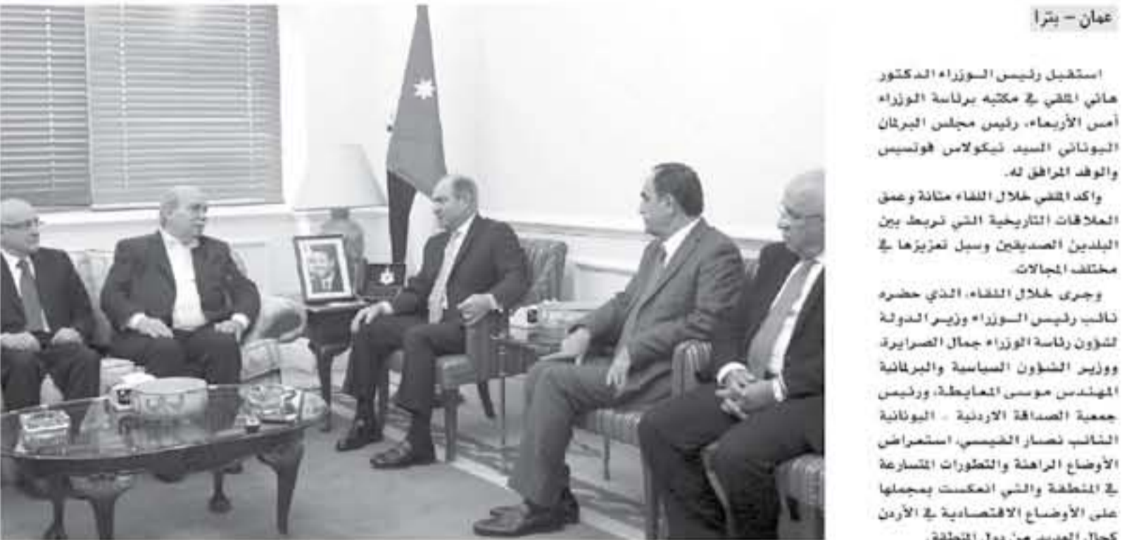
عمان - بترا