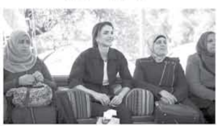
عمان - بترا