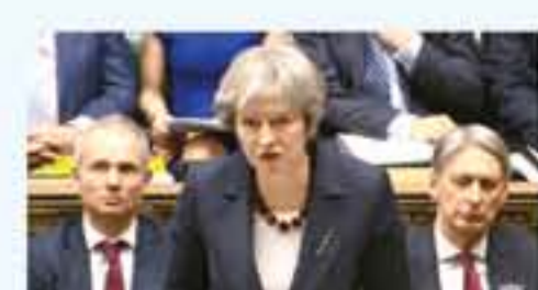
ماي رئيسة وزراء بريطانيا تصعيد التوتر بين البلدين قبل ايام على الانتخابات الرئاسية في روسيا الاحد والتي يعتبر فيها الرئيس فلاديمير بوتين الاوفر حظا بالفوز وقبل اشهر على كأس العالم لكرة القدم في روسيا . وقالت ماي "كل من انتصف من روسيا فرصة تقديم تفسير لكن ره فعلها يتطوي على استخفاف تام بهذه الاحداث الفادحة" مشددة على "انهم لم يقدموا اي تفسير موثوق" ، واضافت ماي "بدلا من ان يقوموا بذلك ، نعلموا مع استخدام غاز الاصعب العسكري في اوروبا وبحرية وازدياد زخمه .

لندن - الف ب اعلنت رئيسة الوزراء البريطانية تريزا ماي امس الاربعاء سلسلة عقوبات ضد روسيا بينها طرد ٢٣ دبلوماسيا وتجميد العلاقات الثنائية معترفاً بمسؤولية موسكو عن تسميم الجاسوس الروسي السابق على ارضها .