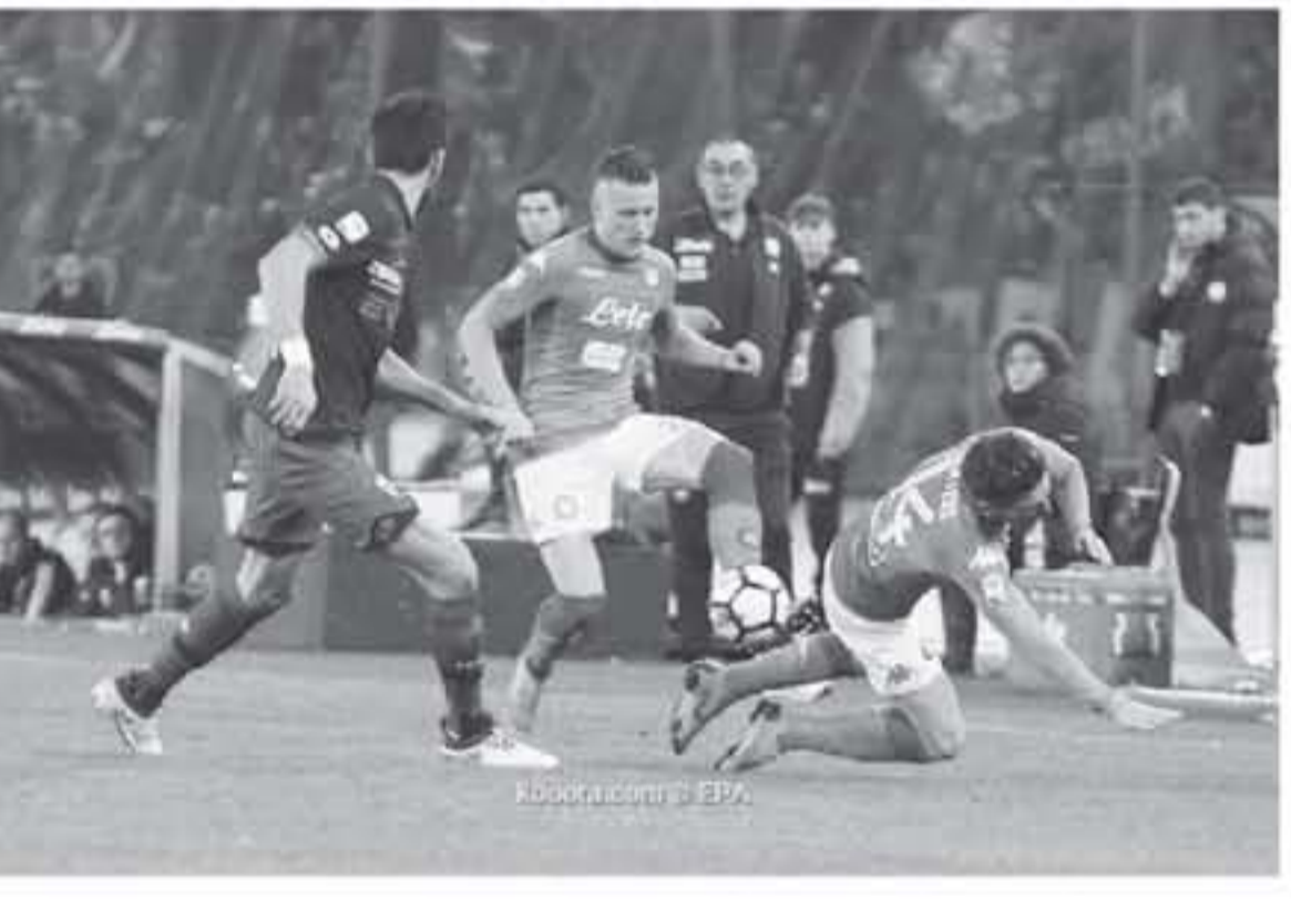
روما - وكالات

عاد نابولي لمزاحمة يوفنتوس على الصدارة في دوري الدرجة الأولى، في المباراة التي أقيمت بين الفريقين في ملعب سانتا لوجيا، حيث حقق نابولي الفوز بنتيجة 2-1 على يوفنتوس، مما يضعه في المركز الثاني، خلف يوفنتوس الذي يحتل الصدارة. المباراة شهدت هدفين من قبل نابولي، بينما سجل يوفنتوس هدفين أيضاً. المباراة أقيمت في ملعب سانتا لوجيا، بحضور عدد كبير من المشجعين. المباراة انتهت بنتيجة 2-1 لفavor نابولي، مما يجعله يتقدم على يوفنتوس في الترتيب. المباراة شهدت عدة أحداث، بما في ذلك تدخلات الحكام وحوادث بين اللاعبين. المباراة كانت مثيرة للاهتمام، خاصةً مع الأداء القوي من قبل كلا الفريقين. المباراة انتهت بفوز نابولي، مما يجعله يتقدم على يوفنتوس في الترتيب. المباراة شهدت عدة أحداث، بما في ذلك تدخلات الحكام وحوادث بين اللاعبين. المباراة كانت مثيرة للاهتمام، خاصةً مع الأداء القوي من قبل كلا الفريقين. المباراة انتهت بفوز نابولي، مما يجعله يتقدم على يوفنتوس في الترتيب.