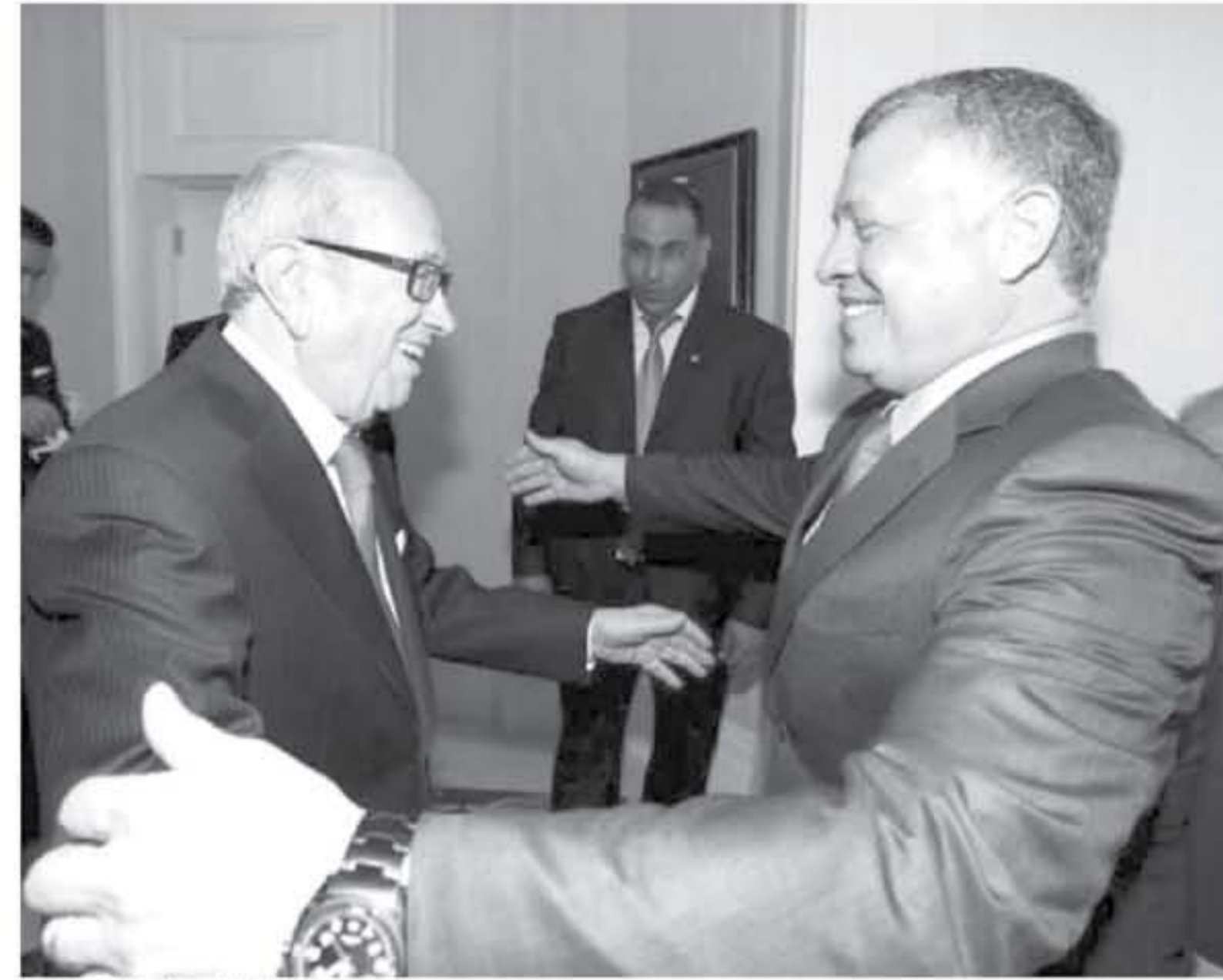
لقاء القائلين في عمان أكتوبر 2018