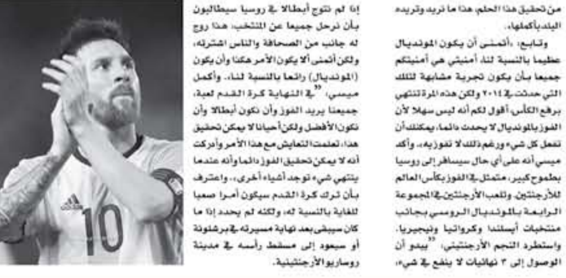
برشلونة - وكالات

أكد ليونيل ميسي، قائد ونجم المنتخب الأرجنتيني الدولي، أن حلمه هو الفوز بكأس العالم في روسيا 2018. ميسي، الذي قاد بلاده للفوز بكأس العالم في 2014، أعرب عن رغبته في قيادة المنتخب الأرجنتيني للفوز بكأس العالم في روسيا. ميسي، الذي قاد بلاده للفوز بكأس العالم في 2014، أعرب عن رغبته في قيادة المنتخب الأرجنتيني للفوز بكأس العالم في روسيا. ميسي، الذي قاد بلاده للفوز بكأس العالم في 2014، أعرب عن رغبته في قيادة المنتخب الأرجنتيني للفوز بكأس العالم في روسيا.