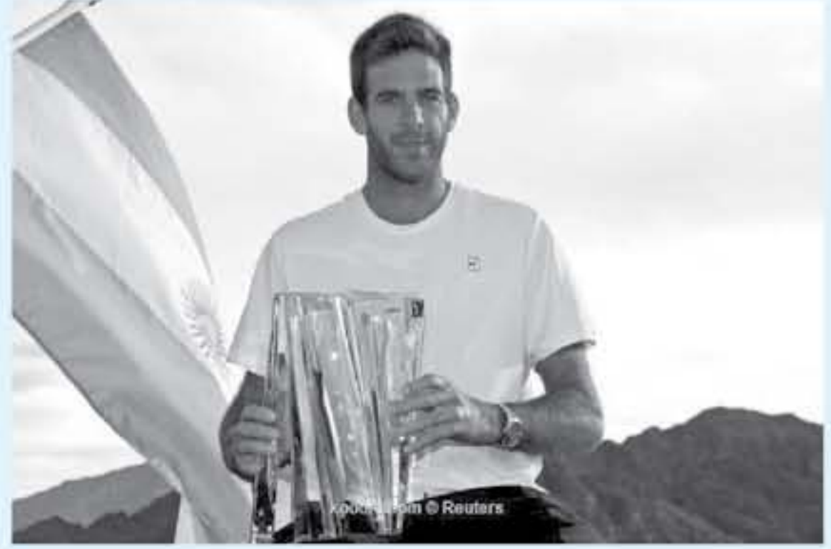
لندن - وكالات

توج الأرجنتيني خوان مارتن ديل بوترو بلقب بطولة إنديان للتس، وهو لقب جديد في عالم التنس. ديل بوترو، الذي حقق هذا اللقب في بطولة إنديان للتس، أصبح اللاعب رقم 10 في التصنيف العالمي. ديل بوترو، الذي حقق هذا اللقب في بطولة إنديان للتس، أصبح اللاعب رقم 10 في التصنيف العالمي. ديل بوترو، الذي حقق هذا اللقب في بطولة إنديان للتس، أصبح اللاعب رقم 10 في التصنيف العالمي.