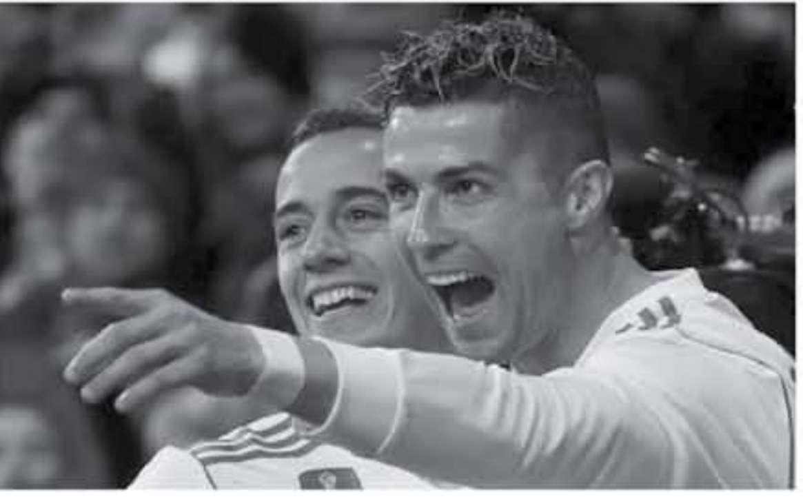
مريد - وكالات

تصدر فوز برشلونة على أتلتيك بيلباو بشانقية نظيفة، والكتشاع ريبال مدريد لجيرونا بنتيجة 3-1 أغلفة الصحف الإسبانية، الصادرة صباح امس، وركزت صحيفة «ماركا» على الرياضية التي سجلها البرتغالي كريستيانو رونالدو، وضوت «الرائع» - رباعية كريستيانو، وتابعت «في 13 كانون ثان الماضي، كان الشون يهتف في أصداق، الآن وصل إلى 22 هدفاً وأصبح المرافق مع ميسي 3 أهداف فقط، وأبرزت الصحيفة، موازنة رونالدو، تسجيل الأهداف في دوري الأبطال والليجا، بعدما أحرز 21 هدفاً في آخر 11 مباراة، وعكشت الصحيفة، على فوز برشلونة على بيلباو، وقالت «برشلونة يترأس الليجا، وفيربايل يسانده بالفوز على أتلتيكو مدريد في الدقيقة 11، وعلى غلاف صحيفة «أس» - جاء العنوان مختلفاً أهداف في البرميديو.. كريستيانو يتربص من ميسي يشارك أهداف، وأضاحت «رونالدو أحرز 22 هدفاً في الليجا، وتخطى لويس سواريز صاحب 21 هدفاً، ويهتف المنافسة على لقب الهداف مع ميسي، وعن هزيمة أتلتيكو مدريد من فيربايل، أشارت إلى تراجع فرض فريق سيموني بالانحل، ببرشلونة، الذي لم يهد أي خيارات لأتلتيك بيلباو في مبارياته، أما