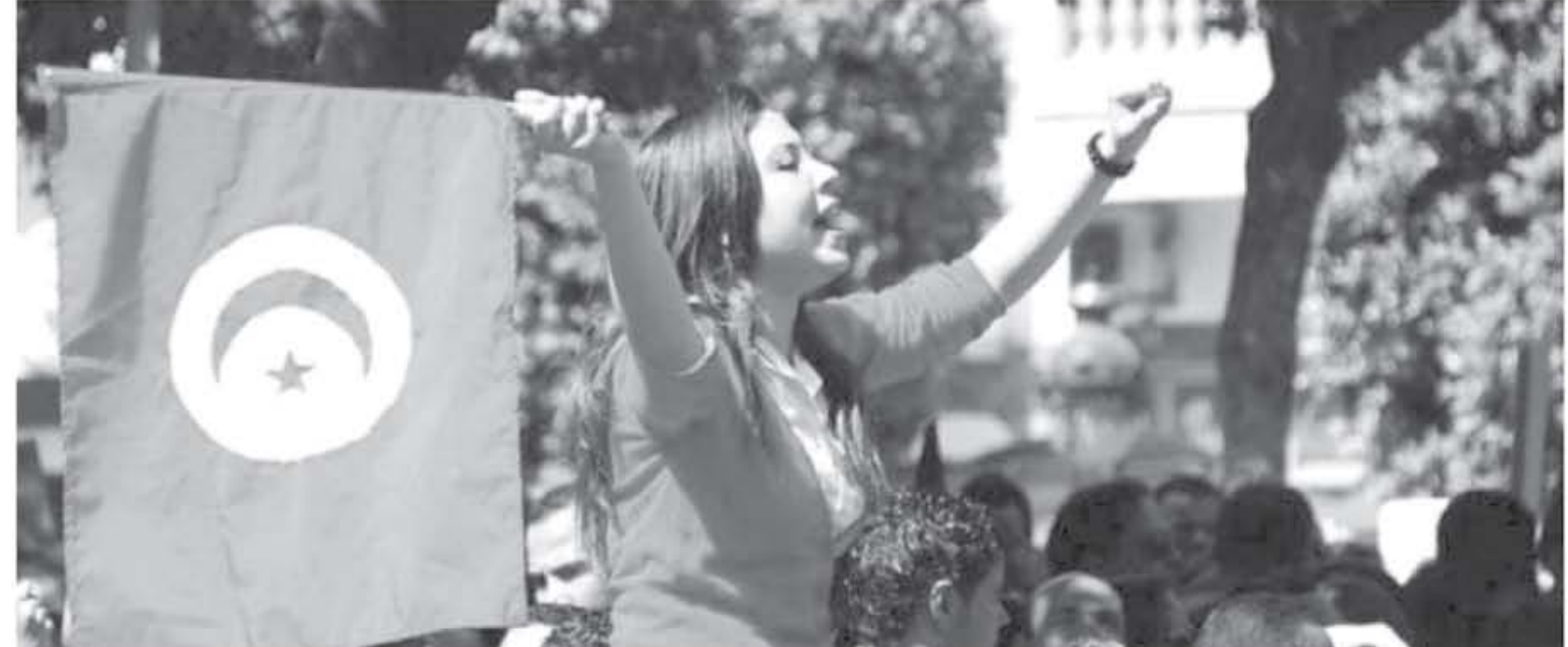
شباب تونس والاحتفال بالثورة