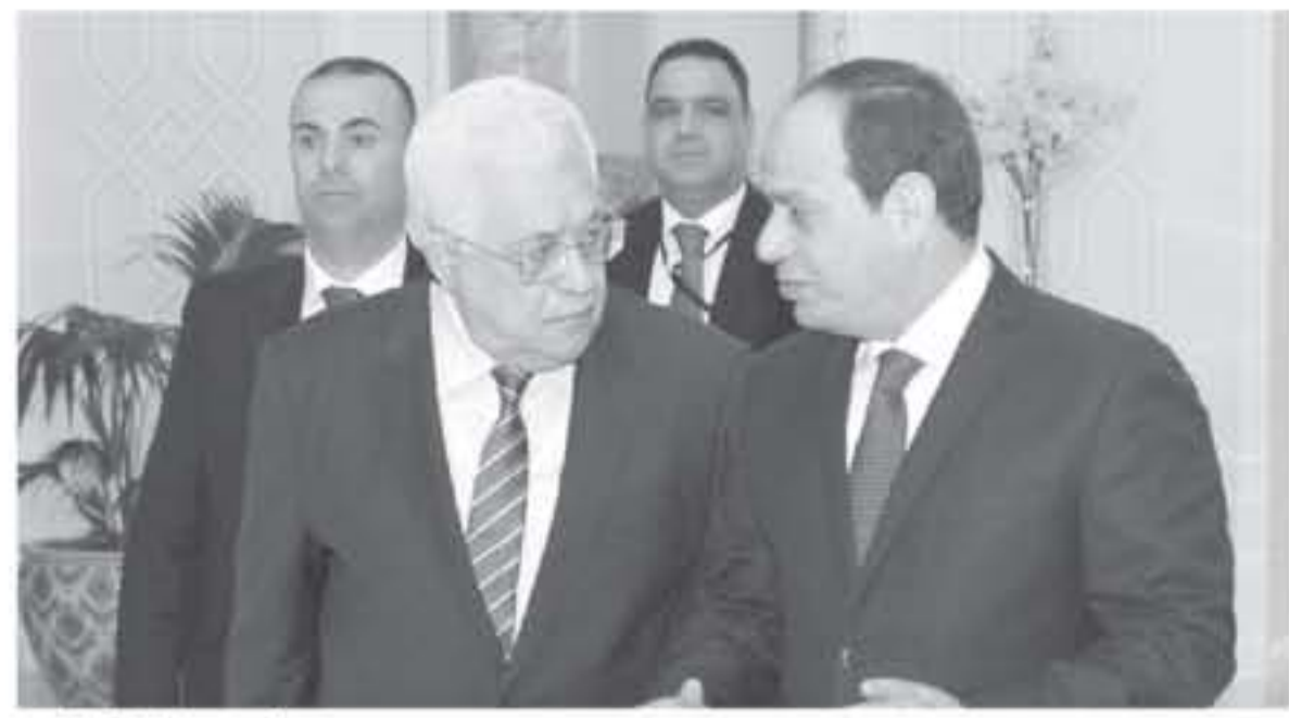
القاهرة - صفا