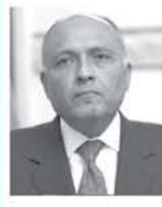
القاهرة - صفا