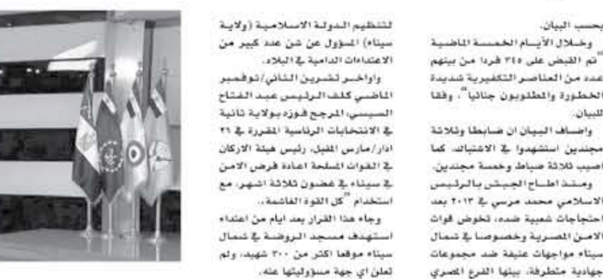
القاهرة - أ ك ب