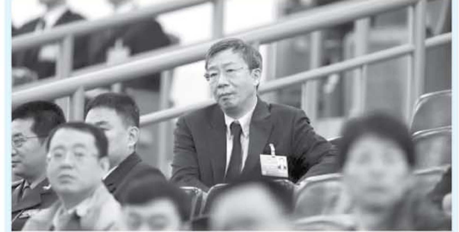
حاكم مصرف المركزي الصيني الجديد في شانغ تائه جلسة انعقاد جلسة البرلمان في بكين