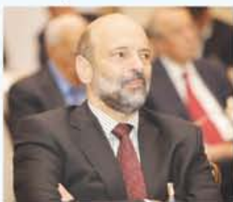
الحاجة الملحة لوجود مادة الفيزياء ضمن الخطة الدراسية لطالب التوجيهي الفرع العلمي، حيث انها تدخل في جميع جوانب الحياة وفي كافة الأصعدة

سواء أكانت "التكنولوجيا الكهربائية النووية، علم الحركة، علم الضوء والوجات الصوتية برصد الظواهر الطبيعية في الفضاء، الحرارة والموالغ والاتصالات والالكترونيات). أما عن أهمية العلوم الحياتية اعتبر التجمع أهمية المادة بأني انطلاقا من الحاجة لمراسة الخلايا والجينات بالإضافة لضرورة دراسة الأساليب المستخدمة في العمليات الكيميائية، وعالم التباينات والحيوانات، حيث تعد مادة الأحياء علم دراسة الكائنات الحية. وتضمنت التوصيات أيضا الحديث عن أهمية الكيمياء في حياة الطالب وذلك باعتبارها مادة تعنى بدراسة خواص المادة وبنيتها وتركيبها علاوة عن أهمية دراسة الطاقة في الحياة اليومية، والصناعات الكيميائية المتمثلة بصناعة المعطور والمنظفات والهندسة الكيميائية.