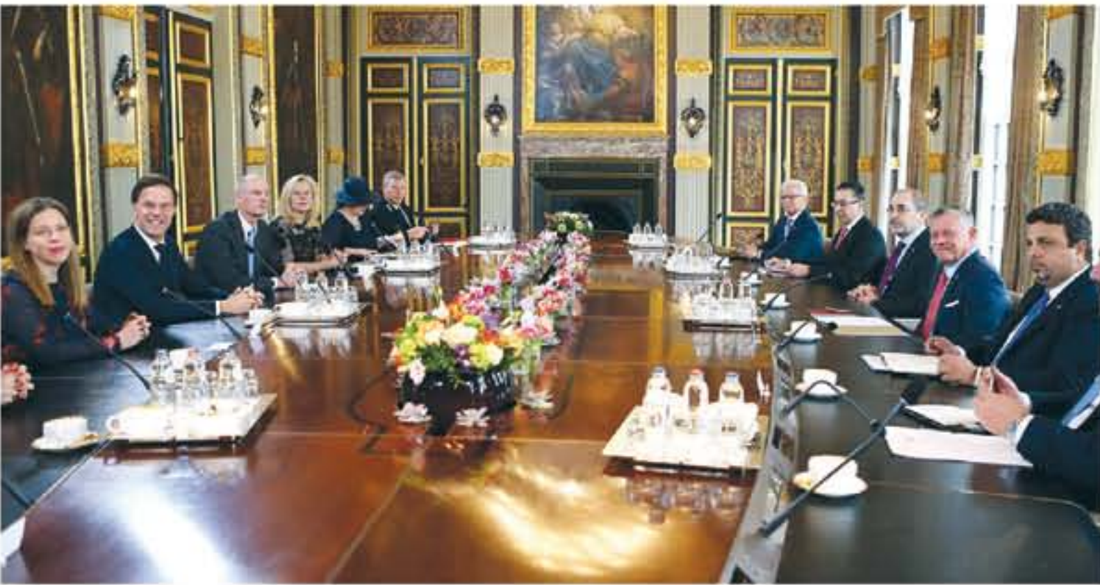
الملك يجري مباحثات مع رئيس الوزراء الهولندي في لاهاي

« الأردن ينتهج سياسة اقتصادية منفتحة على العالم » « هولندا تعتبر الأردن أولوية لبرنامج التعاون التمهوي »