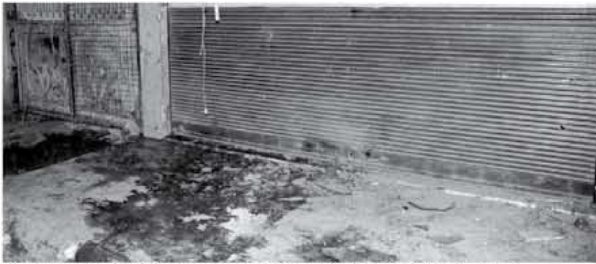
محل الجاني في سوق شعبية في ضاحية دمشق استهدفتها قنبلة صاروخية من السيطرة على ٨٠٠ في المئة منها.

المدنفة في عدد من مشاع دمشق، ارتفعت حصيلة قتلى القذافية الصاروخية التي أطلقتها المصالحات المعارضة على سوق شعبية في ضواحي دمشق مساء الثلاثاء الـ ١٤ هجديا، ومدنيا، وفق ما أوردت وكالة الأنباء السورية الرسمية (سانا) اسم الأرماء، واستشهد مساء الثلاثاء ٢٥ شخصا في القذيفة التي سقطت على سوق في حي كتكول على أطراف ضاحية جرمانا في شرق دمشق. وشاهد مراسل وكالة فرانس برس داخل النشقة قاعة تضم عشرين سرياً على الأقل وضعت عليها جثث الشهداء التي لم تتسع لها السوريات، وعليها القنوة بنوية اللون فيما كان طبيب فرسي يتولى الكشف عنها. من الجرحى في منازل في الأقسام العلوية