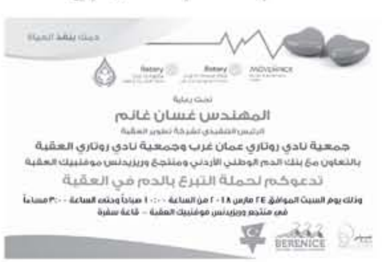
العقبة - الأنباط

تتخذ جمعية نادي زوتاري عمان غرب وصحيفة لنادي زوتاري العقبة بالتعاون مع بنك الدم الوطني ومنتخب فريق كرة قدم لطلاب في موفمبك العقبة، وذلك يوم السبت الموافق 2018-3-24 من الساعة 10:00 صباحاً حتى الساعة 12:00 ظهراً في مستشفى موفمبك العقبة - قاعة صلبة.