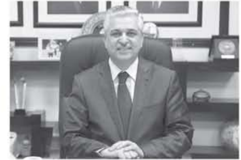
العقبة - الأنباط - نعتت الخورة