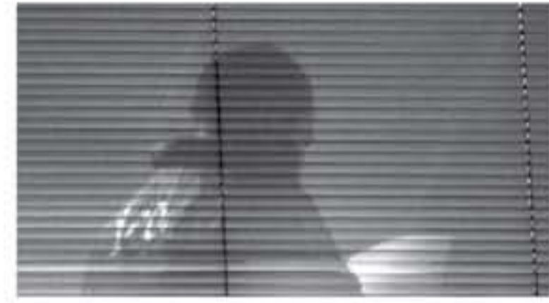
لندن - وكالات

فتحت السلطات البريطانية مكاتب شركة كاسبريف أناليتيكا لتحويل البيانات في لندن، وذلك بسبب ما أثيره تتعلق بفضيحة جمع بيانات من أشخاص دون موافقتهم.