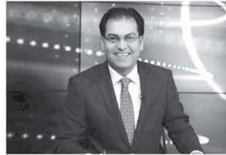
العقبة - الأنباط - نعتت الخورة