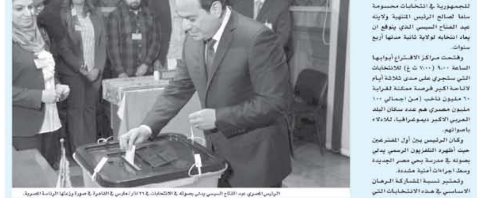
الرئيس المصري عبد الفتاح السيسي يولي سؤله في الانتخابات، في ٢٢ آذار/ مارس، في القاهرة. في صورة لوكمان الرئاسية المصورة.