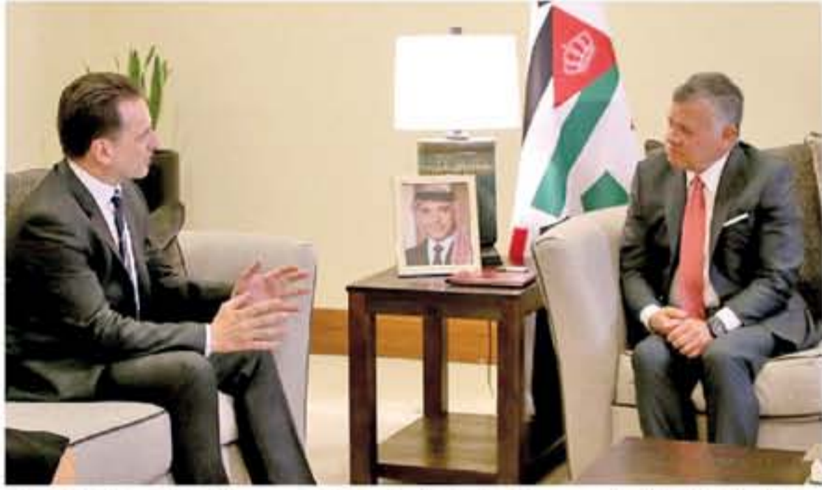
جائزة نوبل للسلام واللغة من أجل الأطفال ٢٠١٨ - منطقة البحر الميت.