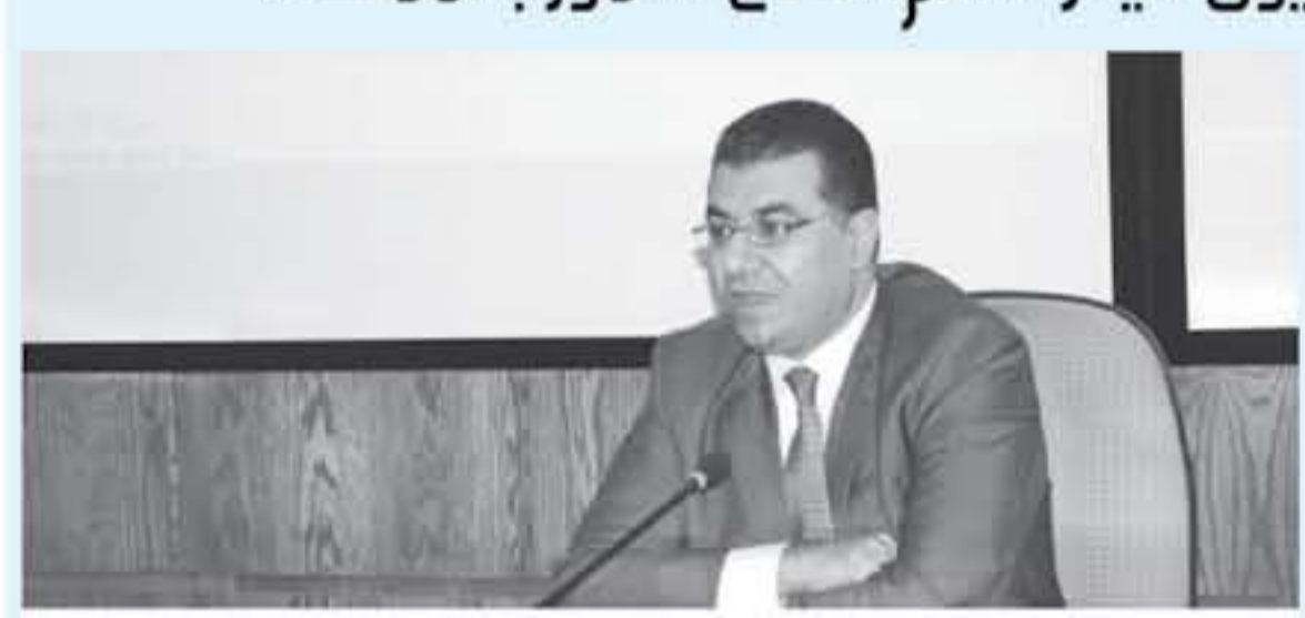
ألقى وزير الزراعة المهندس خالد الحنيفات إن الوزارة تحتضن فوراً برامج التنمية الزراعية، وذلك في إطار الاجتماعات التي تعقدتها الوزارة بالتعاون مع المجتمع الدولي.

قال وزير الزراعة المهندس خالد الحنيفات إن الوزارة تحتضن فوراً برامج التنمية الزراعية، وذلك في إطار الاجتماعات التي تعقدتها الوزارة بالتعاون مع المجتمع الدولي. وشدد الحنيفات على أهمية توفير بيئة آمنة ومستقرة للاجئين، بالتعاون مع المجتمع الدولي. وأضاف الحنيفات أن الوزارة سيبذل كل ما في وسعه لتوفير بيئة آمنة ومستقرة للاجئين، بالتعاون مع المجتمع الدولي.