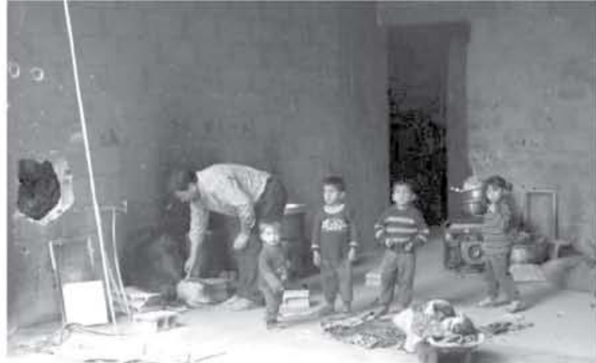
انتقال سوريون من منجيا في ٢٥ آذار/ مارس في دوما بغوطة الشرقية.