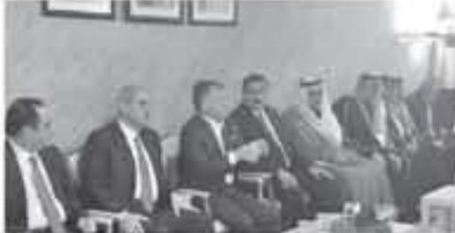
زار جلالة الملك عبدالله الثاني أمس الاثنين محافظة المفرق والتقى جلالته خلال الزيارة بمجموعة من أبناء وشخصيات المحافظة في منزل الباشا تاييف الزويد الحزامنة.