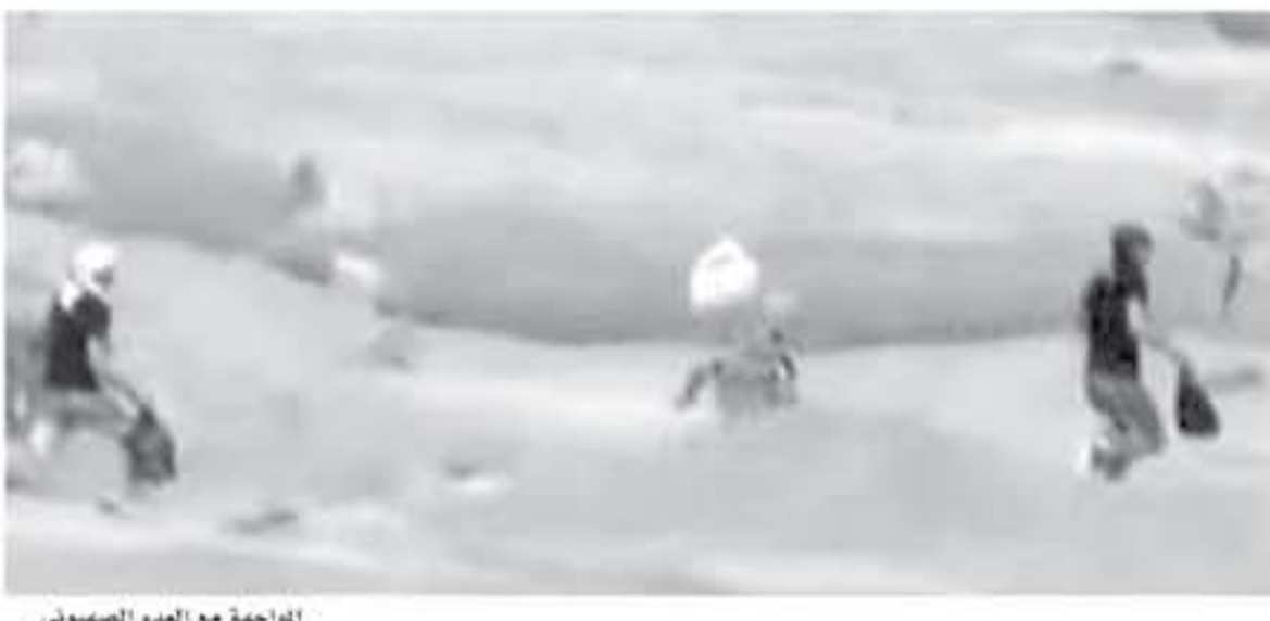
الأجوبة مع العدو الصهيوني

عسكرية واسعة في قطاع غزة، وأصبح أن كتائب النضال قامت أمس بتسليم إطلاق نار بالرشاشات الثقيلة، شيئا إلى أنه حسب وصف الجيش فإن العملية «موجهة ومقصودة ومحظوظ لها مسبقا ومن معرفة وقبلة ما إلى أن» المتحدون على خطورتها لم يقابلا بمره كبير من الجيش، ولكن في كل من الممكن أن يجر نواجة، لكن في نفس الوقت حفقت لحماس إبحار كبير ومهم. وتذكر أنه «إذا ما أردنا تيسيط الأمور أكثر، فنعلم أن ما حدث كان محظوظ له إسرائيل أي صواريخ، وخمس الجيش صواريخ تحلق في الموضوع لمعرفة سبب تفعل القبة الحديدية».