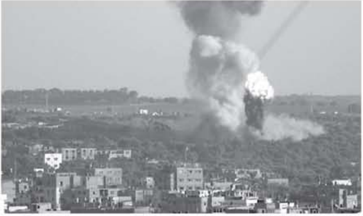
القصف الاسرائيلي لشوارع غزة في ٢٦ آذار/ مارس في دوما بغوطة الشرقية.