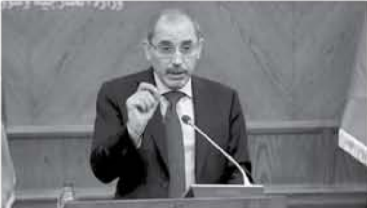
ألقى وزير الخارجية وشؤون المغتربين أيمن الصفدي أمس الاثنين، في المملكة الأردنية، خطاباً بمناسبة اليوم العالمي للاجئين، وذلك في إطار الاجتماعات التي تعقدتها الحكومة الأردنية بالتعاون مع المجتمع الدولي.

أكد وزير الخارجية وشؤون المغتربين أيمن الصفدي أمس الاثنين، في المملكة الأردنية، خطاباً بمناسبة اليوم العالمي للاجئين، وذلك في إطار الاجتماعات التي تعقدتها الحكومة الأردنية بالتعاون مع المجتمع الدولي. وشدد الصفدي على ضرورة الحفاظ على سلامة اللاجئين، مؤكداً أن الأردن سيبذل كل ما في وسعه لتوفير بيئة آمنة ومستقرة للاجئين، بالتعاون مع المجتمع الدولي. وأضاف الصفدي أن الأردن سيبذل كل ما في وسعه لتوفير بيئة آمنة ومستقرة للاجئين، بالتعاون مع المجتمع الدولي.