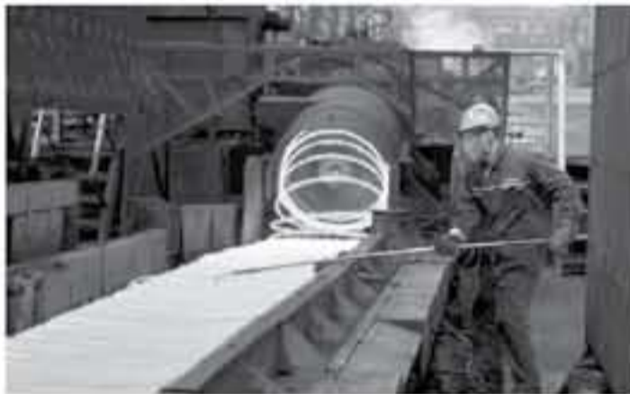
مؤلف صيني يعمل في مصنع للصلب في وينج في شرق الصين