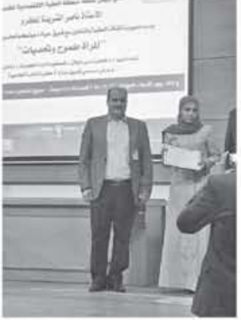
أدى ضمن نشاطات وزارة الشباب يحصل في كل نشاط على نقطة.