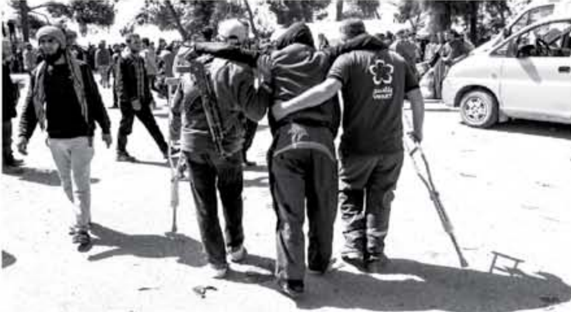
ملاح سوري يحمل ريشة شاة فيها يساعد متعرج جرحيا عند وصولها إلى قلعة الخليل بعد عملية الإجلاء من الغوطة الشرقية في 17 آذار/مارس.

وكانت مصادر معارضة أفادت ويبدو أن موسكو خيبت جيش الإسلام بين الهجوم العسكري أو الخلق بركب المناطق الأخرى والوقوف على الأقدام. ويقترب من عقد اجتماع بين اللجنة المعنية بمخلف المفاوضات والجانب الروسي. - 1٢٨ ألدناج - وفي جنوب الغوطة الشرقية، وعلى خطى الأوبى ومخيم وحسين سيلحقون بهم. يتجمع مسلحون معارضون ومعتزلة في حالات تفتح من مدينة عربون إلى قلعة تجمع قريبة. وكما حصل في الأيام السابقة، تلقى تلك الحالات مساعدات طبية بانتظار اكتمال التغطية قبل منحها الضوء الأخضر للانطلاق باتجاه محافظة إدلب في شمال غرب البلاد. وهو أمر يحتاج ساعات طويلة، ولا تتحقق القاطلة عادة قبل منتصف الليل. المفاوضات وبرنامج جيش الإسلام من الرسمية (سلمان) أن حافلة على منتهى ١٠٥٣ شخصاً بينهم ٢٢٩ إرهابياً "باتت جاهزة للانطلاق. وأعاد مصدر معارض فرانس برس مائدة جوش الإسلام في المفاوضات لتتولى بقاءه متفاناً في دوما على أن تتم العملية بحدود موحدة مع عودة مؤسسات الدولة إليها. واعتبرت روسيا في حياضها على وجه التحديد "إصدار علو عام" والتمسك بحرية الحركة من وإلى المنطقة.