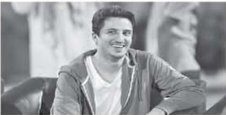
جدة - وكالات