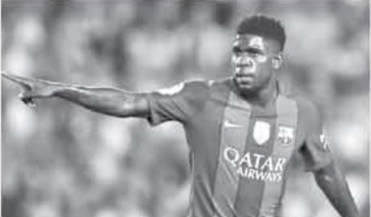
برشلونة - وكالات