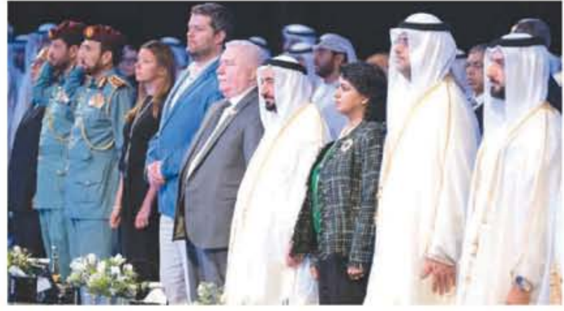
الشارقة - الانباط

شهد صاحب السمو الشيخ الدكتور سلطان بن محمد القاسمي عضو المجلس الأعلى حاكم الشارقة وبحضور سمو الشيخ سلطان بن محمد بن سلطان القاسمي ولي عهد نائب وحاكم الشارقة الجلسة الافتتاحية لفعاليات الدورة السابعة من المنتدى الدولي للاتصال الحكومي التي أقيمت صباح أمس تحت عنوان "الحكومات والقطاع الخاص.. مآهياتها وطبيعة الأدوار المناطة بها في عصر المجتمع الرقمي". في مركز إكسبو الشارقة. وشارك في الجلسة مصطفى الخلفي الوزير المنتدب والتأطق الرسمي باسم الحكومة المغربية وشؤون سويسرا المتحدث السابق باسم البيت الأبيض ونجيب ساويرس الرئيس التنفيذي لشركة أوراسكوم كينيكوم الشاهدية في مصر وأراده الإعلامي محمد حسن خلف مدير عام مؤسسة الشارقة للإعلام. وتناولت الجلسة عدة تساؤلات حول مدى خطورة الشركات العاملة في مجال بيع المعلومات وحساسية العلاقة بين القطاعين الحكومي والخاص وتأثير التحول الرقمي ومواقع التواصل الاجتماعي على المتغيرات الاقتصادية والأمنية والاجتماعية في بلدان العالم.