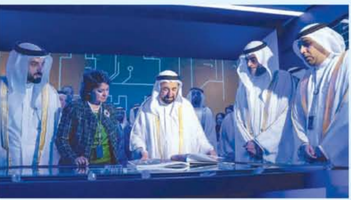
الشارقة - الانباط

افتتح الشيخ الدكتور سلطان بن محمد القاسمي عضو المجلس الأعلى حاكم الشارقة صباح امس الأربعاء فعاليات "المنتدى الدولي للاتصال الحكومي في دورته السابعة" والتي ينظمها المركز الدولي للاتصال الحكومي التابع للمكتب الإعلامي لحكومة الشارقة على مدار يومين في مركز إكسبو الشارقة تحت شعار "الأنفية الرقمية.. إلى أين؟". وأكد الدكتور سلطان بن محمد القاسمي ضرورة تمكين مجتمعاتنا من الأفكار المبتكرة والهدامة التي تؤثر سلباً على التنمية الاجتماعية لأبنائنا وبناتنا، وتوهمهم إلى الصناعات التي تشبه التكنولوجيا الحديثة كميون، سبلية لها. مع أهمية العمل المستقل والابتعاد عن تعارض الشبكات التي عانت من الهزائم، لكنها أصبحت اليوم في مصاف الدول العالمية المتطورة عبر التحول على شمول الاحكام بالهزيمة، والاشتغال بالعلم والمعرفة والوعي المجتمعي.