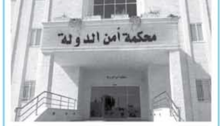
عنان - بترا

التقى وزير الخارجية الأردني ورئيس المندوبين الساعدين في عمان، وزير الخارجية المغربي، في الرياض العاصمة المغربية، وذلك في إطار زيارته للرياض للمشاركة في أعمال مؤتمر الحوار الوطني في المغرب.