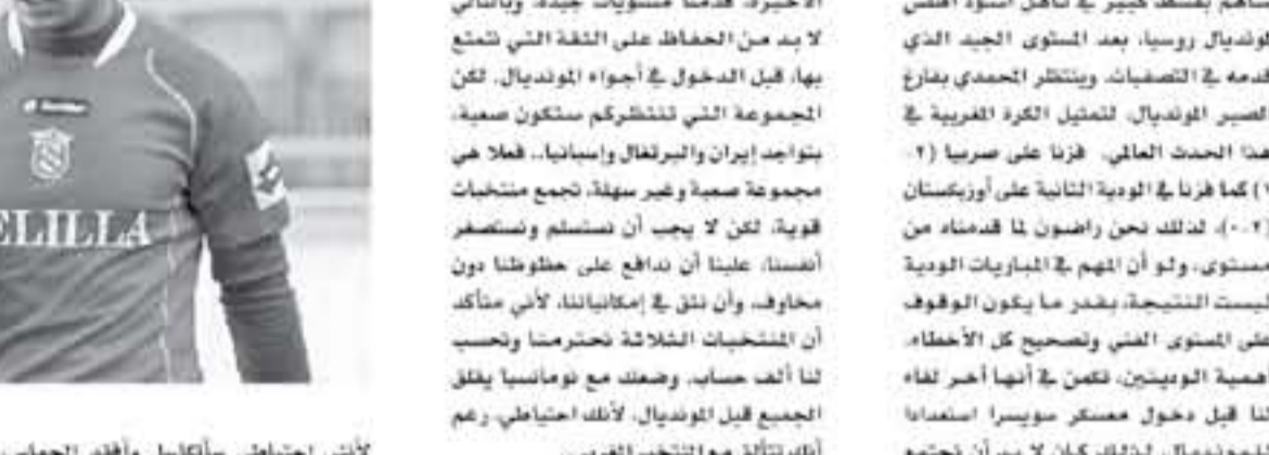
الرباط - وكالات