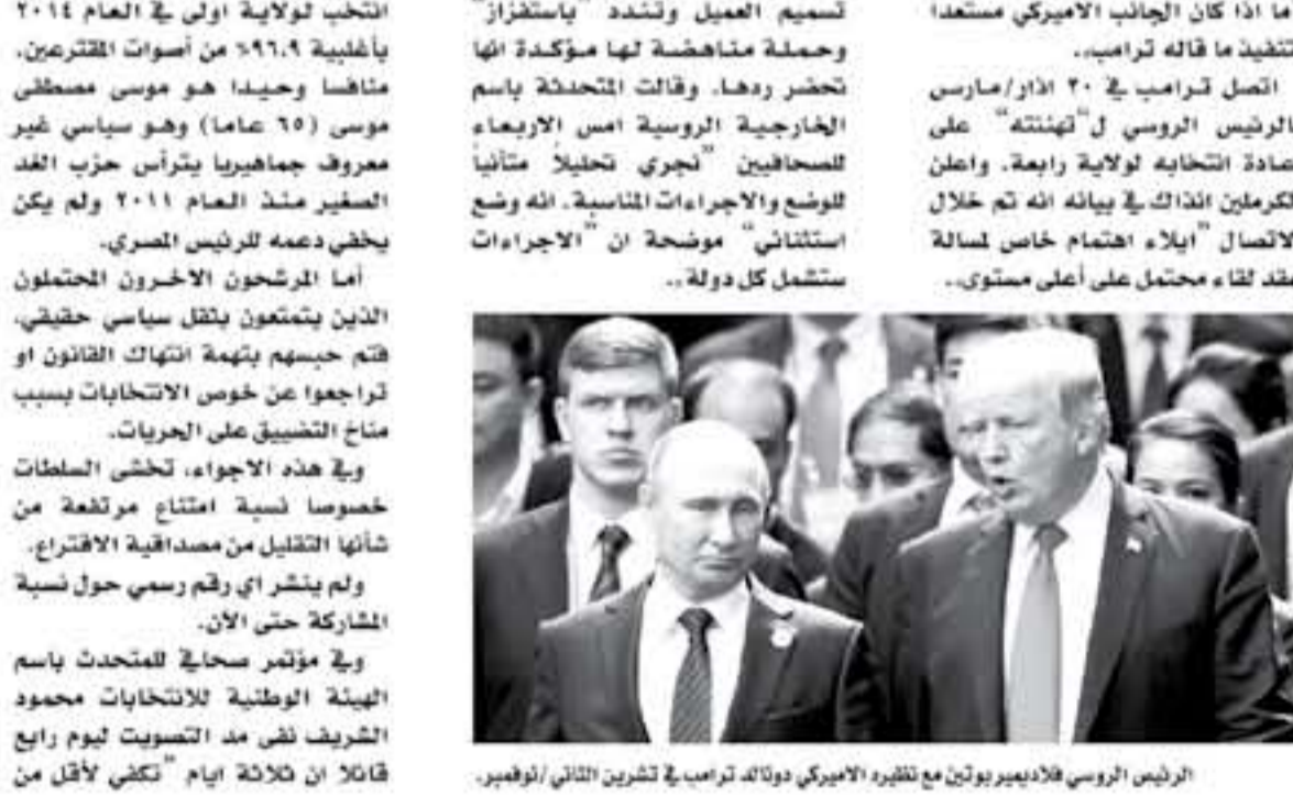
الرئيس الروسي فلاديمير بوتين مع نظيره الأميركي دونالد ترامب في تشرين الثاني/نوفمبر.

تكن تراب أمر الاثنين بطرد روسيا باختيارهم "جوسيس" في أكبر عملية طرد دبلوماسي روس من الولايات المتحدة ودا على قضية تسليم العميل السابق سكريبال وإبنته بيولا في ٤ آذار/مارس في سالتزبرج والذي ألتمت لندن موسكو بالوقوف وراءه. وقررت أكثر من ٥٠ دولة بينها الولايات المتحدة و ١٧ دولة من الاتحاد الأوروبي طرد ما يصل إلى ١١٧ دبلوماسياً روسياً. وردا على سؤال لمعرفة ما إذا كانت موسكو تأثرت بعلميات الطرد هذه قال يسكوف "أنا ٢٠ أو ٣٠ دولة هي فقط في القاهرة وولنا التبرير. ويواجه روسيا أي مسؤولية لها في تسليم العميل وتسليم "سكريبال" وحملة ماخضعت لها محكمة أنها تتلصق والإجراءات المناسبة. إنه وضع استثنائي "موضح أن الإجراءات تستعمل كل دولة".