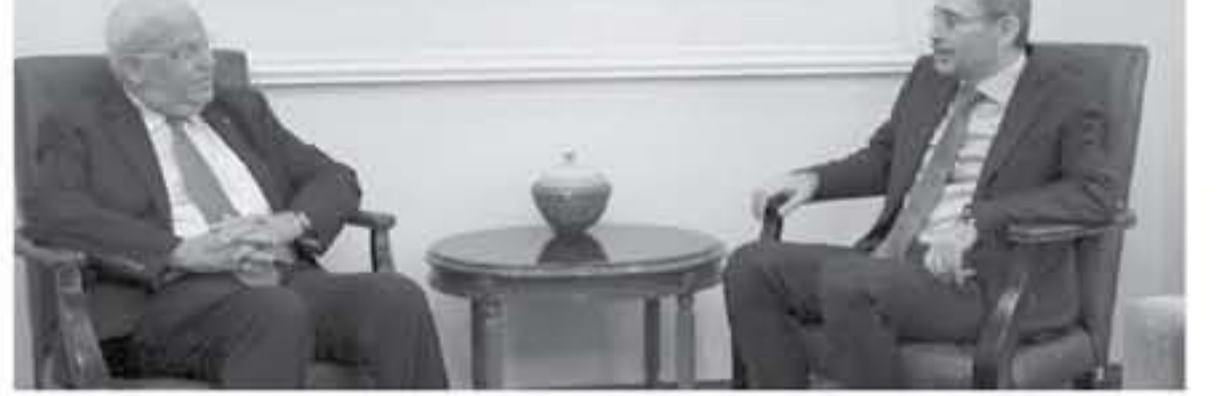
عنان - بترا

التأكيد على أهمية الدور الأوروبي في كسر الجمود الذي تواجهه العملية السلمية