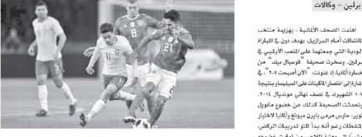
برلين - وكالات

اعلمت الصحف الألمانية، بجزئية متلخ المتعلقة أمام البرازيل، يهدف دون في المباراة الدولية التي جمعتهما على الملعب الألماني في برلين... وسخرت صحيفة "فرسان بيت" من خسارة ألمانيا إذ عرفت: "لأن أسيحت 4-0".