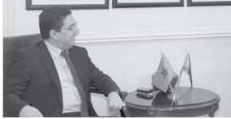
عنان - بترا

التأكيد على أهمية الدور الأوروبي في كسر الجمود الذي تواجهه العملية السلمية