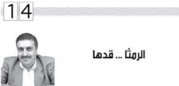
الرمثا ... قدها