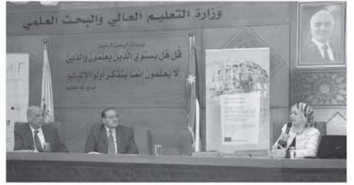
عنان - بترا

قال وزير التعليم العالي والبحث العلمي الدكتور عادل الطوبسي ان اوجه الاتفاق والابداع علميا التركز في اطر المرحلة المقبلة على موضوع الابتكار والابداع استجابة لتطلعات الحكومة الاستراتيجية الاربعة. واضاف الطوبسي خلال افتتاحه اليوم العلمي لصندوق دعم البحث العلمي أمس الاربعاء " حتى نتكمن من الوصول الى الابتكار والابداع علميا التركز في اطر المرحلة المقبلة على موضوع الابتكار والابداع استجابة لتطلعات الحكومة الاستراتيجية الاربعة. واضاف الطوبسي ان الصندوق الذي تم تمويله من قبل وزارة التعليم العالي والبحث العلمي هو من اهم المشاريع التي تدعمها الحكومة في مجال ابحاث العلوم والتكنولوجيا والابتكار والابداع علميا التركز في اطر المرحلة المقبلة على موضوع الابتكار والابداع استجابة لتطلعات الحكومة الاستراتيجية الاربعة. واضاف الطوبسي ان الصندوق الذي تم تمويله من قبل وزارة التعليم العالي والبحث العلمي هو من اهم المشاريع التي تدعمها الحكومة في مجال ابحاث العلوم والتكنولوجيا والابتكار والابداع علميا التركز في اطر المرحلة المقبلة على موضوع الابتكار والابداع استجابة لتطلعات الحكومة الاستراتيجية الاربعة.