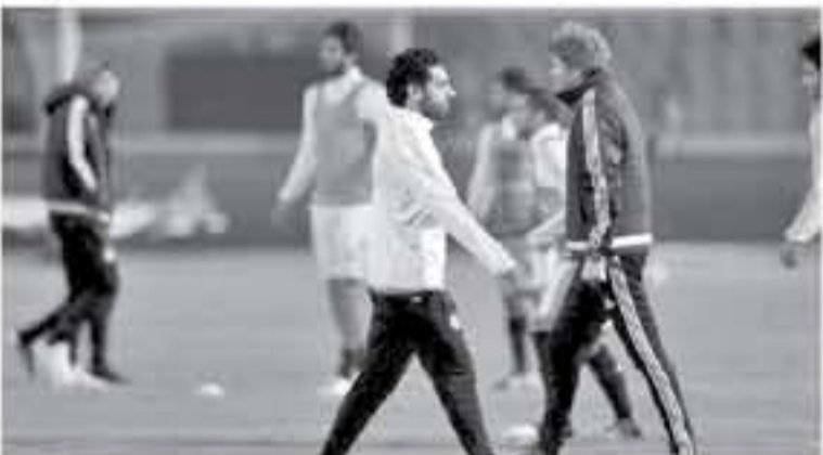
القاهرة - وكالات