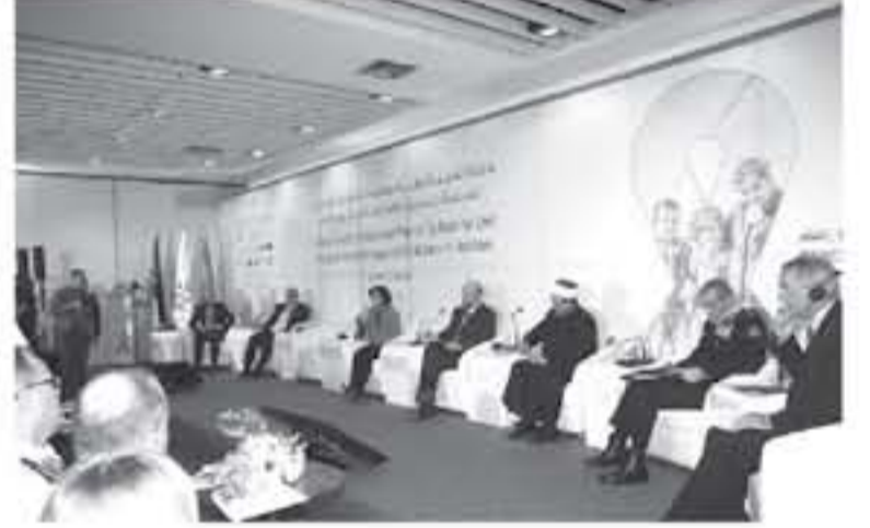
عنان - بترا

أطلق المجلس الوطني لحقوق الإنسان ومنظمة الأمم المتحدة للتربية والعلم والثقافة (يونسكو) بالتعاون مع الشركاء الحكوميين ومديرية الأمن العام والقطاع الخاص، اليوم الأربعاء، خطة عمل وطنية متعددة القطاعات لمدة ثلاث سنوات، تهدف للحد من العنف الجسدي الواقع على الأطفال بالعنف. ويهدف الخطة الى حظر العقاب البدني في جميع الأوساط وتحسين استخدامه إلى الحد من الضيق على الضحايا والفتيات في المنازل والمؤسسات من أجل ضمان حقوقهن الجسدية.