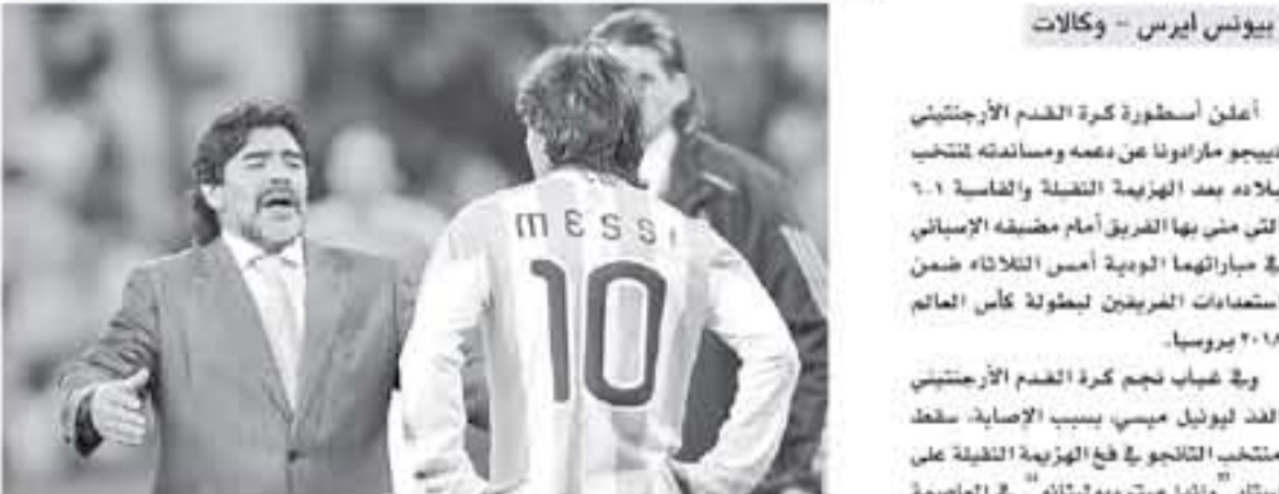
بيونس آيرس - وكالات