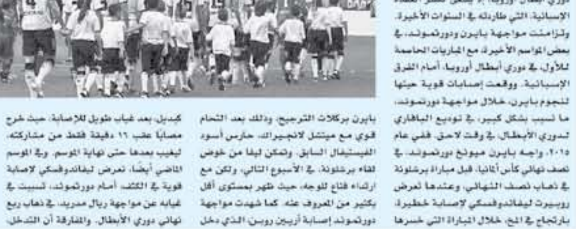
برلين - وكالات