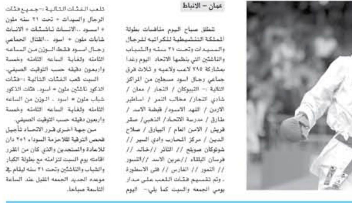
عمان - الألباط

تنطلق صباح الوم منافسات بطولة المهلكة التنشيطية للكراتيه للرجال والسيدات وتحت 21 سنة والشباب والناشئين التي ينظمها الاتحاد الوم وبدا بمشاركة 248 لاعب ولاعبة وثلاث فرق جماعي رجال أسود متجانين من المراكز التالية - النيوكان / النصار / عمان / شادي النصار / محاب النمر / اساطير الالردن / النه الامود / قبضة الالرد / طارق / مدرسة النصار / النهي / ستر فريش / الامن العام / البيارق / صلاح الدين / مركز الشاربات وادي السمير // شوكان صوبع // النائر // الخاند // فرسان البلاء // البحرين الالرد // النصار // التتور // التتور // الفارس // هي الالسطورة - وتم تشجيع فقات اللعب على مدار الوم الجمعة والسبت كما يلي- الوم