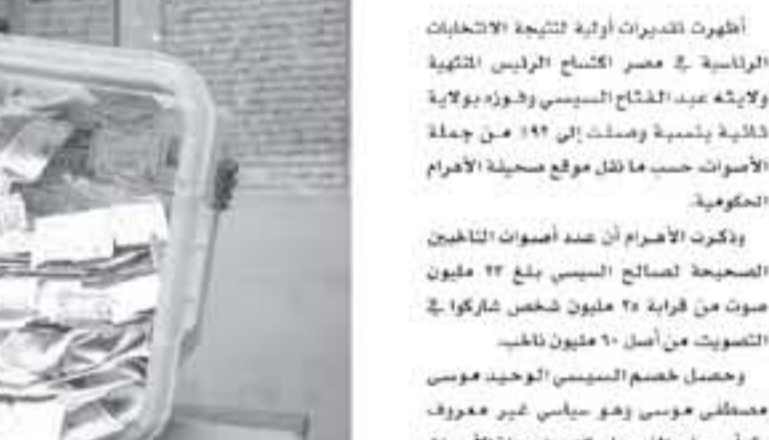
قفر الأصوات بعد ثلاثة أيام من الانتخابات الرئاسية في مصر في ٢٦ آذار/مارس ٢٠١٨

الكل صباحا في صباحها حتى العرافة مساء "انظر لاقبال الناخبين وفق ما افاد مسؤول حكومي معتمدا في القاهرة". وقال مسؤولون من المركز الانتخابي في القاهرة يوم الثلاثاء إن نسبة التصويت في الانتخابات الرئاسية في مصر بلغت حوالي ٩٠ في المئة، وهي أعلى نسبة تاريخية. وقال مسؤولو الانتخابات إن نسبة التصويت في الانتخابات الرئاسية في مصر بلغت حوالي ٩٠ في المئة، وهي أعلى نسبة تاريخية. وقال مسؤولون من المركز الانتخابي في القاهرة يوم الثلاثاء إن نسبة التصويت في الانتخابات الرئاسية في مصر بلغت حوالي ٩٠ في المئة، وهي أعلى نسبة تاريخية. وقال مسؤولون من المركز الانتخابي في القاهرة يوم الثلاثاء إن نسبة التصويت في الانتخابات الرئاسية في مصر بلغت حوالي ٩٠ في المئة، وهي أعلى نسبة تاريخية. وقال مسؤولون من المركز الانتخابي في القاهرة يوم الثلاثاء إن نسبة التصويت في الانتخابات الرئاسية في مصر بلغت حوالي ٩٠ في المئة، وهي أعلى نسبة تاريخية. وقال مسؤولون من المركز الانتخابي في القاهرة يوم الثلاثاء إن نسبة التصويت في الانتخابات الرئاسية في مصر بلغت حوالي ٩٠ في المئة، وهي أعلى نسبة تاريخية.