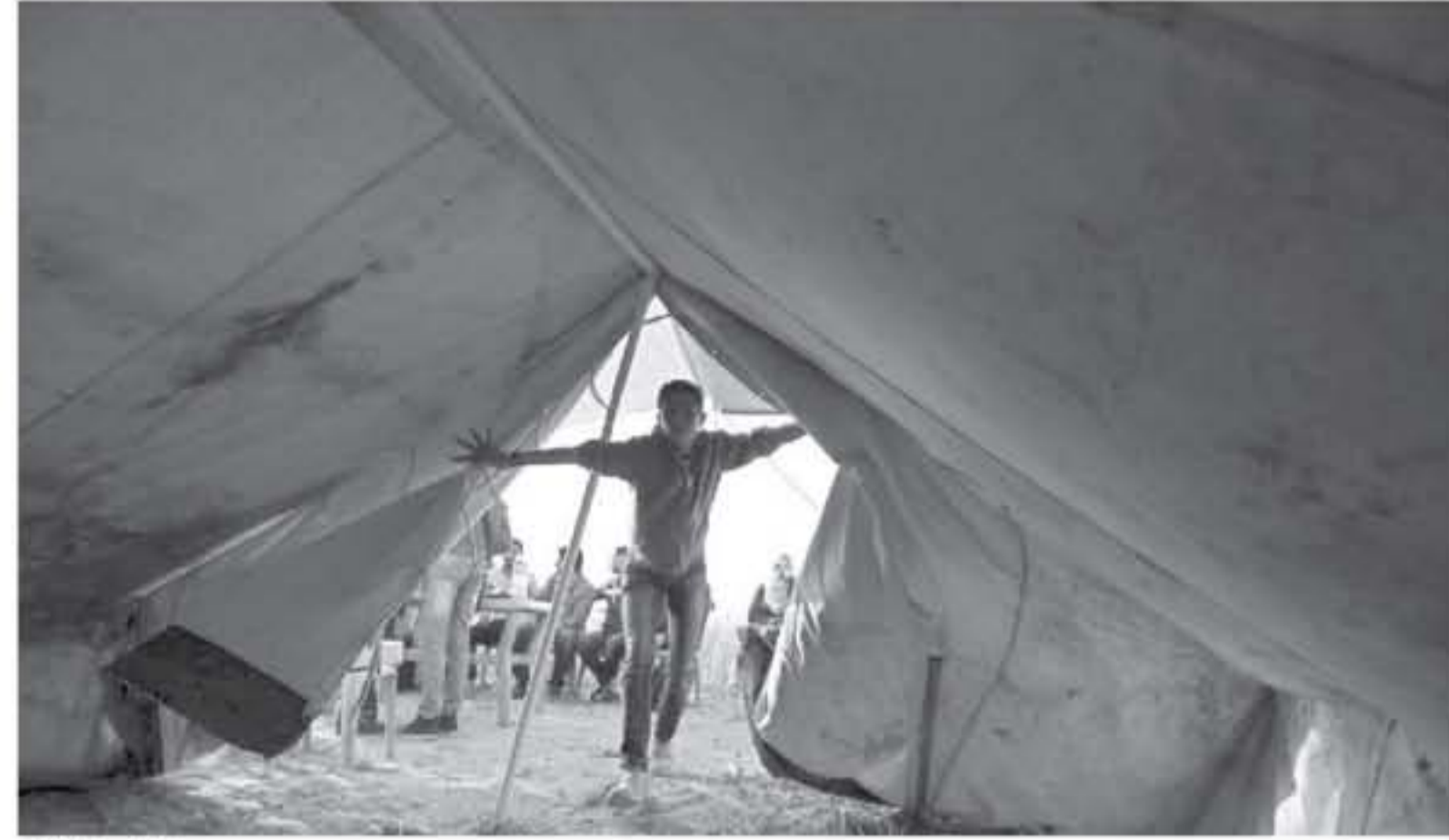
خيام مسيرة العودة

القائمون على المسيرة حرصوا على حماية أنفسهم من أي مخاطر من الاستلاش ونوهد التوابية إلى أن مئات الغلاطات بدأت نصب خيام خاصة بها كل خيمة تالانطلاق مسيرة العودة الكبرى اليوم الجمعة الفلانيين من آذار/مارس من كافة أنحاء الوطن المحتل. بعد الانتهاء من تجهيز خيام العودة التي تم اكتمال تصديا بحصنة مناطق مع أرضينا المحتلة عام ٤٨.