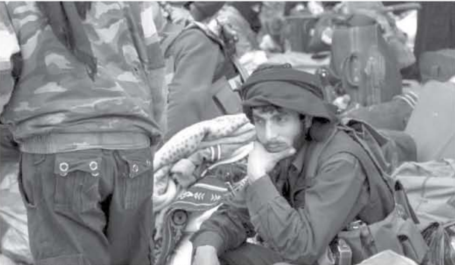
سوريون مدنيون ومقاتلون يمشون في محافظة ادلب بعد خروجهم من القوطة الشرقية قرب دمشق في 2١ آذار/مارس ٢٠١٨

الادلب - ادلب - ادلب استفاد يان الهزائم التي منبت بها الهبة مؤخرا "كبرت الهالة العسكرية" التي كانت تحيط نفسها بها على اعتبار أنها "قوة لا يمكن قهرها." لكن هزاي برى أن هيئة تحرير الشام كيان "القوة العسكرية الأكثر نفوذا لتابعها. أكثر من قوتها القتالية"، شيبرا إلى أنها "تحتفظ بسطة منطقة استمدايا لتجعلها بالنمق الأولى بين قوتى متناوئة. ويضيف تركيا ويسس أي قسبل معارض آخر، تشتت القوة العائمة ضد هيئة تحرير الشام.