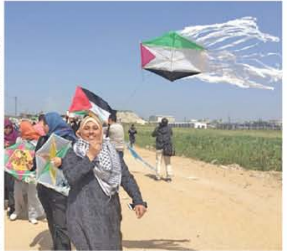
علم فلسطيني بهيئة طائرة ورقية للتخليق في سماء الأرض المحتلة.