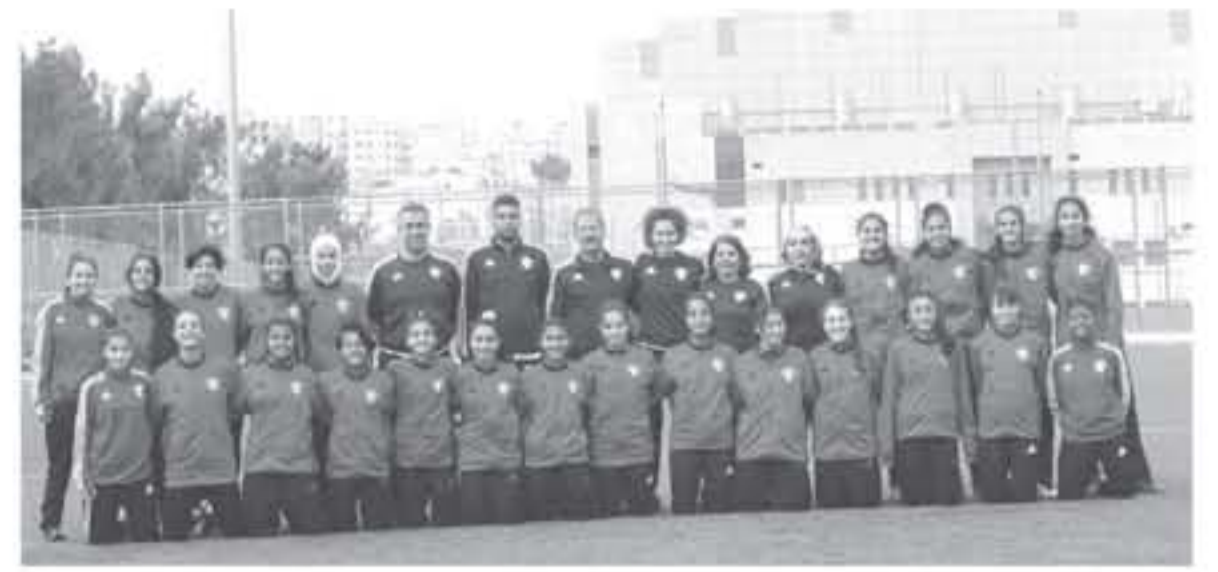
عمان - الألباط

واصل منتخب الناشئات 16 عاماً لكرة القدم تدريباته على ملعب البو شهادة لليرة الثانية من فريق استعداد المشاركة في بطولة غرب آسيا 2018 والتي ستقام في الإمارات خلال الفترة من 7-15 نيسان المقبل بمشاركة منتخبات الأردن، الإمارات، فلسطين، البحرين، سوريا، لبنان وحسب فريق التي كانت تحتضن الفوج الرسمي للناشئات - ركزت التدريبات على كروتات التنية والدينية وبمشاركة 22 لاعبة وبمعدل أربع حركات أسبوعياً وذلك بهدف رفع الجاهزية كتنية والدينية للاعبات، حيث ستشتمل التدريبات حتى قبل المغادرة إلى الإمارات في الخامس من الشهر المقبل.