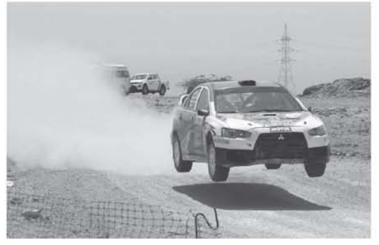
عمان - الألباط