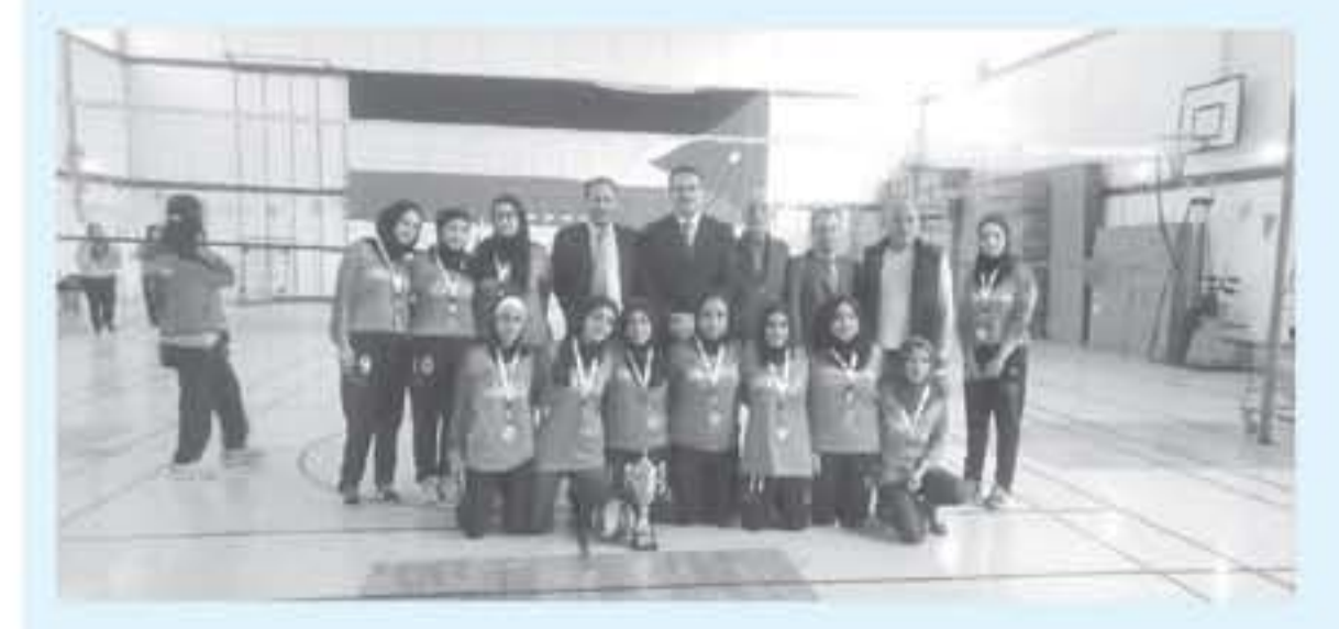
عمان - الألباط

حازت كبة اريد الجامعيه في جامعة البلقاء التطبيقية بكاس بطولة كرة الطائرة للكليات الجامعيه والجامعيه القوسية بعد فوزها على جامعة البلقاء في اللقاء النهائي الذي رعه مندوب عن الأستاذ الدكتور عبد الله سرور الزعبي رئيس جامعة البلقاء التطبيقية الدكتور منفي الموشى عميد كلية اريد الجامعيه والتي اقيمت في كلية اريد الجامعيه والتي نظمها الاتحاد الربي الالكليات الجامعيه والجامعيه المتوسطة بمشاركة فرق جامعة البلقاء التطبيقية المركز، وكبة اريد الجامعيه، وجامعة الطفولة التقنية، وكنابديه الامير الحسين بن عبد الله الثاني للعلوم التقنية، وكبة الزرقاء، وقد هازت كبة اريد الجامعيه