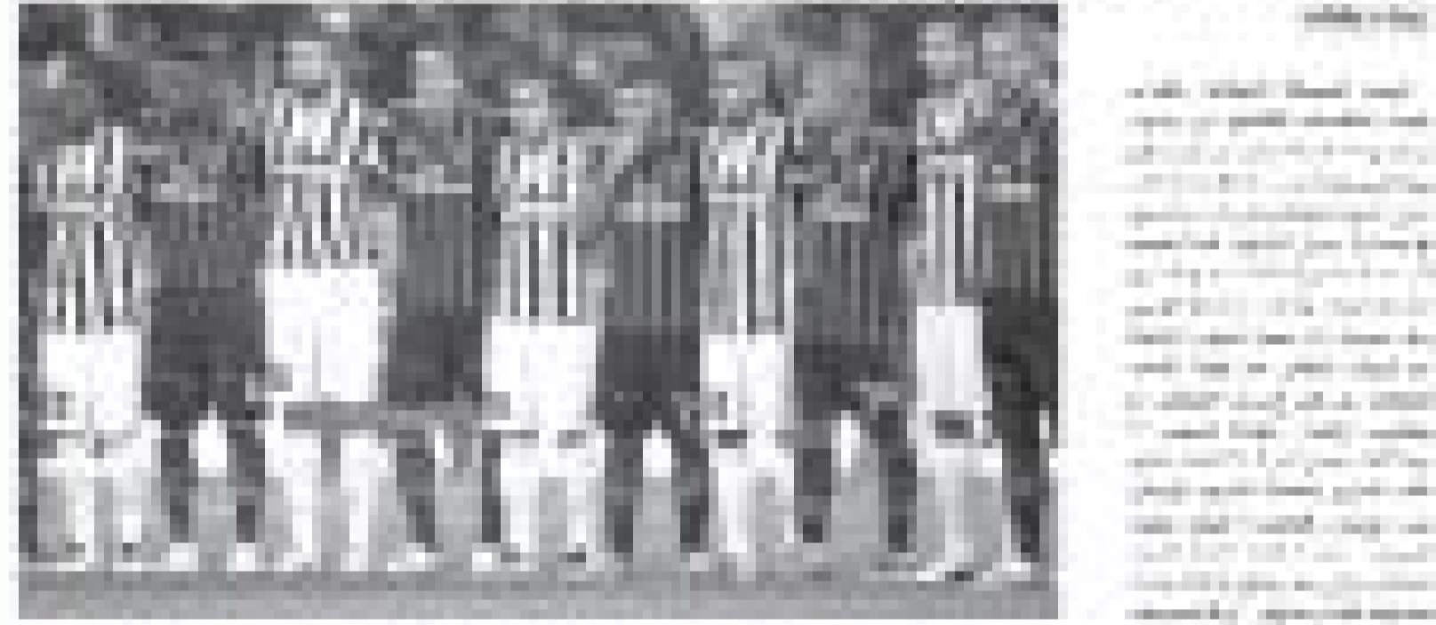
عمان - الألباط