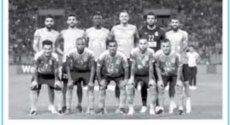
عمان - الألباط