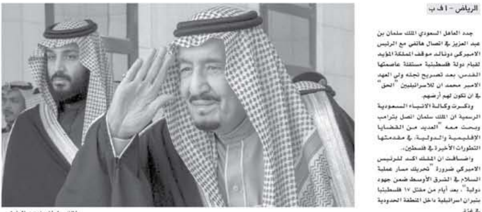
الرياض - أ ف ب

جدد الملك السعودي الملك سلمان بن عبد العزيز في اتصال هاتفي مع الرئيس الأميركي دونالد ترامب تأكيداً لقيام دولة فلسطينية مستقلة عاصمتها القدس بعد تصريح لنته ولي العهد الأمير محمد بن سلمان بأن القدس هي عاصمة إسرائيل.