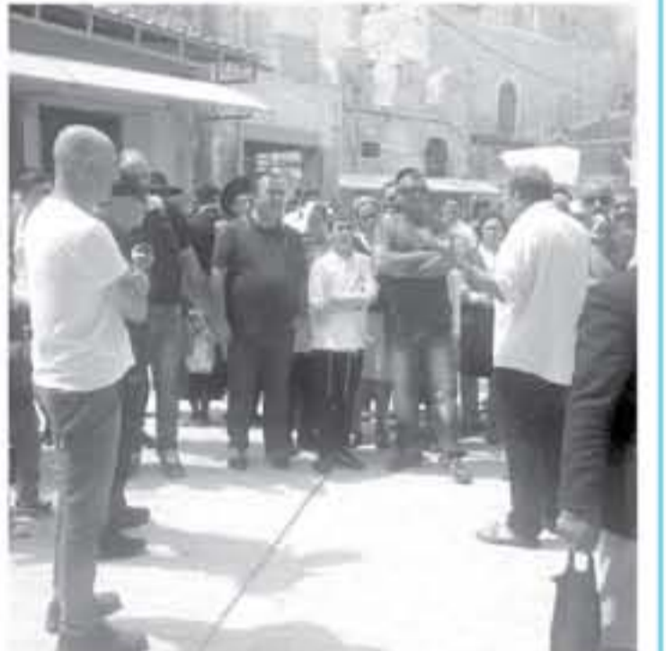
الخليل - معا

أجبرت قوات الاحتلال الإسرائيلي، يوم أمس الثلاثاء، جدار الجدار القديمة في الخليل على إغلاق محالهم التجارية، لتأمين سلامة مستوطنين لشبهه بالجنود الحرس من مدينة بيت لحم.