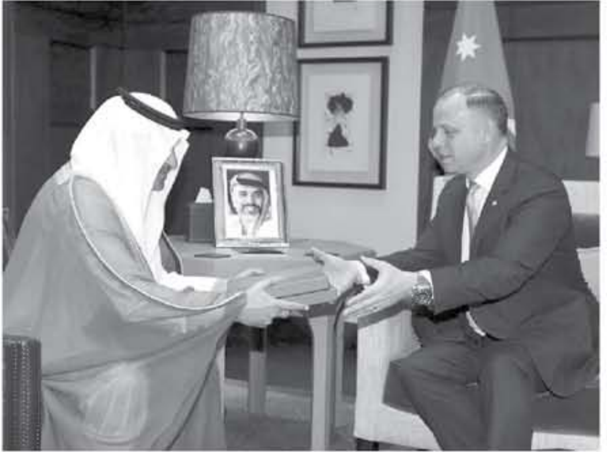
قابل الملك يتسلم الدعوة من السفير السعودي في عمان

لكفي جلالة الملك عبدالله الثاني، أمس الثلاثاء، دعوة من أخيه خادم الحرمين الشريفين الملك سلمان بن عبدالعزيز آل سعود، ملك المملكة العربية السعودية، للمشاركة في أعمال القمة العربية التي ستعقد في مدينة الطهران السعودية في الخامس عشر من شهر نيسان الحالي.