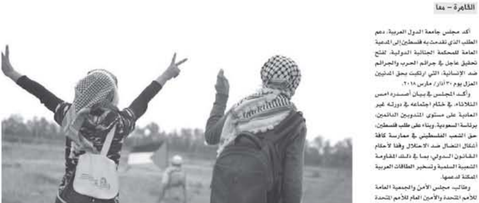
القاهرة - معا

أكد مجلس جامعة الدول العربية، دعم الطلب الذي تقدمته فلسطين إلى الجمعية العامة للأمم المتحدة، لفتح تحقيق عاجل في جرائم الحرب والجرائم ضد الإنسانية، التي ارتكبت بحق الفلسطينيين منذ يوم 7 مارس 2018.