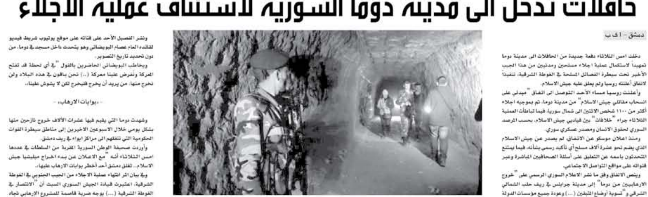
دمشق - أ ف ب

دخلت أمس الثلاثاء دفعة جديدة من الحافلات إلى مدينة دوما تهديدا لاستكمال عملية إجلاء مسلحين ومدنيين من هذا الجيب الأخير تحت إشراف الفصحة في القوة الشرقية، لتنفيذ لاتفاق أطلته روسيا ولم يعلق عليه جيش الإسلام.