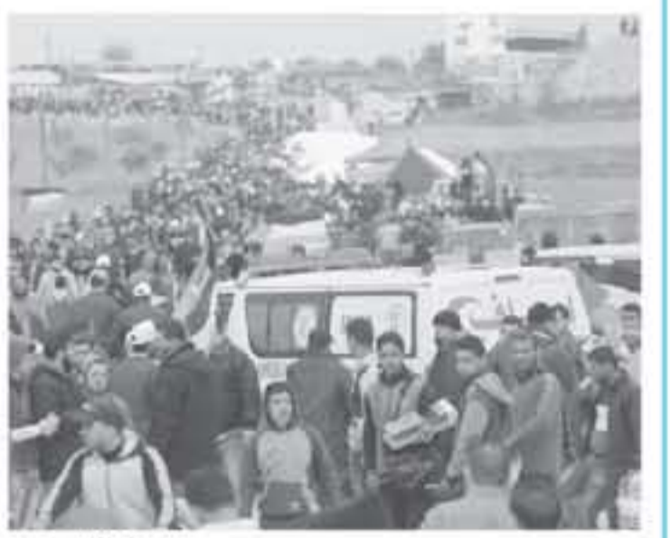
أهل غزة في مسيرة

الصالح التي تتكلمها مع إسرائيل، وإنه كان هناك سلام، ستكون هناك الكثير التنازل الخليلي ودول أخرى مثل مصر واليمن.