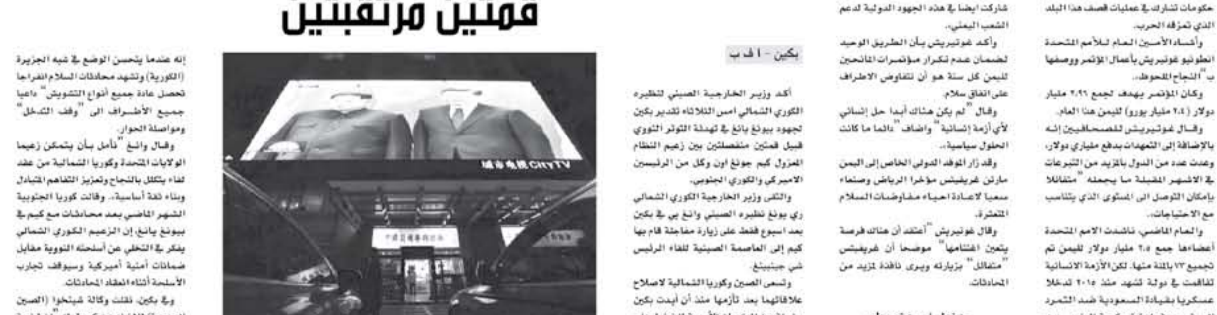
بيكين - أ ف ب

أكد وزير الخارجية الصيني لى تشنغ تشي إن الصين ستدعم كوريا الشمالية في جهودها لتأمين الطاقة النووية، وذلك في إطار العلاقات الاستراتيجية بين البلدين. كما أكد وزير الخارجية الصيني لى تشنغ تشي إن الصين ستدعم كوريا الشمالية في جهودها لتأمين الطاقة النووية، وذلك في إطار العلاقات الاستراتيجية بين البلدين.