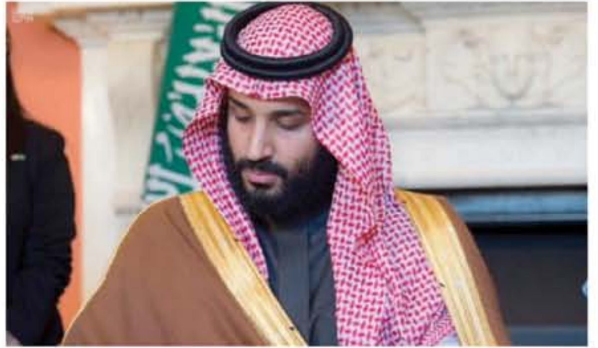
جدة - وكالات

أكد ولي العهد الأمير محمد بن سلمان أن الاقتصاد السعودي سينمو بمعدل سنوي عديد، وقال ولي العهد خلال لقائه مع مجلة "التايم" الأميركية إنه سيتم خلق وظائف كثيرة للسعوديين والأجانب والمواطنين حتى ما كان المواطن السعودي مؤملاً. وذكر الأمير محمد بن سلمان أن السعودية أمام مشروع كبير منيوق للطاقات الشمسية مستغنيًا منه بنوهر 1٠ مليار دولار، بالإضافة إلى زيادة الناتج المحلي بـ ٢٠ مليار دولار، ما سيخلق عدد هائل من الوظائف للسعوديين بلغ 1٠٠ ألف وظيفة. وكشف ولي العهد خلال اللقاء أن المملكة ستقلد ما ستفعل مستحق شرق، مؤكداً أنها لم سوى 1٠٠ ولديها ٨٠٠ متشعبة لتتحقق وعن مجالات الطاقة قال ولي العهد إن السعودية تعمل على تنويع مصادر دخلها، إلا أن الطلب على النفط سيظل مرتفعاً إلى ٢٠٢٠ حسب التوقعات المتحفظة وسيزداد الطلب العالمي على النفط سيصل إلى 11٠ مليون برميل.