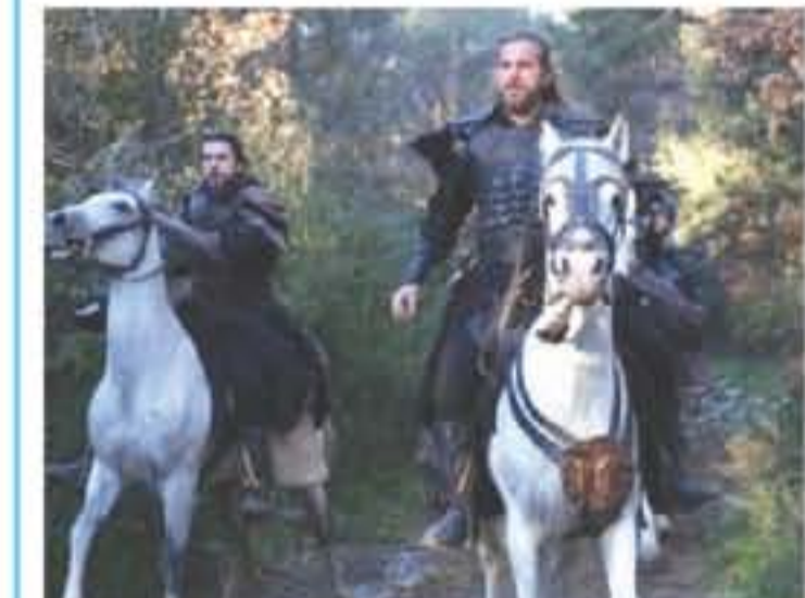
الأنباط - وكالات

يواصل المسلسل التركي التاريخي الشهير، قيامه أرطغرل، قدسمة في الرايئنف رسم أحداثه لأول مرة في موسمته الرابع، المركز الثاني بعد التراجع المسلسل الاجتماعي، أخيراً البحر الأسود، المركز الأول منه. وبحسب المصنفات الـ 100، يواجه زعيم قبيلة التكايب أرطغرل، حرباً شرسة ومباركة من عدوه القشور الأحمير، سعد الدين كوكبلك، الذي أحكم قبضته على السطان الشاب هيات الدين بعد قتله والده السلطان علاء الدين بالسم، فنجس السلطان هيات الدين على ختم قراده بأنتراف لقمعة بيلاججه وإصدار العقائل من أرطغرل، ويرجع السلطان لأمره، ويعزله عن منصبه، ويؤوم فون آلب بتشيده الأمر، واستلام إمارة القبائل منه، وإزالة علم قبيلته التكايب، لإزالة رسم العقائل الشريك.