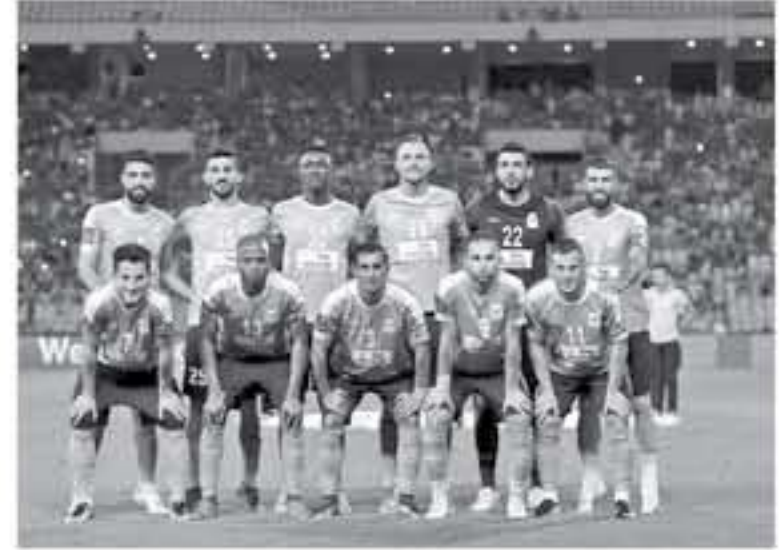
عنان - الأنباط

بدأ فريق الفيصلي مساء أمس تدريباته في العاصمة بيروت التي وصلها من الأون استعداداً للقاء فريق الوحدة السوري في الساعة الثامنة من مساء يوم هذا في برصيدة ٧ قطاف والوحدة المركز الثالث