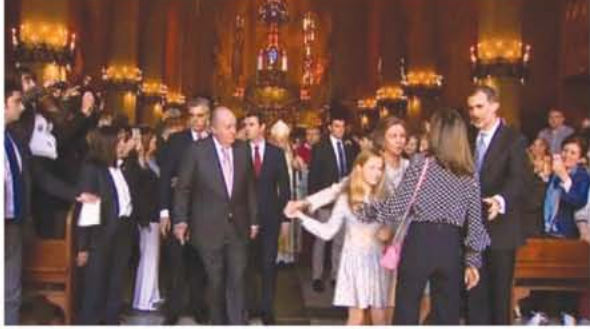
الفصل بين والدته وزوجته أما الملك السابق، خوان كارلوس، 80 عاماً، زوج سوفييا ووالد فيليبس السادس، فقد بدأ