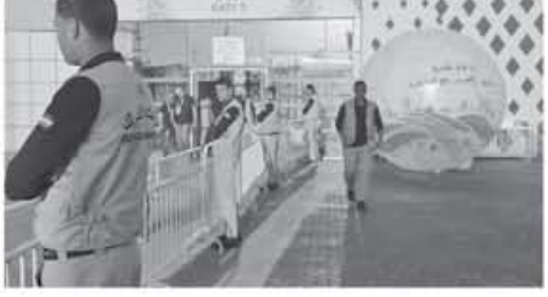
عنان - الأنباط